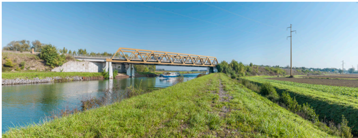
La Saône et le pont autoroutier de l'A36 franchissant la dérivation de Pagny-Seurre à Labruyère.