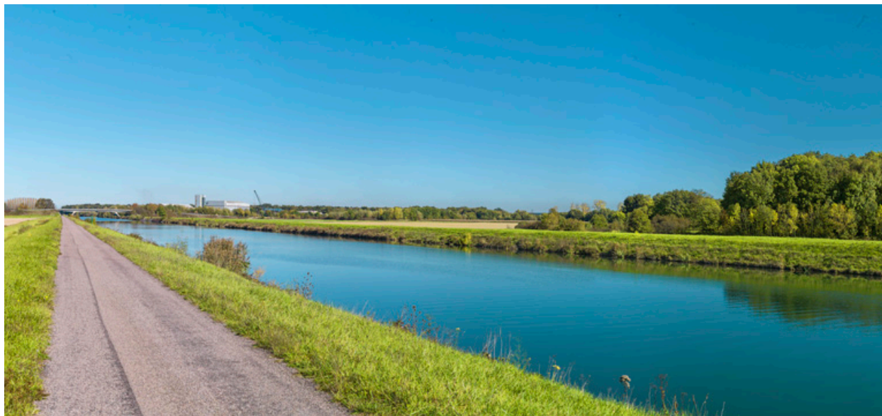
Vue d'ensemble de la dérivation au niveau du Technoport.