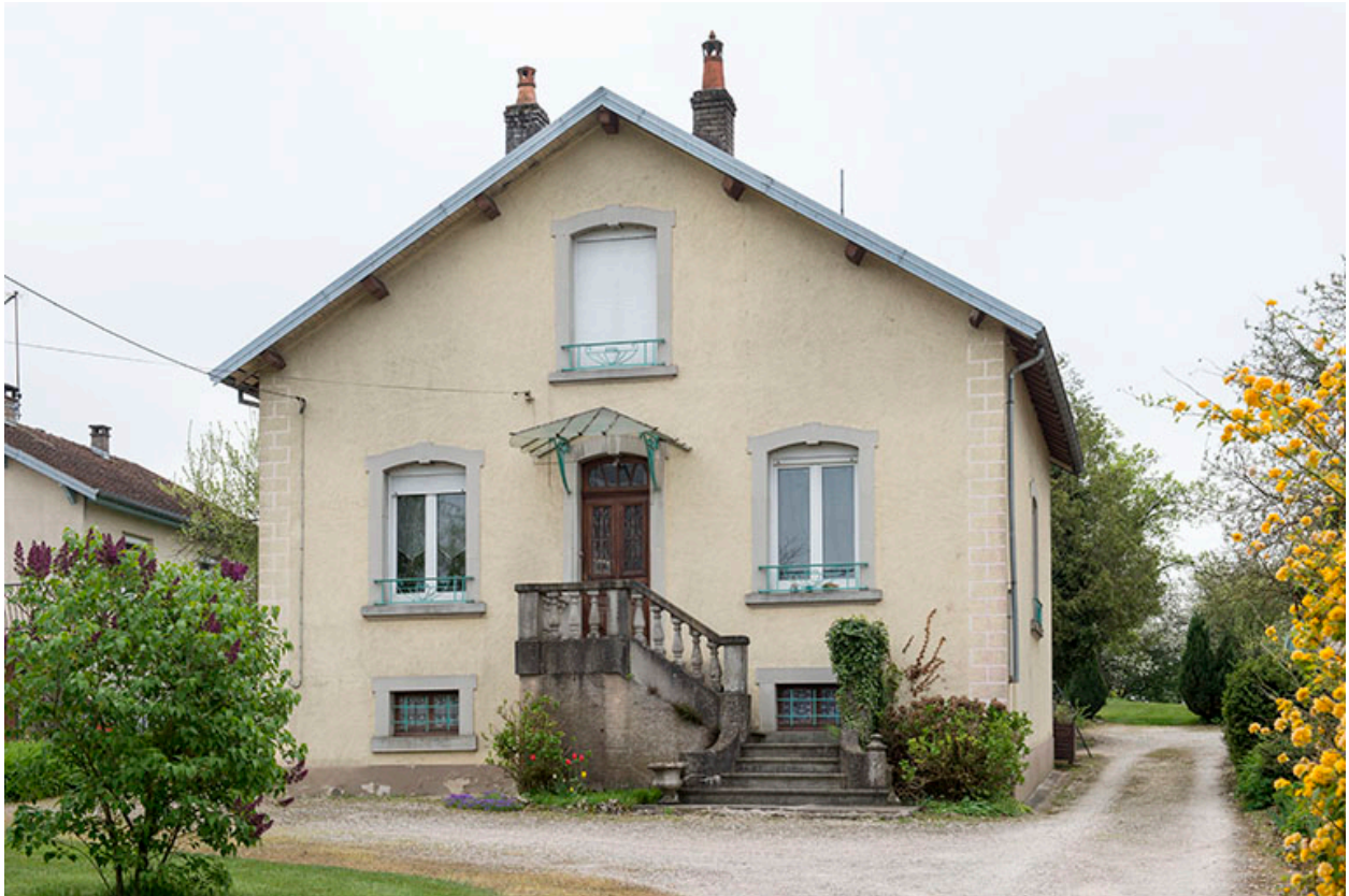
Vue générale de la maison.