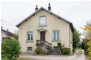
Vue générale de la maison.