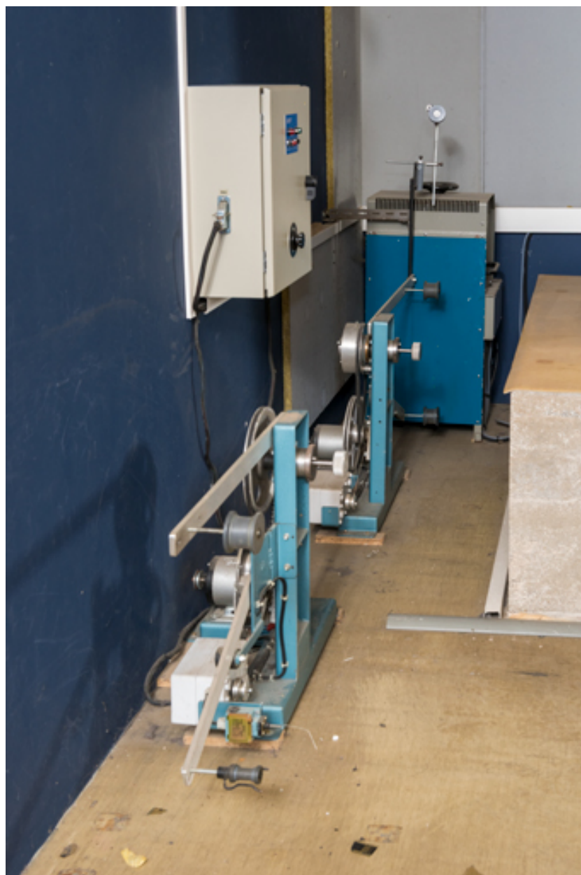
Enrouleur-dérouleur en ligne IDEF, en avant du redresseur IREM.