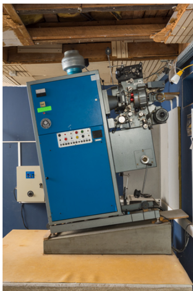
Vue d'ensemble. IVR26_20257100792NUC4A