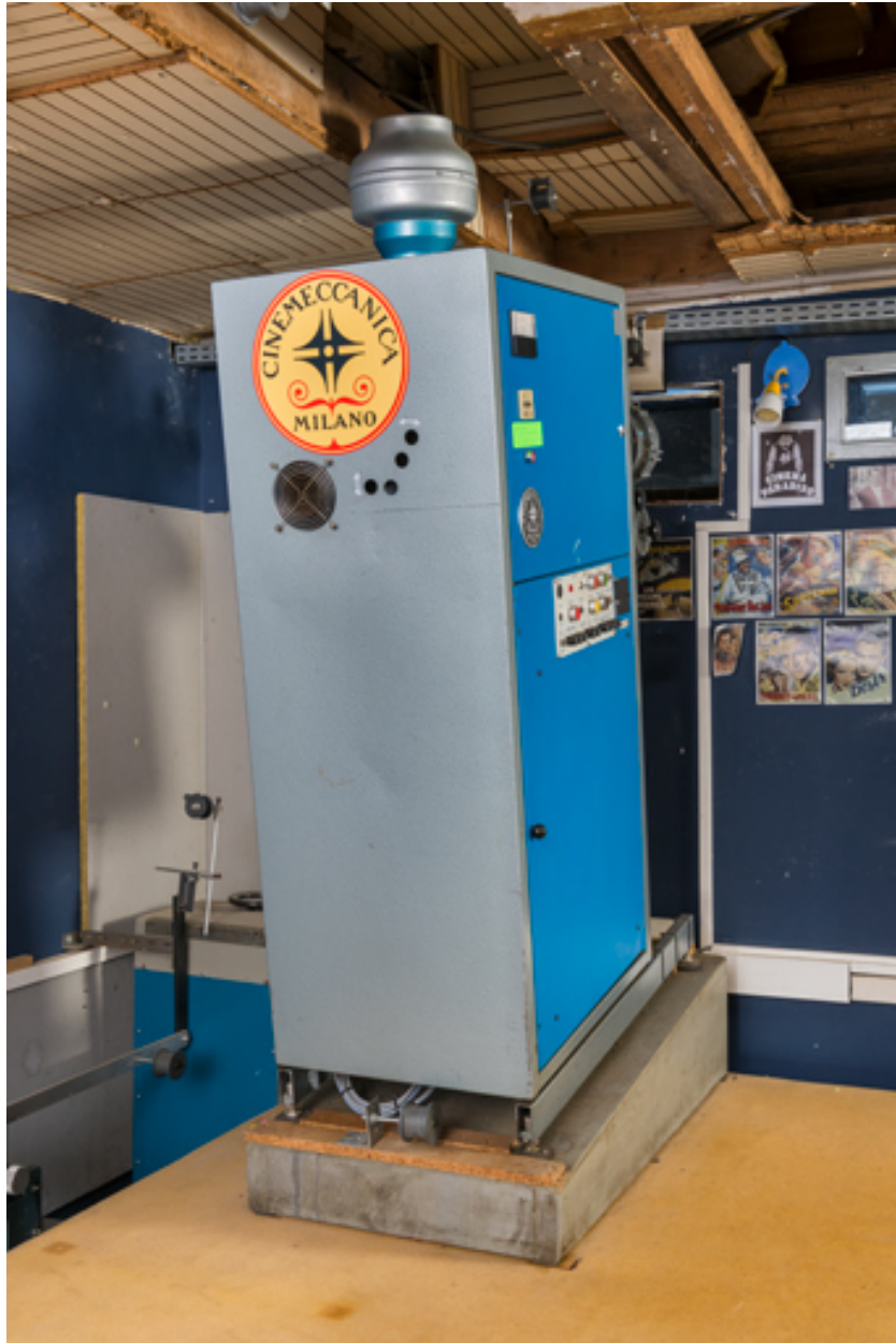
Vue d'ensemble, de trois quarts arrière.