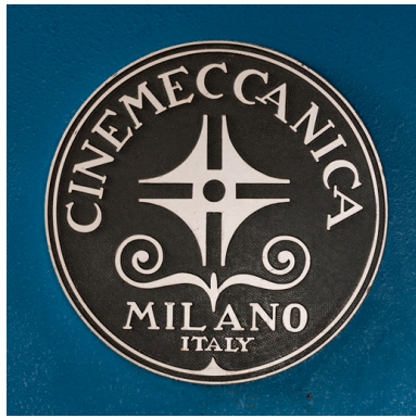
Logotype Cinemeccanica.