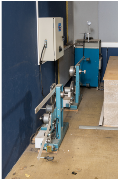
Enrouleur-dérouleur en ligne IDEF, en avant du redresseur IREM.