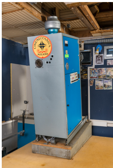
Vue d'ensemble, de trois quarts arrière.