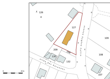
Plan-masse et de situation, extrait du plan cadastral (2021). IVR26_2021580003NUDA