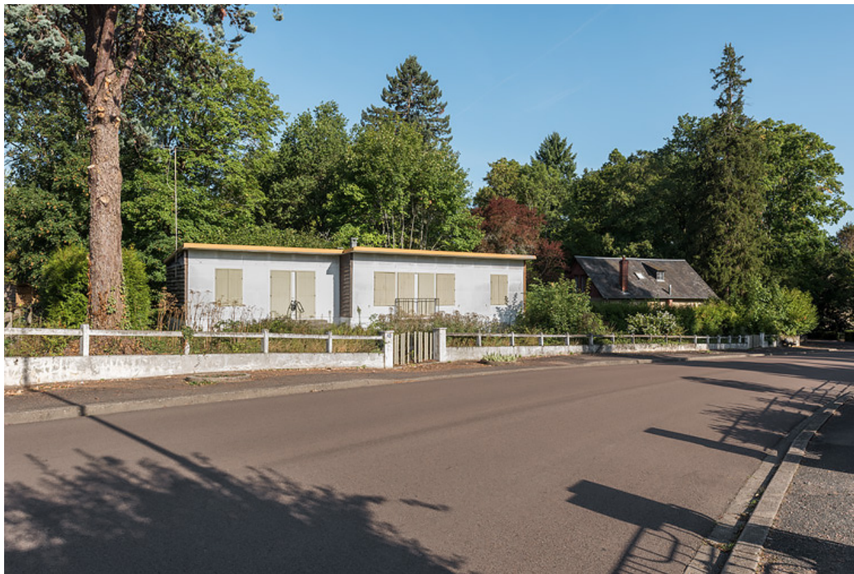
Vue depuis le sud-est.