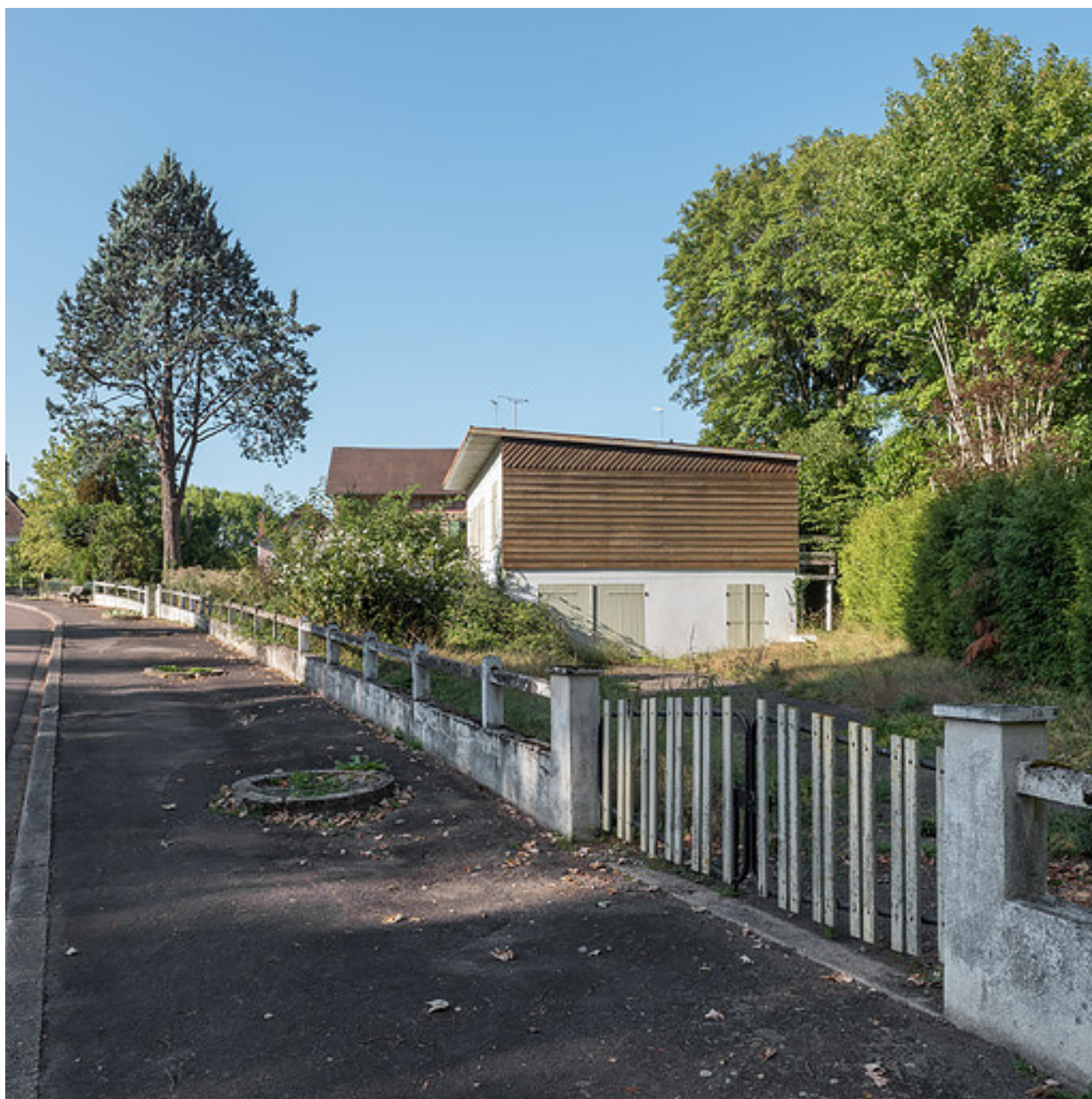
Vue depuis l'est.