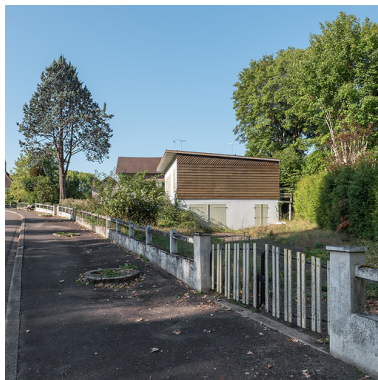
Vue depuis l'est. IVR26_20195800662NUC2A