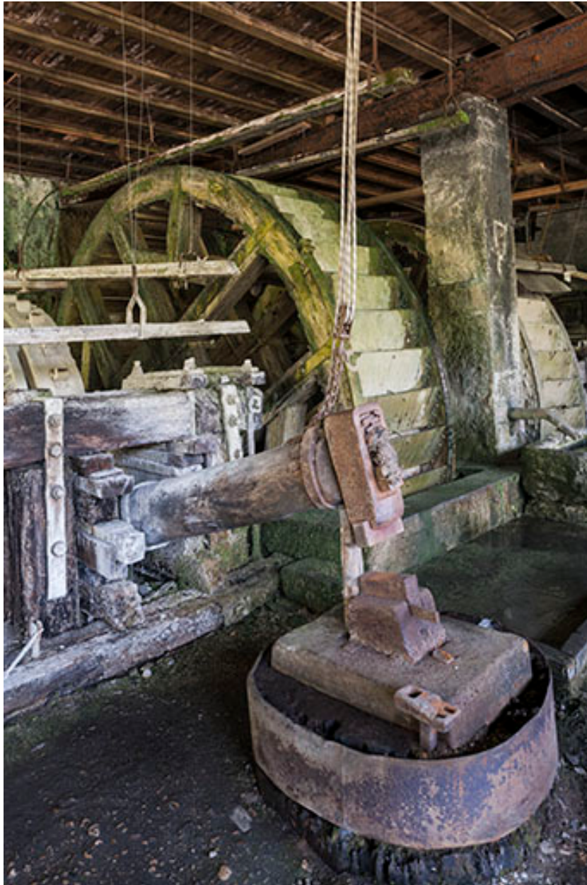
Taillanderie Philibert, à Nans-sous-Sainte-Anne : un martinet.