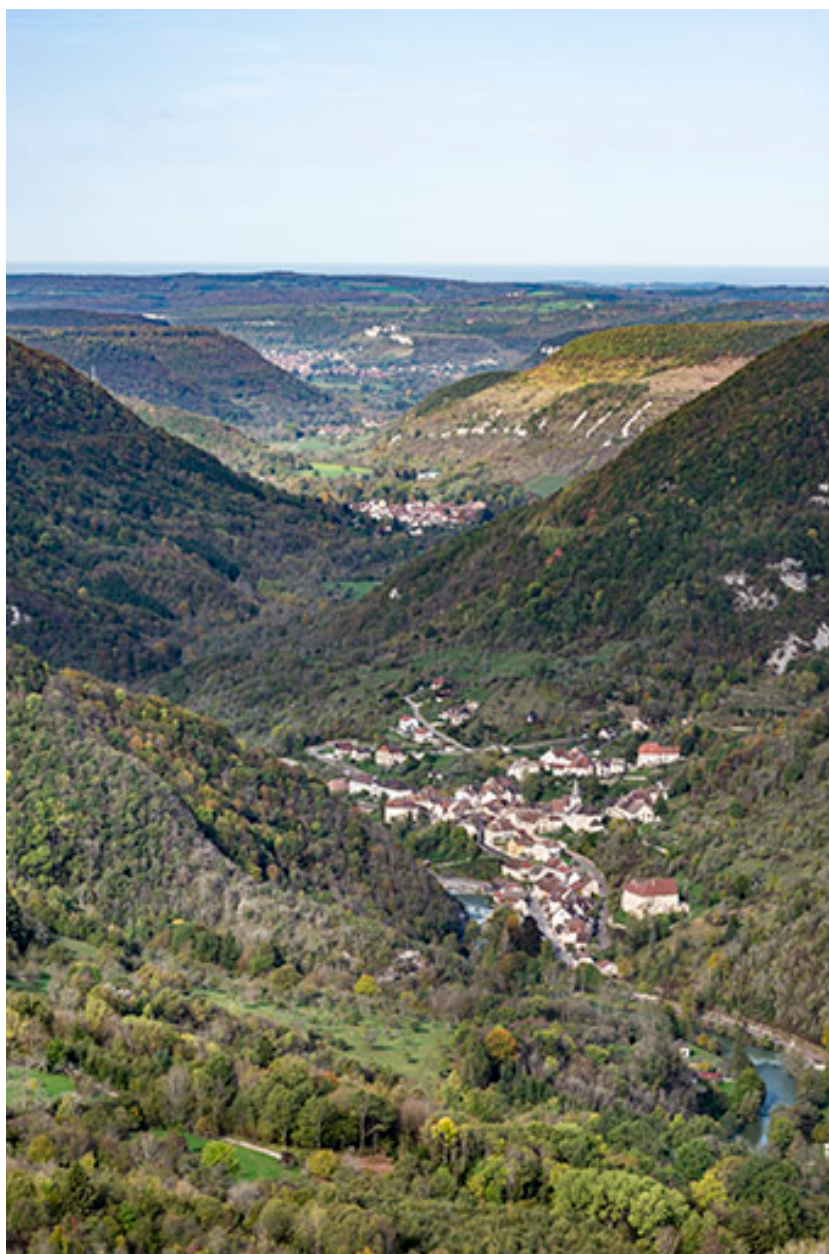
la haute vallée de la Loue.