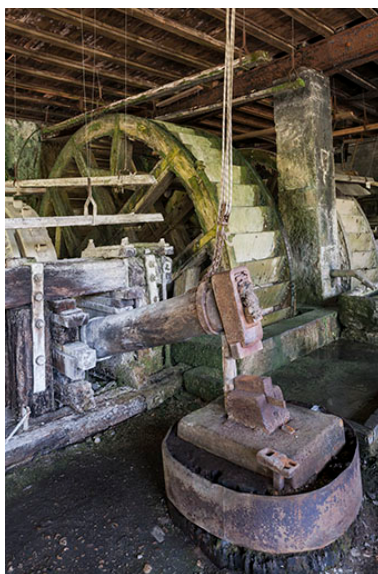
Taillanderie Philibert, à Nans- sous-Sainte-Anne : un martinet. IVR43_20152501534NUC4A