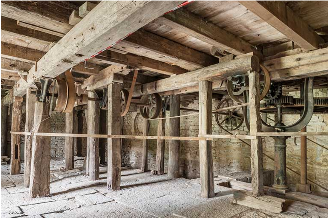
Beffroi du moulin de Fourbanne.