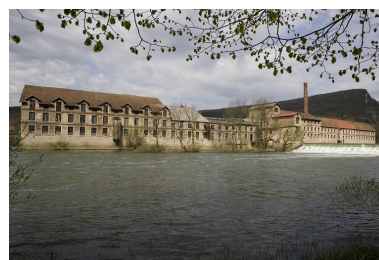
Usine de papeterie Outhenin- Chalandre à Deluz.