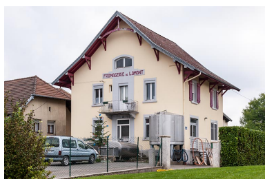
Fromagerie de Lomont-sur-Crête. IVR43_20142501199NUC4A