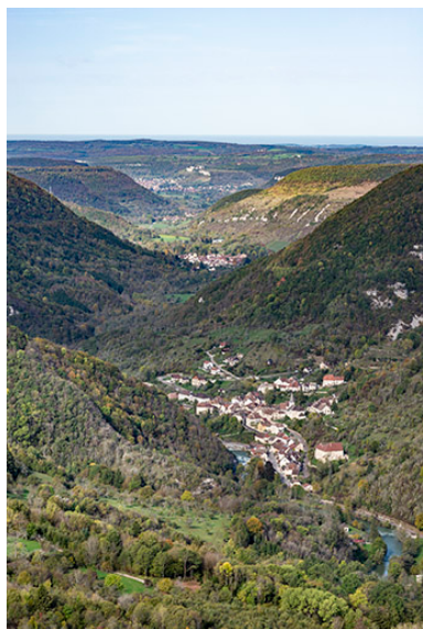
la haute vallée de la Loue. IVR43_20192501158NUC4A