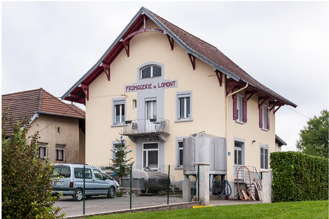
Fromagerie de Lomont-sur-Crête.