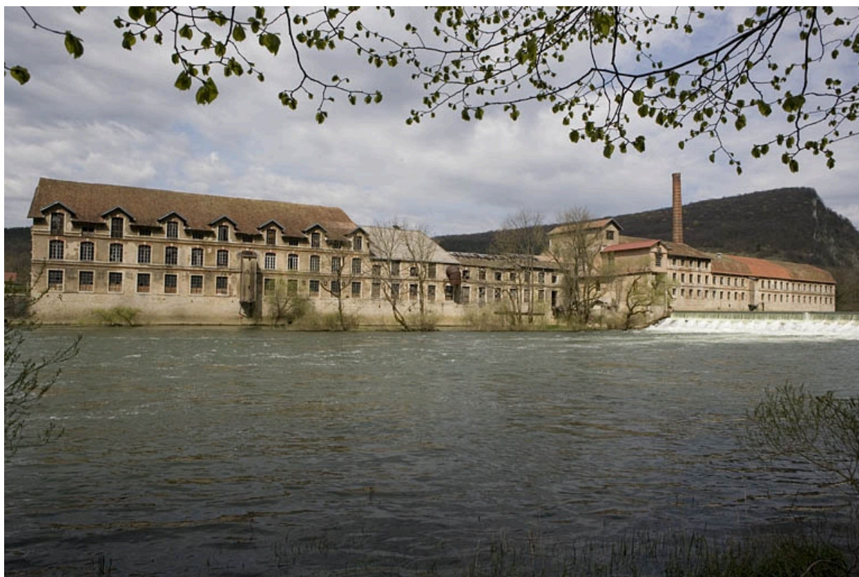
Usine de papeterie Outhenin-Chalandre à Deluz.