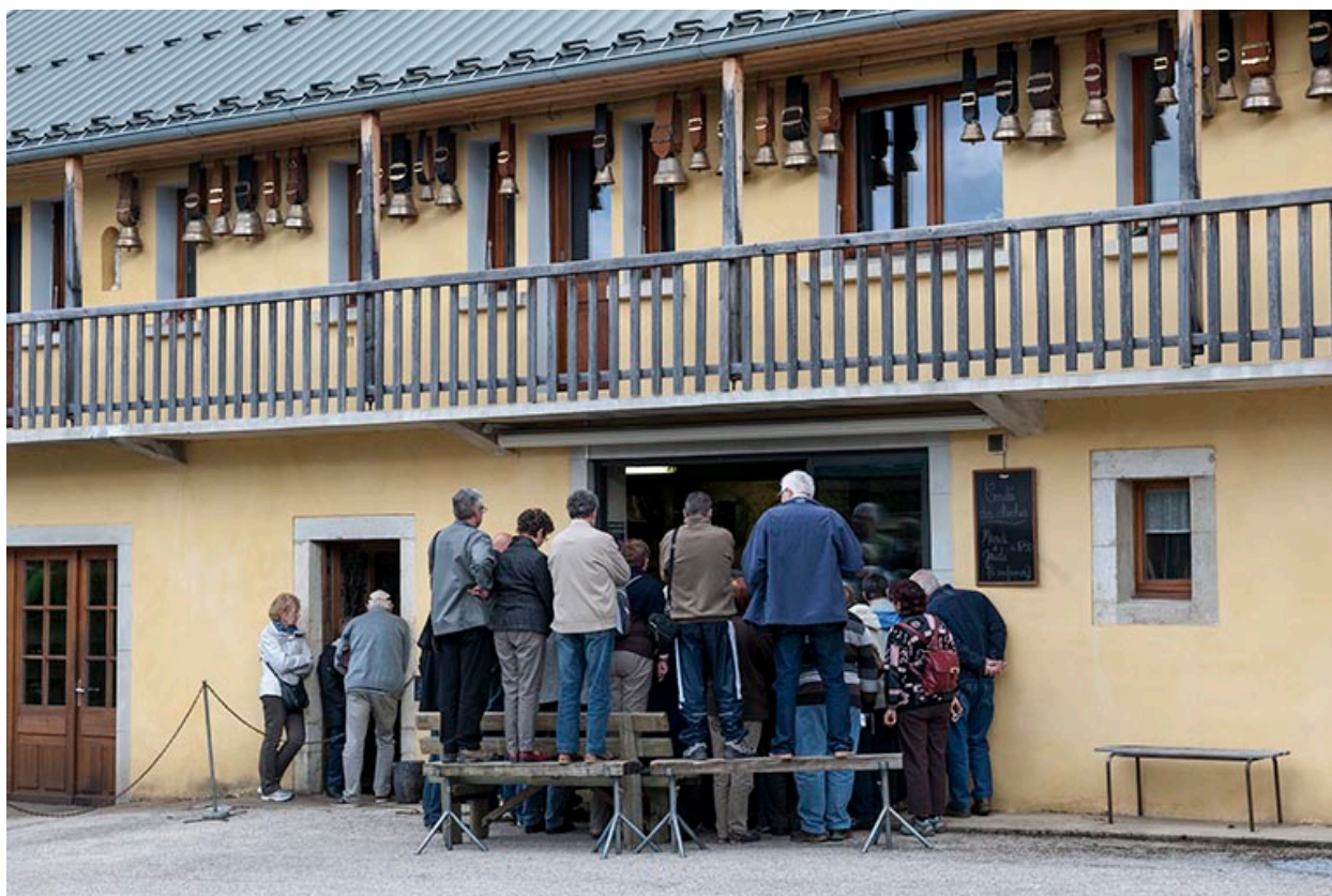
Fonderie de cloches Charles Obertino à Labergement-Sainte-Marie : la coulée.