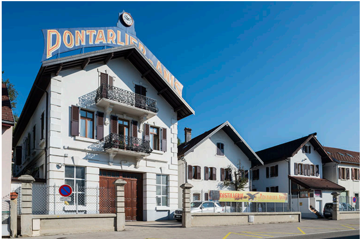
Distillerie Armand Guy, à Pontarlier.