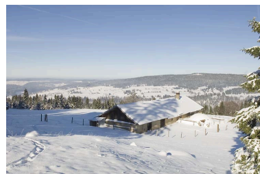
Chalet d'estive de la Caffode, à Jougne. IVR43_20082500950NUC2A