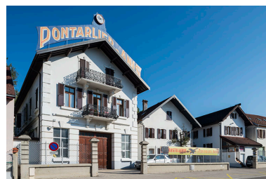
Distillerie Armand Guy, à Pontarlier. IVR43_20162501117NUC4A