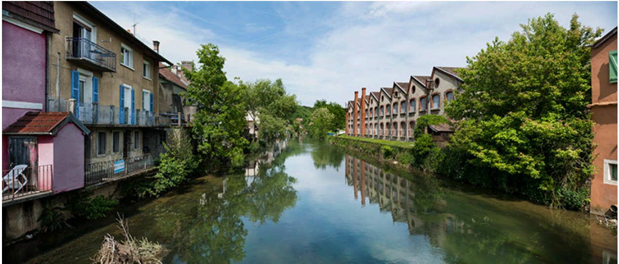
Petit bras du Doubs à l'Isle-sur-le-Doubs : façades de maisons et de l'usine Japy.