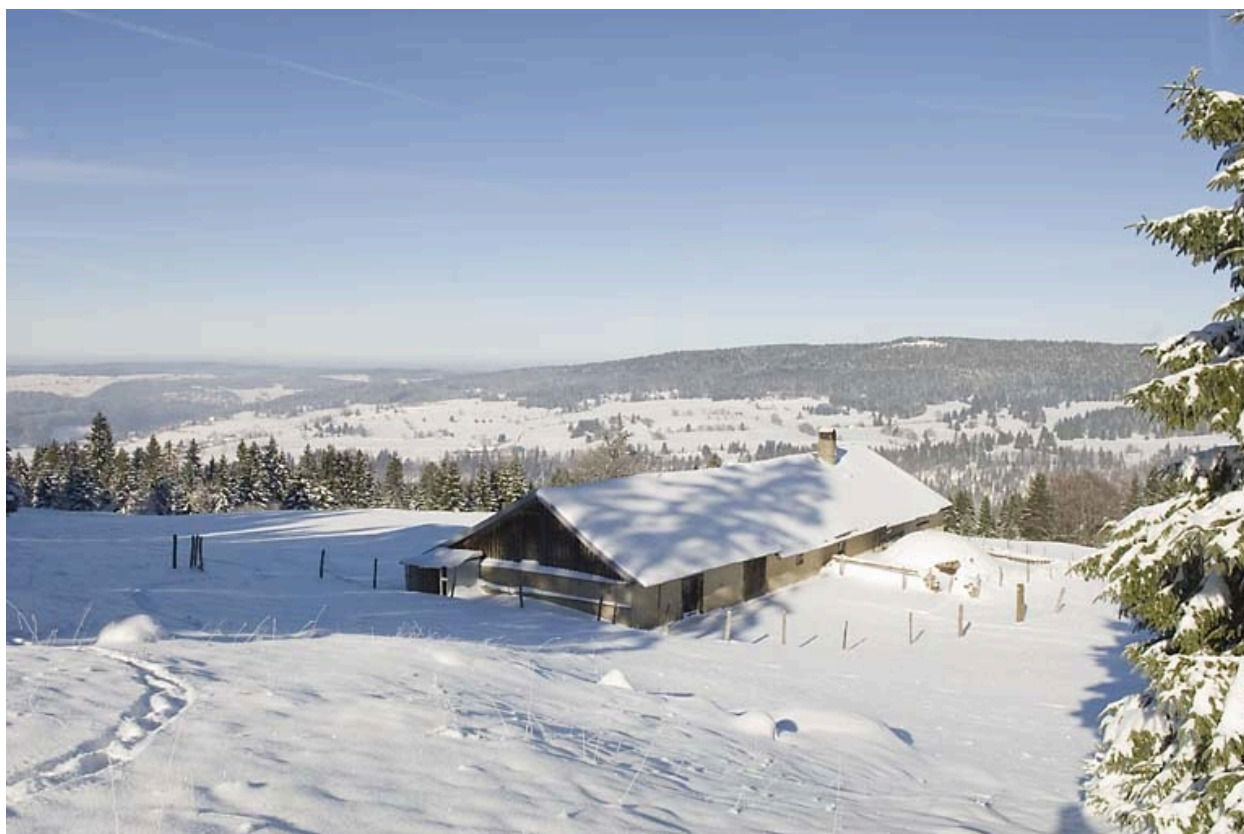
Chalet d'estive de la Caffode, à Jougne.