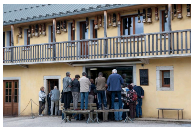
Fonderie de cloches Charles Obertino à Labergement- Sainte-Marie : la coulée. IVR43_20152502458NUC4A