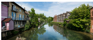
Petit bras du Doubs à l'Isle-sur-le-Doubs : façades de maisons et de l'usine Japy.