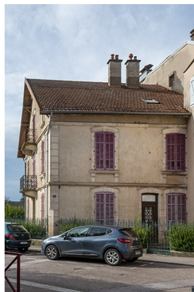
Façade est. IVR43_20207000679NUC4A