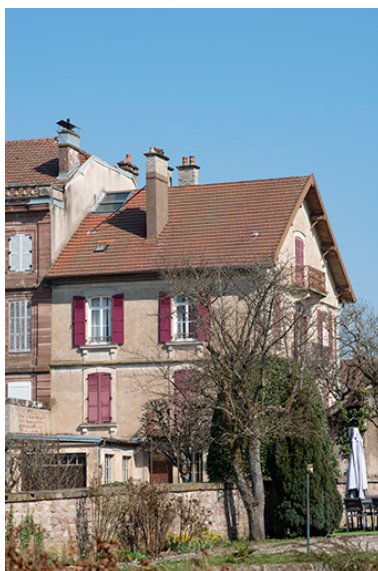
Façade ouest. IVR43_20227000125NUC4A