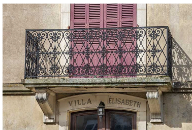
Façade sud, détail, balcon et inscription de la porte d'entrée. IVR43_20207000680NUC4A