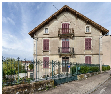
Façade sud.