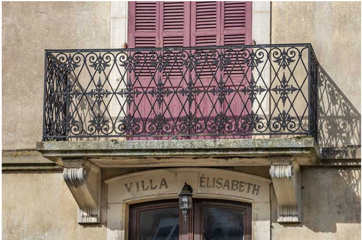
Façade sud, détail, balcon et inscription de la porte d'entrée.