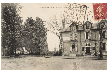
Vue ancienne.