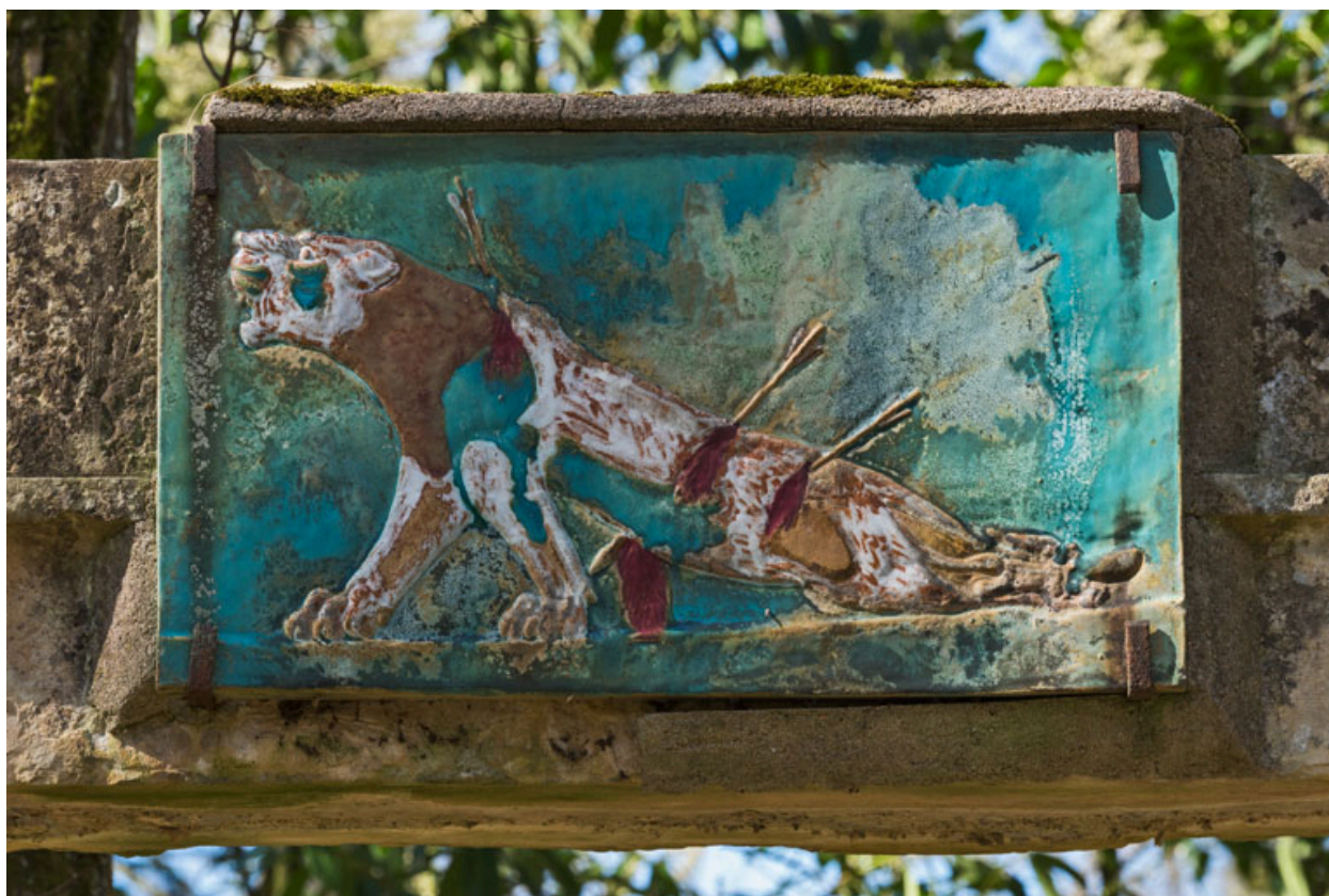
Plaque en céramique : La Lionne blessée, d'après un relief assyrien.