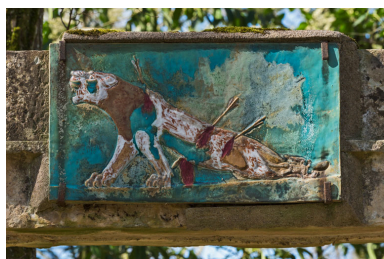
Plaque en céramique : La Lionne blessée, d'après un relief assyrien.