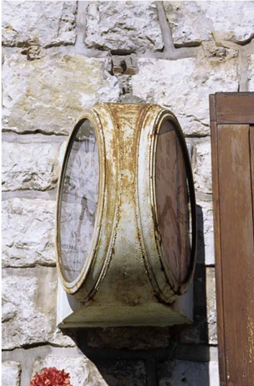
Vue de profil.