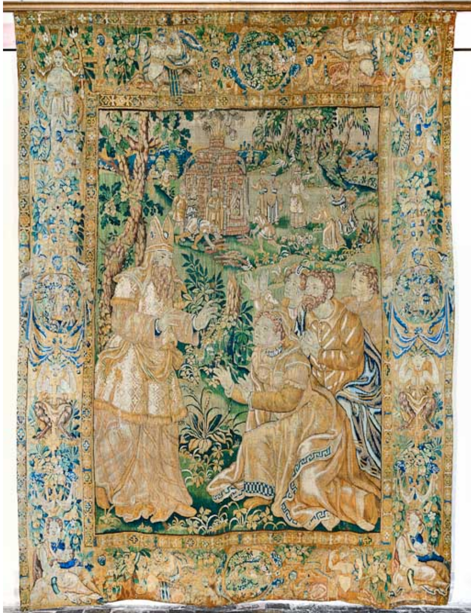
Pièce n°7 : vue d'ensemble.