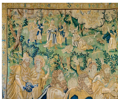
Pièce n°4 : détail. IVR26_20042100013XA