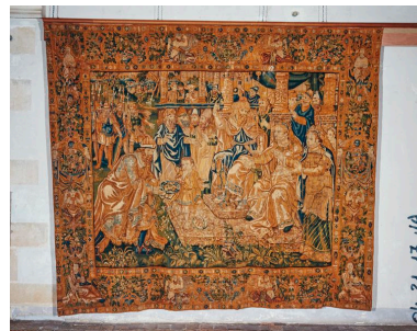
Pièce n°2 : Moïse enfant foulant la couronne de Pharaon. IVR26_20042100017VA