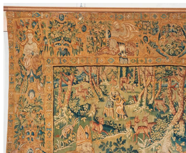
Pièce 3 : détail : angle supérieur gauche, rencontre de Moïse et Aaron. IVR26_20042100031XA