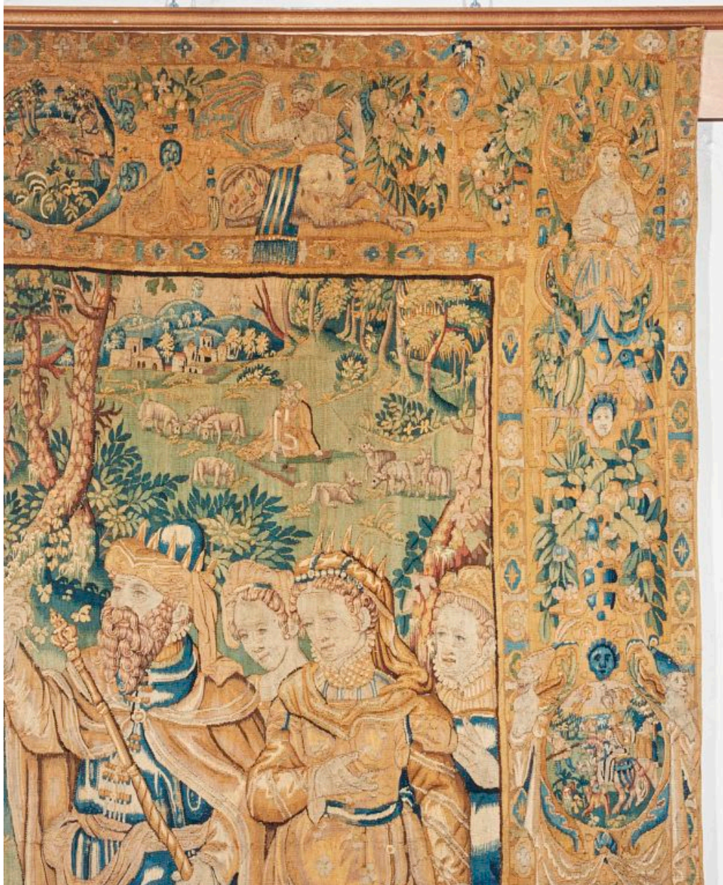
Pièce 3, détail : Pharaon et la reine au premier plan, Moïse gardant le troupeau de son beau-père au second plan.