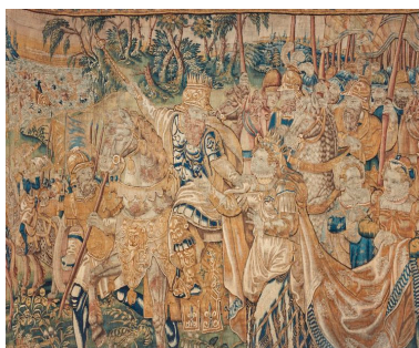
Pièce n°5, détail : Pharaon à la tête de son armée et la reine.