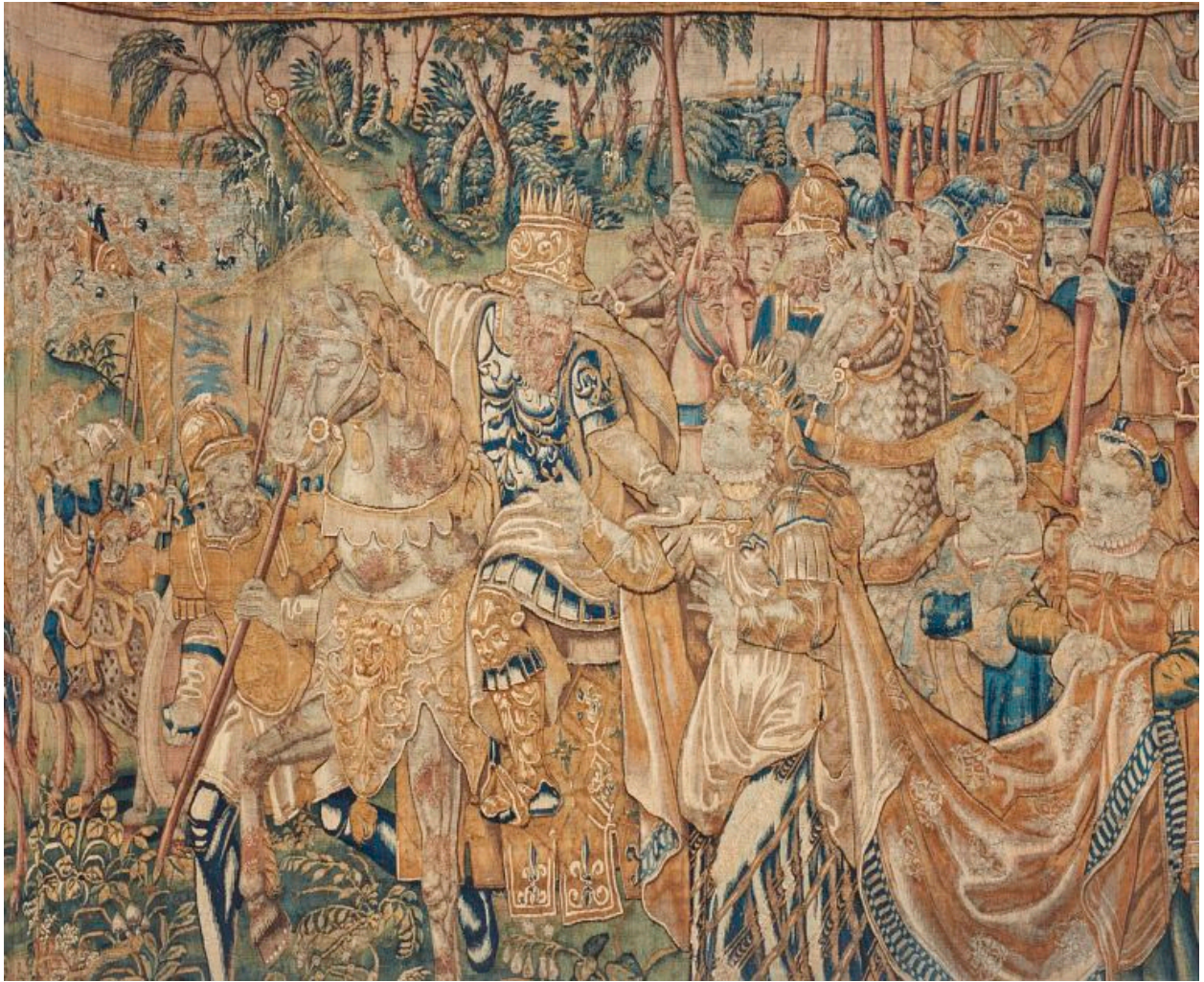
Pièce n°5, détail : Pharaon à la tête de son armée et la reine.