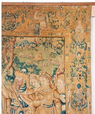
Pièce 3, détail : Pharaon et la reine au premier plan, Moïse gardant le troupeau de son beau-père au second plan.