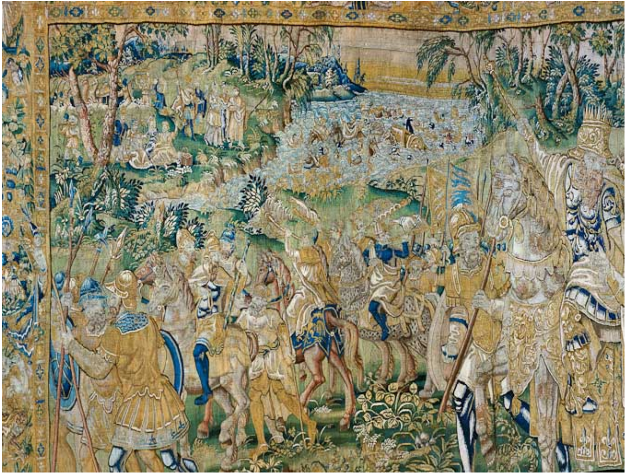
Pièce n°5 : détail.