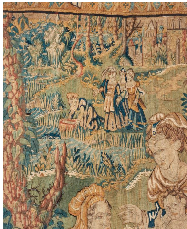
Pièce n°1 : détail. IVR26_20042100025XA