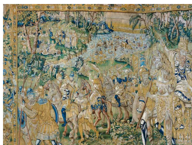
Pièce n°5 : détail. IVR26_20042100003XA