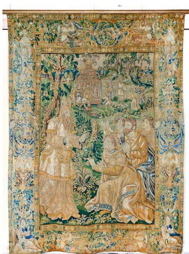
Pièce n°7 : vue d'ensemble. IVR26_20042100033VA