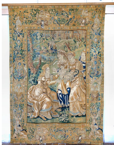
Pièce n°1 : Moïse sauvé des eaux. IVR26_20042100023VA