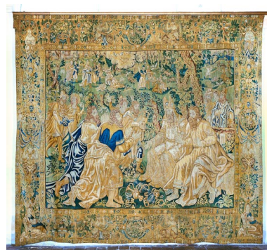
Pièce n°4 : vue d'ensemble. IVR26_20042100011VA