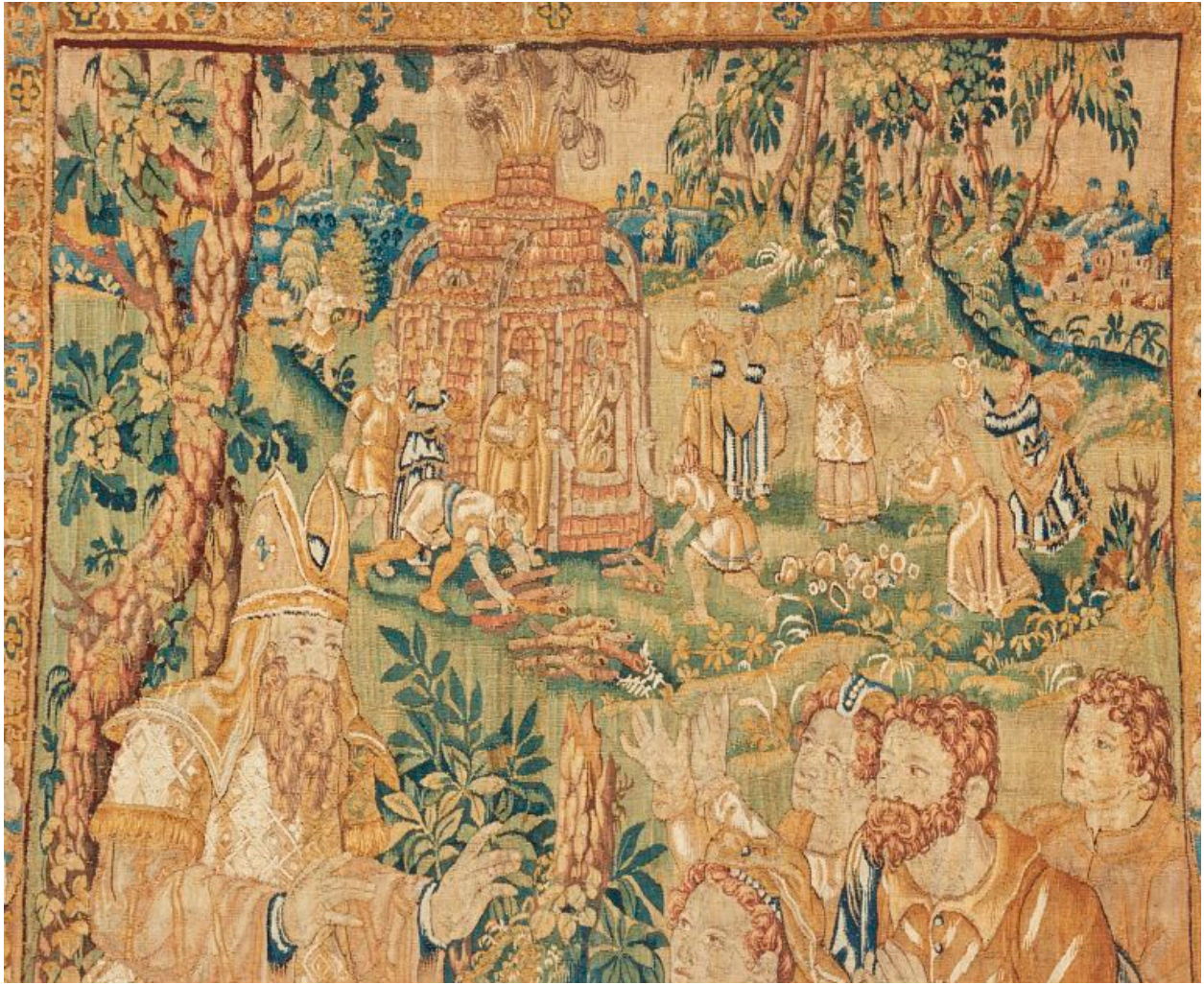
Pièce 7, détail : des hommes alimentent en bois le four qui va servir à fondre le veau d'or.