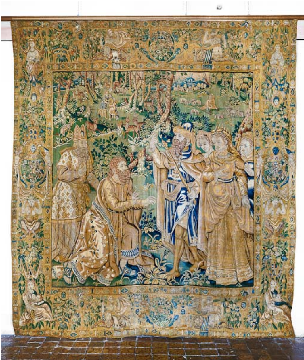
Pièce n°3 : vue d'ensemble.