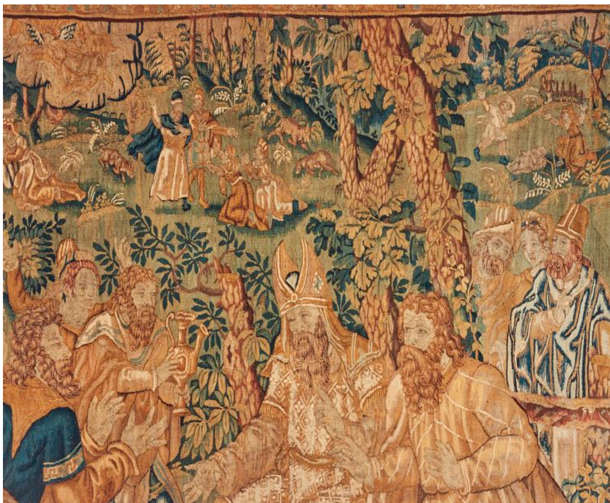
Pièce n°4 : détail.