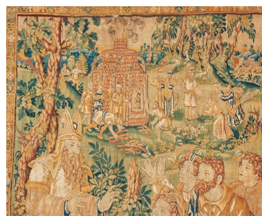
Pièce 7, détail : des hommes alimentent en bois le four qui va servir à fondre le veau d'or.