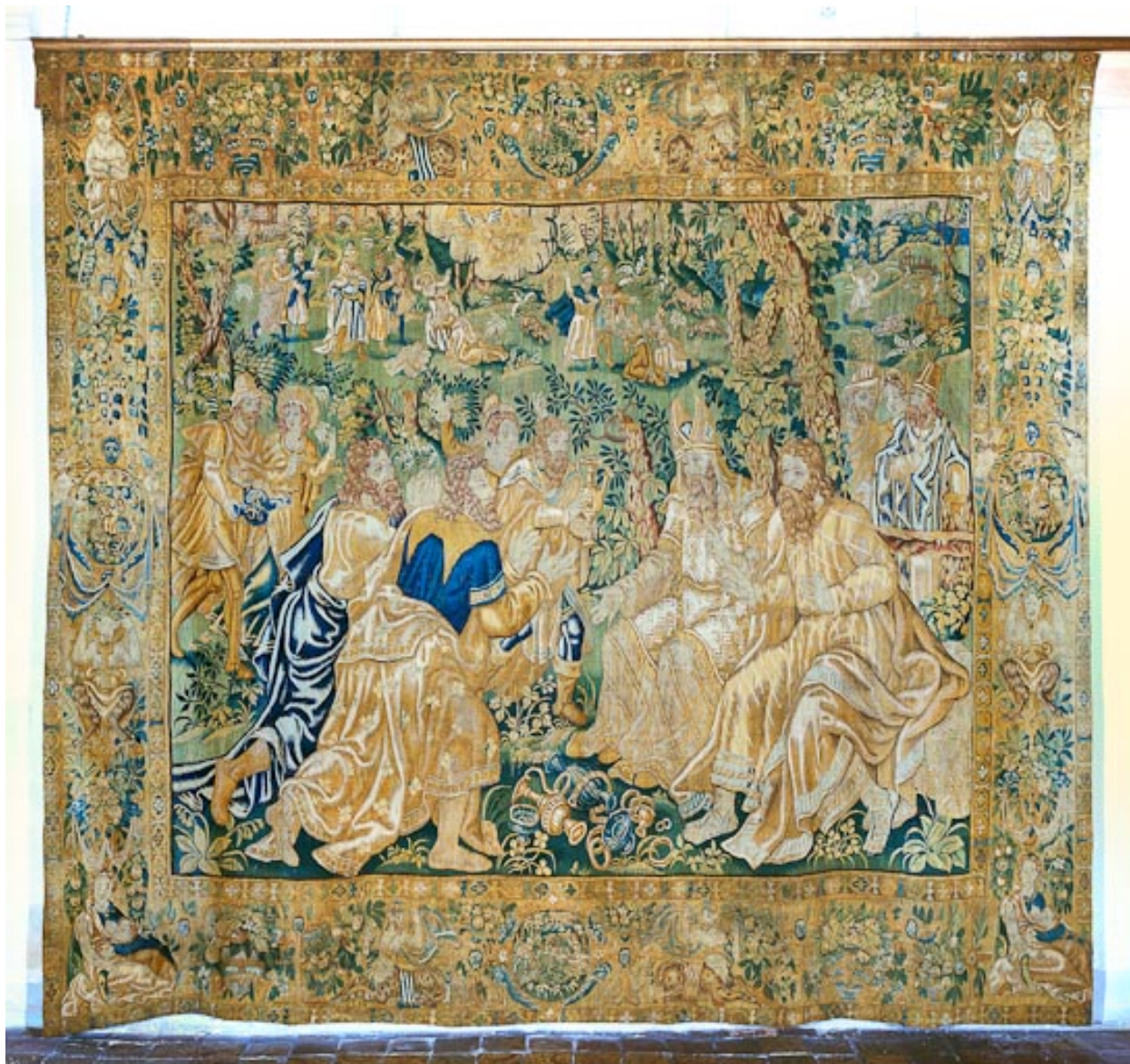
Pièce n°4 : vue d'ensemble.