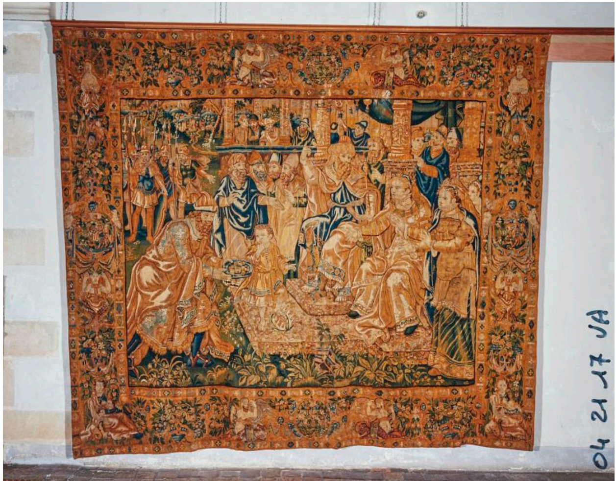
Pièce n°2 : Moïse enfant foulant la couronne de Pharaon.