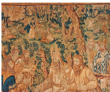
Pièce n°4 : détail.