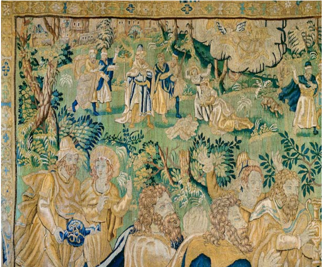
Pièce n°4 : détail.