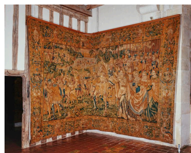
Pièce n°5 : Passage de la mer Rouge.