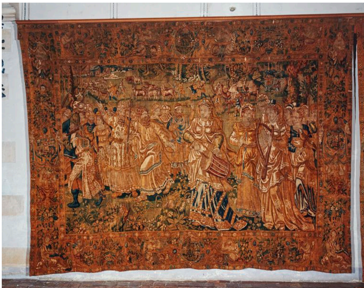
Pièce n°6 : Moïse chante un cantique.