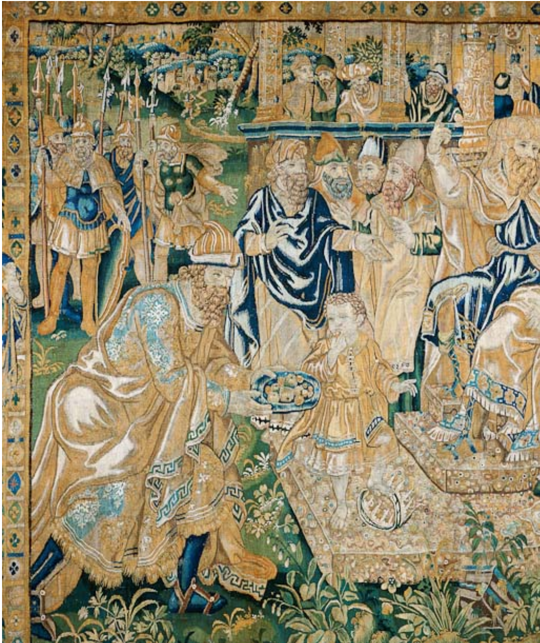
Pièce n°2 : détail.