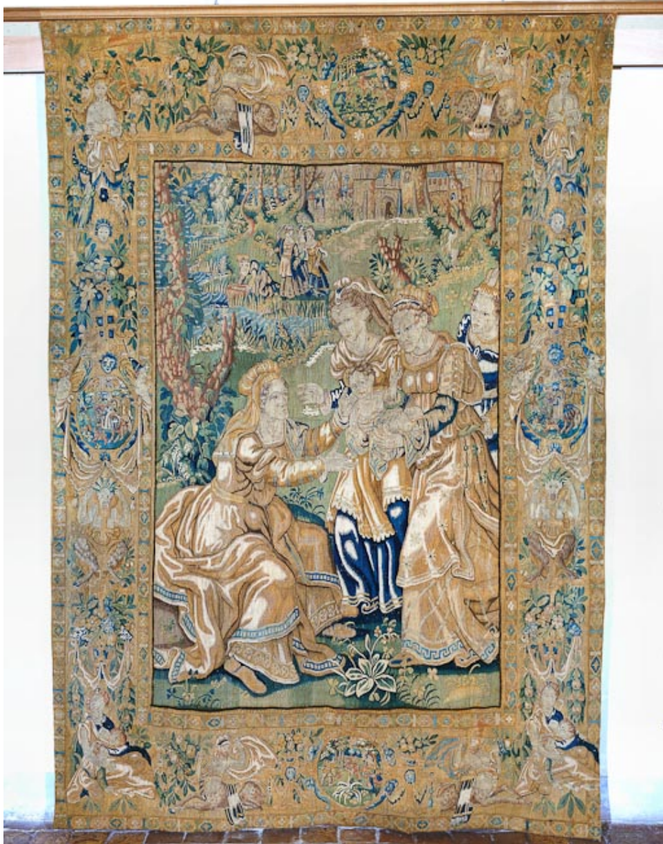
Pièce n°1 : Moïse sauvé des eaux.