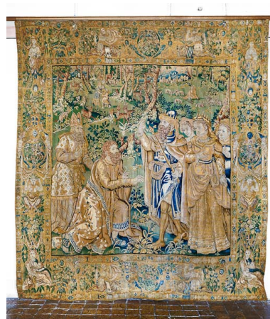
Pièce n°3 : vue d'ensemble. IVR26_20042100027VA