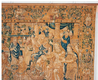
Pièce n°2 : détail.