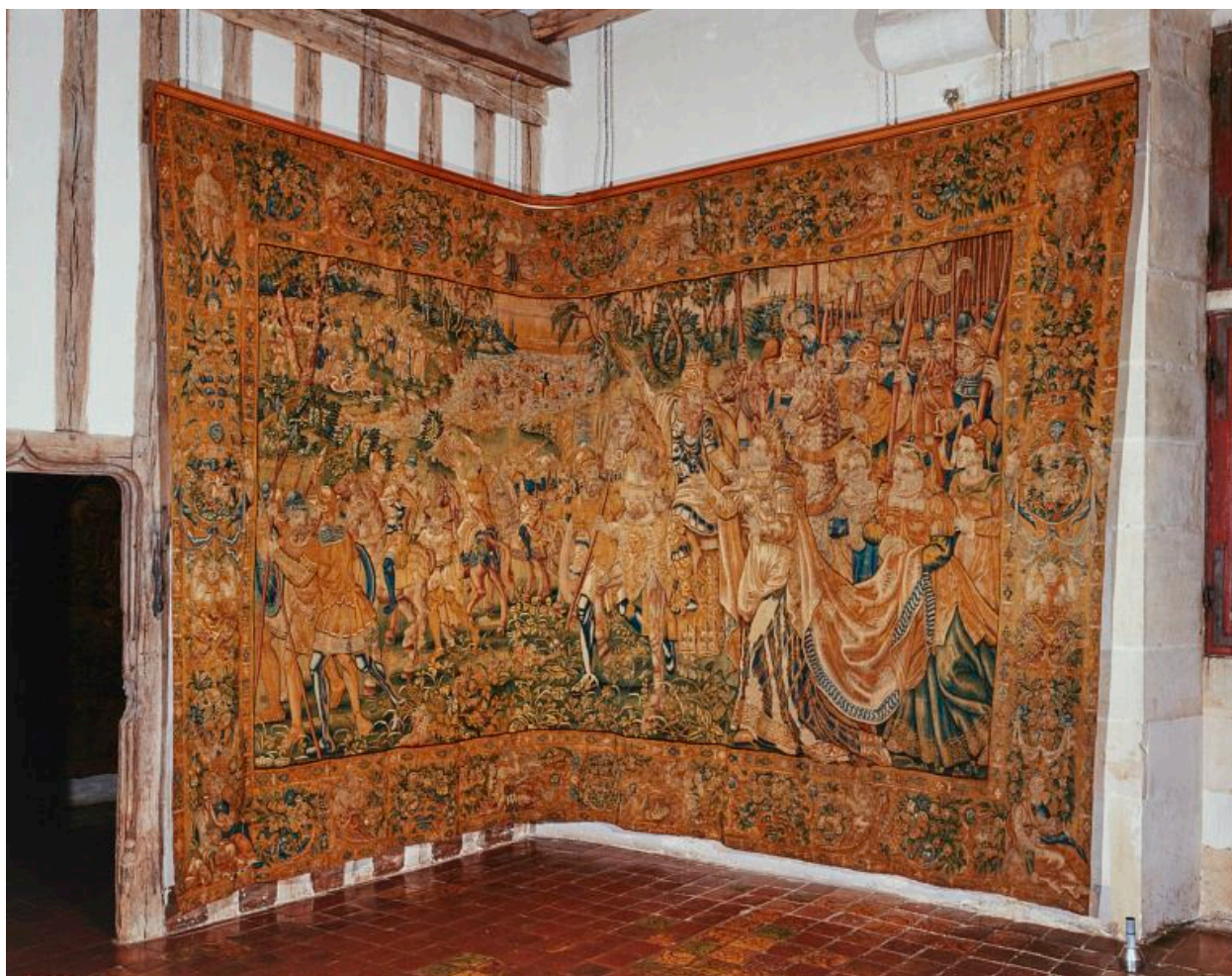
Pièce n°5 : Passage de la mer Rouge.