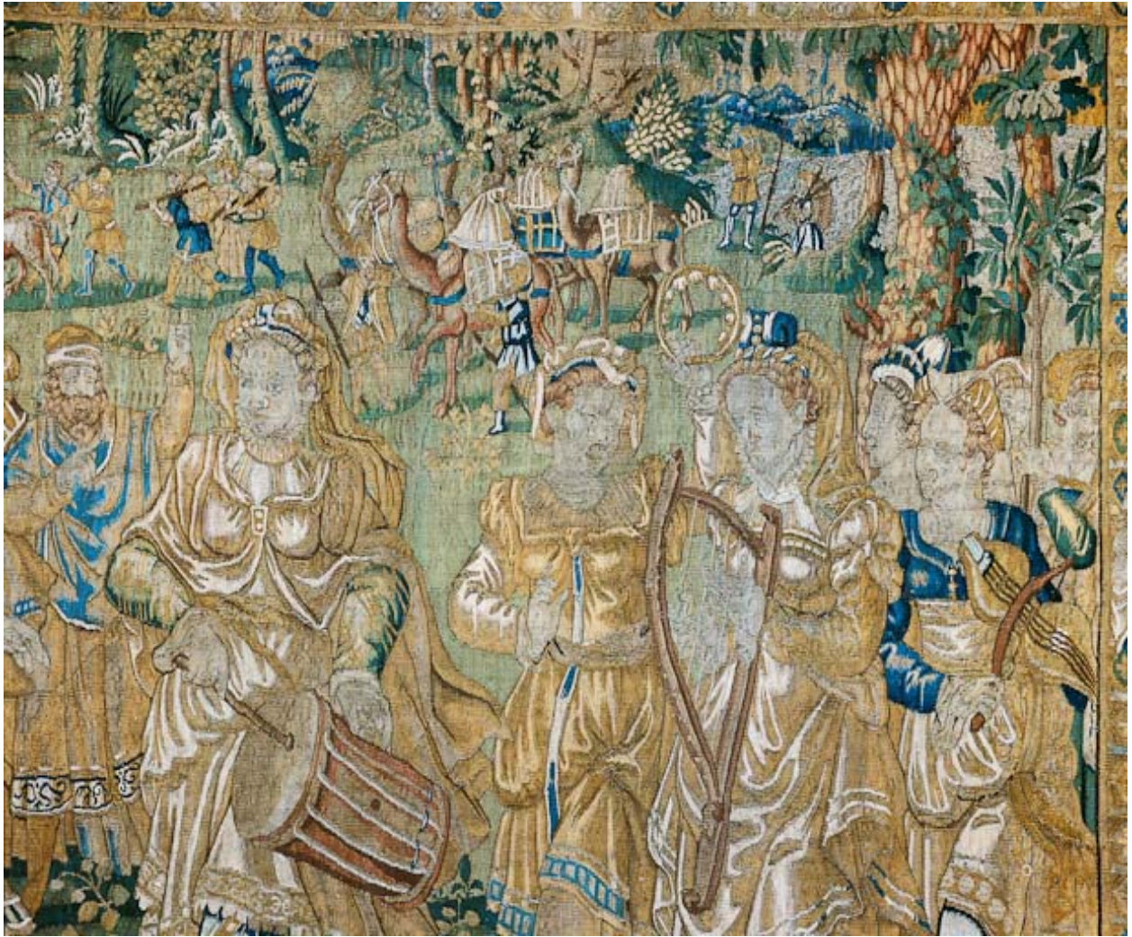
Pièce n°6 : détail.