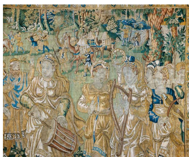
Pièce n°6 : détail. IVR26_20042100009XA