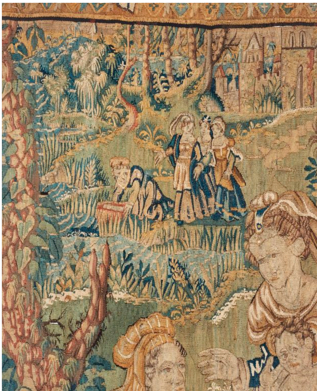
Pièce n°1 : détail.