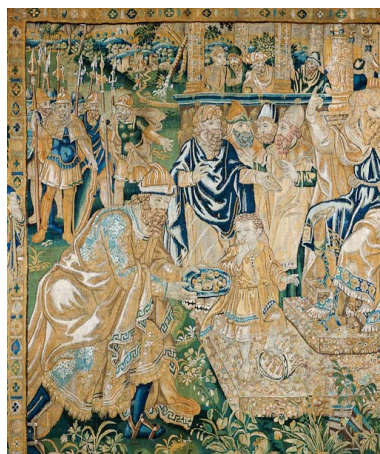
Pièce n°2 : détail. IVR26_20042100021XA