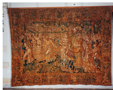
Pièce n°6 : Moïse chante un cantique.