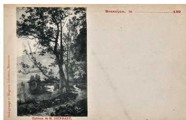
Vue ancienne du tableau. IVR43_20232500583NUC1A