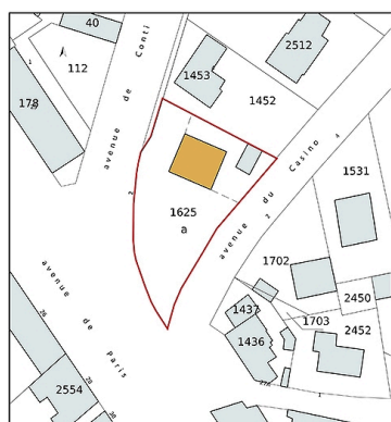
Plan-masse et de situation, extrait du plan cadastral (2021). IVR26_20215800056NUDA