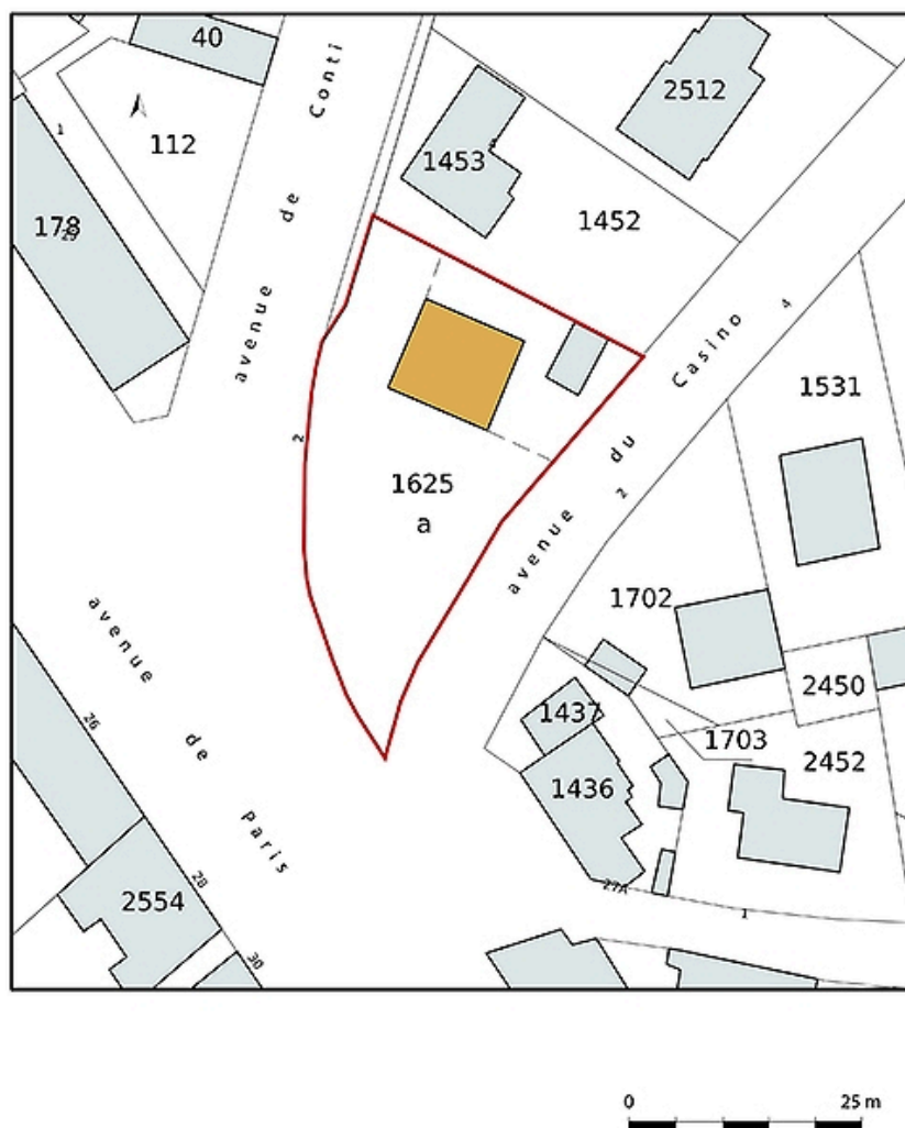
Plan-masse et de situation, extrait du plan cadastral (2021).