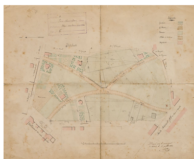
Plan du Parc Chevalier en 1884. IVR26_20205800239NUC2A