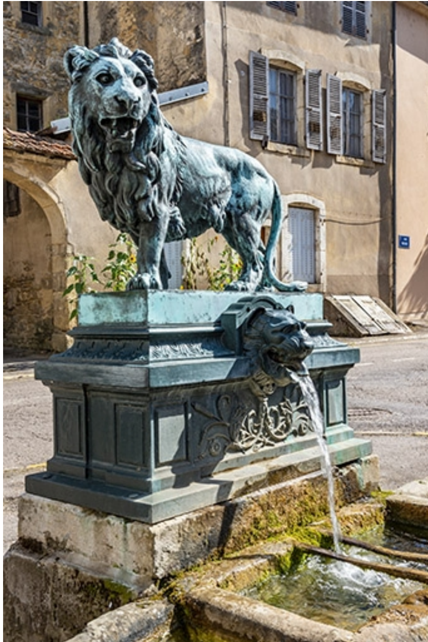
La borne et la sculpture de trois quarts gauche.