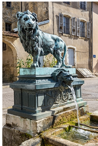
La borne et la sculpture de trois quarts gauche. IVR43_20217000589NUC4A