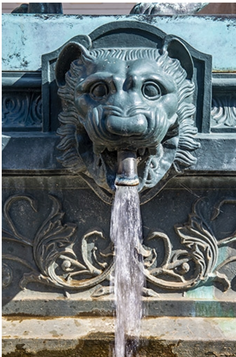
Détail du protomé de lion en eau.