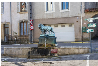
L'ensemble de la fontaine.