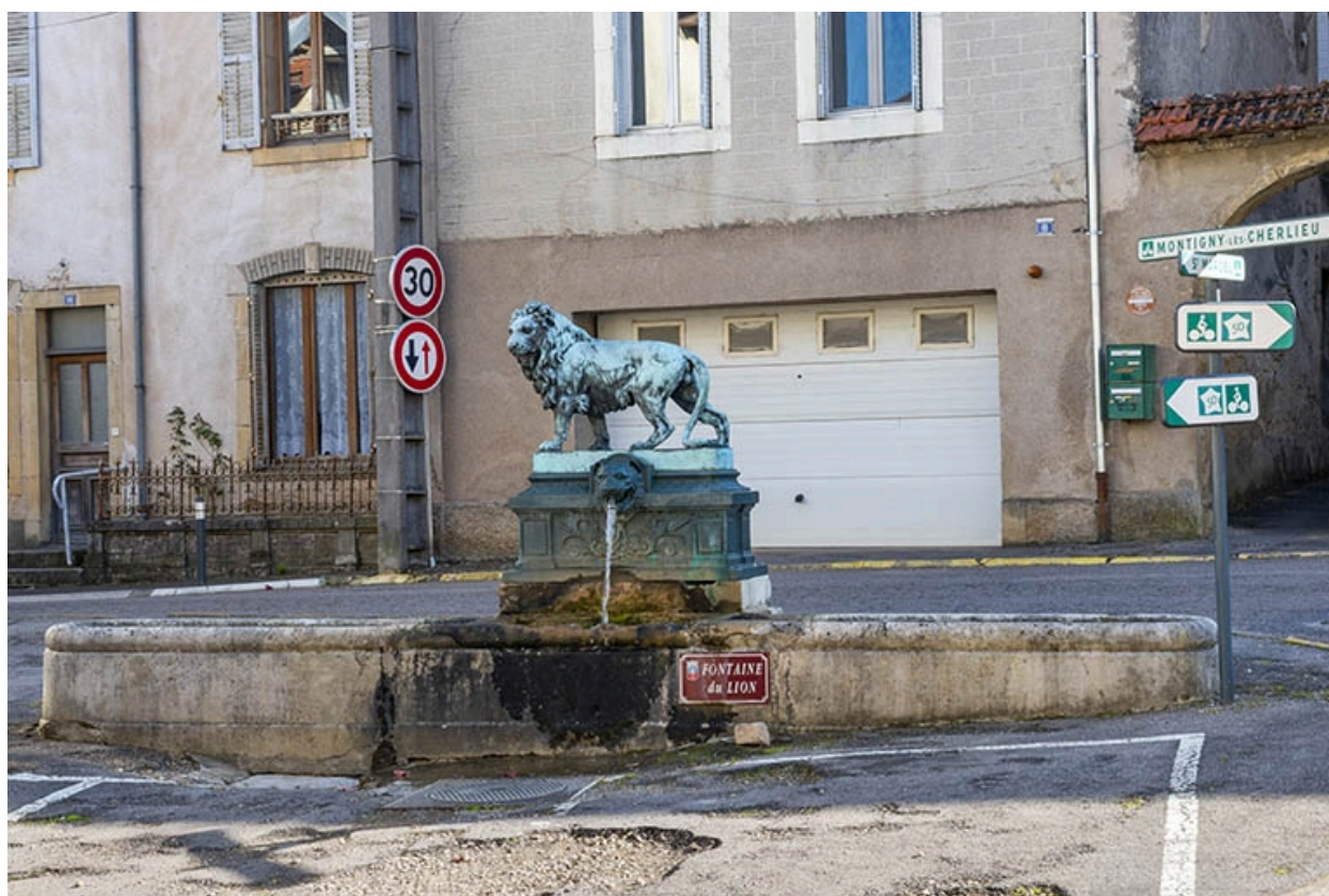
L'ensemble de la fontaine.