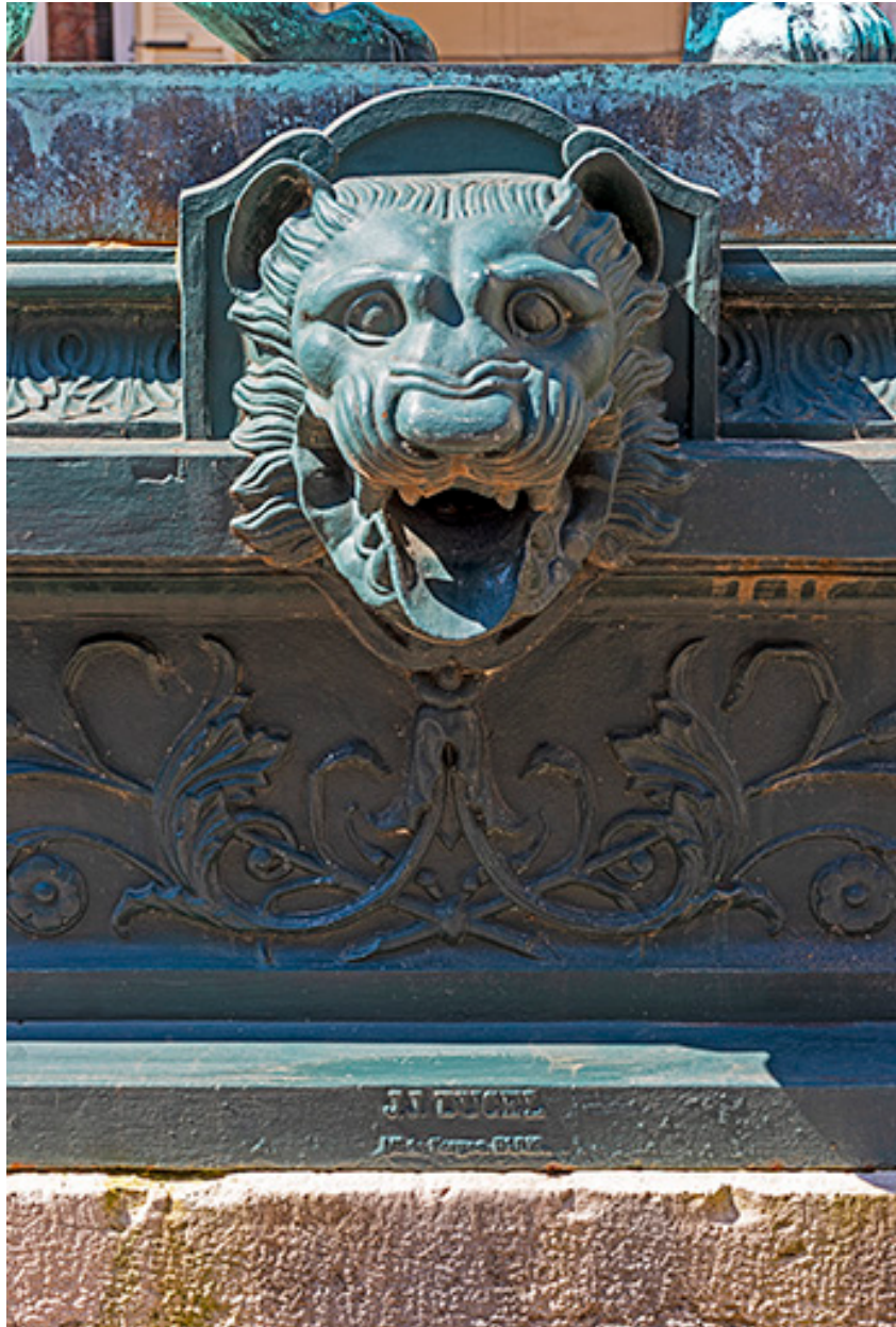
Détail du protomé de lion sans eau.