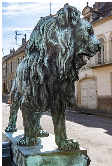
Trois quarts gauche du lion.