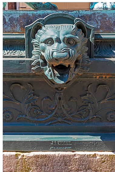
Détail du protomé de lion sans eau.