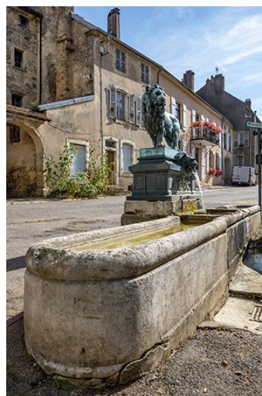
La fontaine de trois quarts gauche.