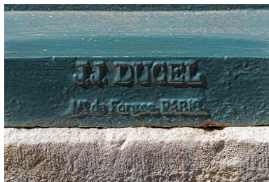
Signature de la fonderie au revers de la fontaine.

Phot. Aline Thomas IVR43_20257000018NUC4A