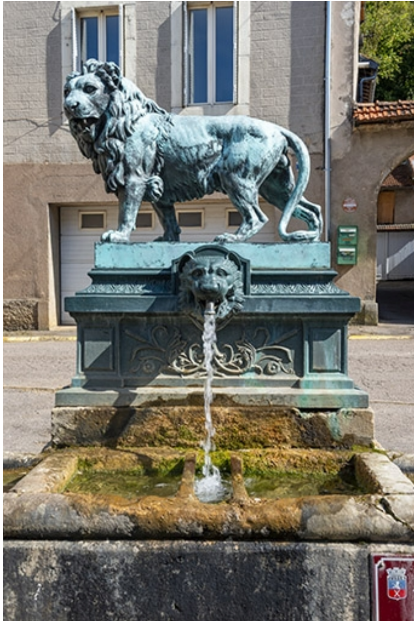
La statue et la borne de face.