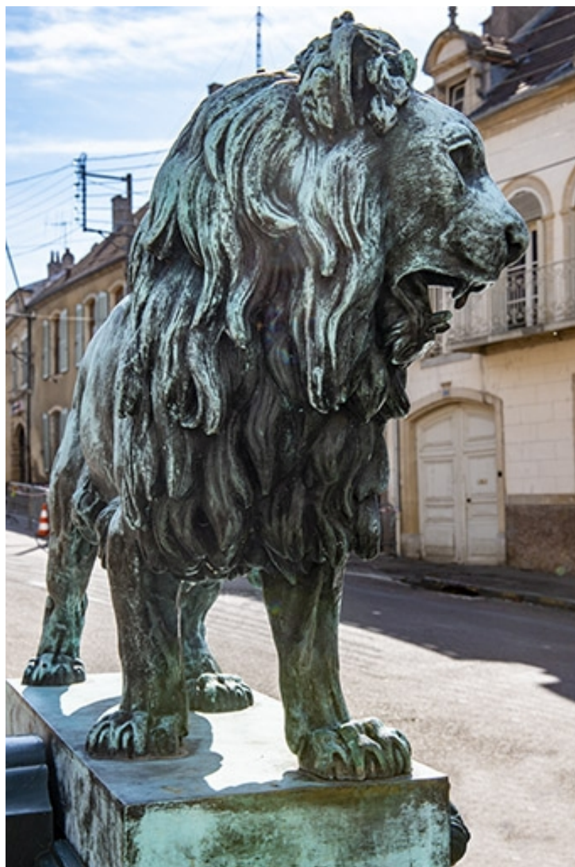
Trois quarts gauche du lion.