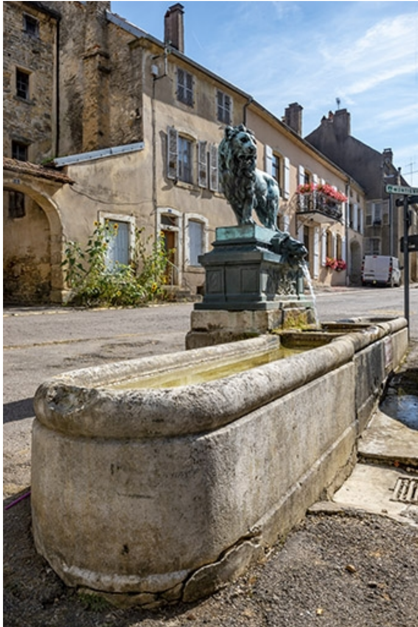
La fontaine de trois quarts gauche.