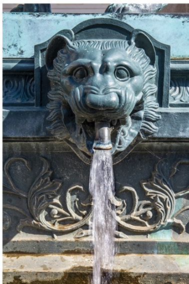
Détail du protomé de lion en eau.