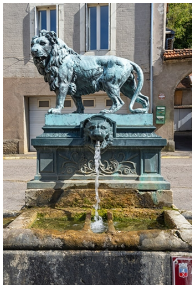
La statue et la borne de face. IVR43_20217000586NUC4A