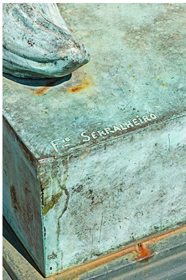
Signature au pied du lion.

IVR43_20257000018NUC4A