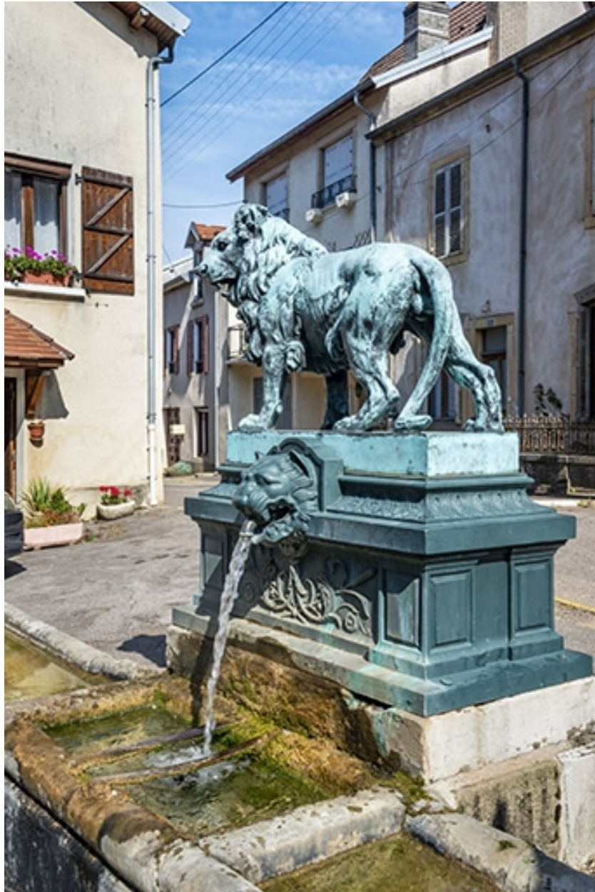
La statue et la borne de trois quarts droit.