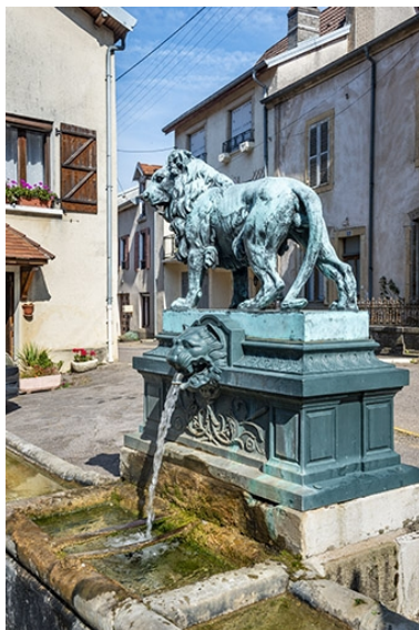
La statue et la borne de trois quarts droit. IVR43_20217000585NUC4A