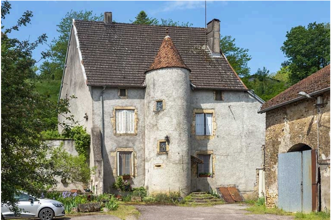
La façade antérieure depuis la rue.