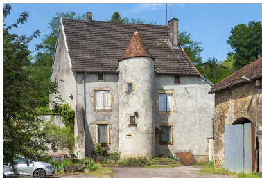
La façade antérieure depuis la rue. IVR43_20217000257NUC4A

IVR43_20257000059NUDA