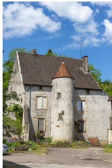
La façade antérieure depuis la rue.