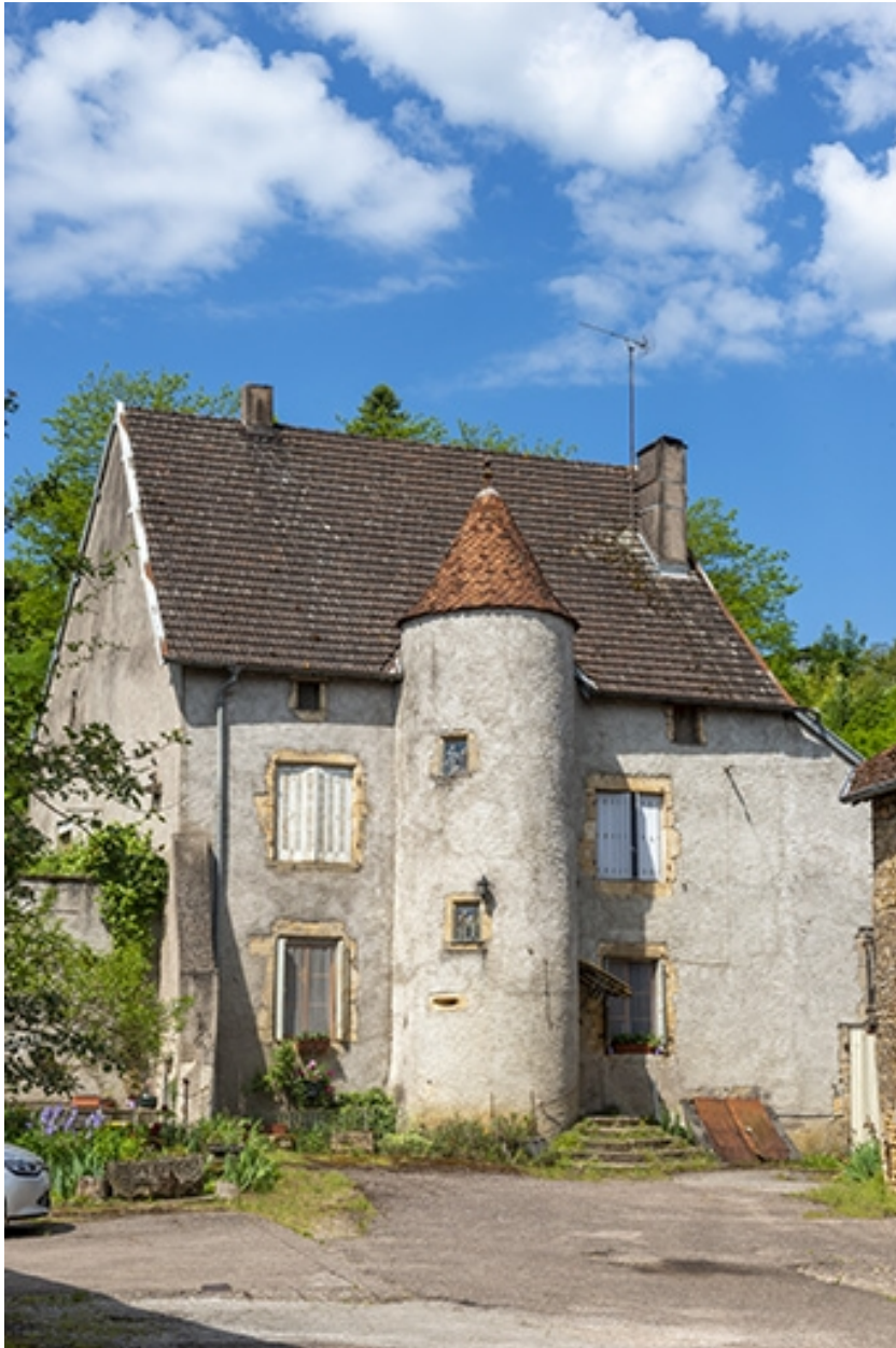
La façade antérieure depuis la rue.