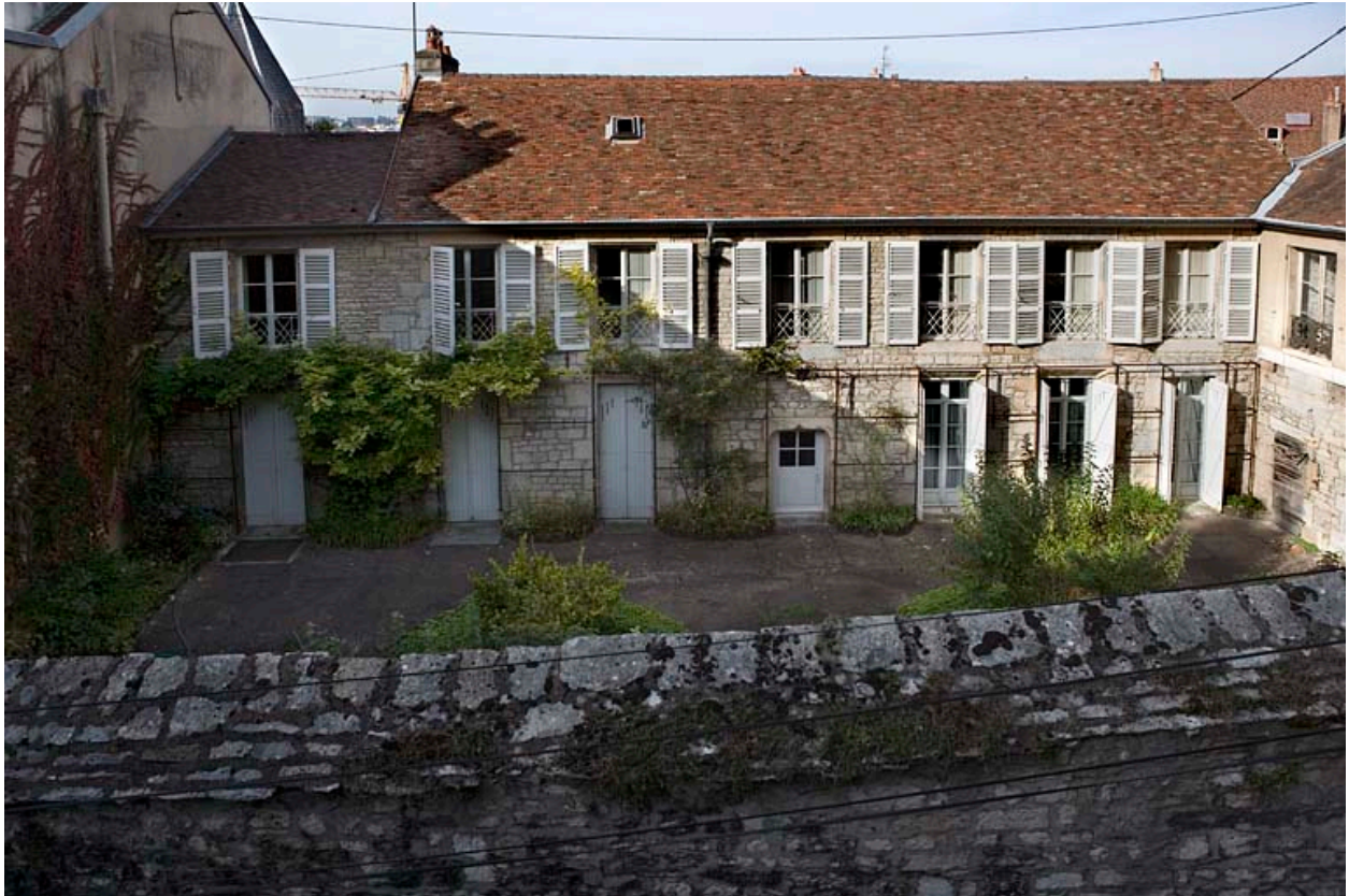
Vue d'ensemble de la façade postérieure depuis le jardin de l'hôtel Franchet de Rans.