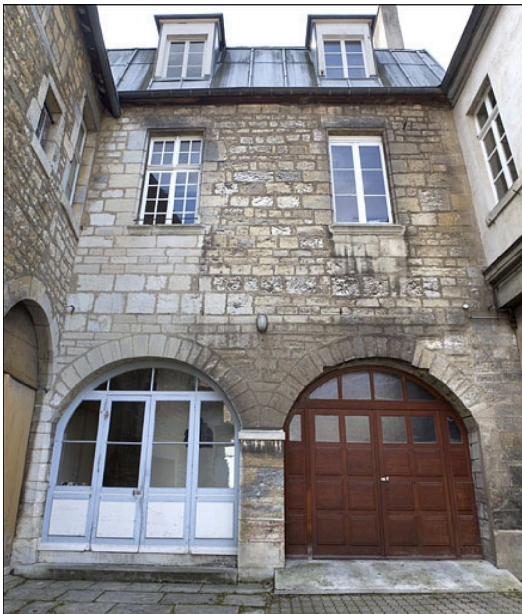
Vue d'ensemble de la façade antérieure du logis en fond de cour.