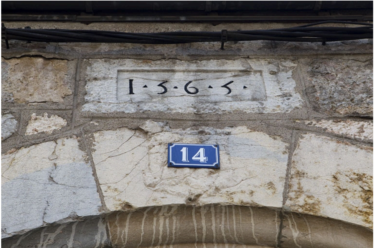
Détail de la date sur le linteau du portail dans clôture.