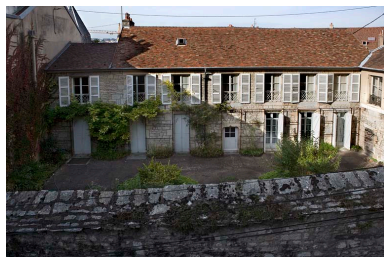
Vue d'ensemble de la façade postérieure depuis le jardin de l'hôtel Franchet de Rans. IVR43_20072500879NUCA