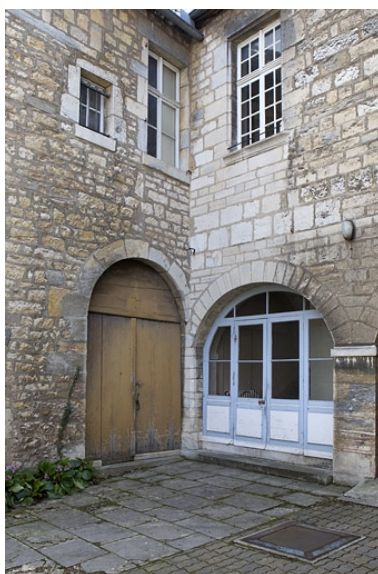
Détail de l'angle gauche entre l'aile gauche et le logis en fond de cour. IVR43_20102500435NUC2A