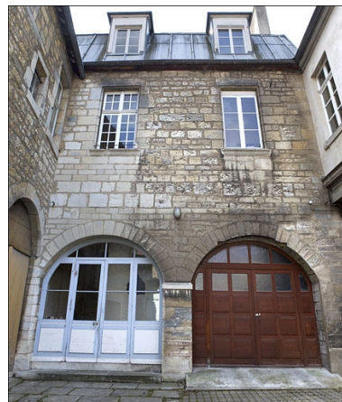
Vue d'ensemble de la façade antérieure du logis en fond de cour.