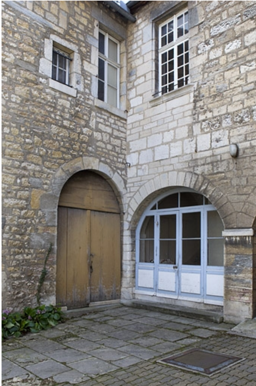
Détail de l'angle gauche entre l'aile gauche et le logis en fond de cour.