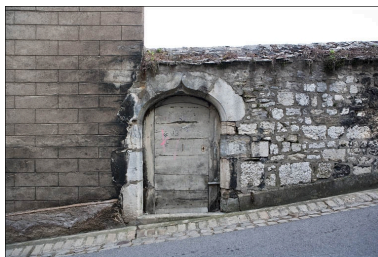
Détail de la porte dans la clôture de jardin. IVR43_20102500437NUC2A