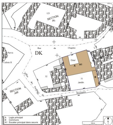
Plan masse et de situation. Extrait du plan cadastral, 1974, section AL.