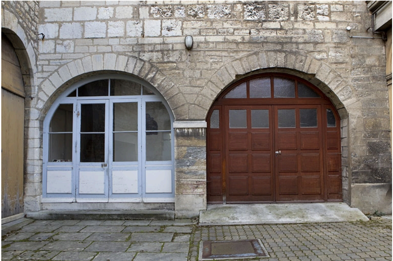
Détail du rez-de-chaussée du logis en fond de cour.