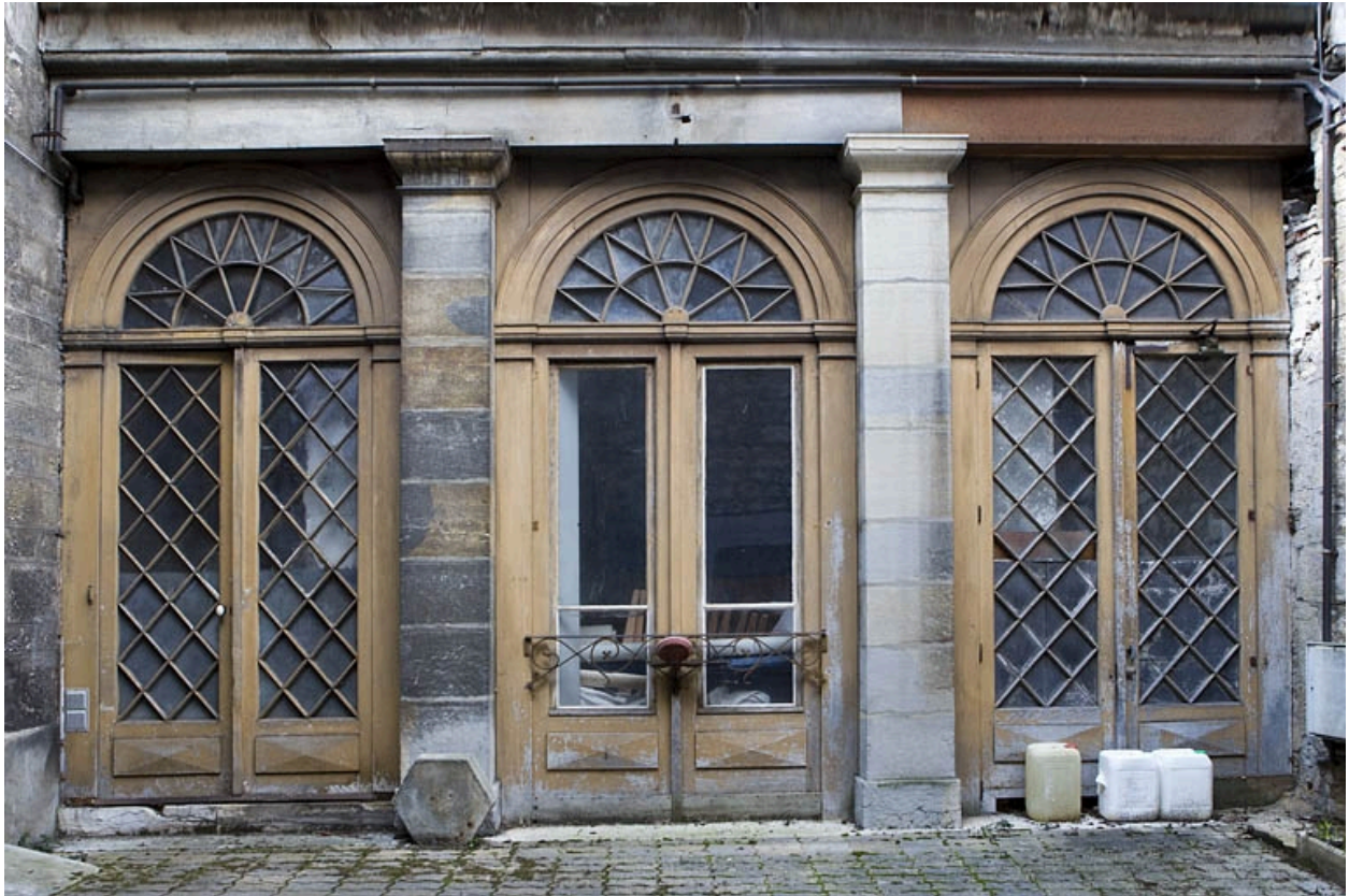
Détail du rez-de-chaussée de l'aile droite.