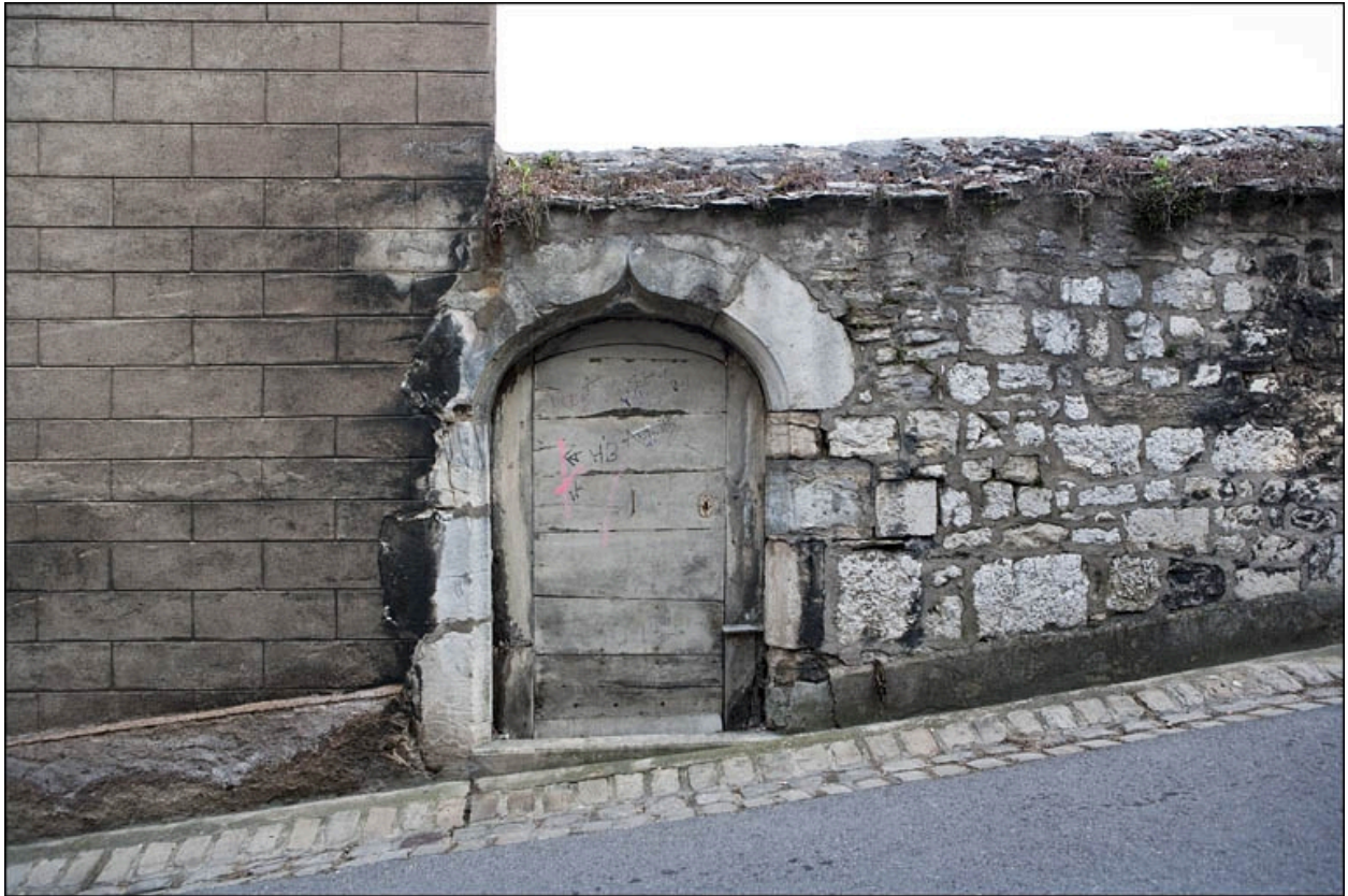
Détail de la porte dans la clôture de jardin.