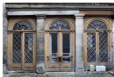
Détail du rez-de-chaussée de l'aile droite. IVR43_20102500433NUC2A