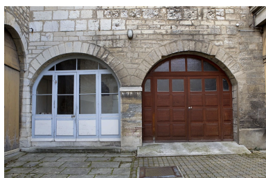
Détail du rez-de-chaussée du logis en fond de cour. IVR43_20102500434NUC2A