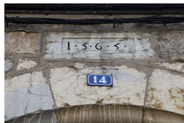
Détail de la date sur le linteau du portail dans clôture.