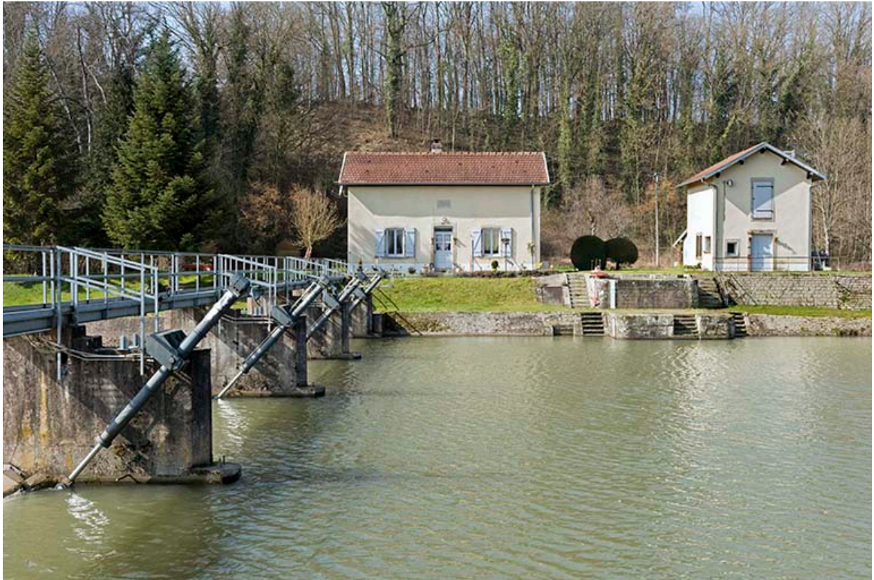
Le barrage et la maison du barragiste.