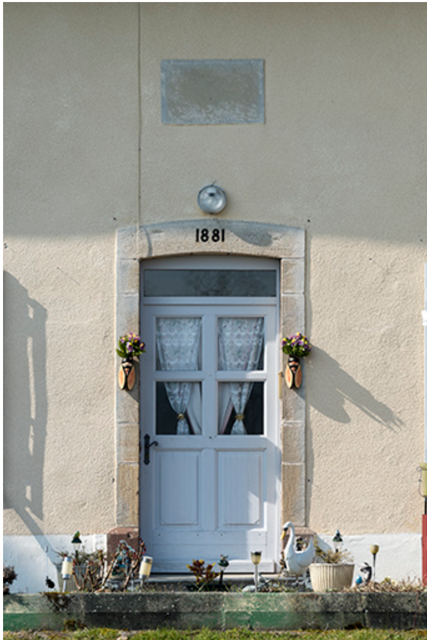
La porte d'entrée de la maison avec sa plaque signalétique.