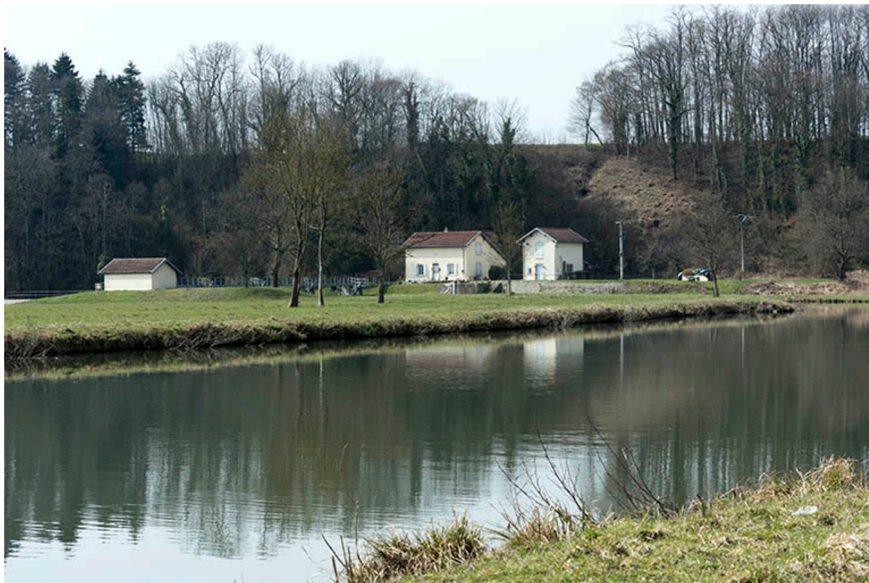
La saône et le site du barrage mobile.