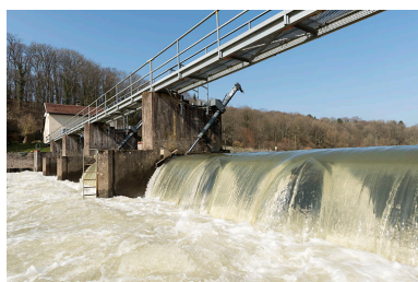
La passerelle du barrage. IVR43_20167000275NUC4A