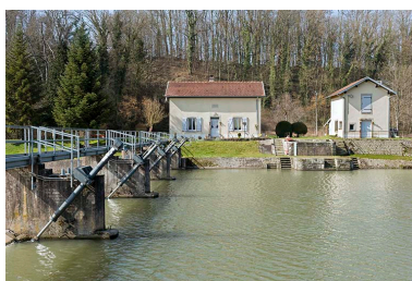
Le barrage et la maison du barragiste. IVR43_20167000276NUC4A