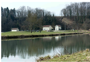
La saône et le site du barrage mobile. IVR43_20167000273NUC4A