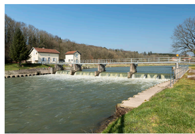
Le site du barrage, vue d'ensemble.