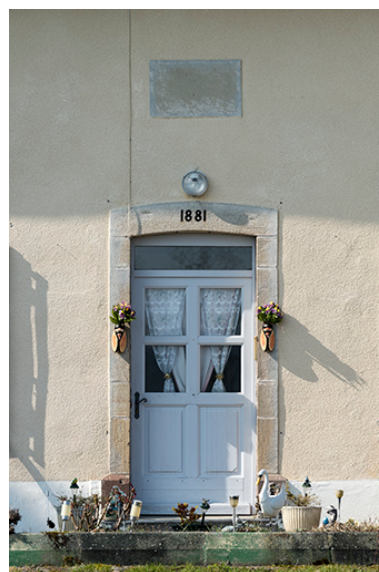
La porte d'entrée de la maison avec sa plaque signalétique.