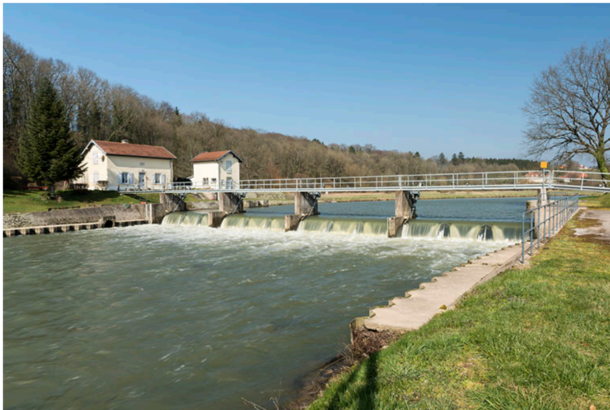
Le site du barrage, vue d'ensemble.