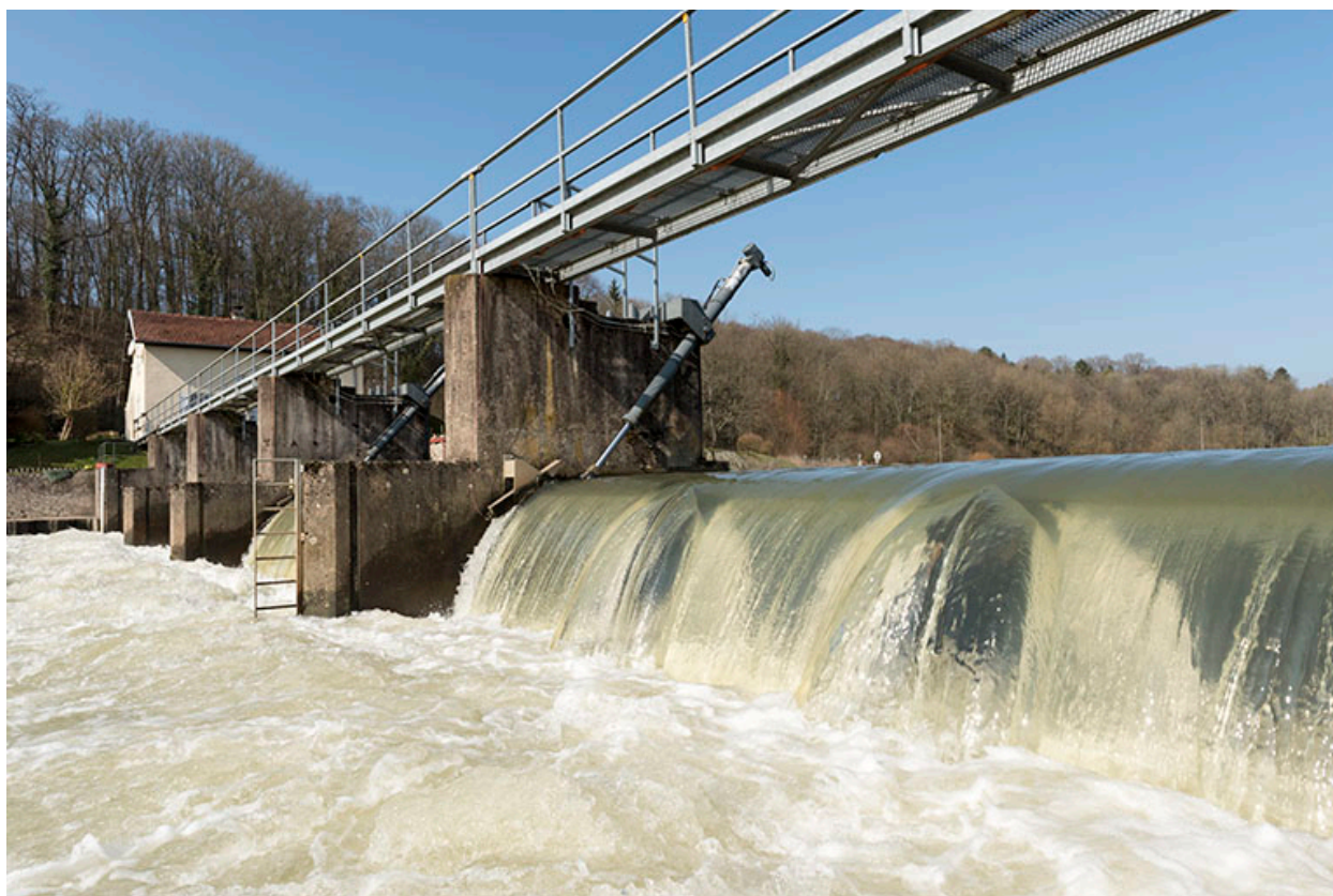
La passerelle du barrage.