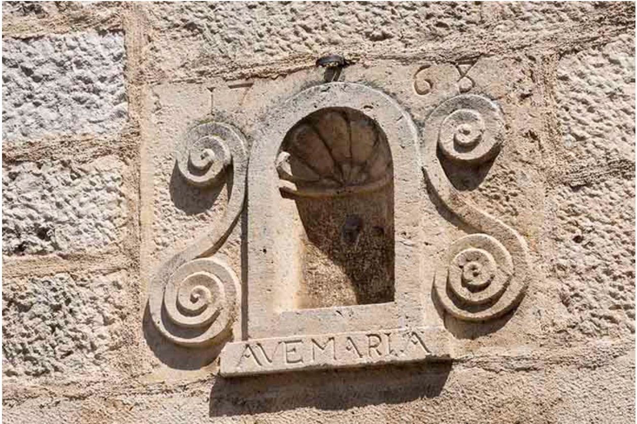
Niche encadrée de volutes.