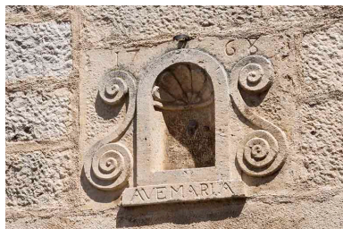
Niche encadrée de volutes.