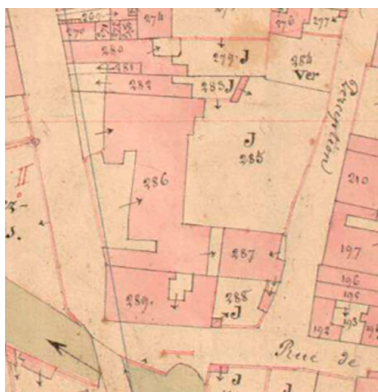
Extrait de l'Atlas parcellaire (1836) du cadastre de la commune de Scey-sur-Saône-et-Saint-Albin.