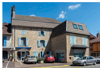
Élévation sur la rue Armand Paulmard. IVR43_20187000442NUC4A