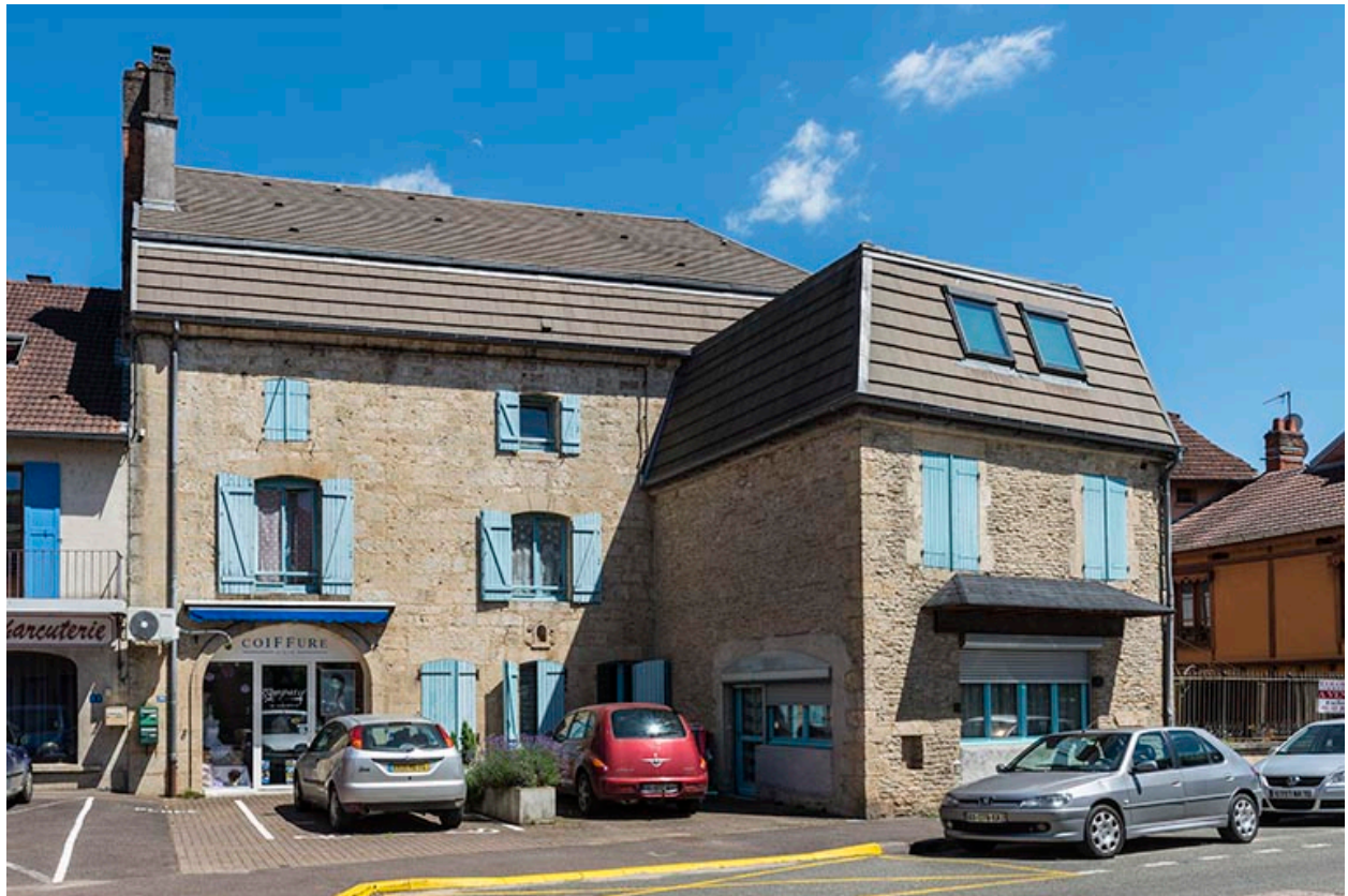
Élévation sur la rue Armand Paulmard.