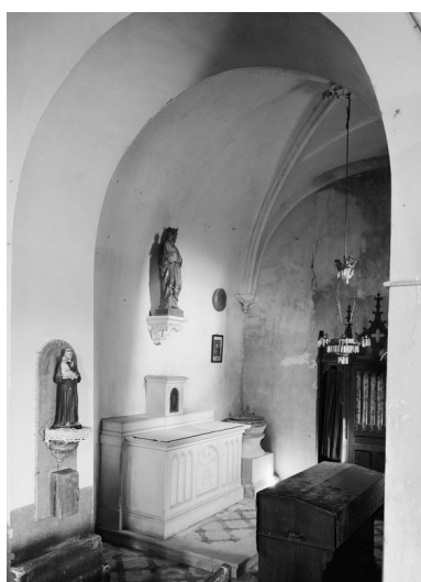
La chapelle (photo prise en 1978). IVR26_19782100777V