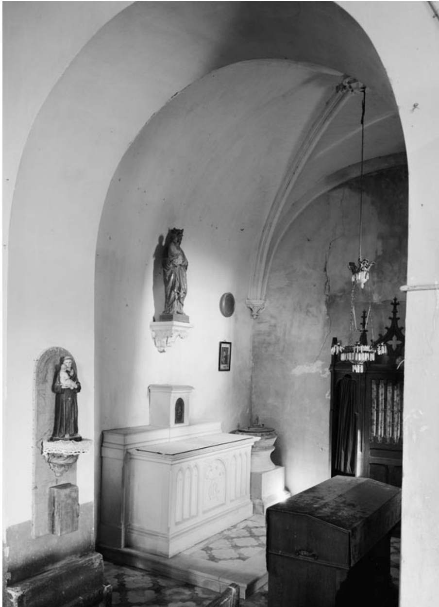
La chapelle (photo prise en 1978).