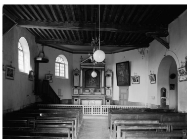
Vue d'ensemble prise de l'entrée (photo prise en 1978).