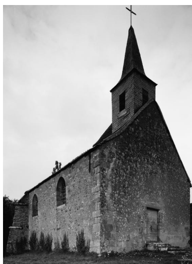
Vue d'ensemble de 3/4 droit (photo prise en 1978).