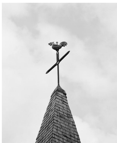
Girouette (photo prise en 1978).