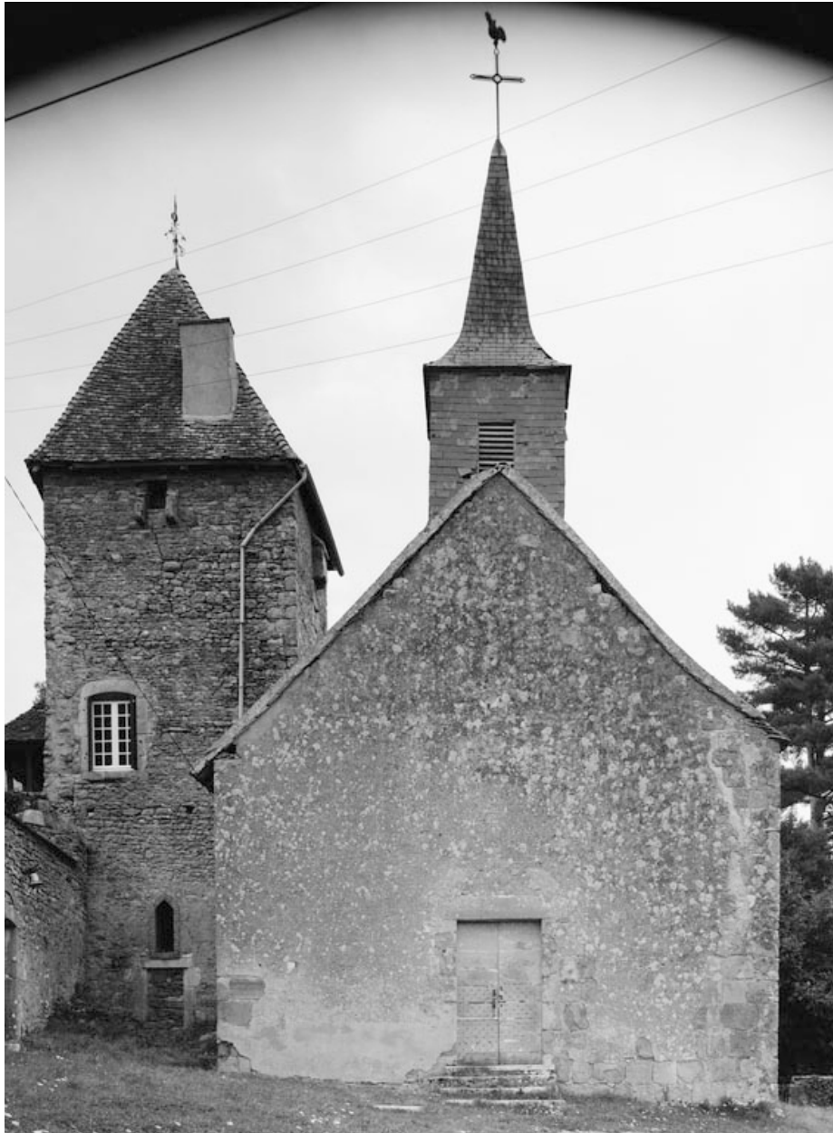
Façade antérieure (photo prise en 1978).