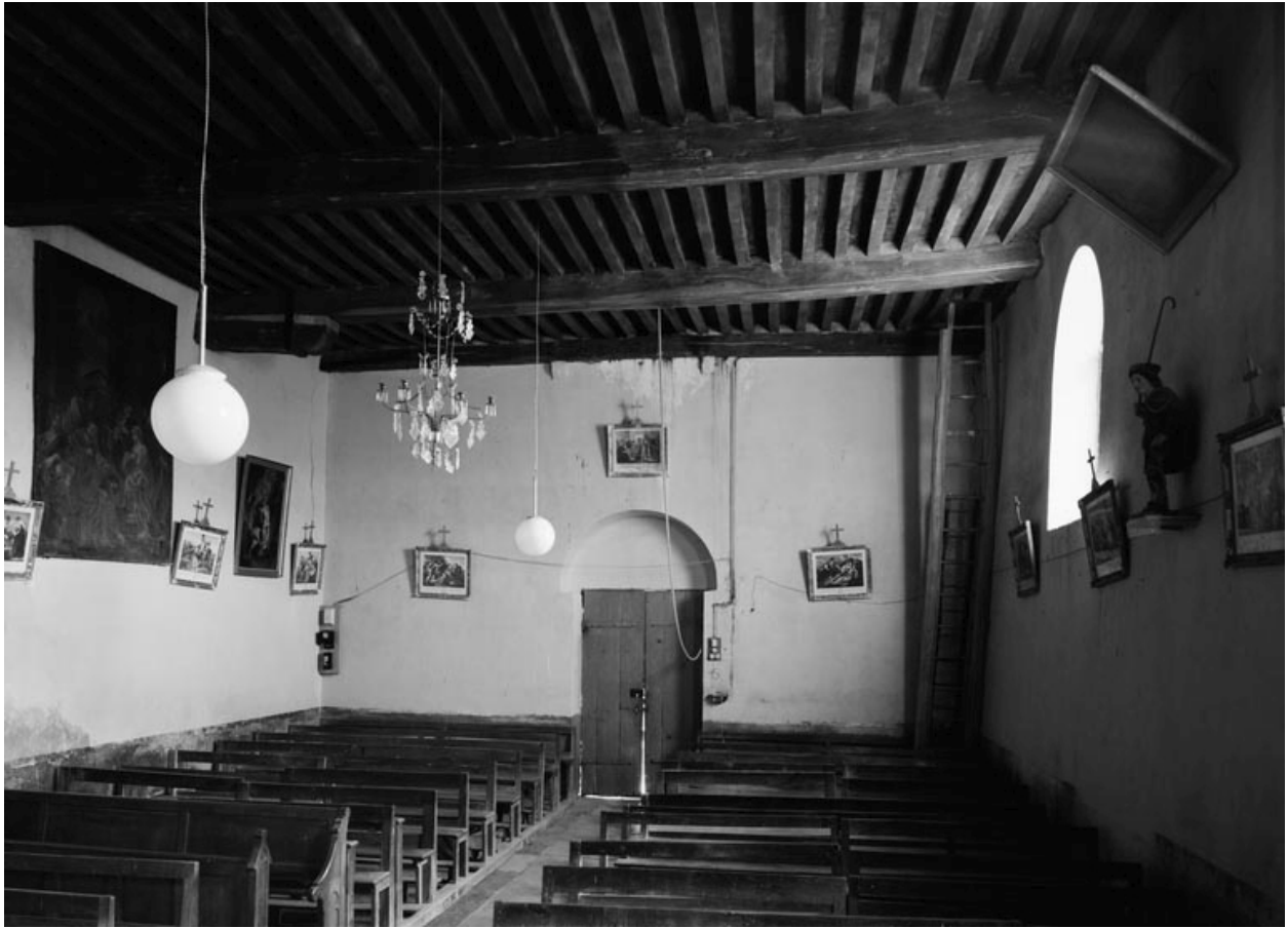
La nef, depuis le chœur (photo prise en 1978).