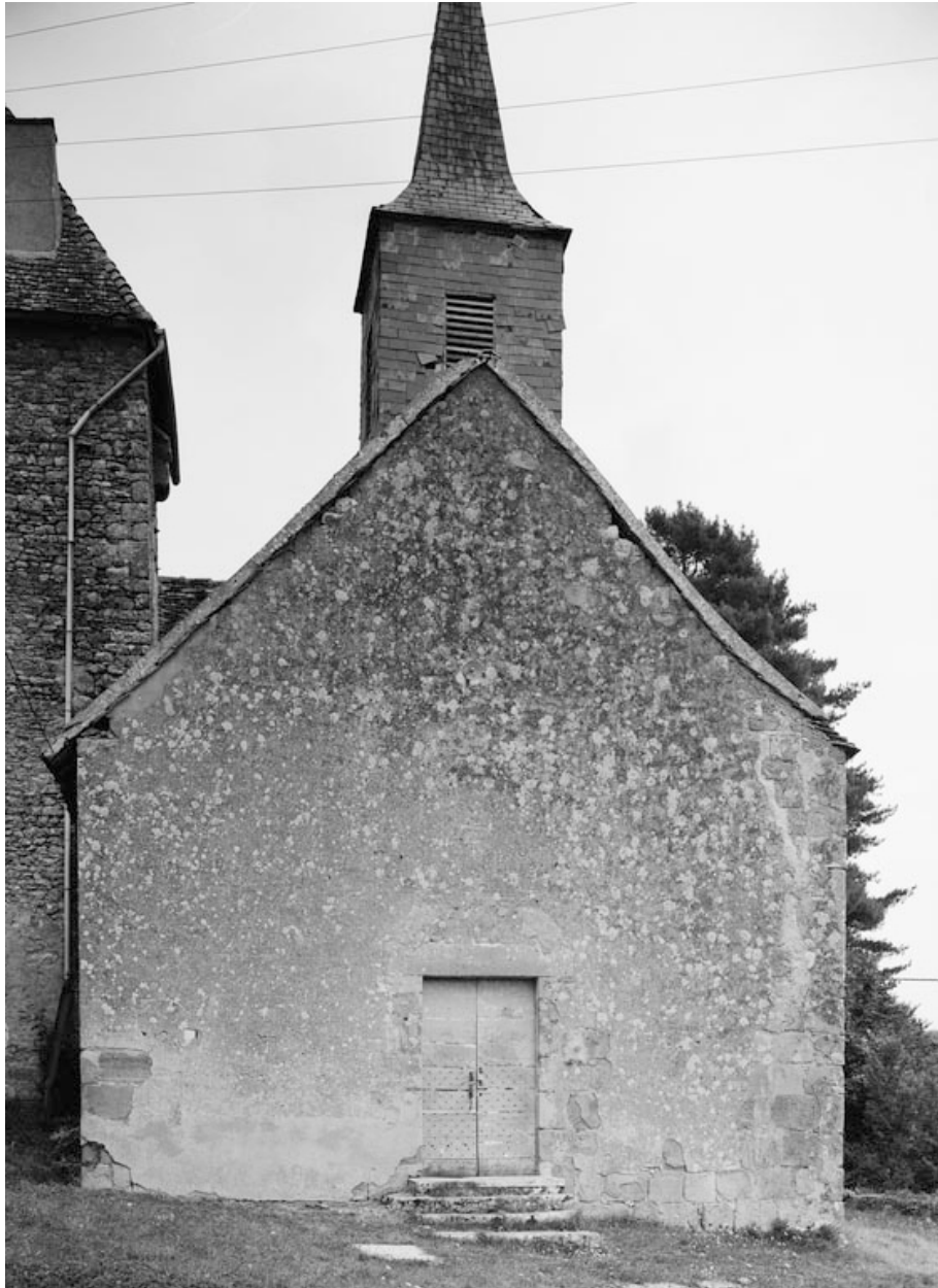
Façade antérieure (photo prise en 1978).