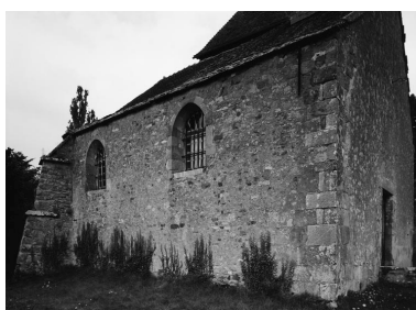
Élévation droite (photo prise en 1978).