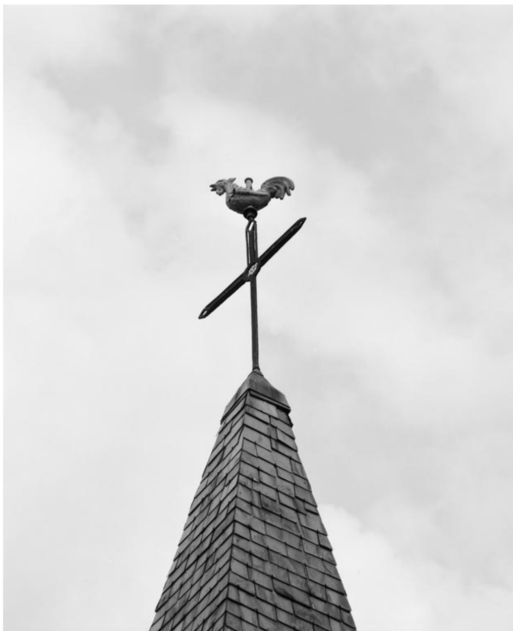
Girouette (photo prise en 1978).