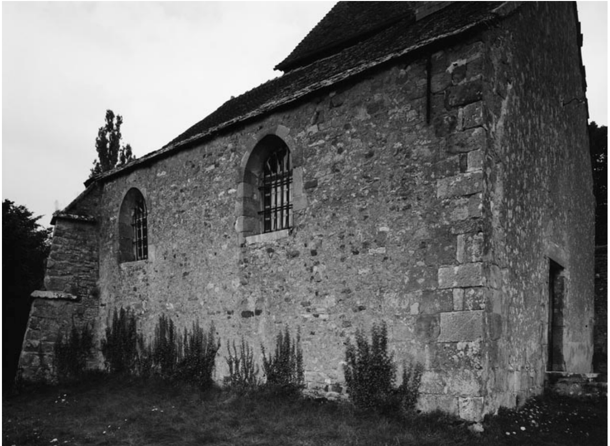
Élévation droite (photo prise en 1978).