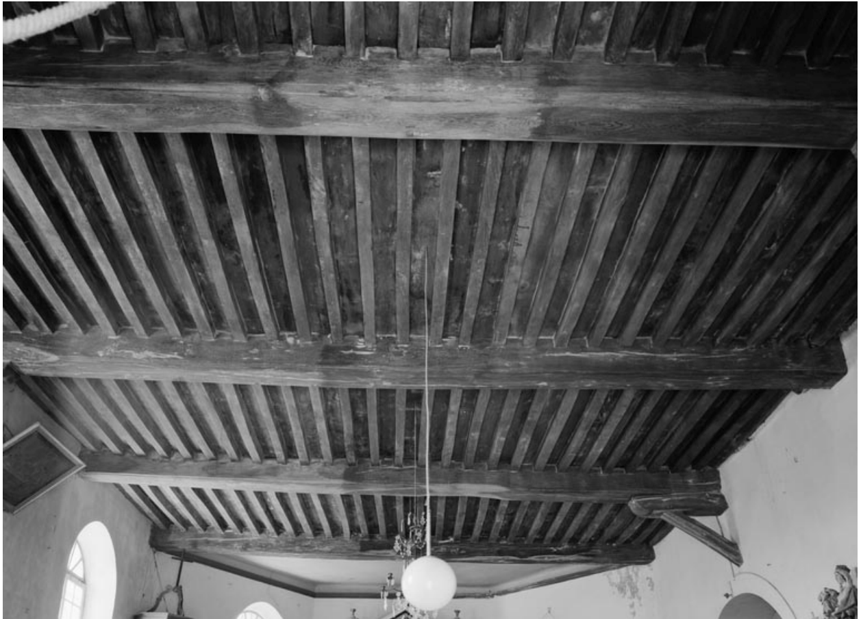
Le plafond (photo prise en 1978).