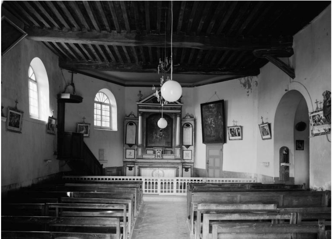
Vue d'ensemble prise de l'entrée (photo prise en 1978).