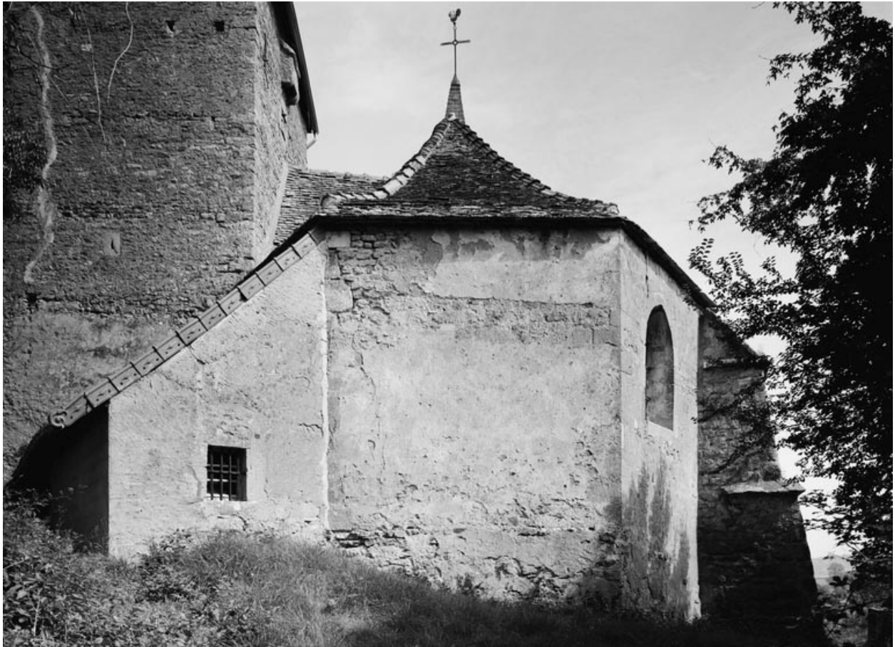
Chevet (photo prise en 1978).