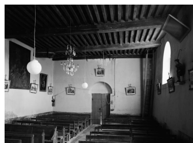
La nef, depuis le chœur (photo prise en 1978).