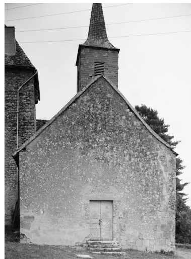
Façade antérieure (photo prise en 1978). IVR26_19782100769V