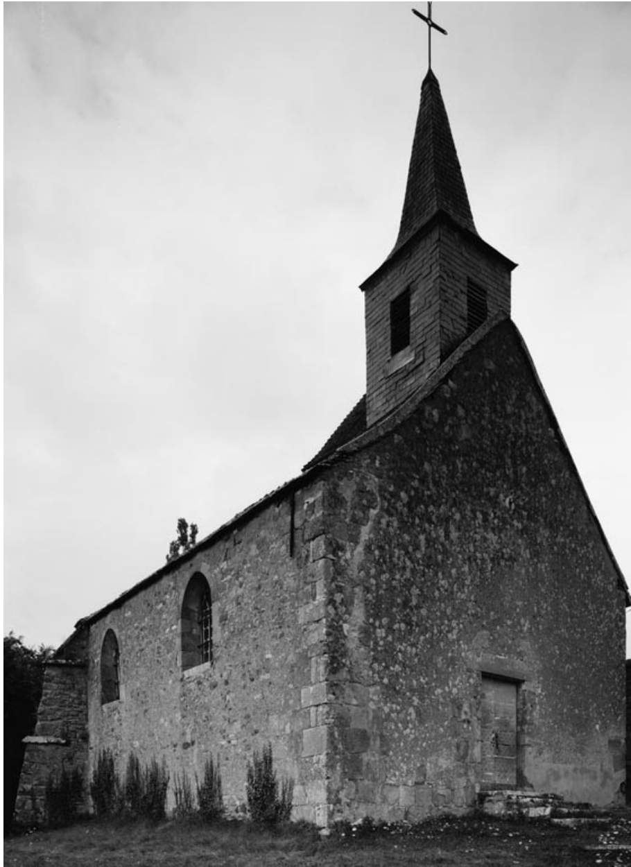
Vue d'ensemble de 3/4 droit (photo prise en 1978).