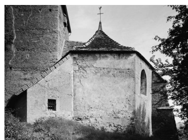
Chevet (photo prise en 1978). IVR26_19782100771V