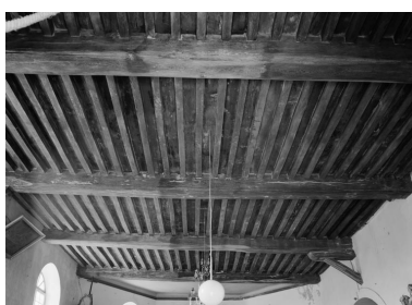
Le plafond (photo prise en 1978).