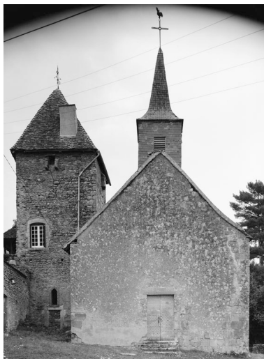
Façade antérieure (photo prise en 1978).