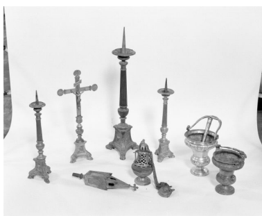
Croix d'autel, chandeliers, lanterne de procession, encensoir et seaux à eau bénite.