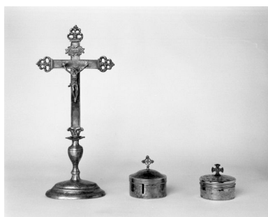
Croix d'autel, boîte à lunule et boîte à hosties.