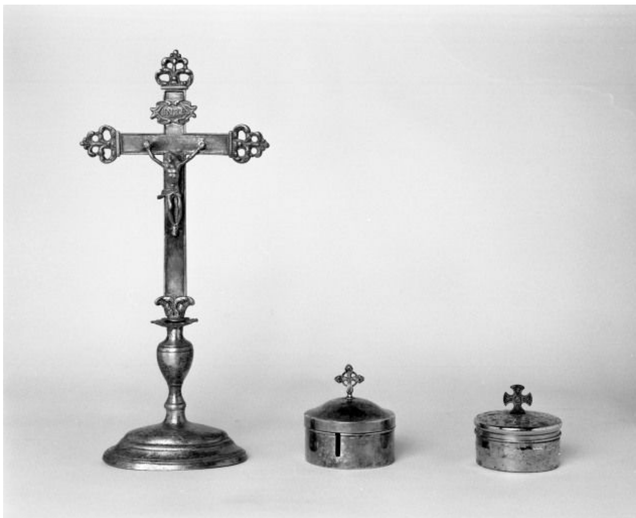
Croix d'autel, boîte à lunule et boîte à hosties.