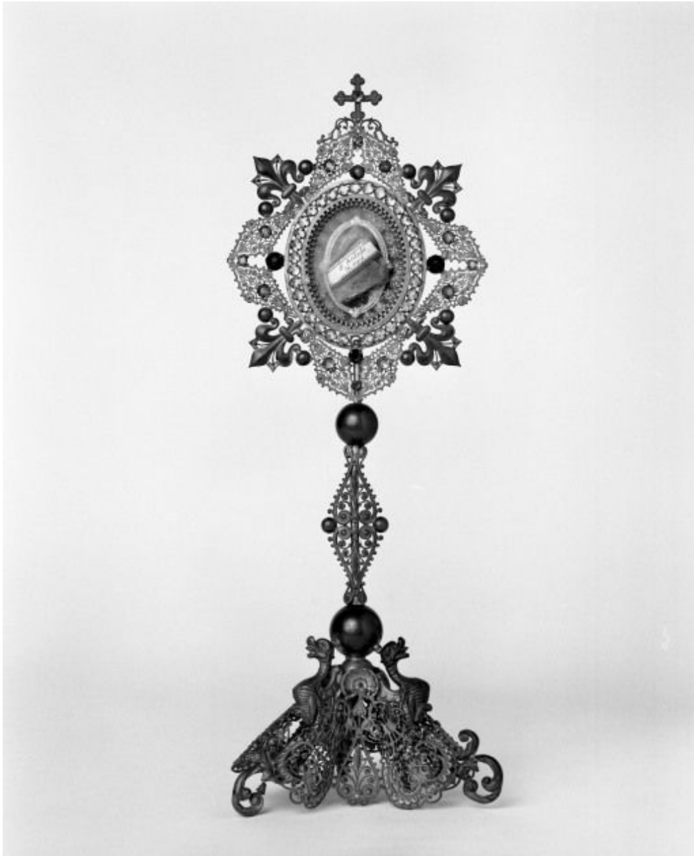
Reliquaire de saint Antide.