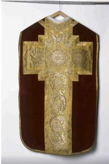
Chasuble rouge.