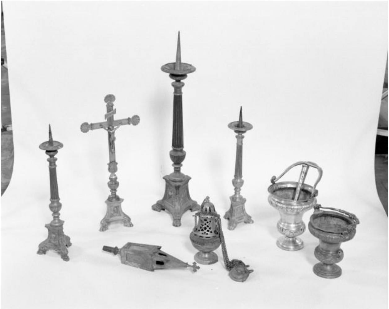
Croix d'autel, chandeliers, lanterne de procession, encensoir et seaux à eau bénite.