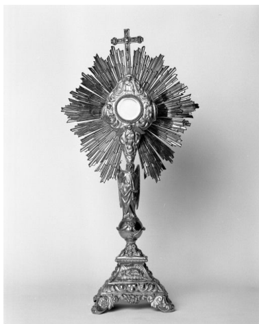
Ostensoir. IVR26_20017101140X