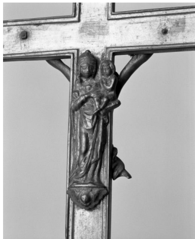
Croix de procession : détail.