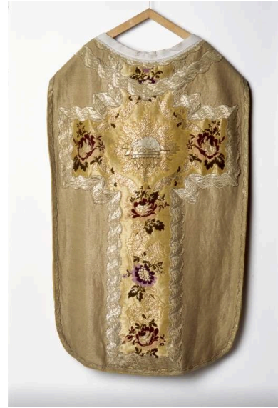
Chasuble dorée. IVR26_20017101131ZA