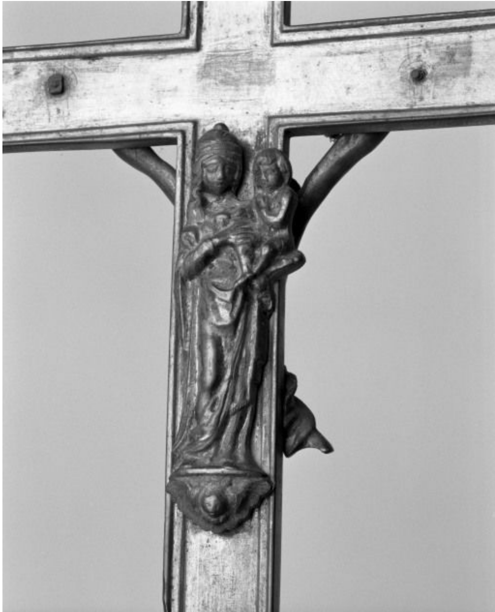
Croix de procession : détail.