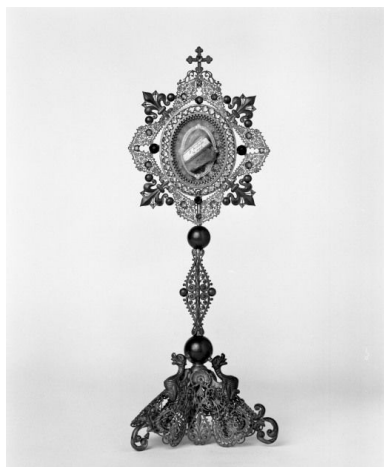
Reliquaire de saint Antide. IVR26_20017101143X