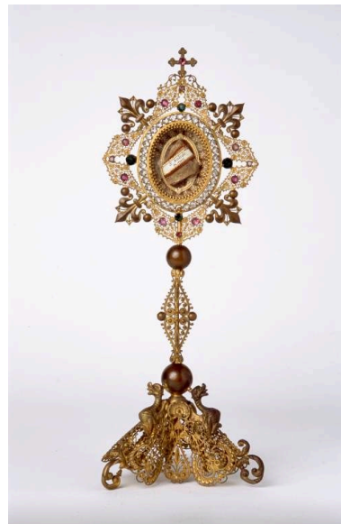
Reliquaire de saint Antide. IVR26_20017101144ZA