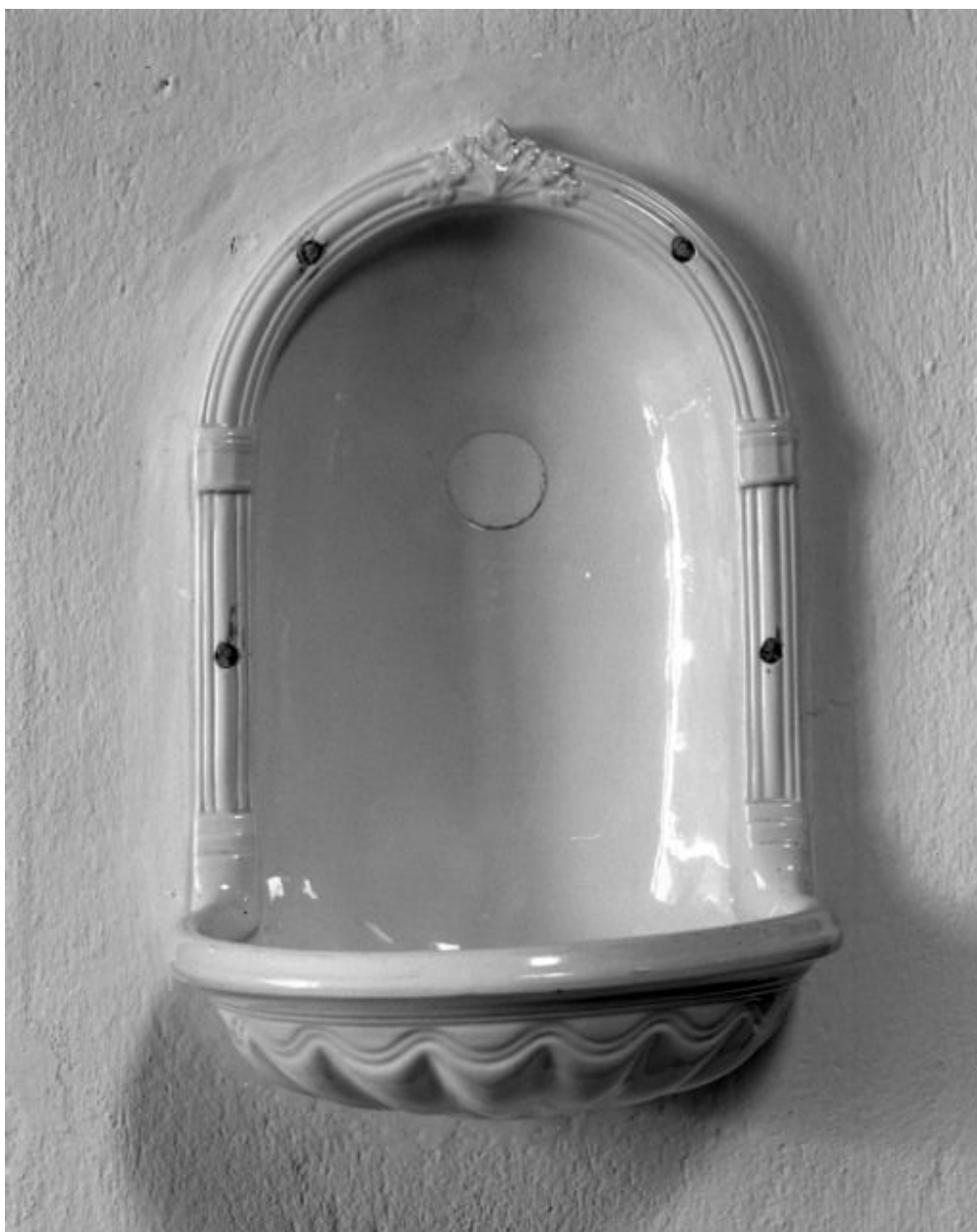
Bénitier en faïence blanche.