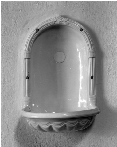
Bénitier en faïence blanche. IVR26_20017101136X