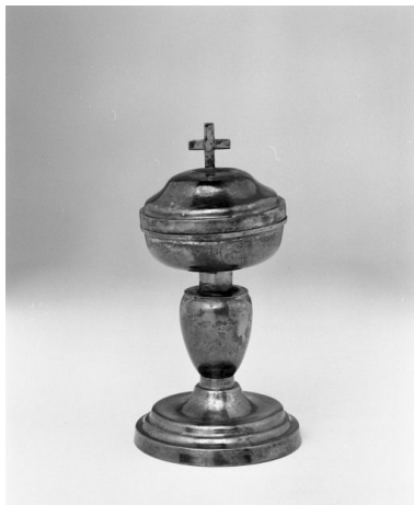
Ciboire-chrismatoire.