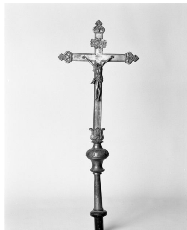
Croix de procession.