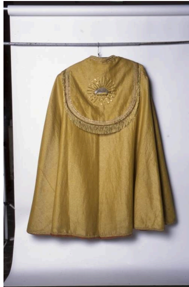
Chape dorée. IVR26_20017101129ZA