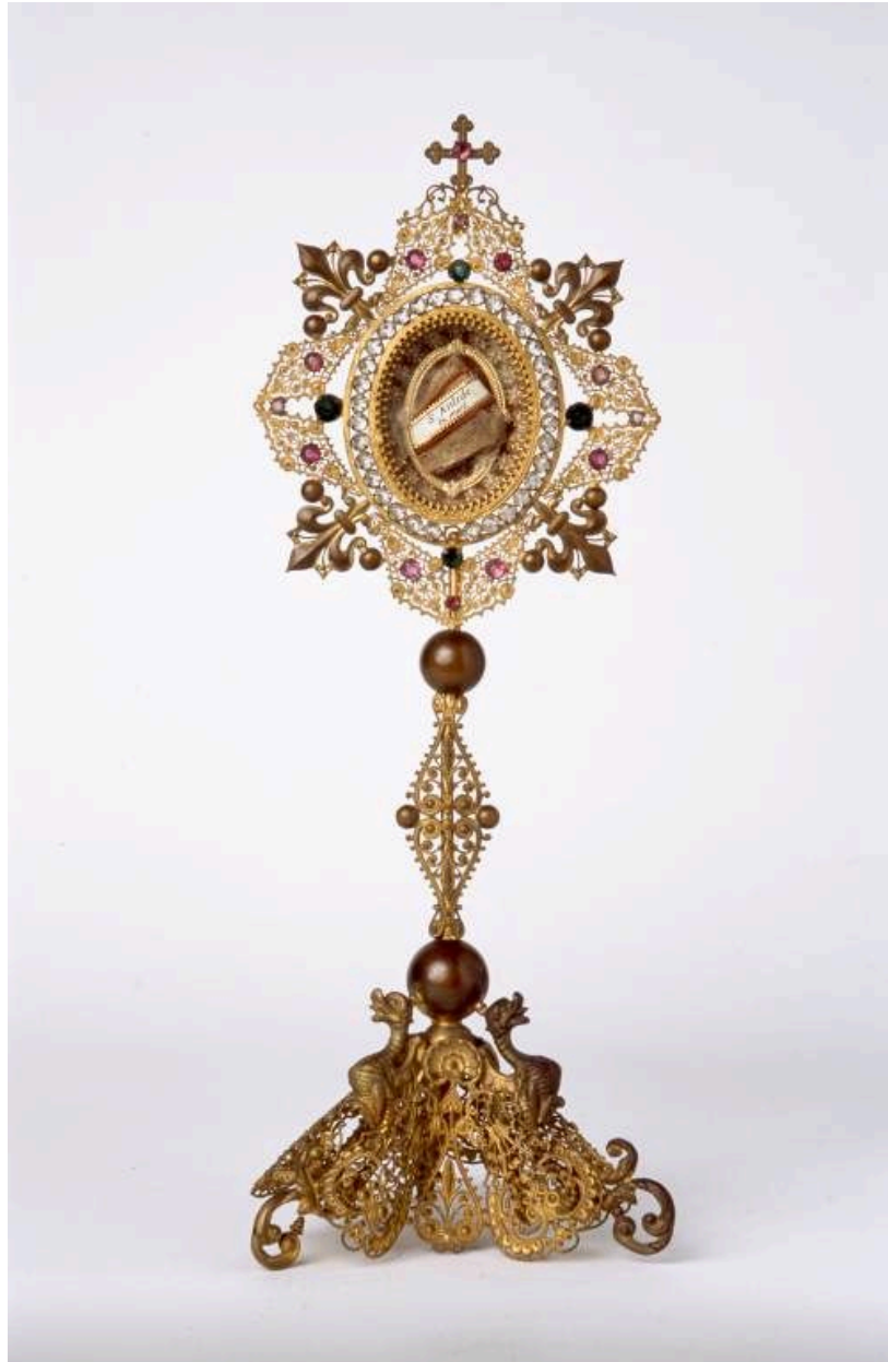
Reliquaire de saint Antide.