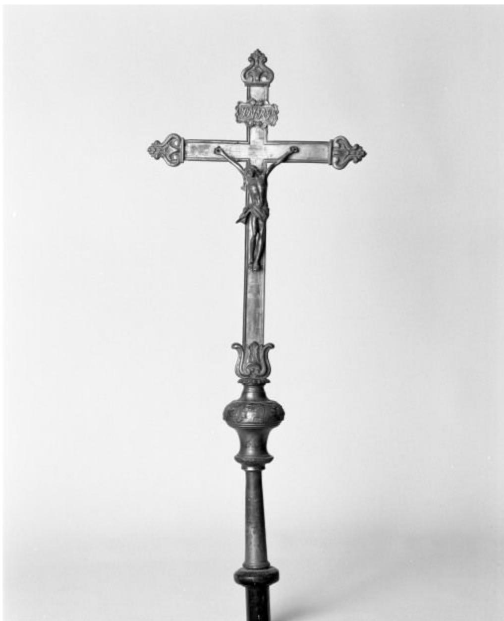
Croix de procession.