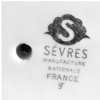
Marque de la Manufacture de Sèvres.