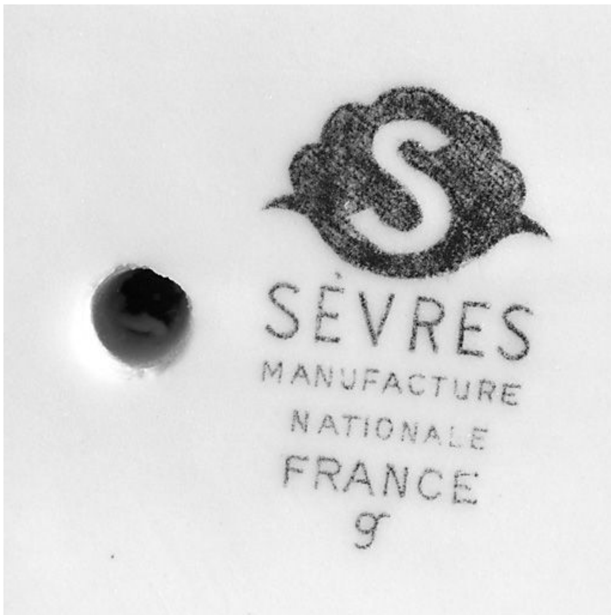
Marque de la Manufacture de Sèvres.