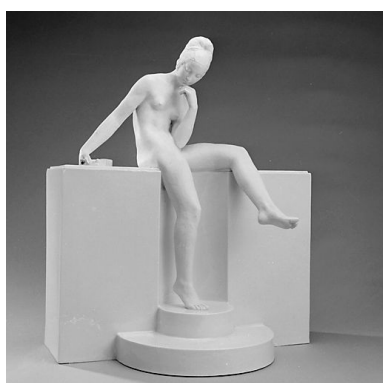
Vue d'ensemble. IVR43_20023900161X