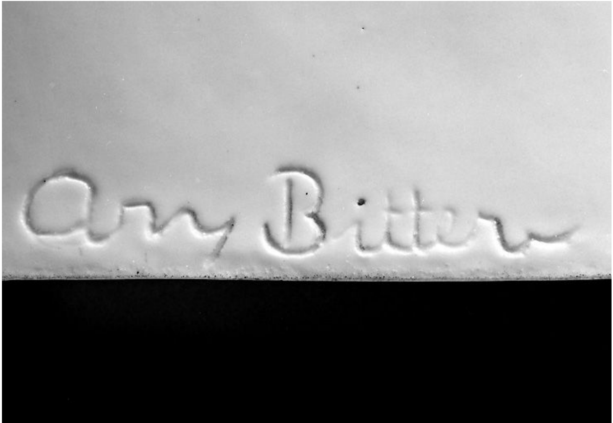
Signature du sculpteur Ary Bitter.