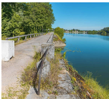
Pont sur la Roie de Droux. IVR26_20217100263NUC4A