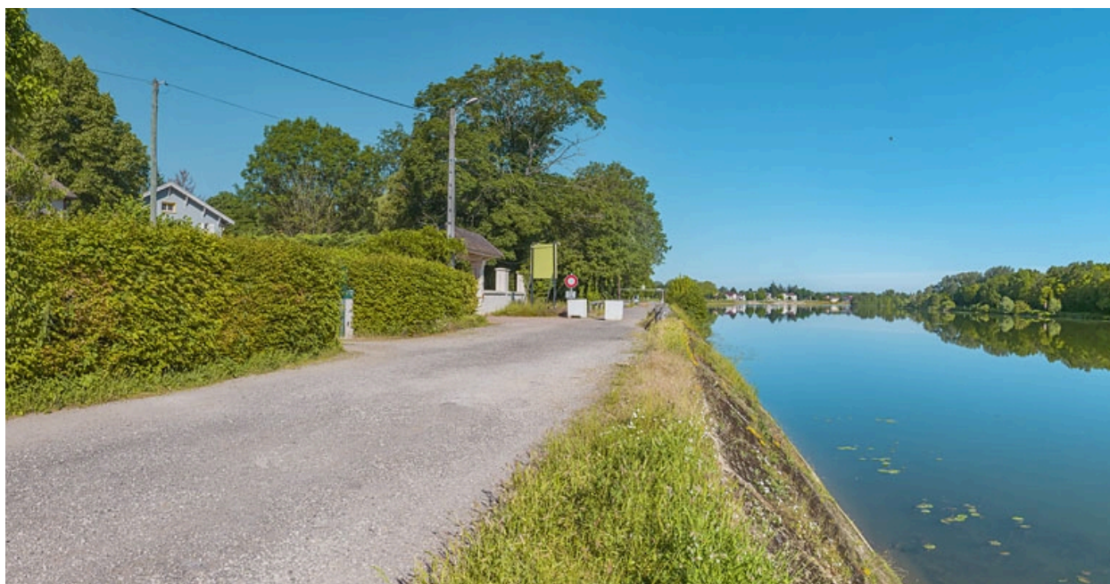
Extrémité aval du quai avec le pont sur la Roie de Droux.