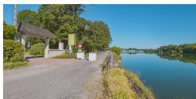
Extrémité aval du quai avec le pont sur la Roie de Droux. IVR26_20217100262NUC4A