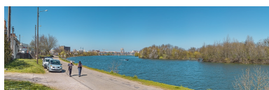
L'amont du quai avec en arrière-plan, le viaduc des Dombes. À droite, les îles de Benne-la-Faux dans la Saône. IVR26_20217100088NUC4A