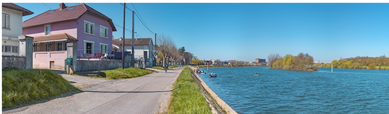
Le quai avec la rampe de mise à l'eau et ses perrés.