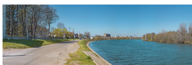
Les perrés du quai, avec en arrière- plan, le viaduc des Dombes.