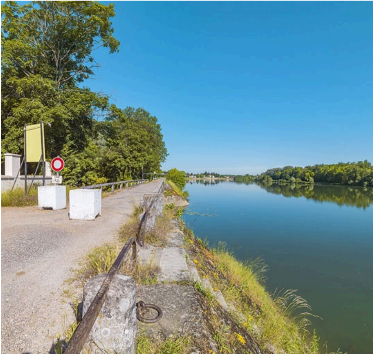
Extrémité aval du quai avec le pont sur la Roie de Droux.