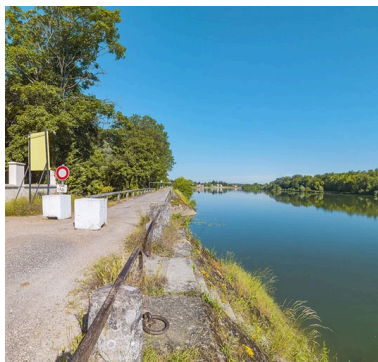
Extrémité aval du quai avec le pont sur la Roie de Droux.