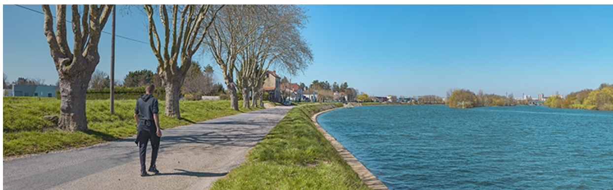
Vue d'ensemble du quai.