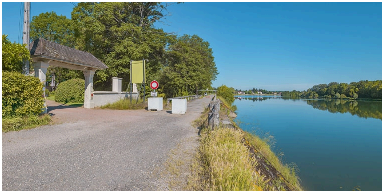
Extrémité aval du quai avec le pont sur la Roie de Droux.