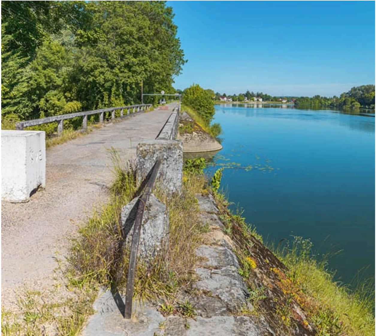
Pont sur la Roie de Droux.