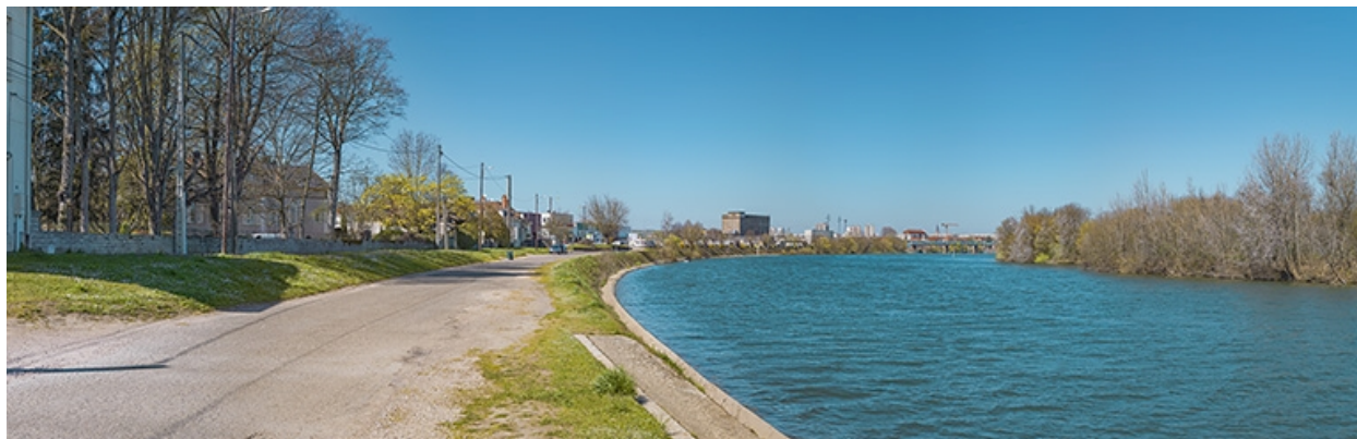
Les perrés du quai, avec en arrière-plan, le viaduc des Dombes.