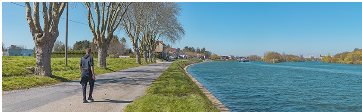
Le quai Bellevue et les îles de Benne-la-Faux.