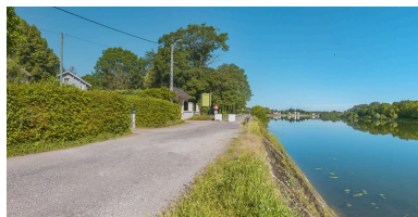
Extrémité aval du quai avec le pont sur la Roie de Droux.