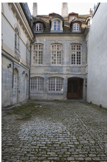
Vue du logis en fond de cour, de face.