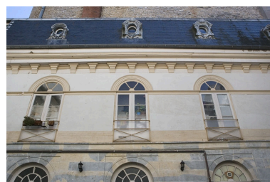
Détail du premier étage de l'aile sur cour. IVR43_20092501051NUC2A