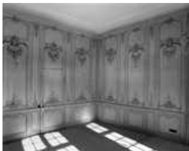
Logis sur cour, intérieur : vue des lambris du salon, de trois quarts.

IVR43_20032500069X