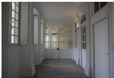
Vue d'ensemble du vestibule. IVR43_20092501049NUC2A