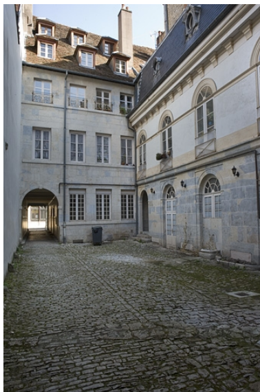
Façade postérieure du logis sur rue et l'aile sur cour.