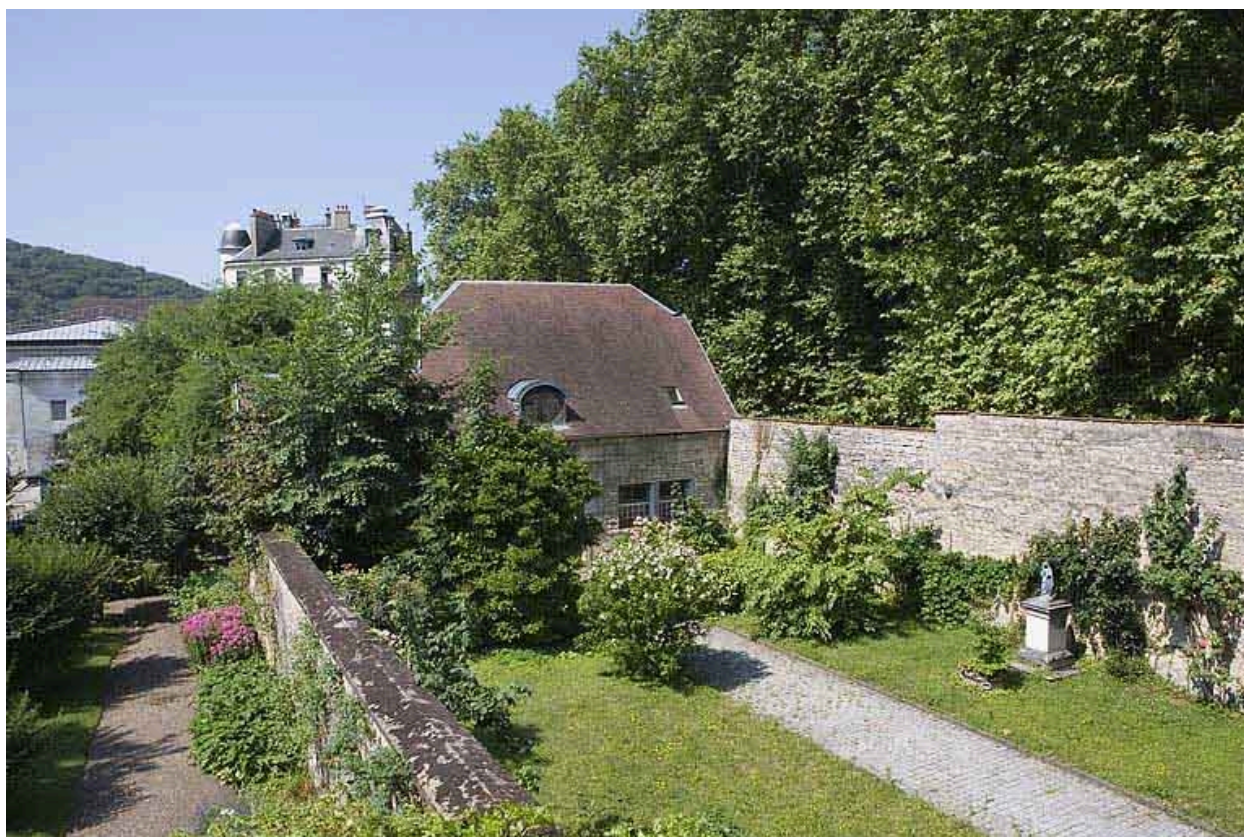
Bâtiment des remise et écurie depuis la propriété voisine.