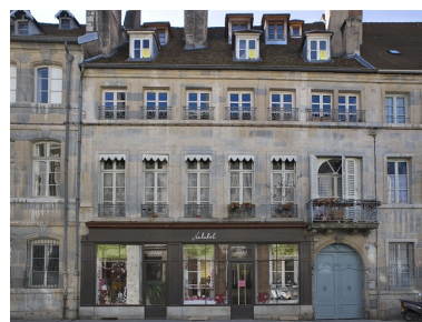
Vue d'ensemble de la façade sur rue, de face. IVR43_20092501044NUC2A