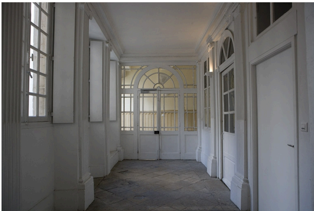
Vue d'ensemble du vestibule.