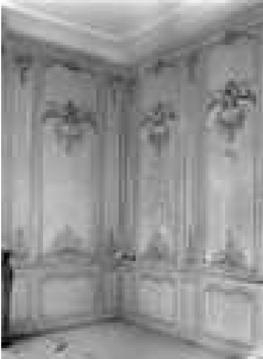
Logis sur cour, intérieur : détail d'un angle du salon.