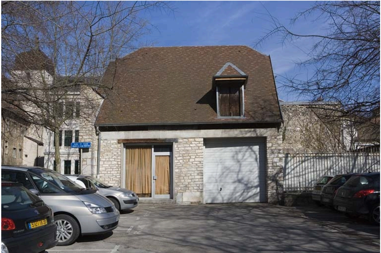
Bâtiment des remise et écurie depuis la place du Théâtre.