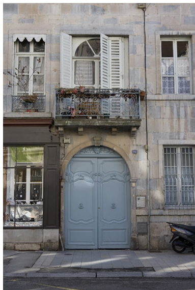
Détail du portail d'entrée.