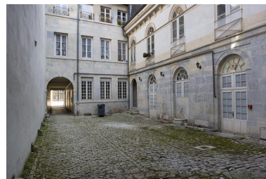
Façade postérieure du logis sur rue et aile sur cour : rez- de-chaussée et premier étage. IVR43_20092501055NUC2A