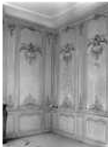
Logis sur cour, intérieur : détail d'un angle du salon.

IVR43_20032500070X