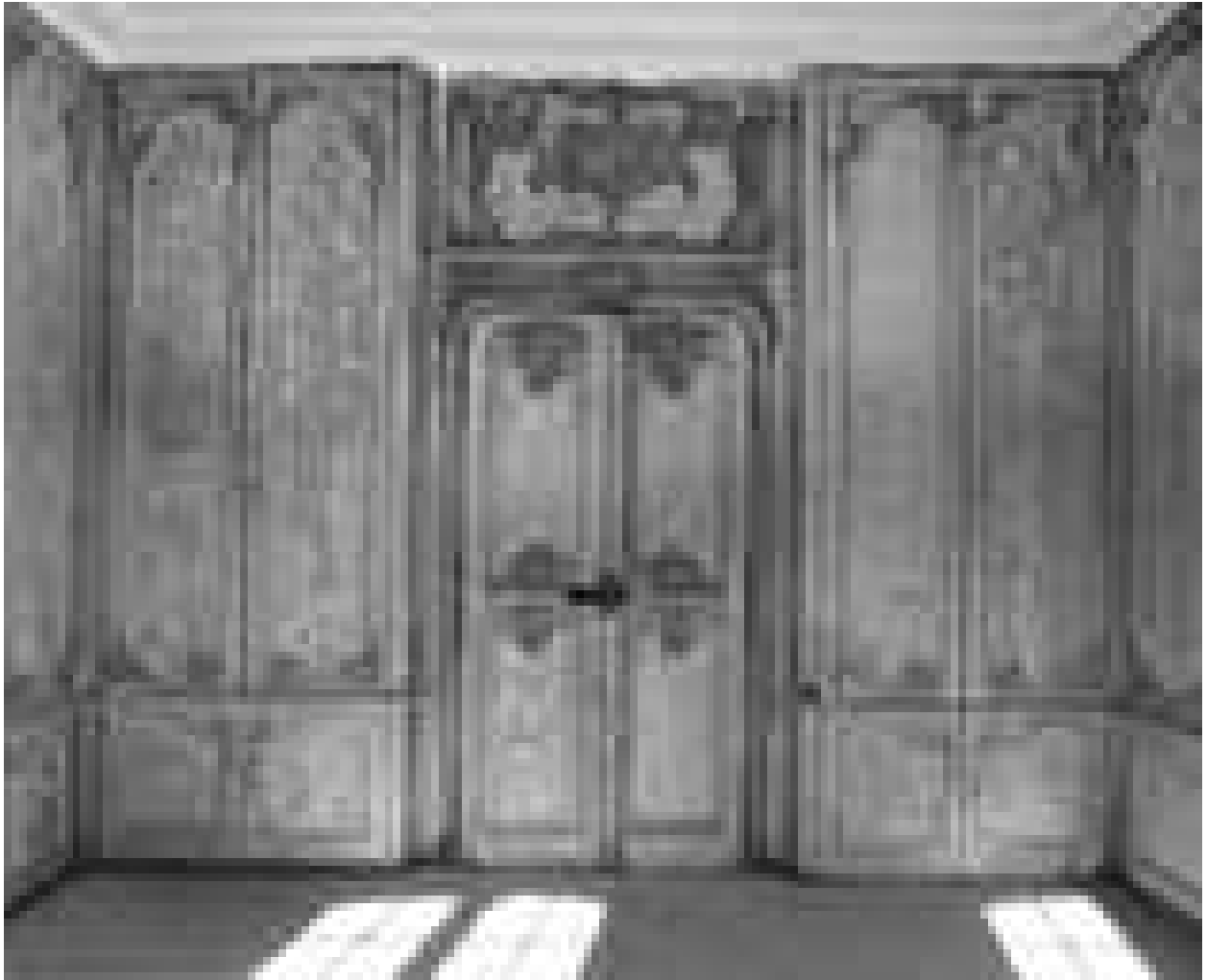
Logis sur cour, intérieur : vue d'ensemble des lambris de la bibliothèque avec la porte d'entrée.