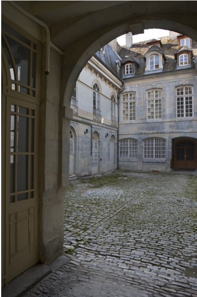
Vue des bâtiments sur cour depuis l'entrée du passage cocher.