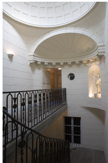
Escalier, dernier palier : détail de la demi-coupole. IVR43_20092501056NUC2A