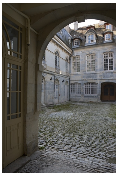
Vue des bâtiments sur cour depuis l'entrée du passage cocher. IVR43_20092501052NUC2A