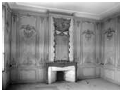
Logis sur cour, intérieur : vue d'ensemble de la cheminée du salon.

IVR43_20032500069X