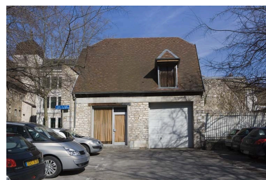
Bâtiment des remise et écurie depuis la place du Théâtre. IVR43_20092501047NUC2A