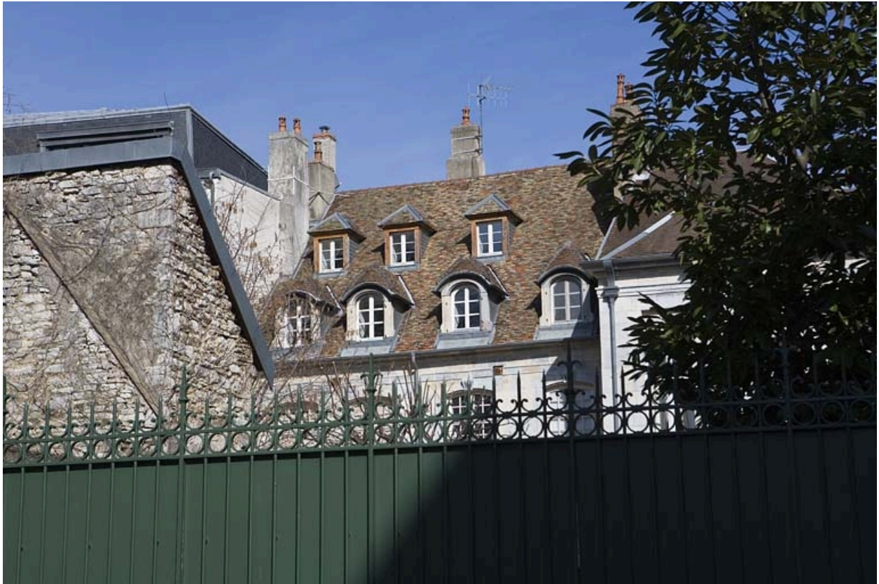
Façade postérieure depuis la place du Théâtre.