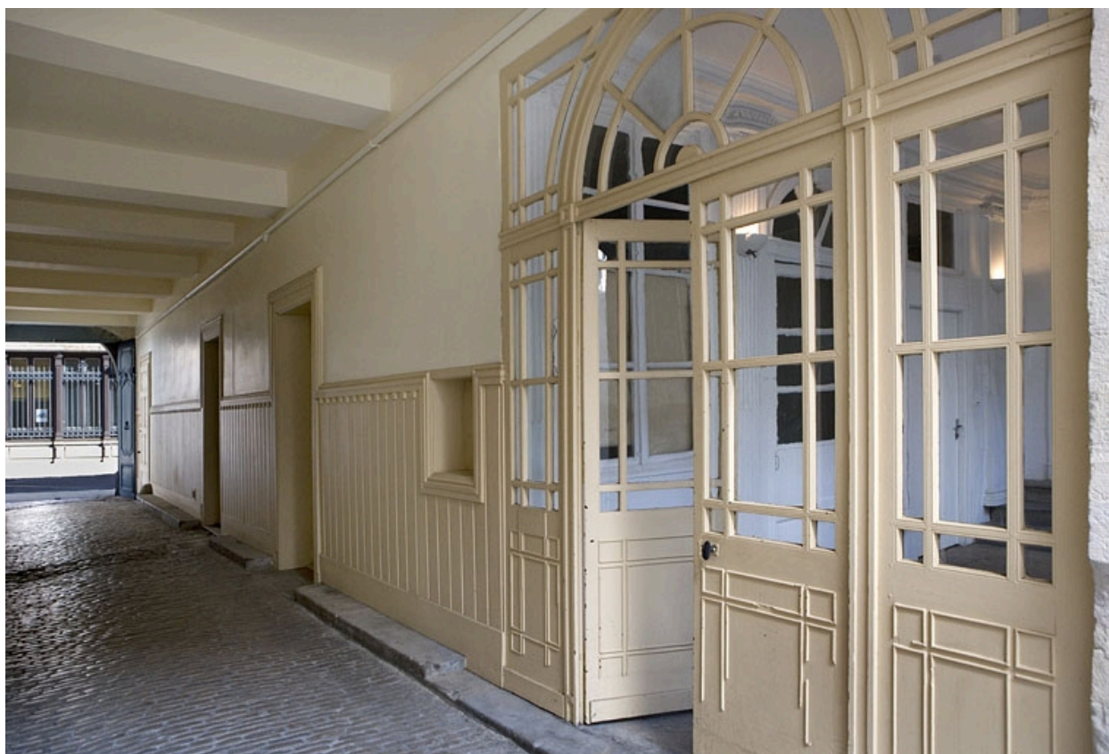
Entrée du vestibule depuis le passage cocher.