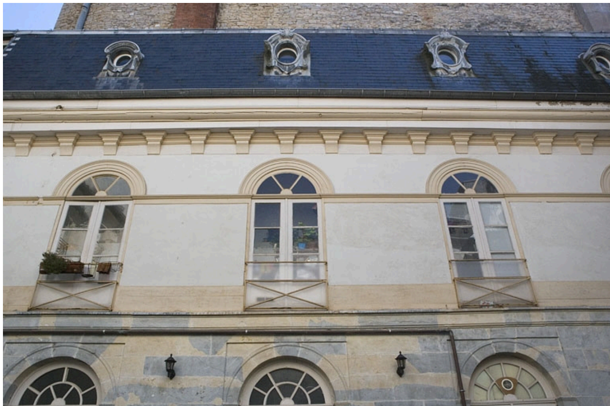
Détail du premier étage de l'aile sur cour.