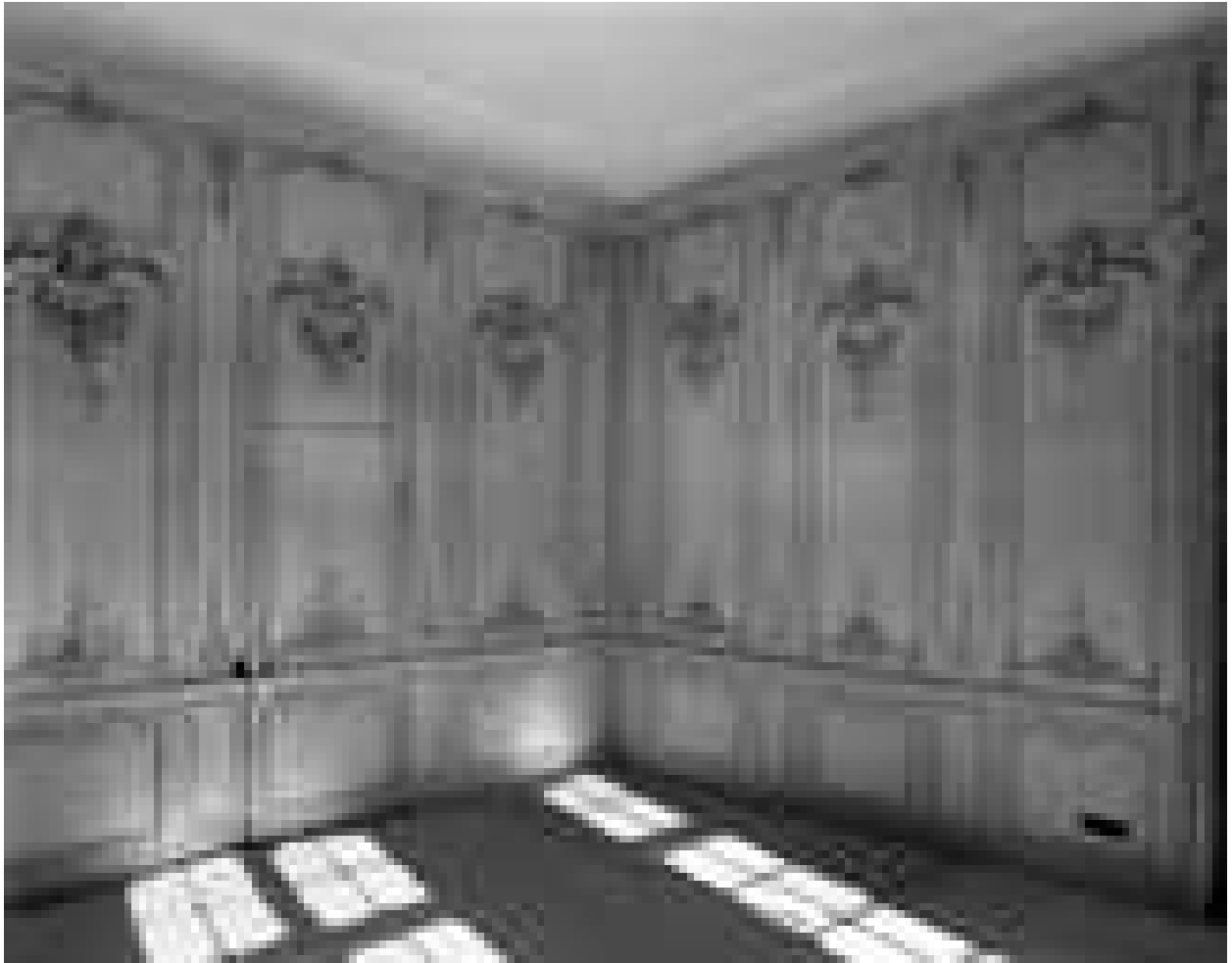
Logis sur cour, intérieur : vue des lambris du salon, de trois quarts.