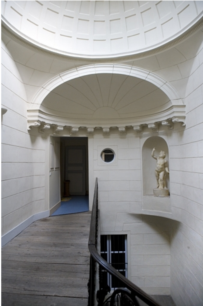
Escalier, dernier palier : détail de la demi-coupole, de face.