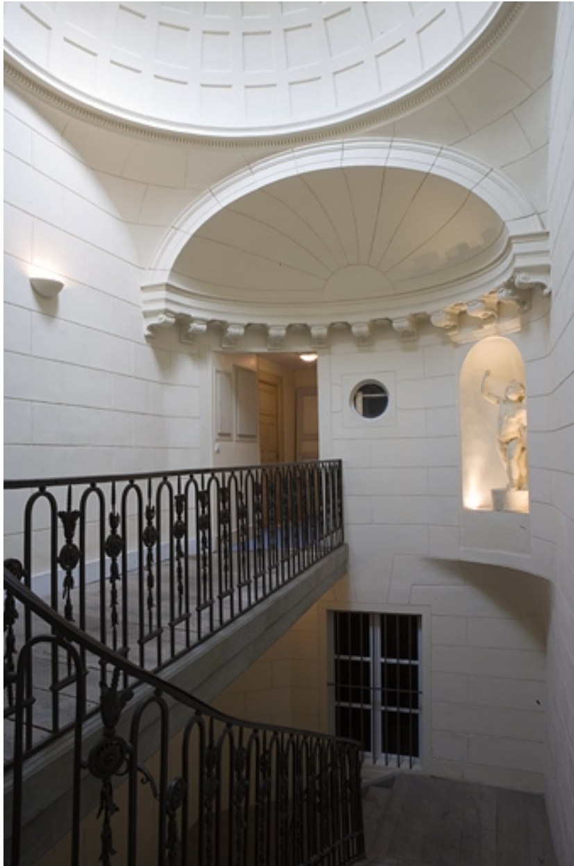
Escalier, dernier palier : détail de la demi-coupole.