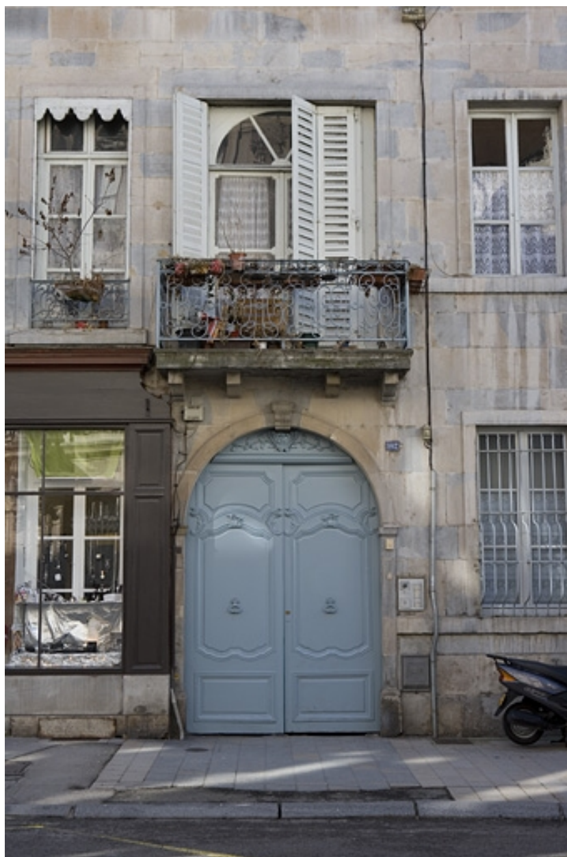
Détail du portail d'entrée.