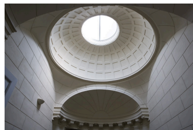
Couvrement de l'escalier : détail de la coupole et d'une demi-coupole. IVR43_20092501058NUC2A