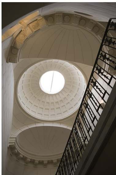
Couvrement de l'escalier : détail de la coupole et des deux demi-coupoles. IVR43_20092501059NUC2A