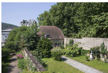
Bâtiment des remise et écurie depuis la propriété voisine.