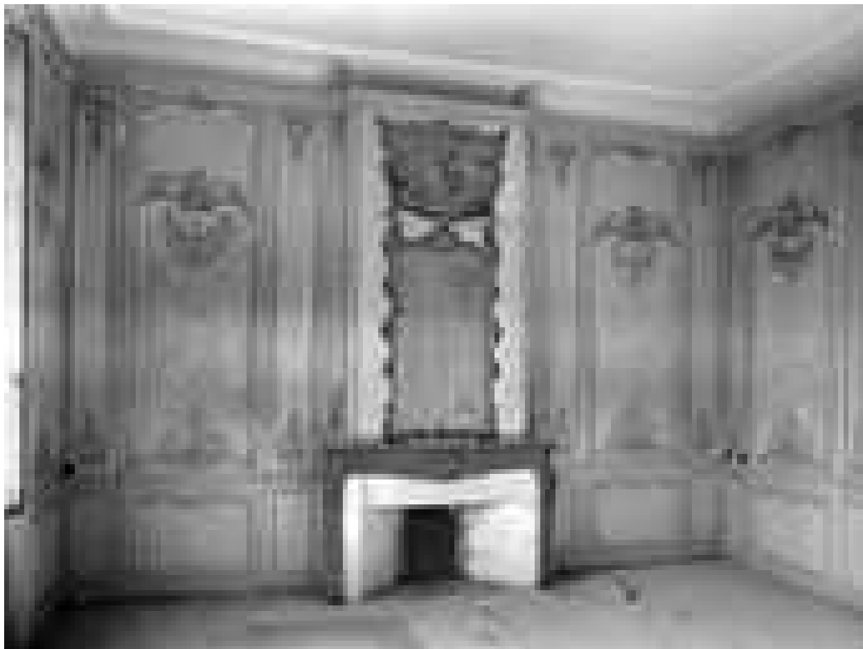
Logis sur cour, intérieur : vue d'ensemble de la cheminée du salon.