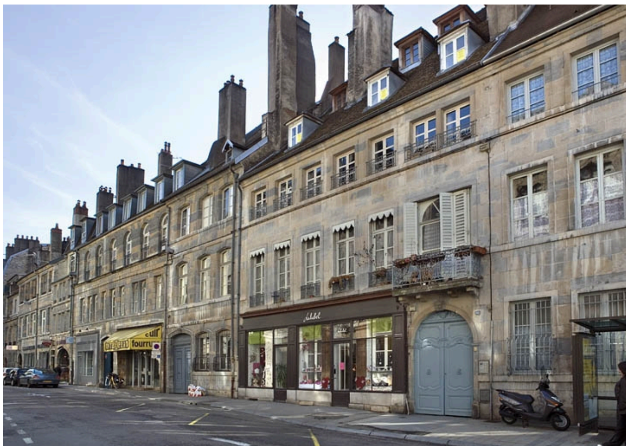
Vue d'ensemble de la façade sur rue, de trois quarts droit.