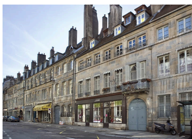
Vue d'ensemble de la façade sur rue, de trois quarts droit. IVR43_20092501045NUC2A