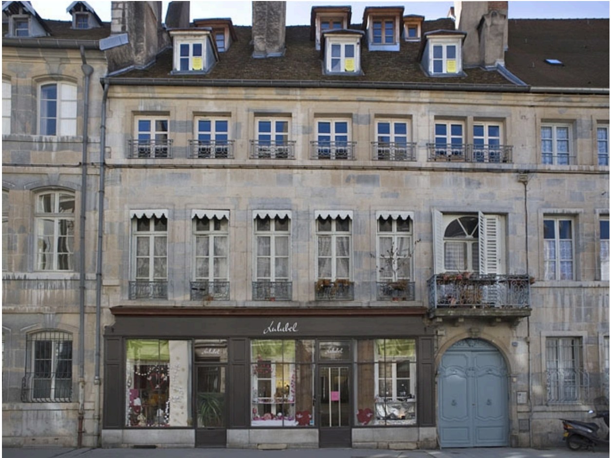
Vue d'ensemble de la façade sur rue, de face.