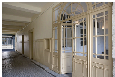
Entrée du vestibule depuis le passage cocher.