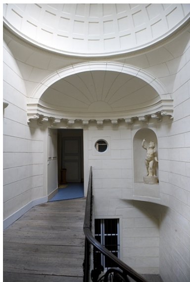
Escalier, dernier palier : détail de la demi-coupole, de face. IVR43_20092501057NUC2A