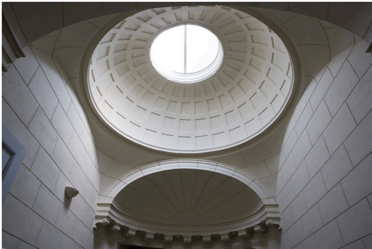
Couvrement de l'escalier : détail de la coupole et d'une demi-coupole.