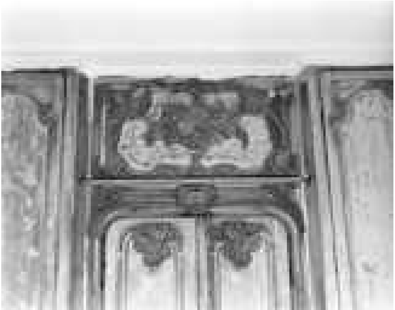
Logis sur cour, intérieur : lambris de la bibliothèque, détail du dessus de porte.