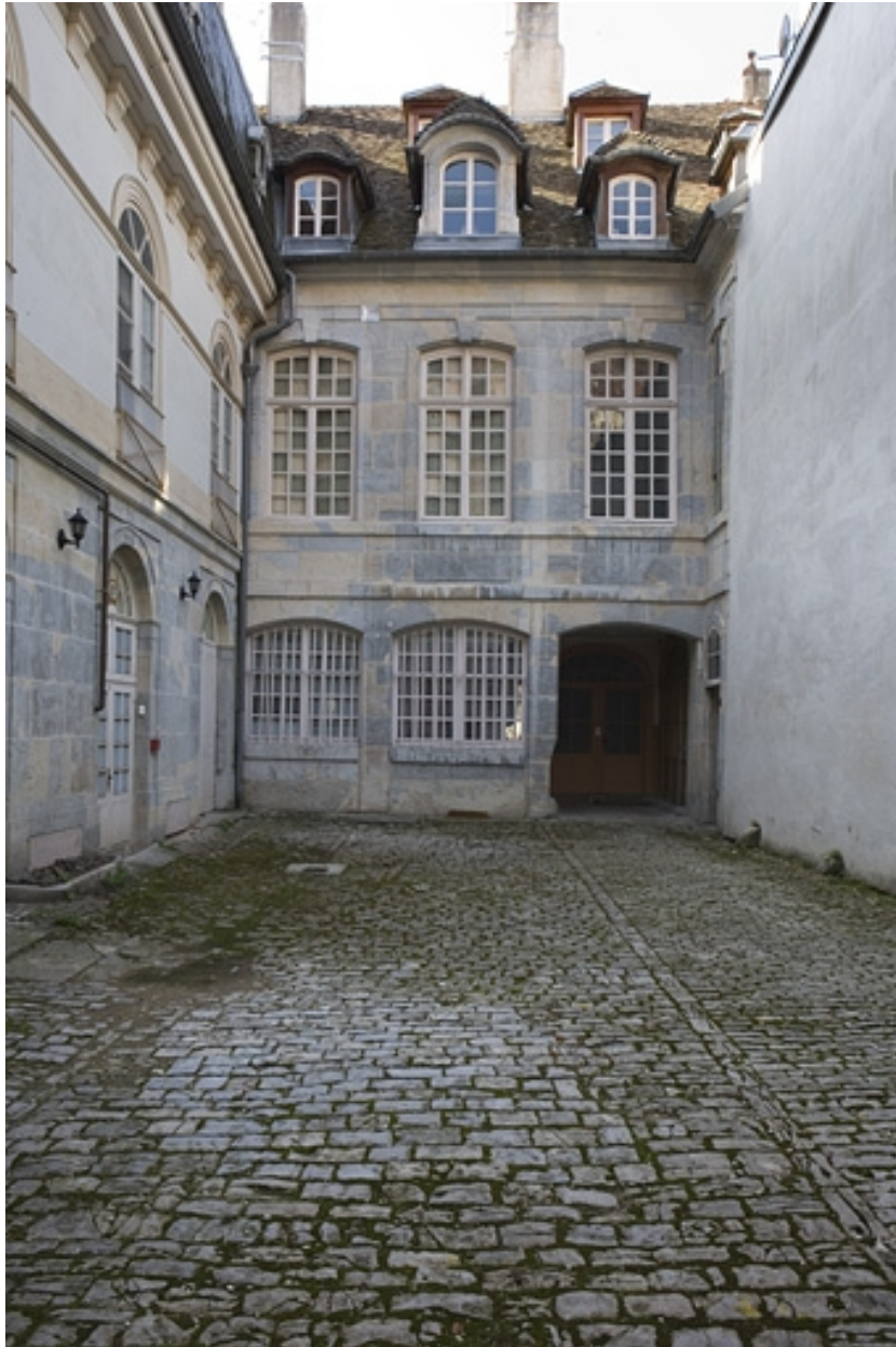
Vue du logis en fond de cour, de face.