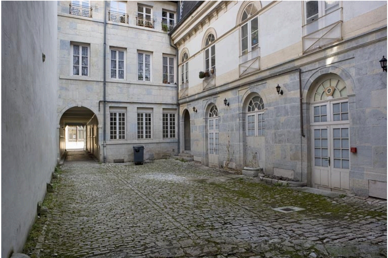
Façade postérieure du logis sur rue et aile sur cour : rez-de-chaussée et premier étage.