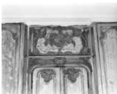
Logis sur cour, intérieur : lambris de la bibliothèque, détail du dessus de porte.

IVR43_20032500066X