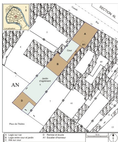
Plan masse et de situation. Extrait du plan cadastral, 1974, section AN. Dess. André Céréza