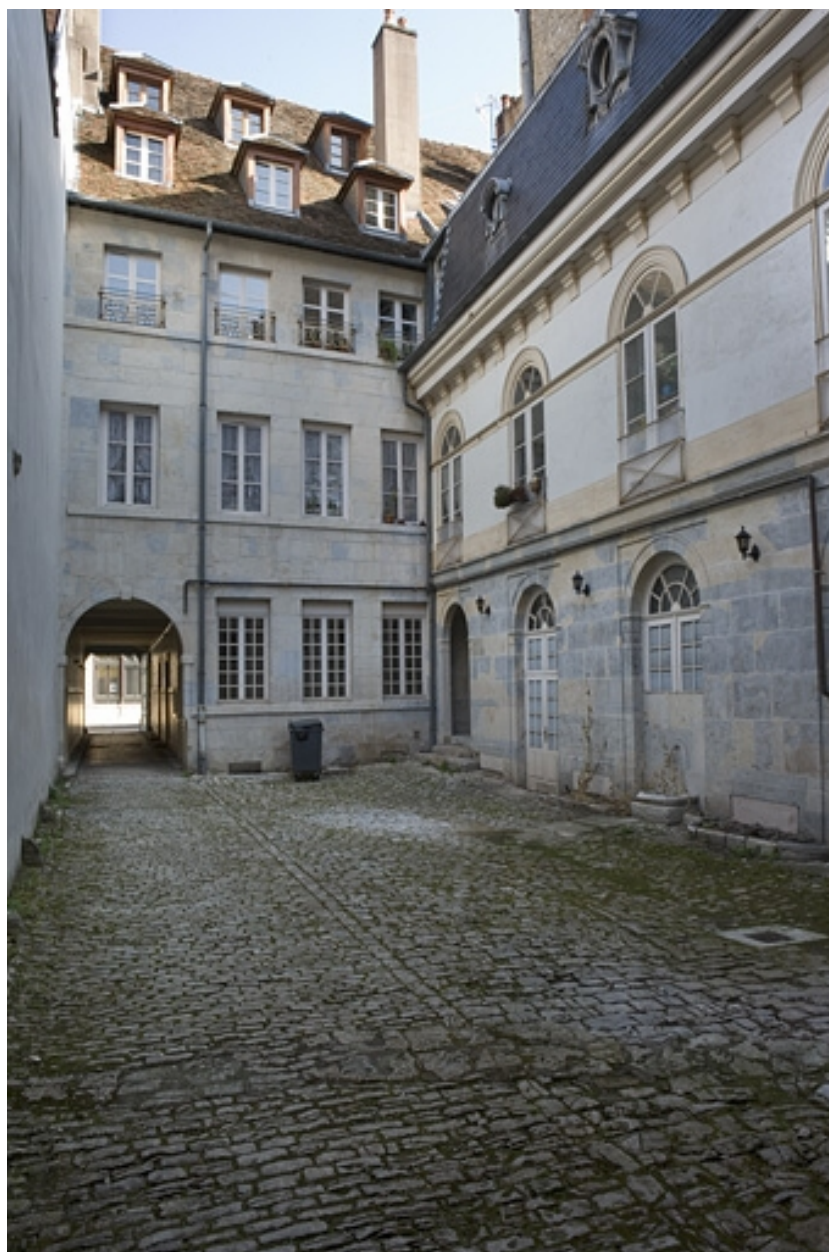
Façade postérieure du logis sur rue et l'aile sur cour.