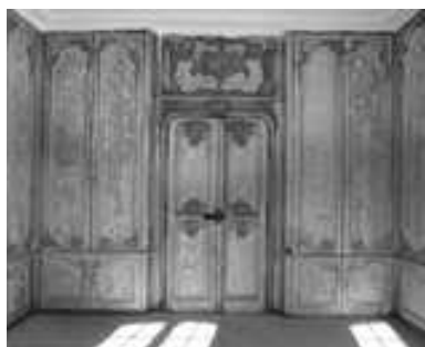
Logis sur cour, intérieur : vue d'ensemble des lambris de la bibliothèque avec la porte d'entrée.

IVR43_20032500068X