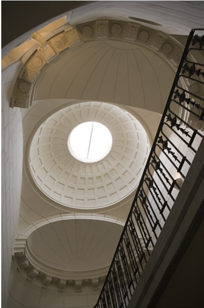
Couvrement de l'escalier : détail de la coupole et des deux demi-coupoles.