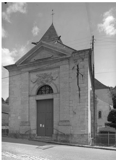
Portail. IVR26_19748900712V