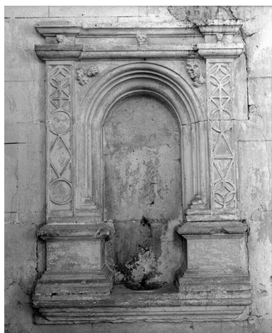
Collatéral droit, 2e travée. Lavabo encastré dans le mur droit.