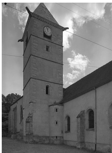
Clocher. IVR26_19748900713V