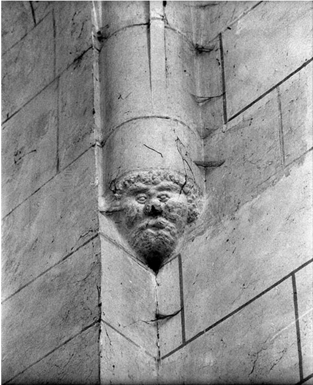
Culot décoré d'une tête en relief.