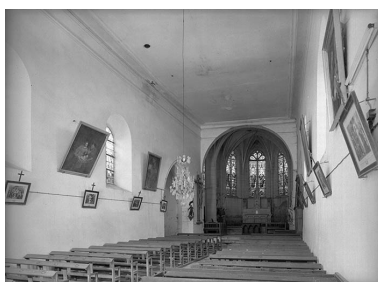
Vue intérieure vers le chœur. IVR26_19748900703V