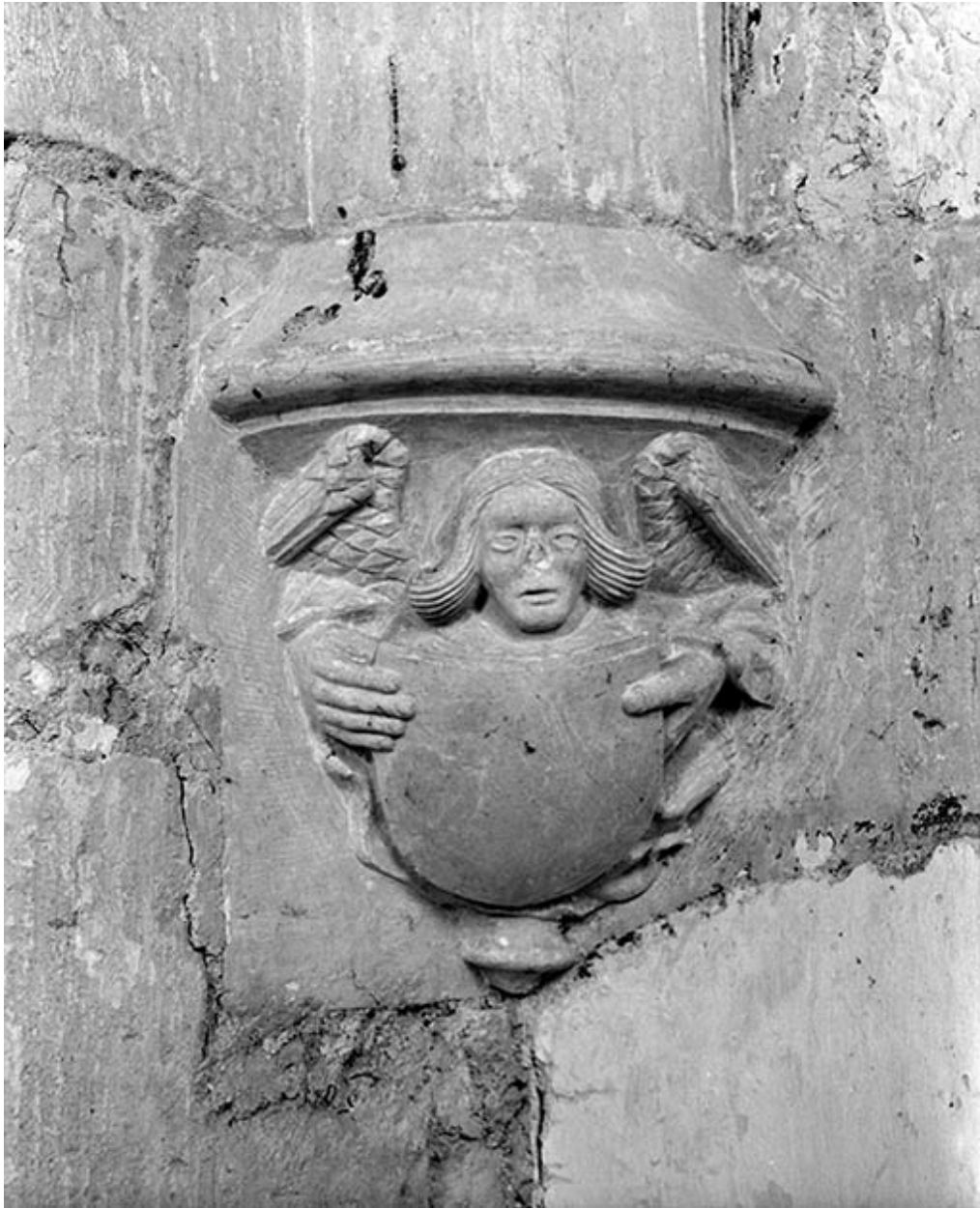
Culot décoré d'un ange porte-blason en relief.