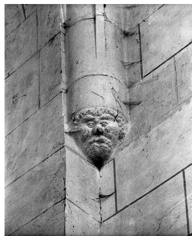
Culot décoré d'une tête en relief. IVR26_19748900709X