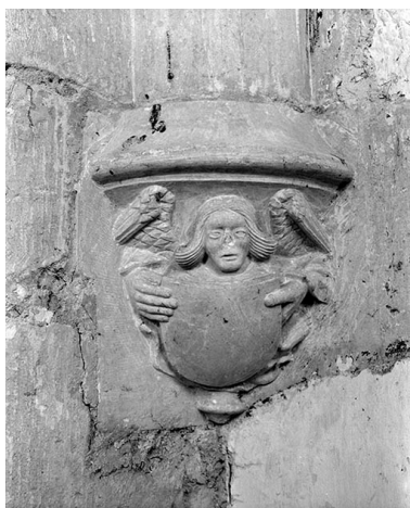
Culot décoré d'un ange porte-blason en relief. IVR26_19748900711X