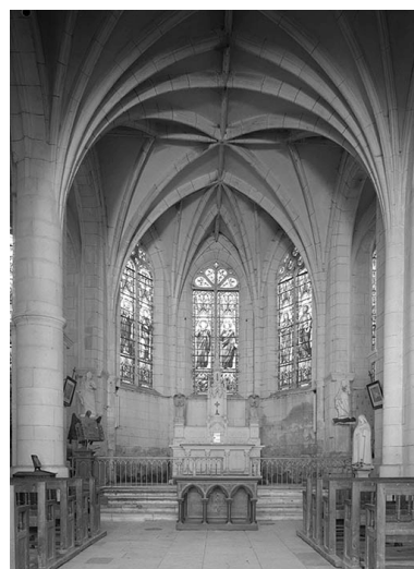
Chœur. Voûte d'ogives. IVR26_19748900704V