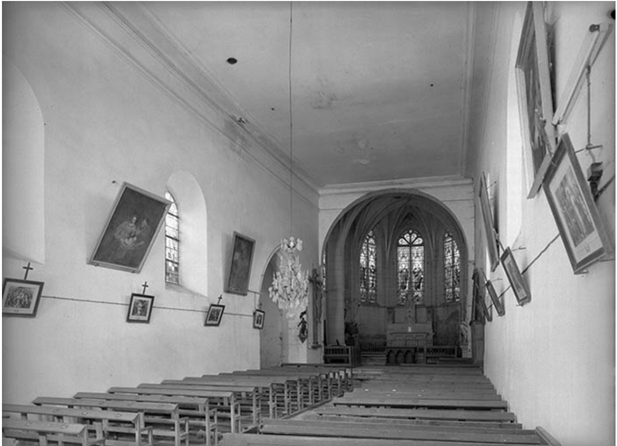
Vue intérieure vers le chœur.