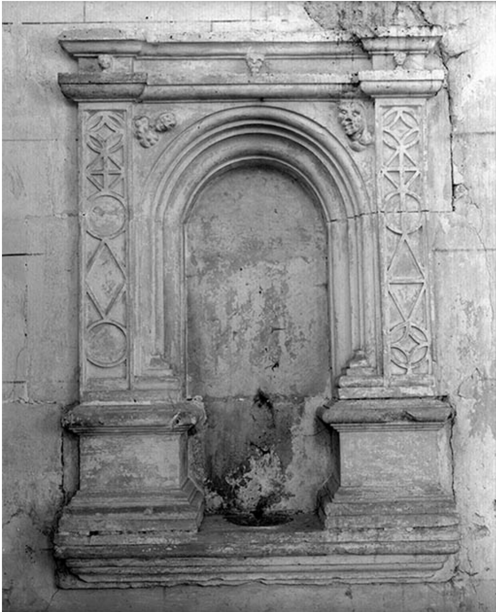
Collatéral droit, 2e travée. Lavabo encastré dans le mur droit.