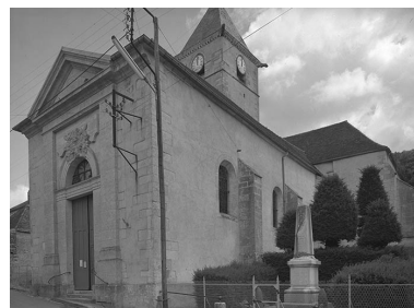
Façade occidentale.