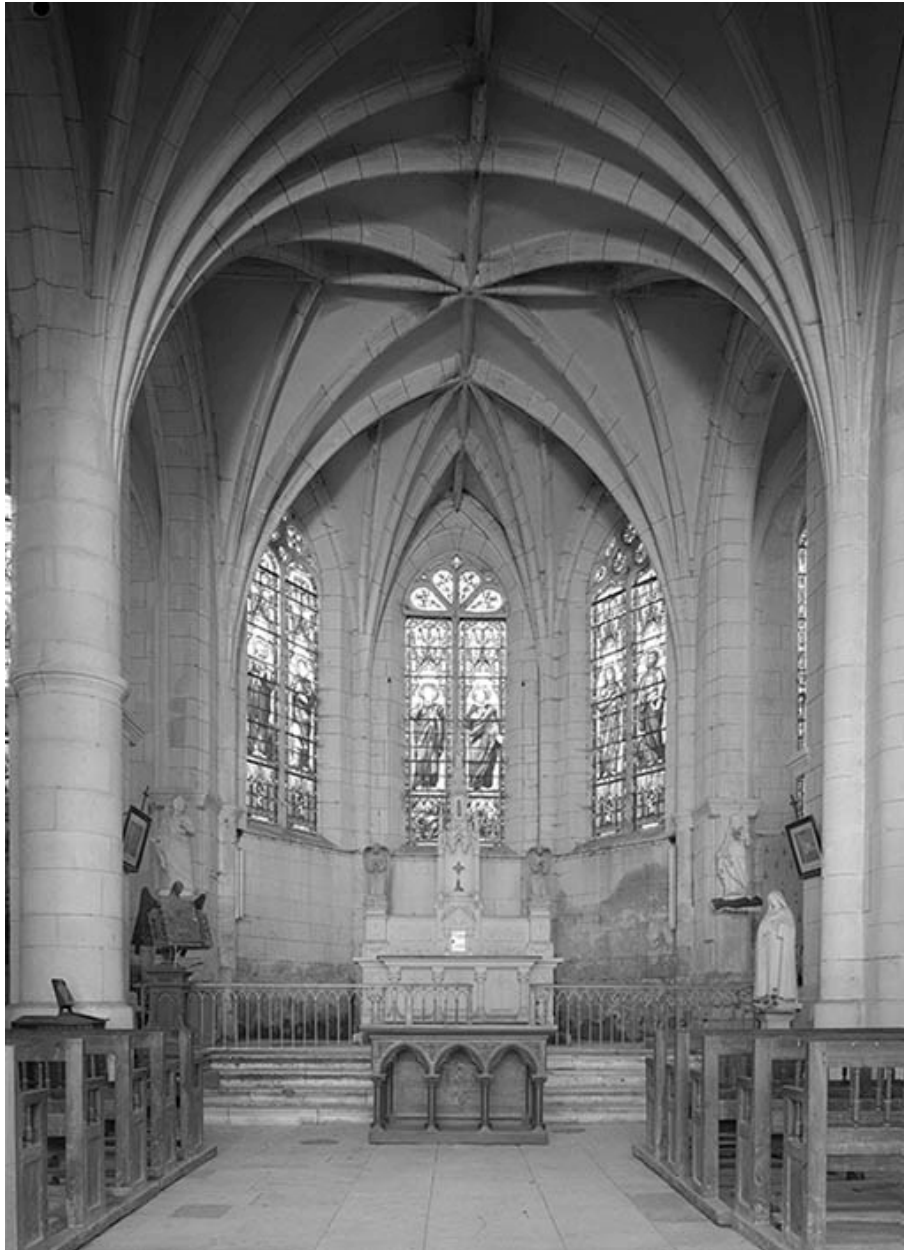
Choeur. Voûte d'ogives.