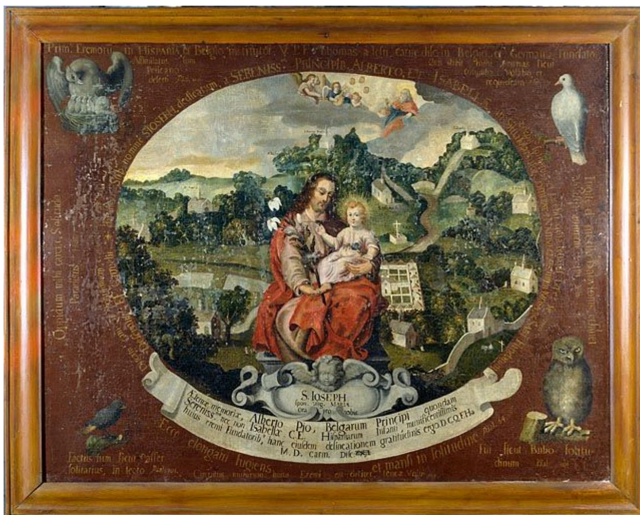
Tableau : Saint Joseph au désert de Marlagne (Crans, église Saint-Antoine-de-Padoue).