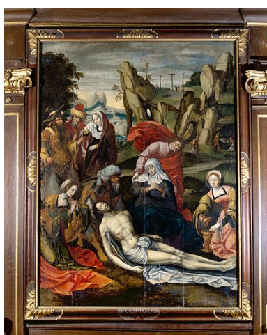
Tableau : la Déposition de croix (Foucherans, église paroissiale Saint-Martin).