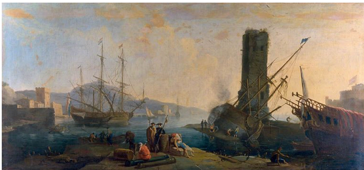
Tableau : vue d'un port (Besançon, rectorat de l'académie)