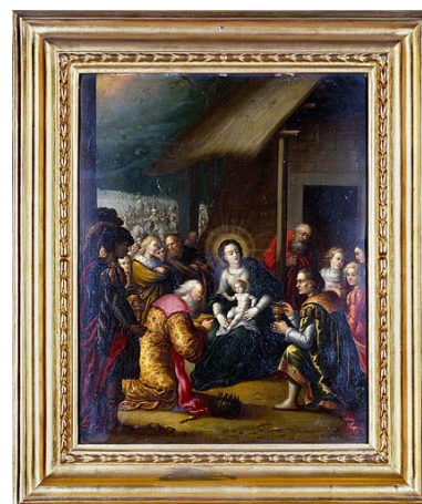
Tableau : l'Adoration des Mages (Besançon, rectorat de l'académie).