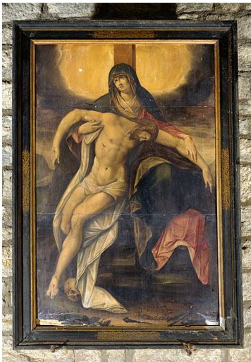
Tableau : Vierge de Pitié (Salins-les-Bains, église paroissiale Saint-Anatoile).