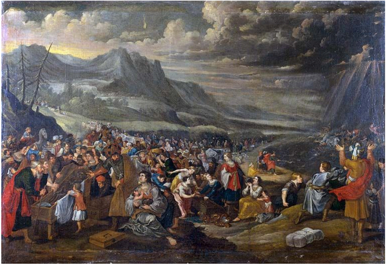
Tableau : Passage de la Mer Rouge (Besançon, rectorat de l'académie).