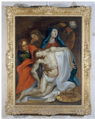
Tableau : Vierge de Pitié (Besançon, cathédrale Saint-Jean).