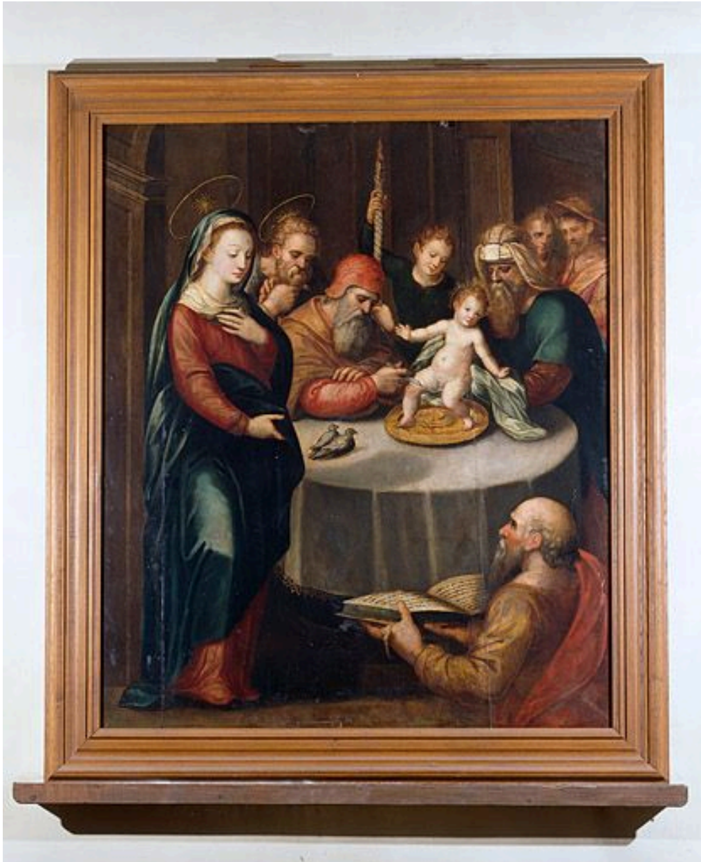
Tableau : la Circoncision (Villersexel, église paroissiale Saint-Nicolas).