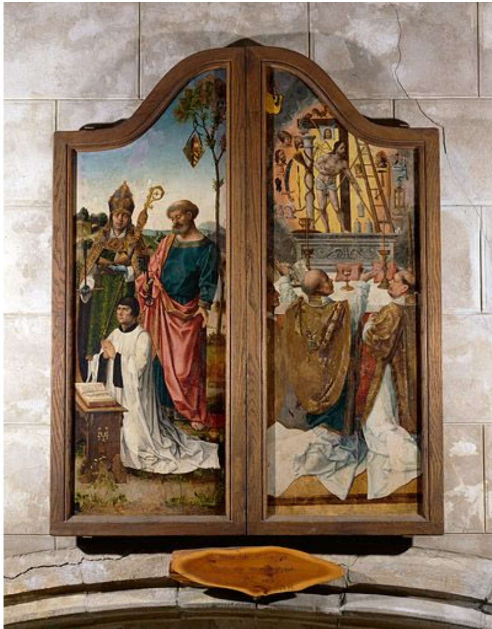
Triptyque : la messe de saint Grégoire, saints et donateur (Champagnole, église paroissiale Saint-Etienne).