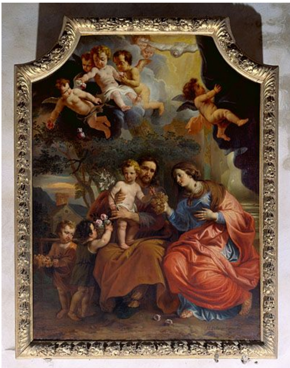
Tableau : la Sainte Famille (Besançon, église paroissiale Sainte-Madeleine).