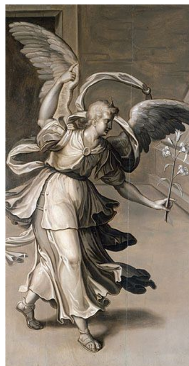
Tableau : l'Ange de l'Annonciation (Pugey, église paroissiale Saint-André).