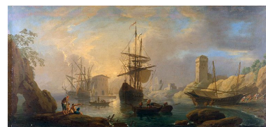
Tableau : vue d'un port (Besançon, rectorat de l'académie)