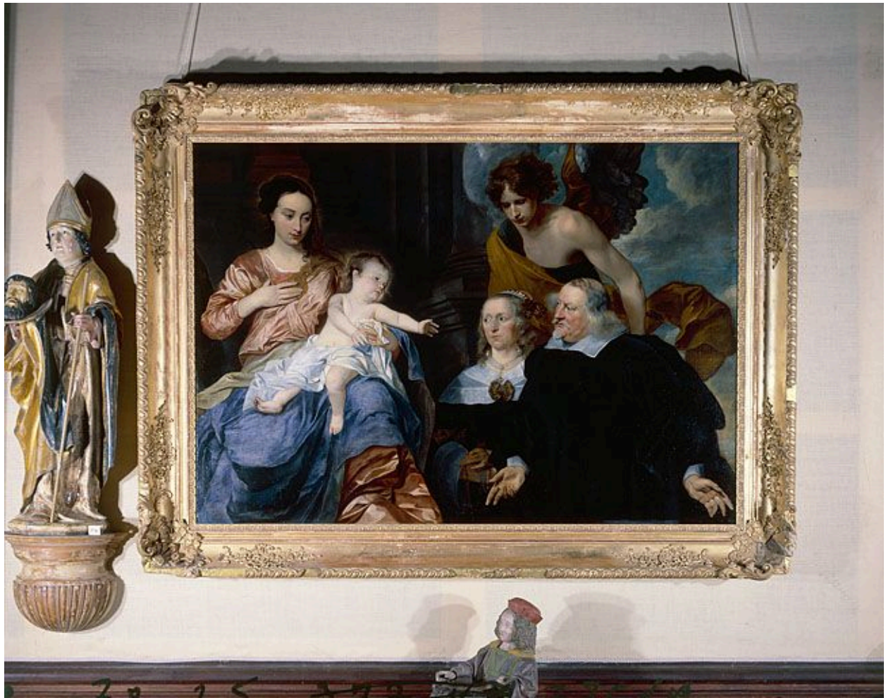
Tableau : Vierge à l'Enfant (Arc-et-Senans, église Saint-Bénigne).