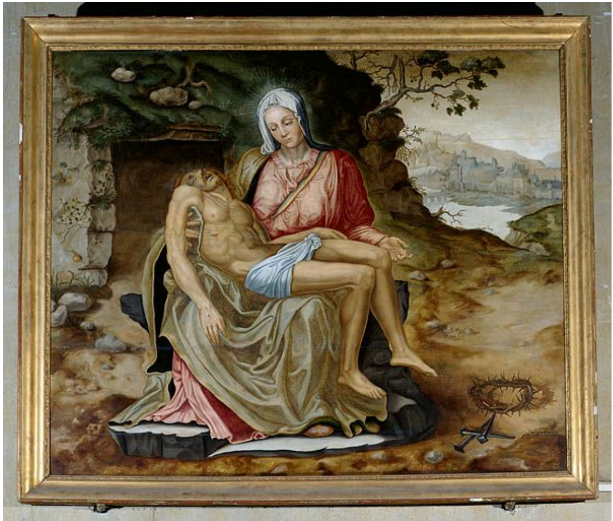
Tableau : Vierge de Pitié (Besançon, cathédrale Saint-Jean).