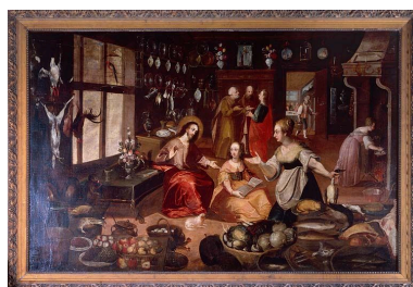
Tableau : le Christ chez Marthe et Marie (Pont-de-Roide, église paroissiale Notre-Dame).