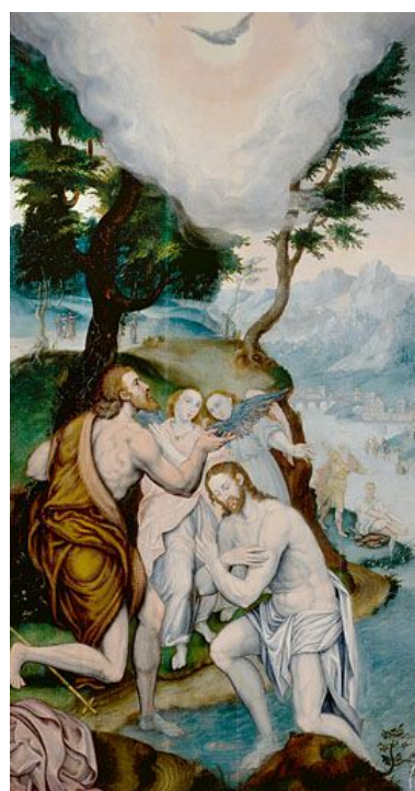
Polyptyque de la vie du Christ (Nozeroy, collégiale Saint-Antoine).