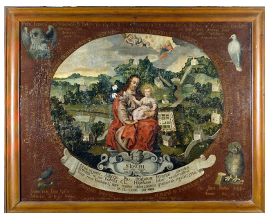
Tableau : Saint Joseph au désert de Marlagne (Crans, église Saint-Antoine-de-Padoue).