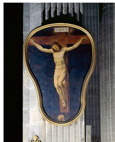
Tableau : la Crucifixion (Besançon, église paroissiale Sainte-Madeleine). IVR43_19982500092VA