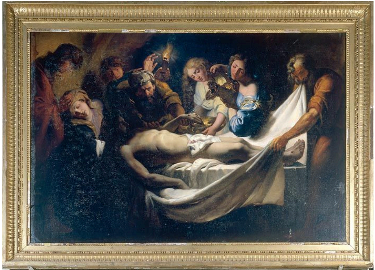
Tableau : Mise au tombeau (Arc-et-Senans, église Saint-Bénigne).