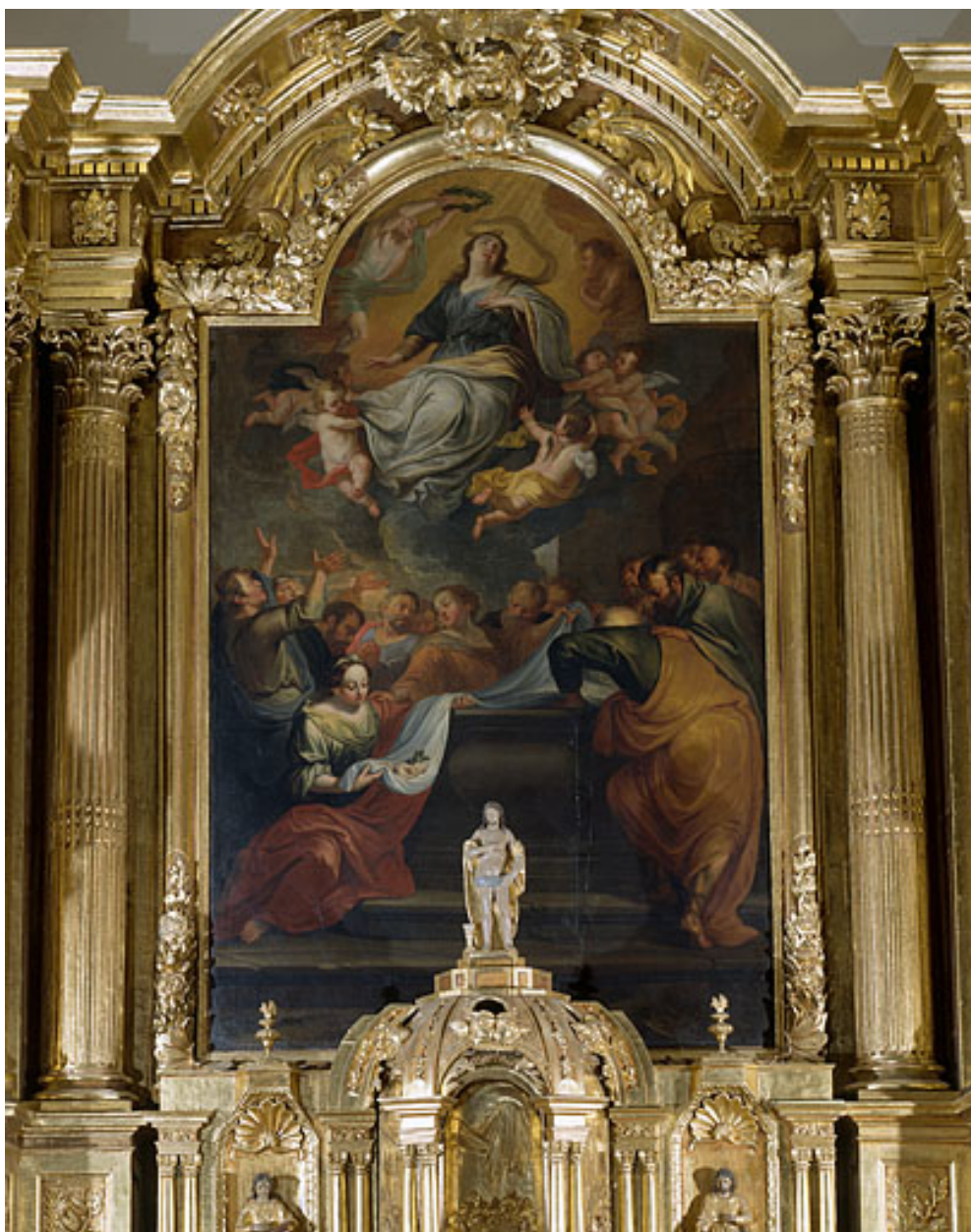
Tableau : l'Assomption de la Vierge (Gray-la-Ville, église paroissiale Saint-Maurice).