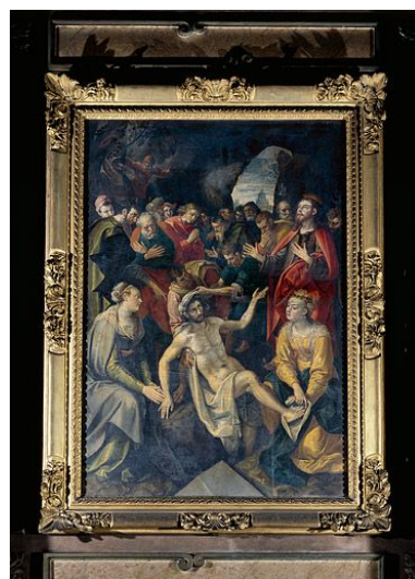
Tableau : la Résurrection de Lazare (Besançon, église Saint-Pierre).