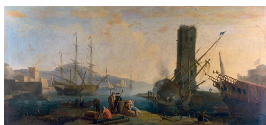
Tableau : vue d'un port (Besançon, rectorat de l'académie)