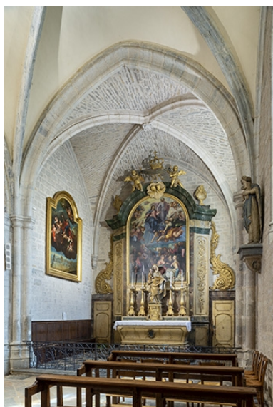
Tableau : l'Assomption et le Couronnement de la Vierge (Poligny, collégiale Saint-Hyppolite).