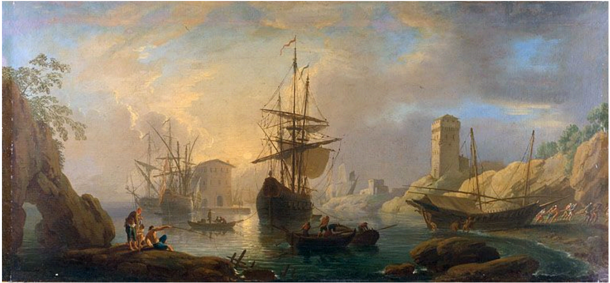
Tableau : vue d'un port (Besançon, rectorat de l'académie)