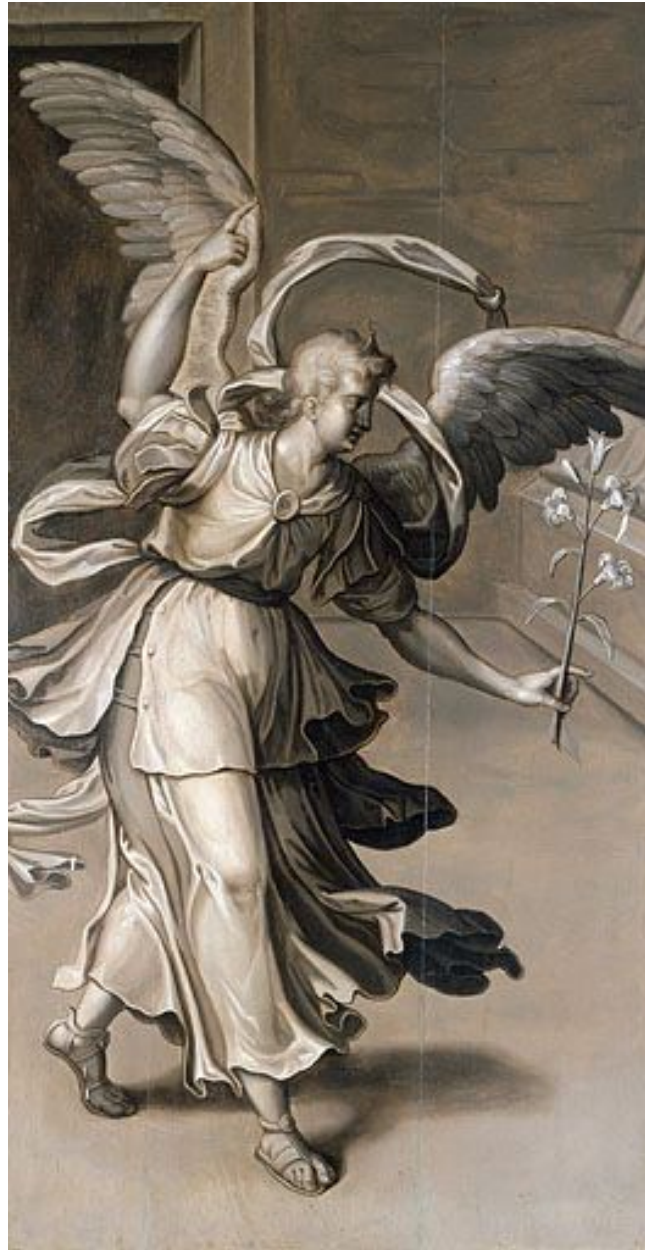
Tableau : l'Ange de l'Annonciation (Pugey, église paroissiale Saint-André).