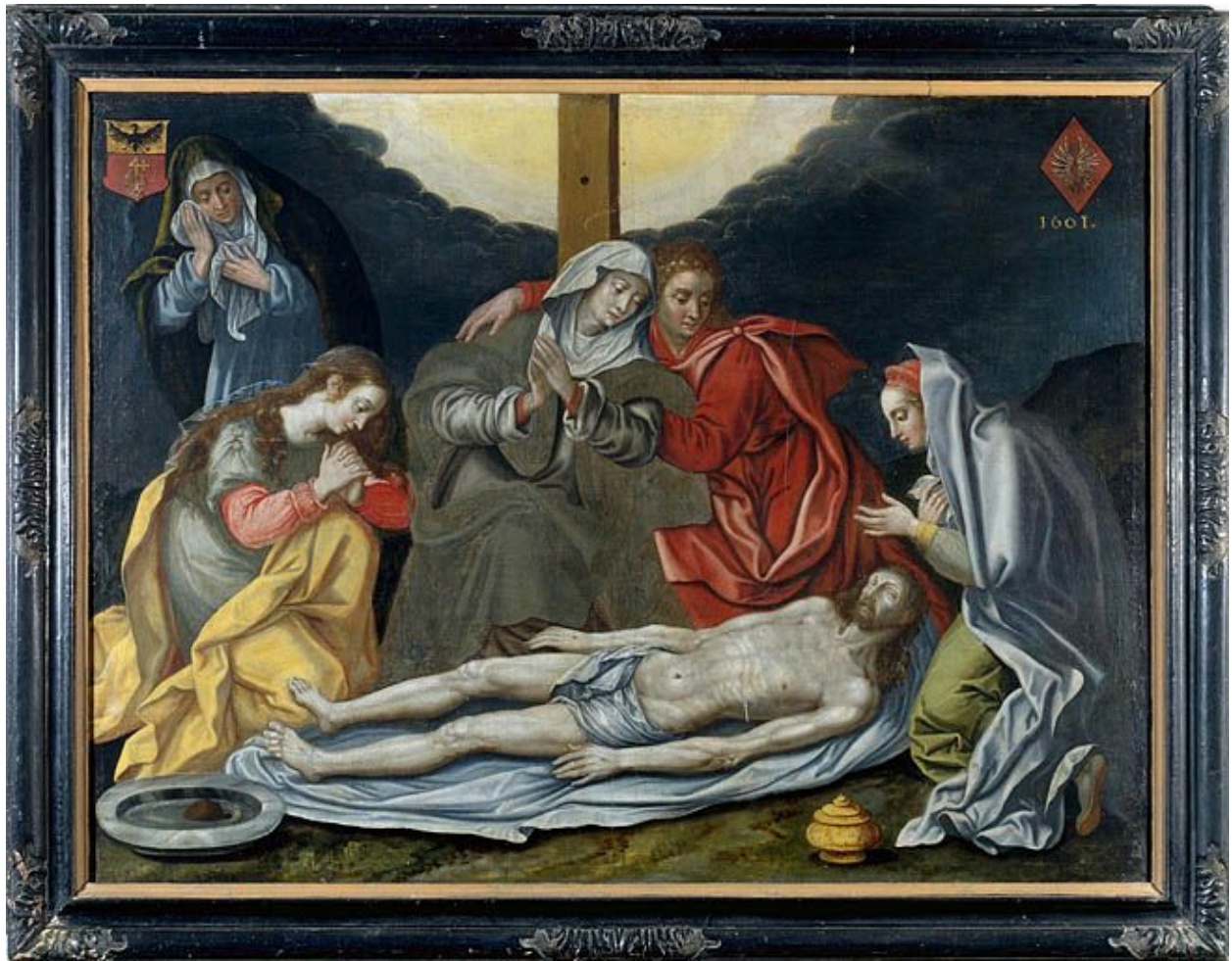
Tableau : la Déploration du Christ (Ecole-Valentin, église paroissiale Saint-Georges).