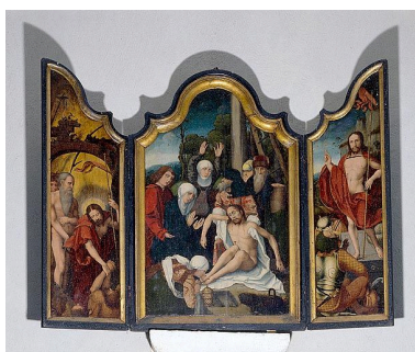
Triptyque : la Descente de croix, la Descente aux limbes, la Résurrection (Chaumergy, église paroissiale de la Nativité de la Vierge).