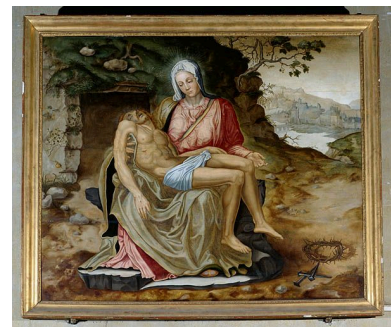
Tableau : Vierge de Pitié (Besançon, cathédrale Saint-Jean).