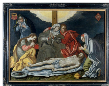
Tableau : la Déploration du Christ (Ecole-Valentin, église paroissiale Saint-Georges). IVR43_19982500108VA