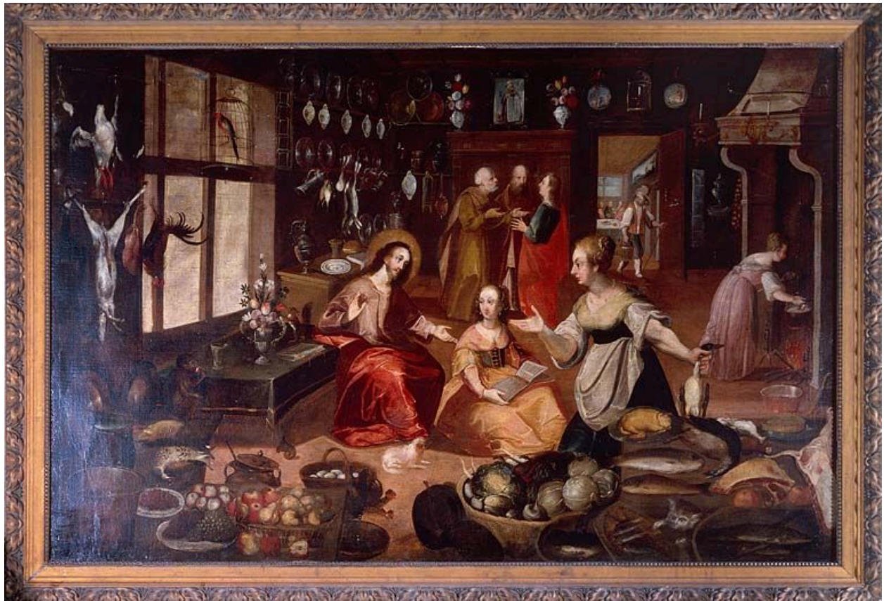
Tableau : le Christ chez Marthe et Marie (Pont-de-Roide, église paroissiale Notre-Dame).