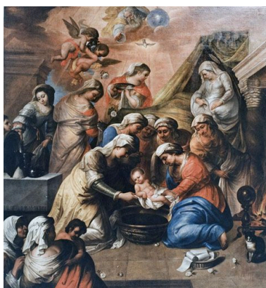
Tableau : la Nativité de la Vierge (Dole, collégiale Notre-Dame).