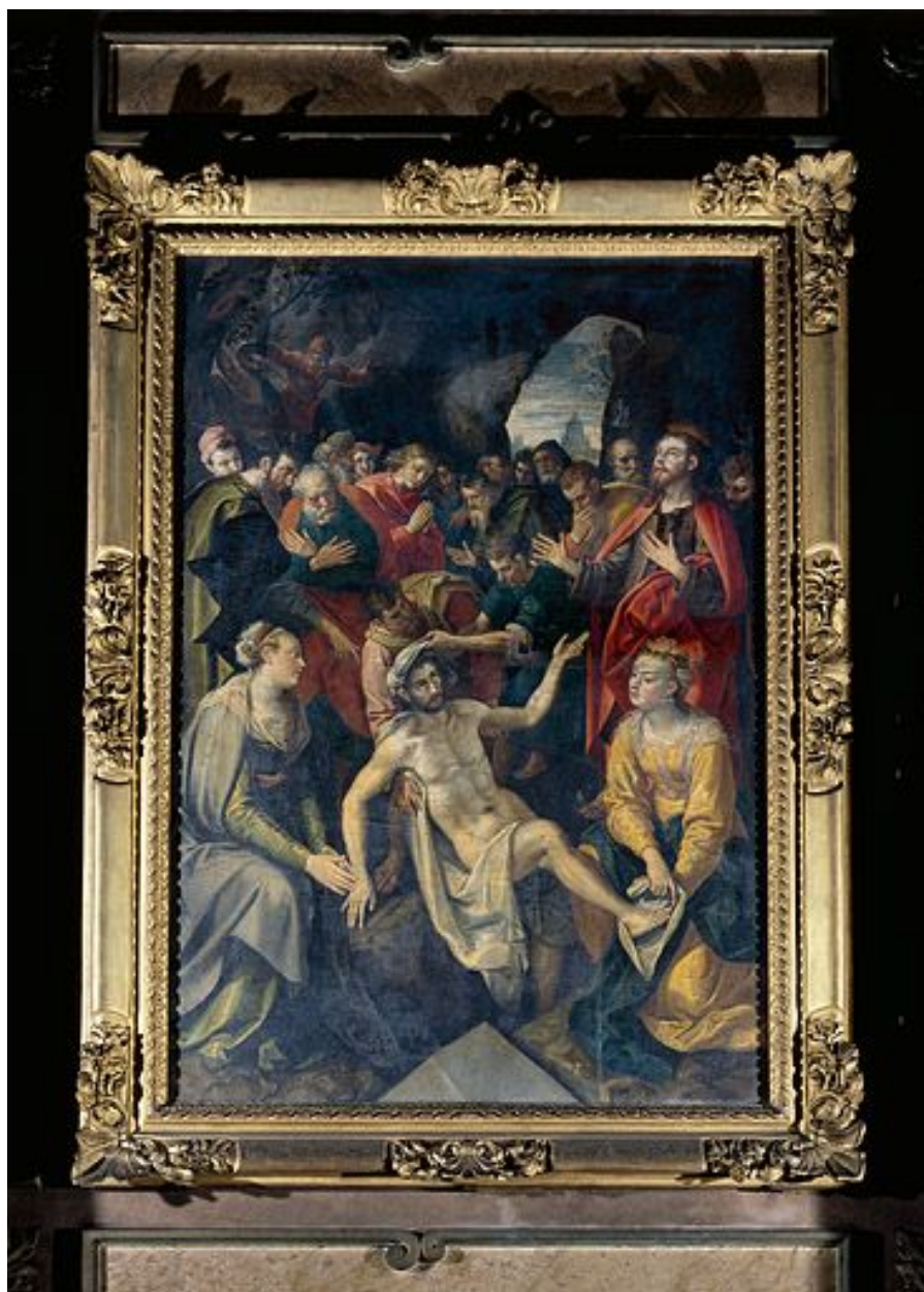
Tableau : la Résurrection de Lazare (Besançon, église Saint-Pierre).