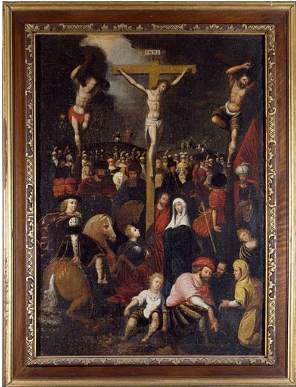
Tableau : la Crucifixion (Clairvaux-les-Lacs, église paroissiale Saint-Nithier).