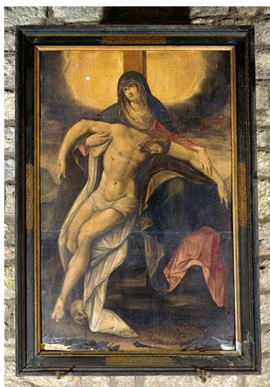
Tableau : Vierge de Pitié (Salins-les-Bains, église paroissiale Saint-Anatoile). IVR43_19993900011VA