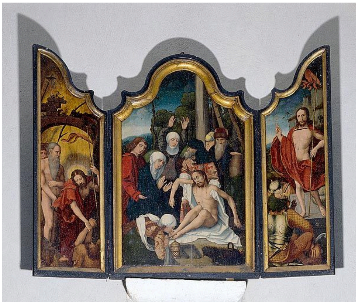
Triptyque : la Descente de croix, la Descente aux limbes, la Résurrection (Chaumergy, église paroissiale de la Nativité de la Vierge).