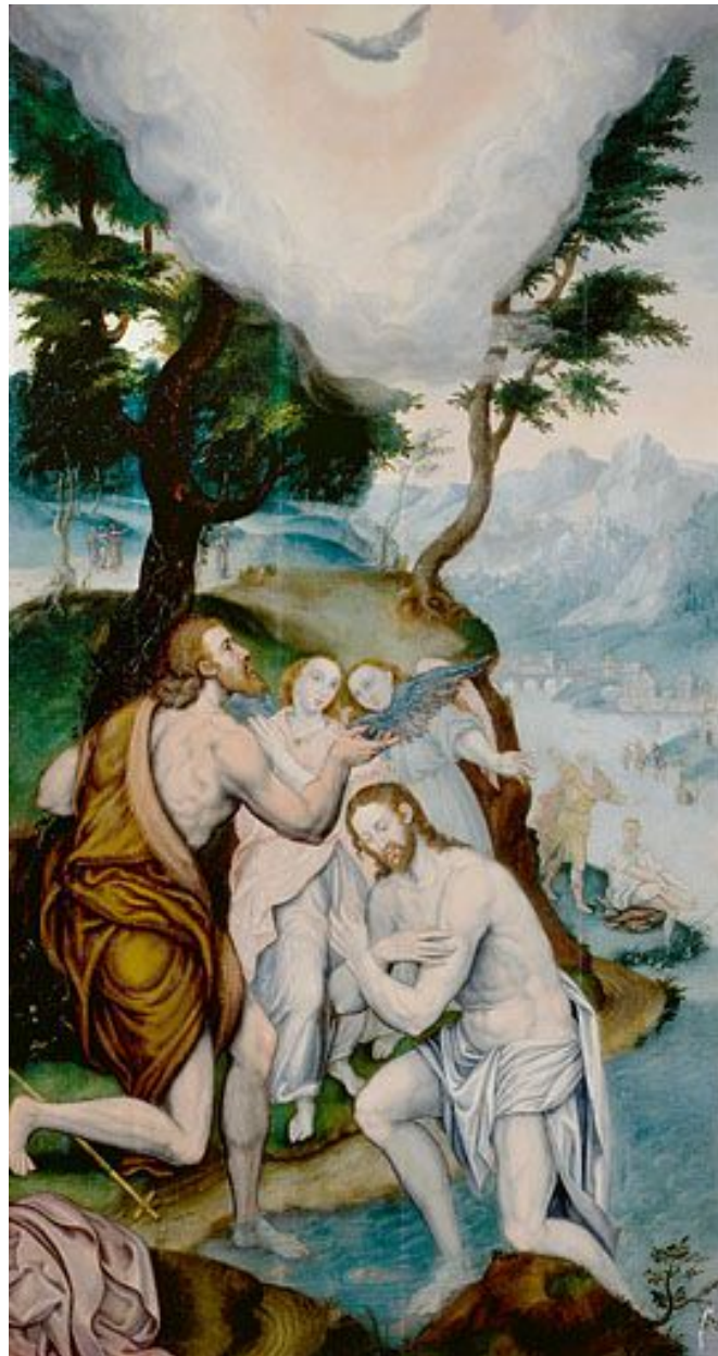
Polyptyque de la vie du Christ (Nozeroy, collégiale Saint-Antoine).