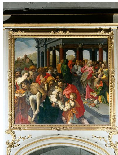
Tableau : la mort de Saphire (Besançon, cathédrale Saint-Jean).