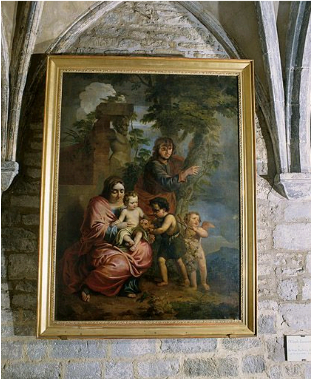
Tableau : La Sainte Famille (Arbois, église Saint-Just).