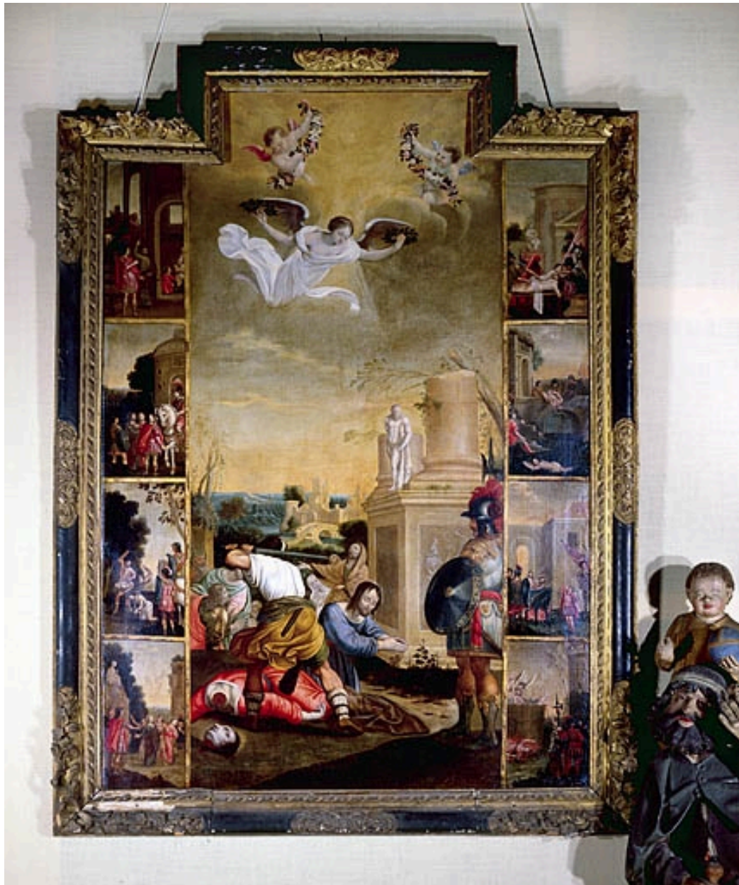
Tableau : le martyre de saint Crépin et de saint Crépinien (Besançon, église paroissiale Sainte-Madeleine).