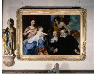
Tableau : Vierge à l'Enfant (Arc-et-Senans, église Saint-Bénigne). IVR43_19782500376VA