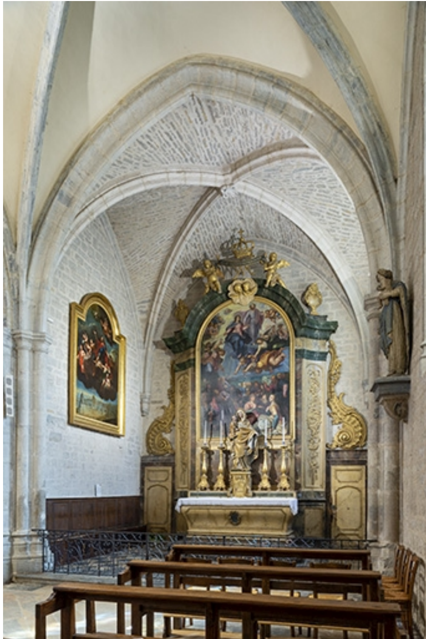
Tableau : l'Assomption et le Couronnement de la Vierge (Poligny, collégiale Saint-Hyppolite).