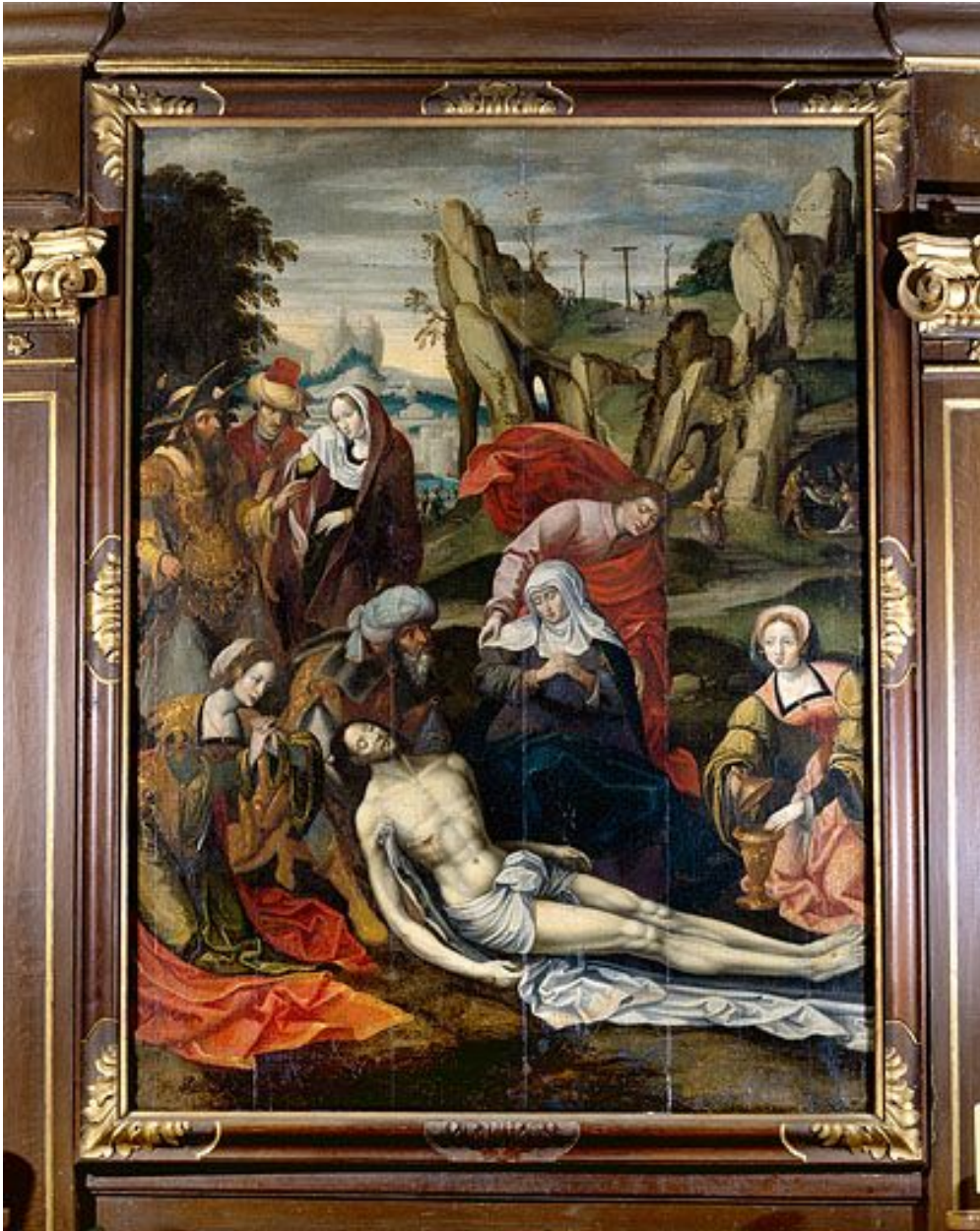
Tableau : la Déposition de croix (Foucherans, église paroissiale Saint-Martin).