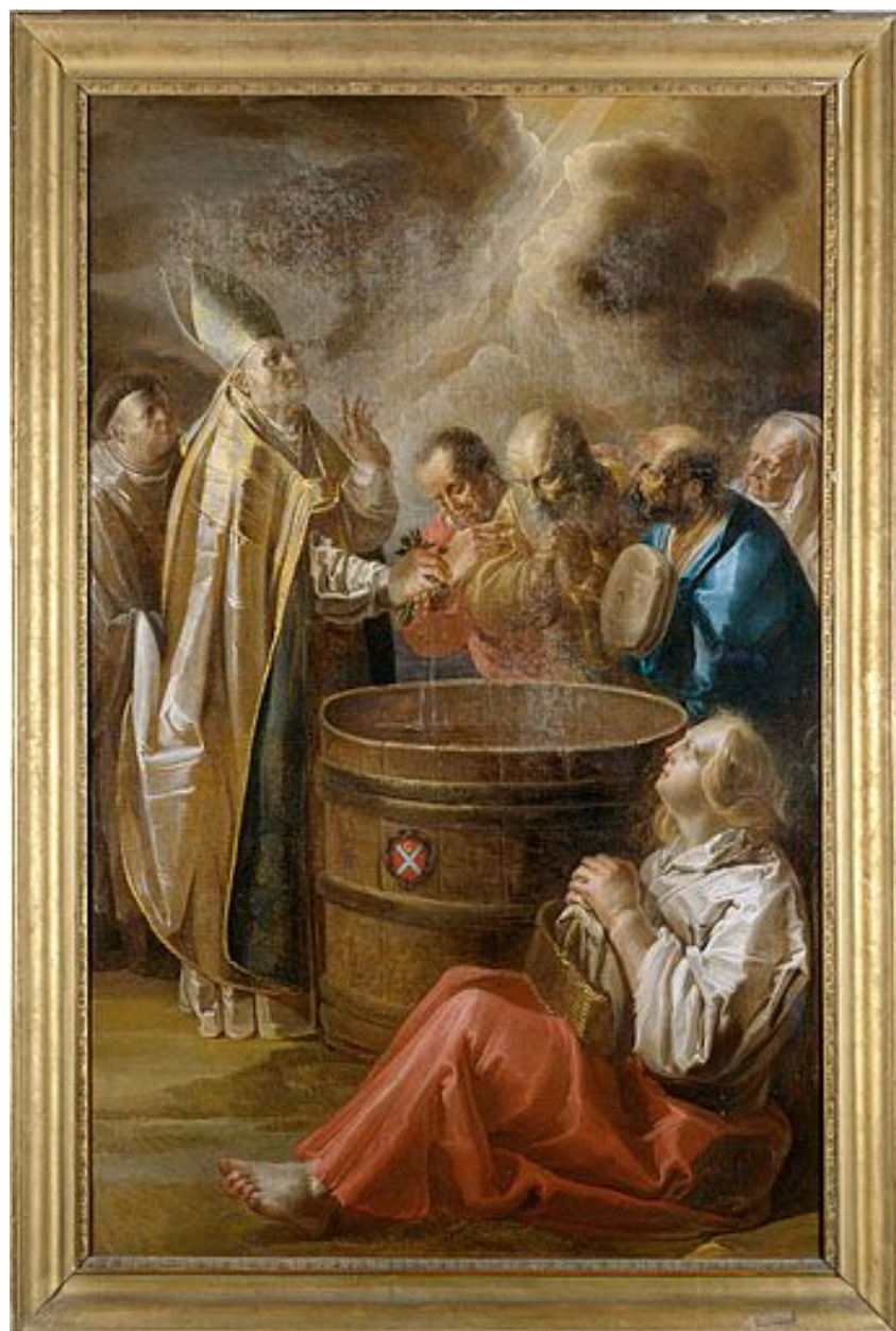
Tableau : le miracle de saint Théodule (Besançon, cathédrale Saint-Jean).