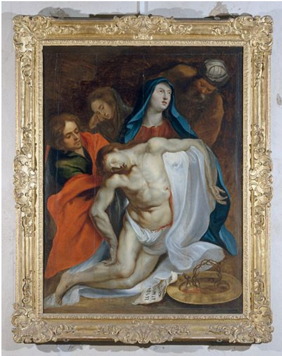
Tableau : Vierge de Pitié (Besançon, cathédrale Saint-Jean).