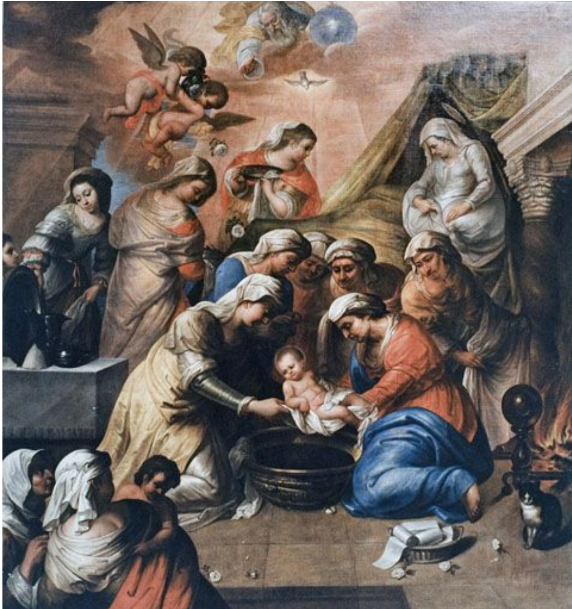
Tableau : la Nativité de la Vierge (Dole, collégiale Notre-Dame).