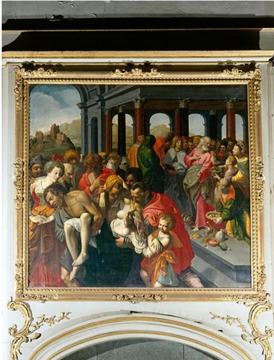
Tableau : la mort de Saphire (Besançon, cathédrale Saint-Jean).