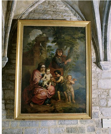
Tableau : La Sainte Famille (Arbois, église Saint-Just). IVR43_19983900047XA