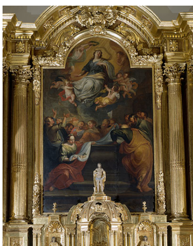
Tableau : l'Assomption de la Vierge (Gray-la-Ville, église paroissiale Saint-Maurice).