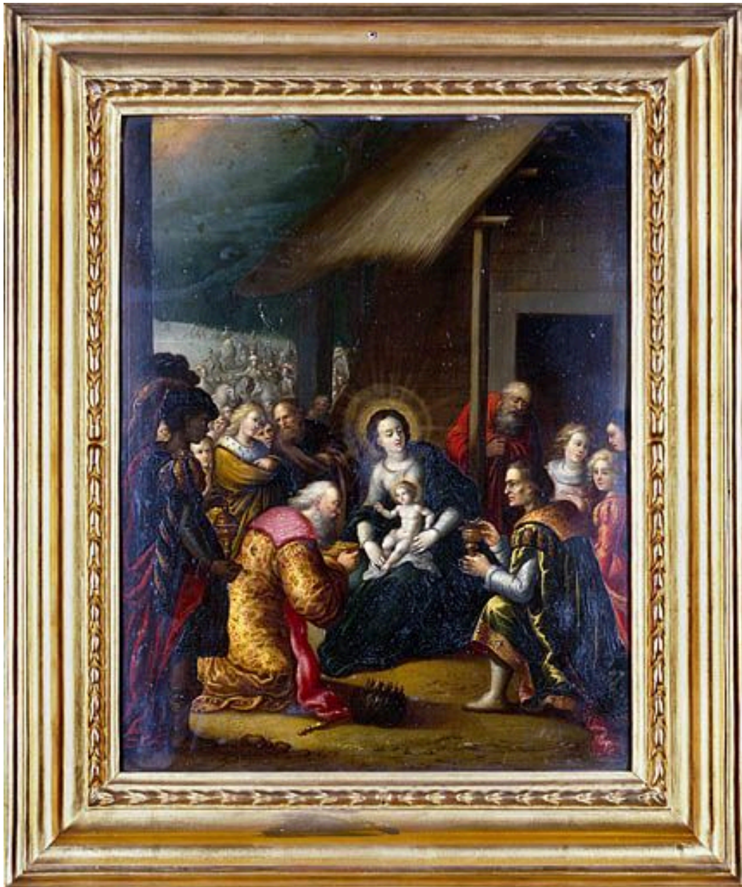
Tableau : l'Adoration des Mages (Besançon, rectorat de l'académie).