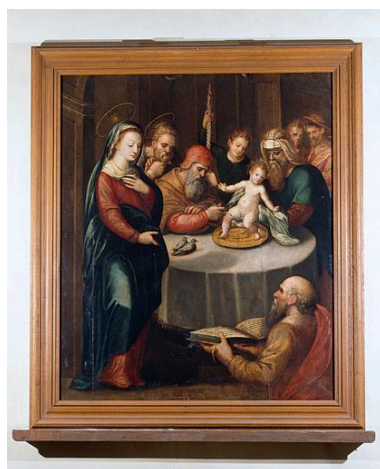
Tableau : la Circoncision (Villersexel, église paroissiale Saint-Nicolas). IVR43_19987000078VA