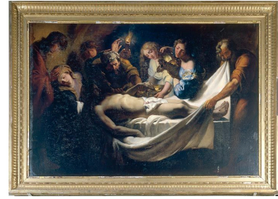
Tableau : Mise au tombeau (Arc-et-Senans, église Saint-Bénigne).