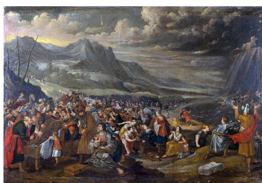
Tableau : Passage de la Mer Rouge (Besançon, rectorat de l'académie).