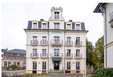
Façade ouest. IVR43_20207000638NUC4A