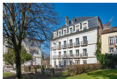
Façade sud. IVR43_20227000105NUC4A