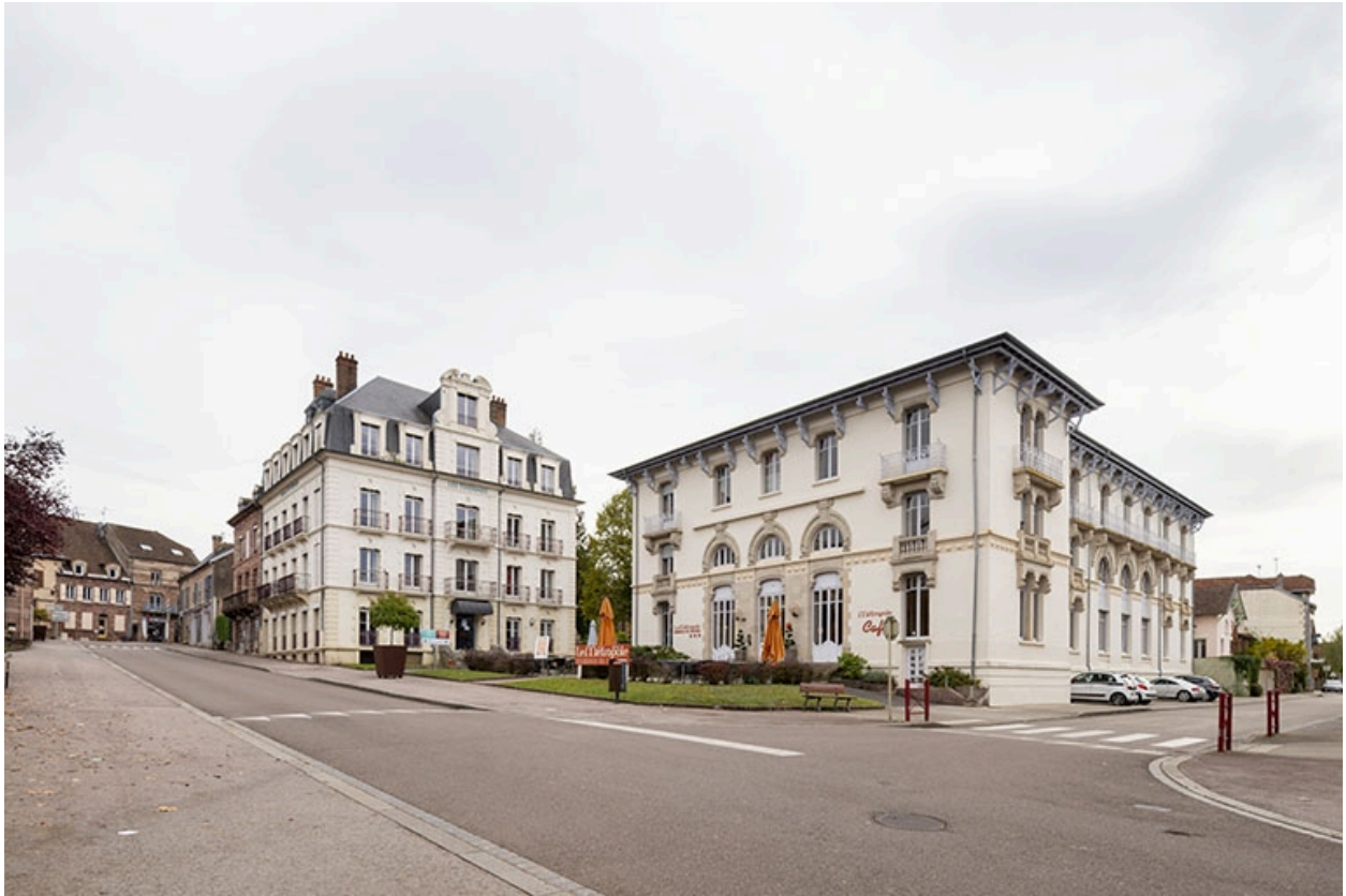
Situation de l'hôtel, au croisement de la rue des Thermes (à gauche) et du boulevard Richet (à droite).