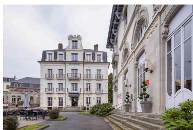
Façade ouest. IVR43_20207000637NUC4A