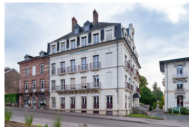
Façade nord. IVR43_20207000584NUC4A