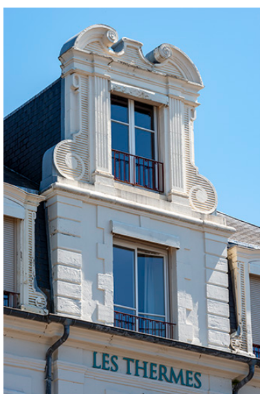
Lucarne. IVR43_20207000587NUC4A