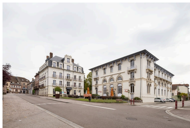
Situation de l'hôtel, au croisement de la rue des Thermes (à gauche) et du boulevard Richet (à droite).