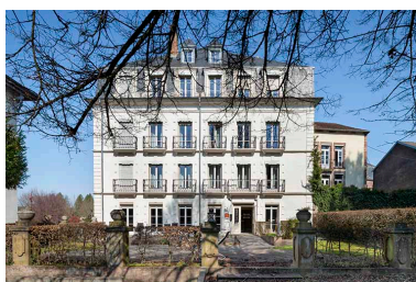
Façade sud. IVR43_20227000106NUC4A