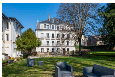
Façade sud. IVR43_20227000110NUC4A