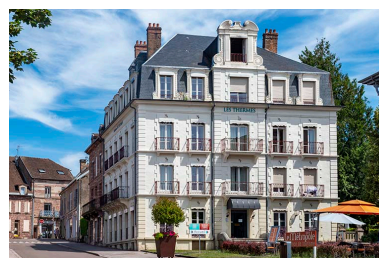
Façade ouest. IVR43_20207000585NUC4A