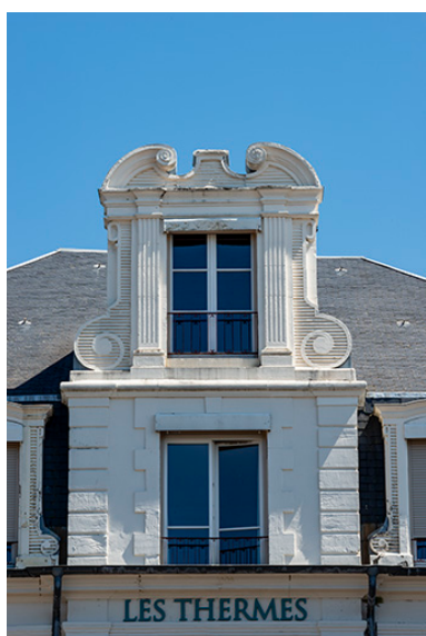
Lucarne. IVR43_20207000586NUC4A