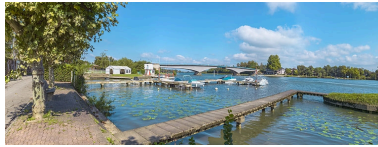
Le port et le pont de Saint-Romain, vus depuis la rive droite.