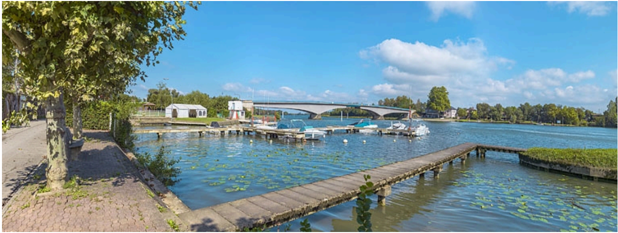
Le port et le pont de Saint-Romain, vus depuis la rive droite.