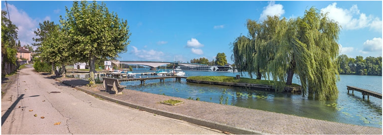
Le port et le pont de Saint-Romain, vus depuis la rive droite.