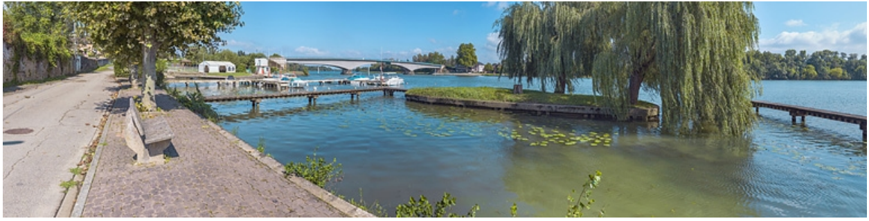
Le port et le pont de Saint-Romain, vus depuis la rive droite.