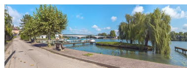
Le port et le pont de Saint-Romain, vus depuis la rive droite. IVR26_20217100601NUC4A