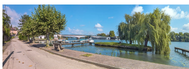
Le port et le pont de Saint-Romain, vus depuis la rive droite. IVR26_20217100600NUC4A