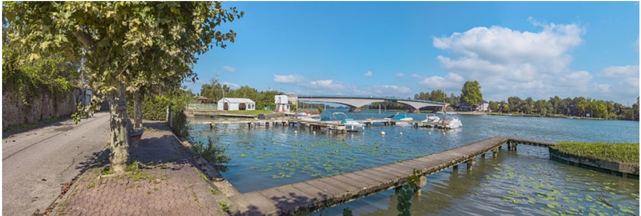
Le port et le pont de Saint-Romain, vus depuis la rive droite.