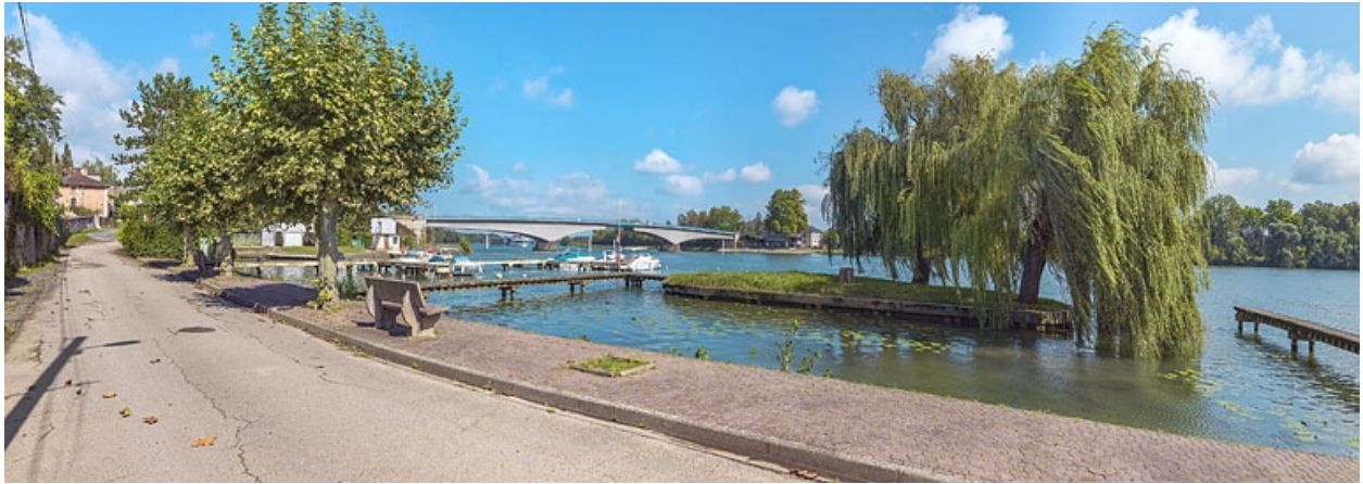
Le port et le pont de Saint-Romain, vus depuis la rive droite.