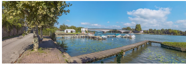
Le port et le pont de Saint-Romain, vus depuis la rive droite.