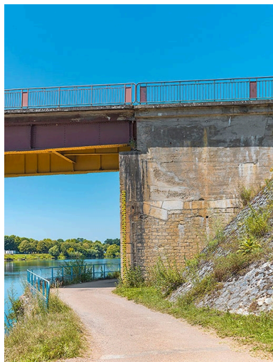
Culée rive droite du pont de Bragny. On lit les différentes phases de reconstruction de l'ouvrage.

IVR26_20207100223NUC4A