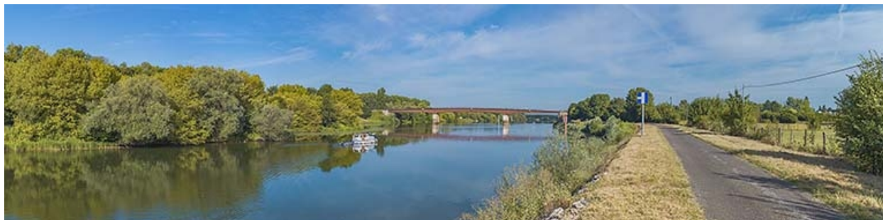
Le pont de Bragny vu d'amont depuis la rive droite.