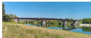
Le pont de Bragny vu d'amont.