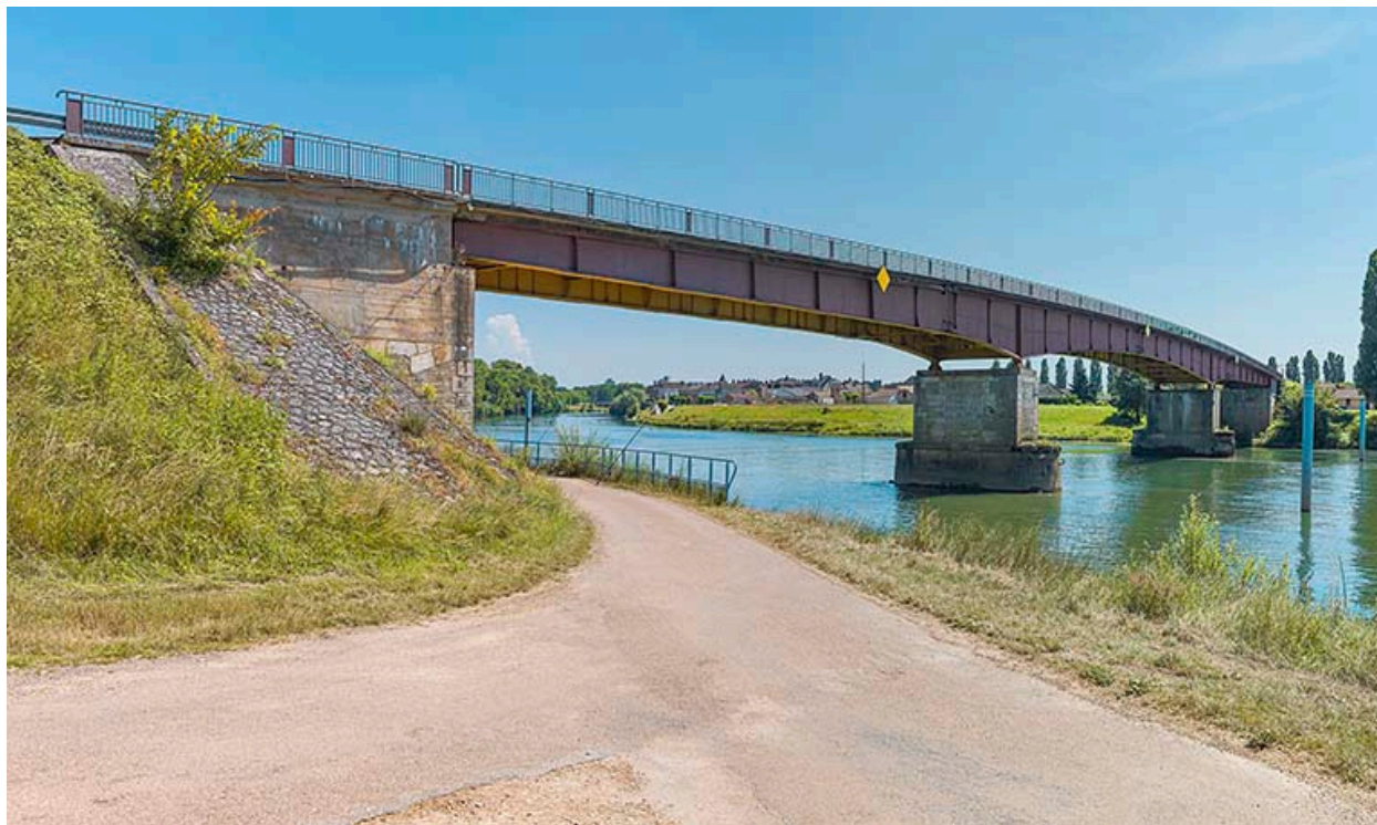
Le pont de Bragny, vu d'aval. La ville de Verdun-sur-le-Doubs en arrière-plan.