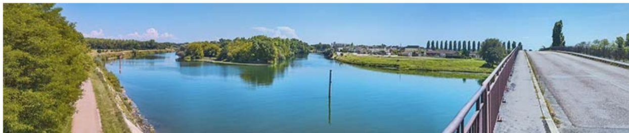
Confluence de la Saône et du Doubs en amont du pont de Bragny.