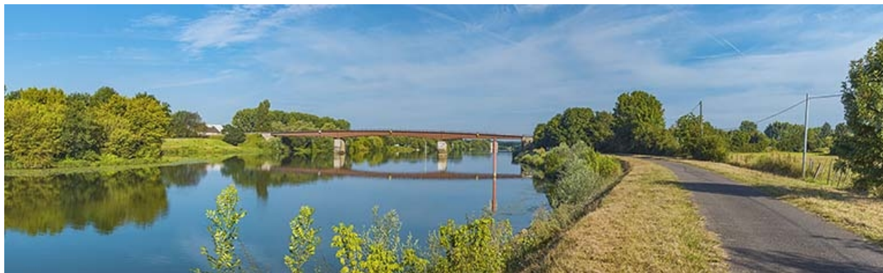
Le pont de Bragny vu d'amont, rive droite.