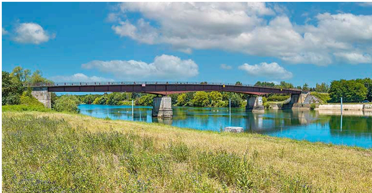
Vue d'ensemble du pont de Bragny.