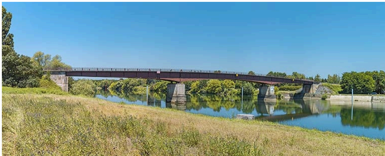
Le pont de Bragny vu d'amont.