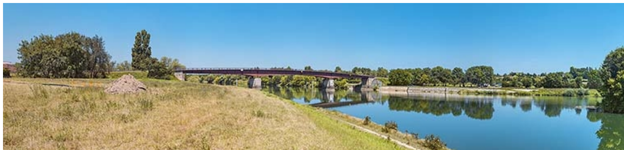
Le pont de Bragny vu d'amont depuis Verdun-sur-le-Doubs.