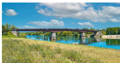
Vue d'ensemble du pont de Bragny.

IVR26_20207100220NUC4A