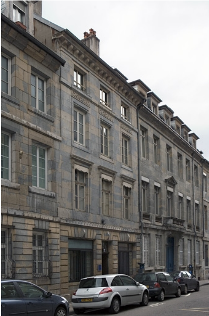
Vue d'ensemble du logis principal depuis la rue, de trois quarts gauche.