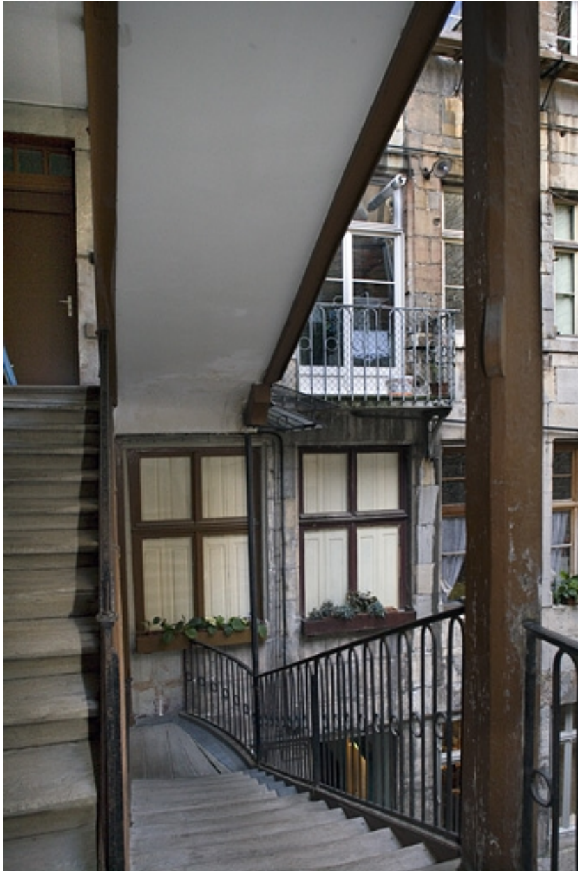
Vue de la façade sur cour du logis principal depuis l'escalier.