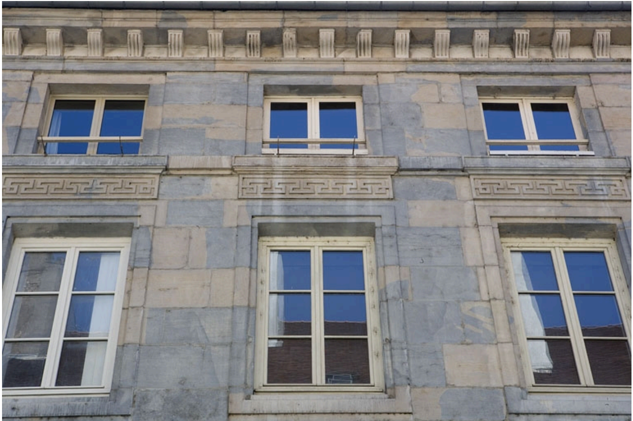
Détail des fenêtres des deuxième et troisième étages.