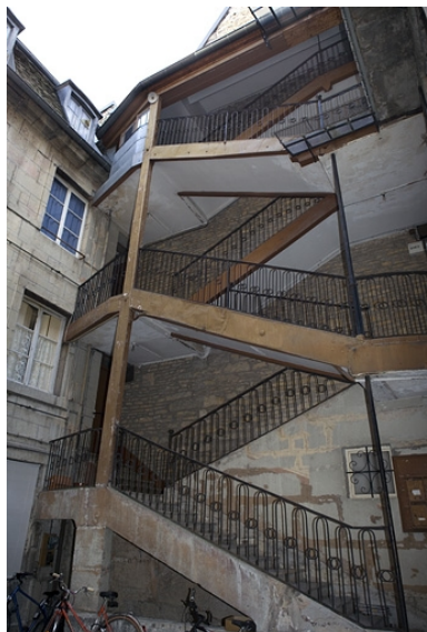
Vue d'ensemble de l'escalier à cage ouverte sur cour. IVR43_20072500273NUCA