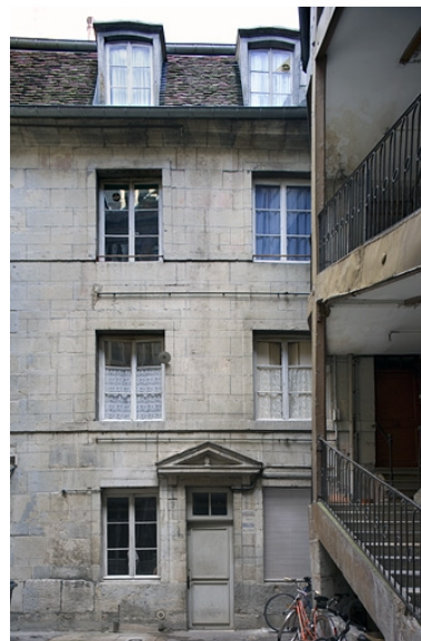
Vue de la façade sur cour du logis secondaire. IVR43_20072500279NUCA