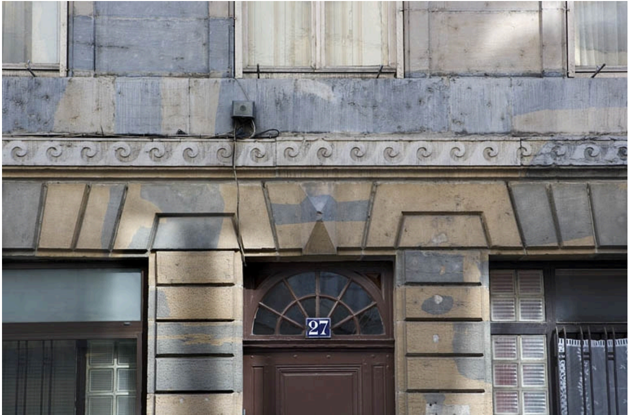
Détail du décor sculpté au-dessus de l'entrée.