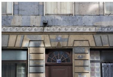
Détail du décor sculpté au-dessus de l'entrée. IVR43_20072500274NUCA