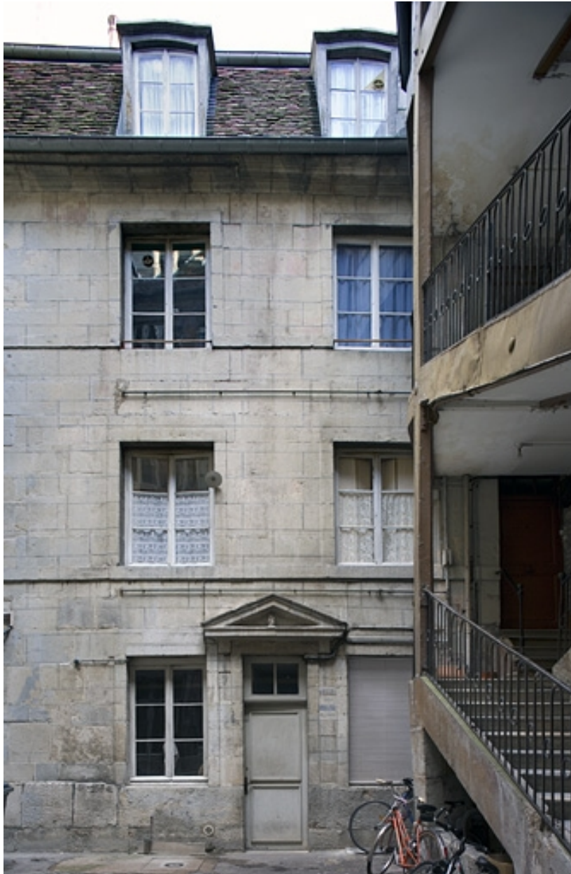
Vue de la façade sur cour du logis secondaire.