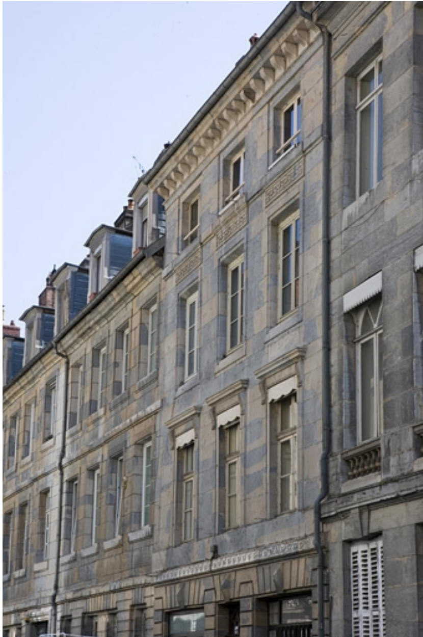
Vue rapprochée de la façade sur rue de trois quarts droit.