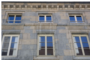
Détail des fenêtres des deuxième et troisième étages.