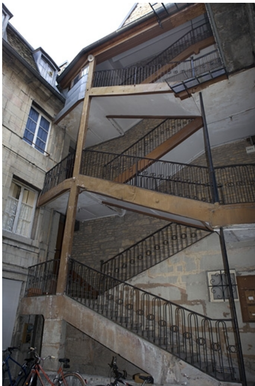
Vue d'ensemble de l'escalier à cage ouverte sur cour.