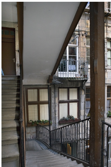
Vue de la façade sur cour du logis principal depuis l'escalier.