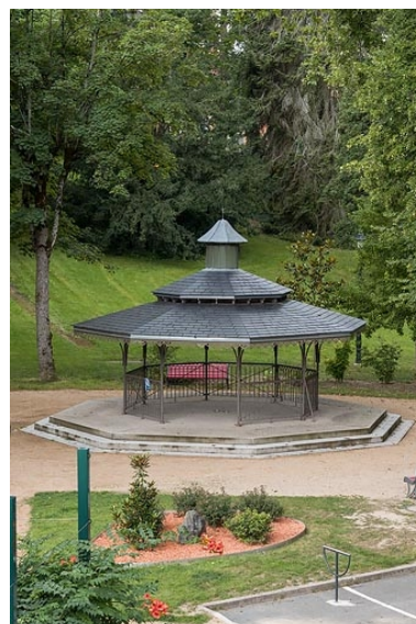
Vue actuelle de l'abri dans le parc thermal. IVR26_20217100208NUC4A