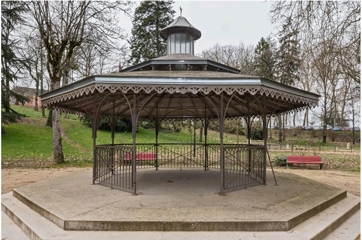
Vue actuelle de l'abri dans le parc thermal.