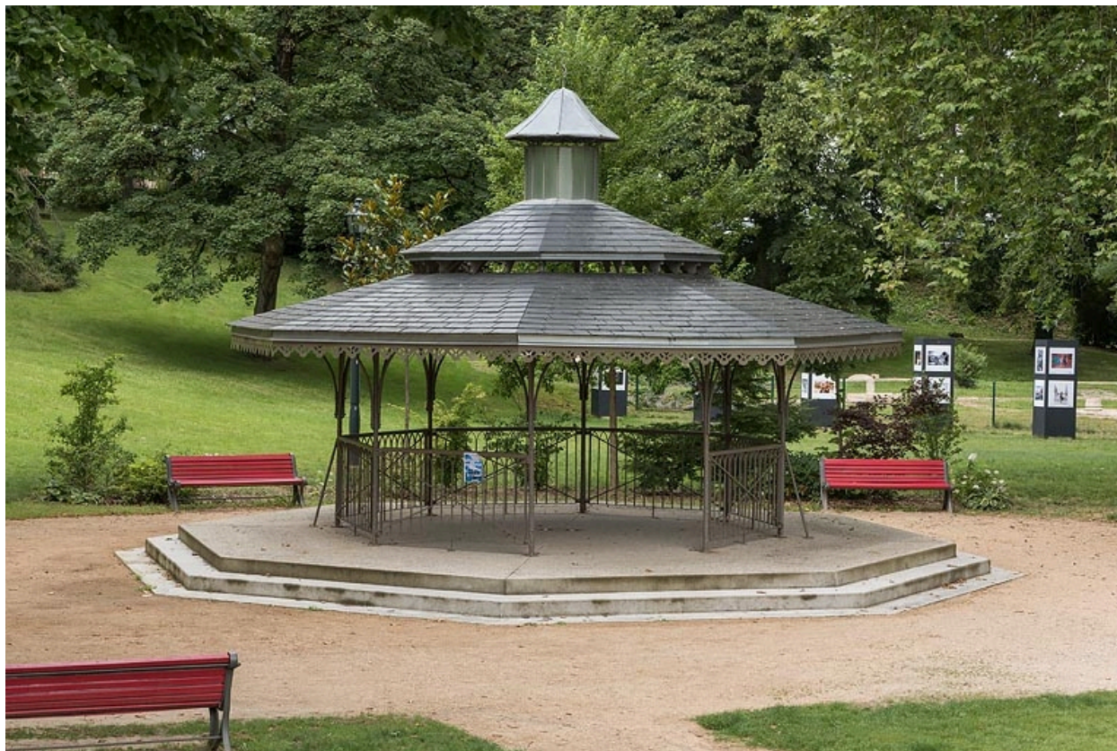
Vue actuelle de l'abri dans le parc thermal.