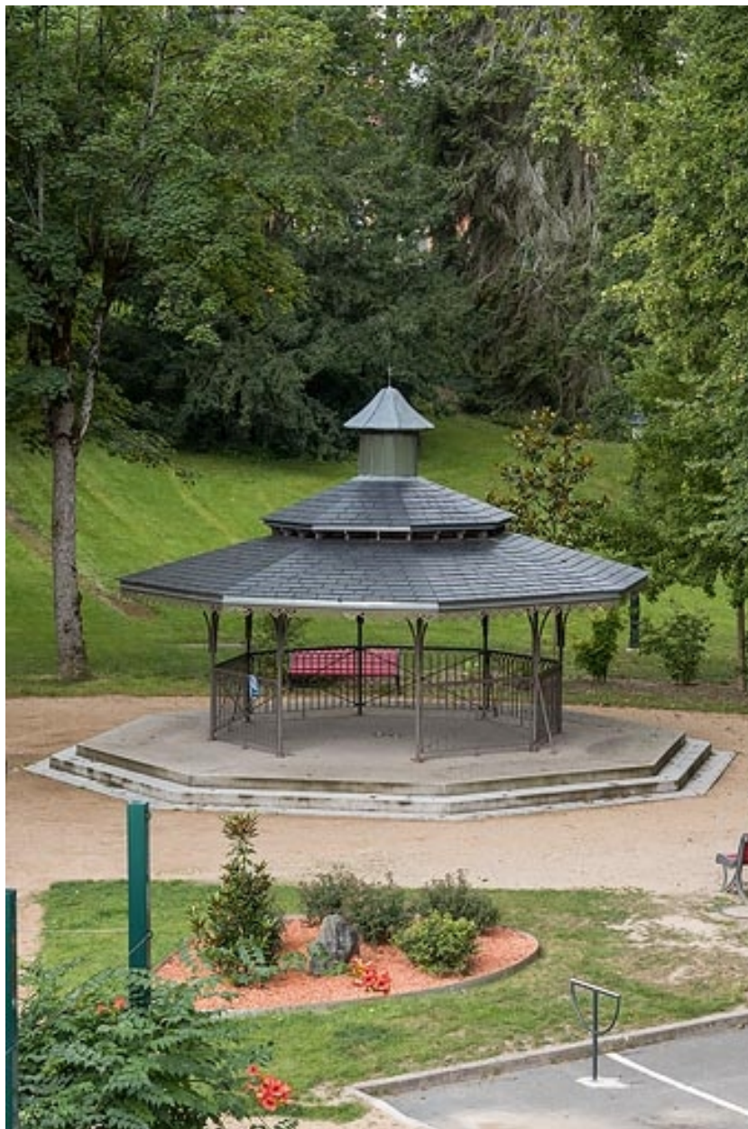
Vue actuelle de l'abri dans le parc thermal.