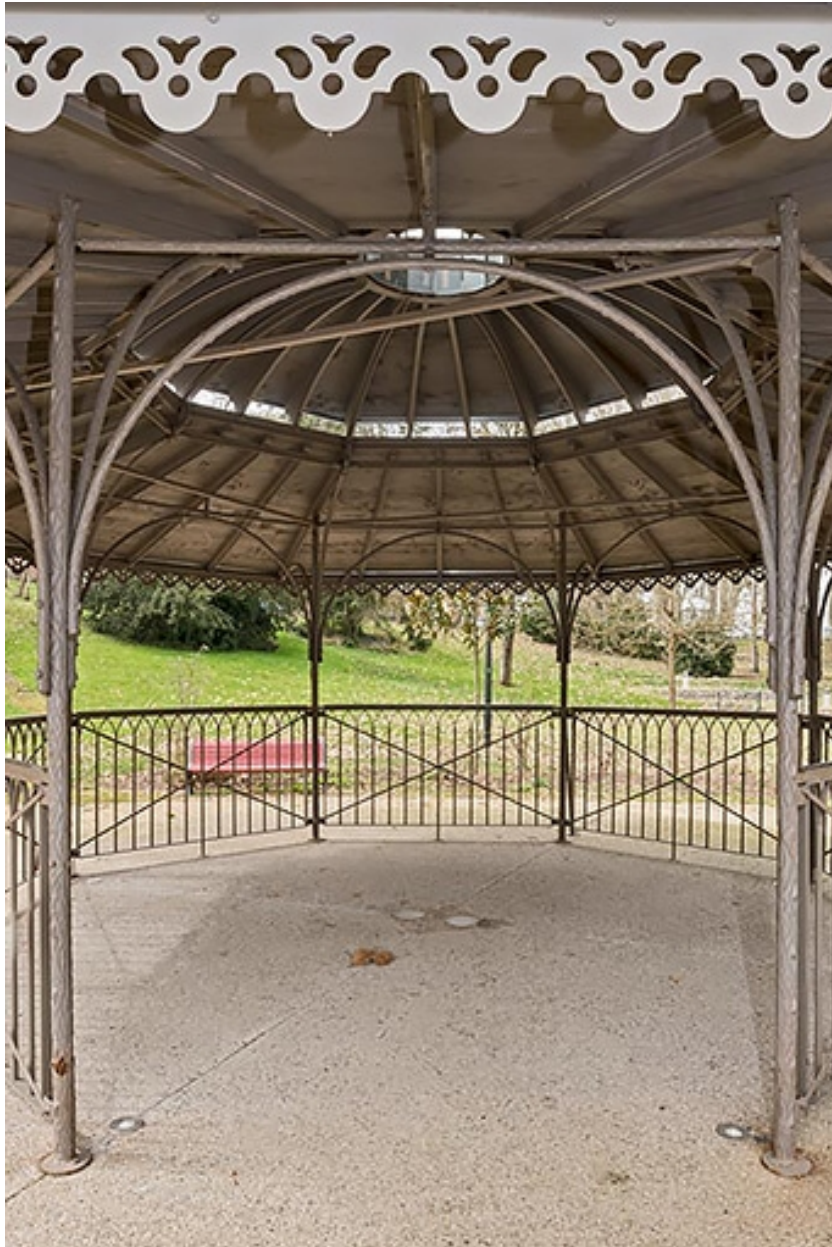
Vue actuelle de l'abri dans le parc thermal.