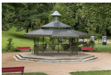
Vue actuelle de l'abri dans le parc thermal. IVR26_20217100212NUC4A