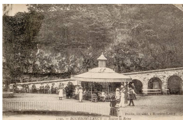
Vue ancienne de l'abri dans la cour des thermes.