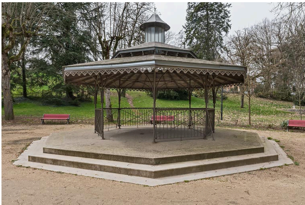
Vue actuelle de l'abri dans le parc thermal.