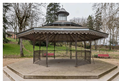
Vue actuelle de l'abri dans le parc thermal. IVR26_20227100018NUC4A