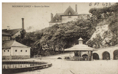
Vue ancienne de l'abri dans la cour des thermes. IVR26_20217100314NUC1A