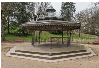
Vue actuelle de l'abri dans le parc thermal. IVR26_20227100019NUC4A