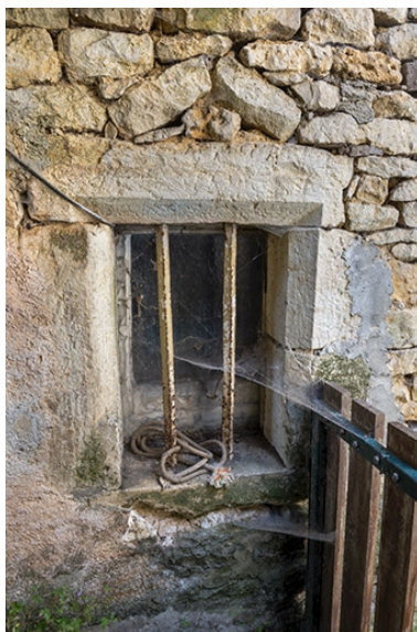
Baie chanfreinée au rez-de-chaussée.