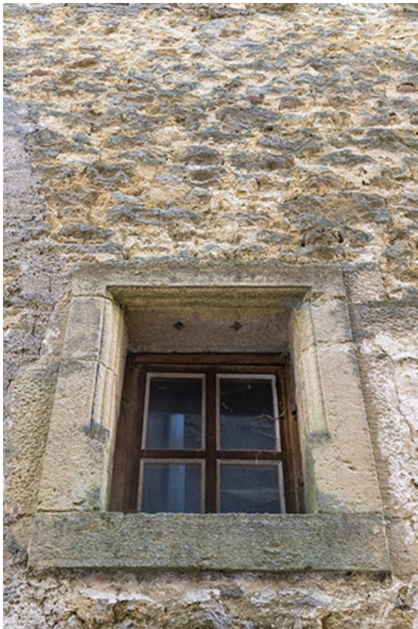
Une baie de l'étage, côté cour.