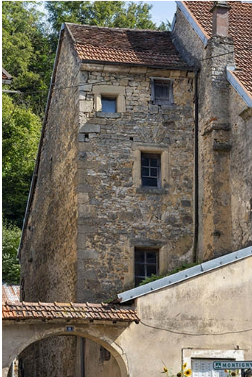
Détail de la partie en retrait.