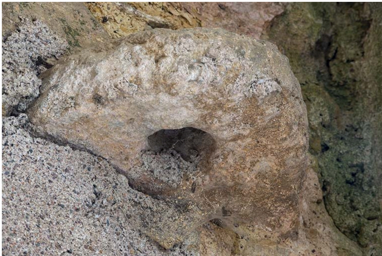
Détail d'un remploi pris dans la maçonnerie.