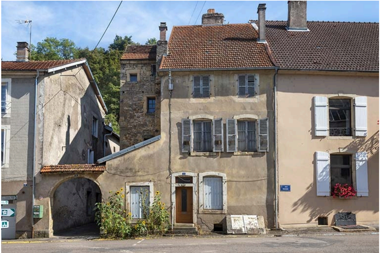
Façade sur rue.