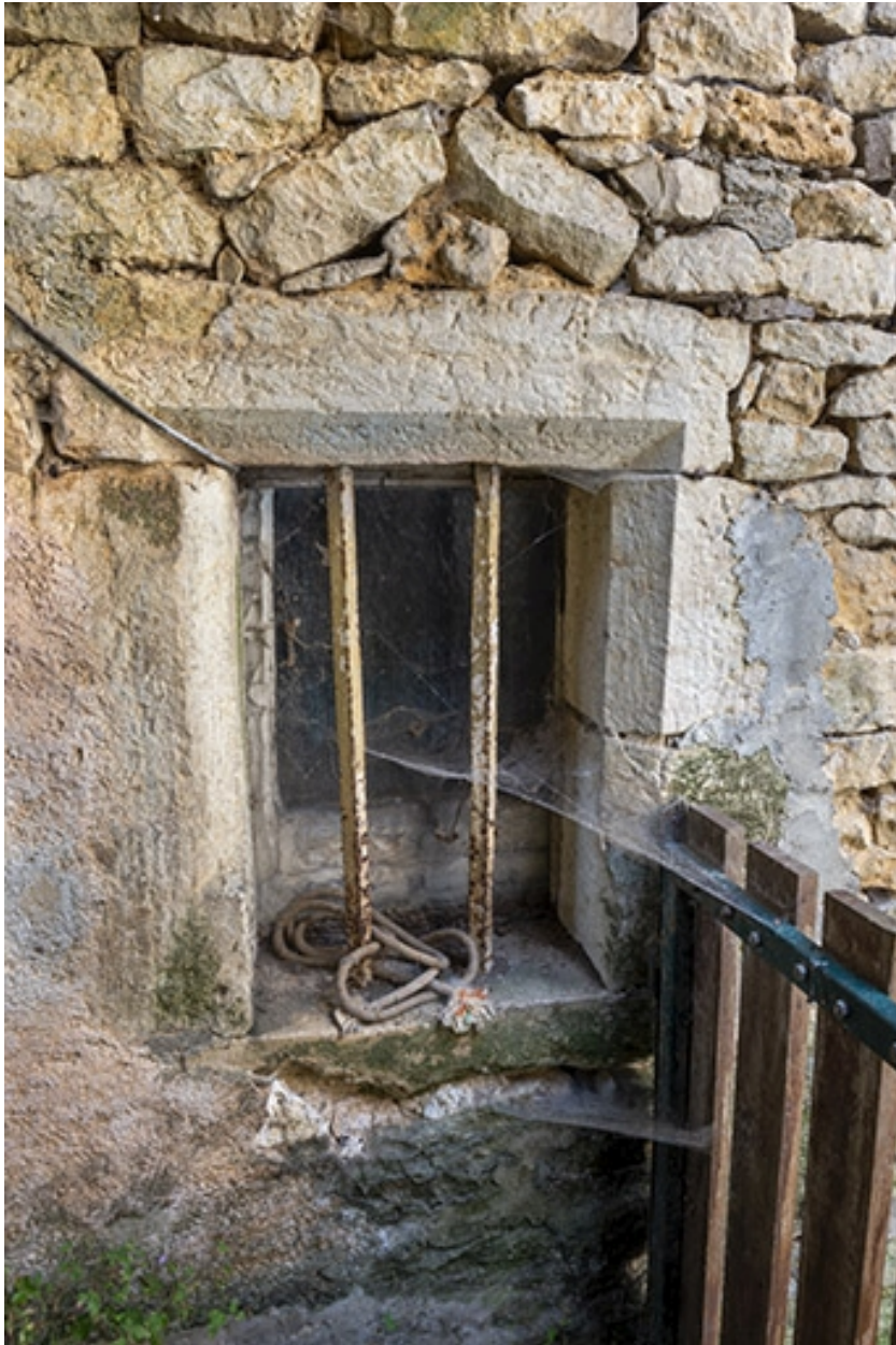
Baie chanfreinée au rez-de-chaussée.