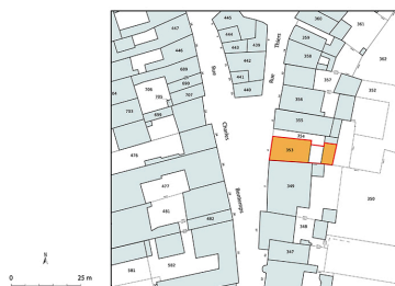
Plan-masse et de situation. Extrait du plan cadastral numérisé de la direction générale des finances publiques, 2025, 1/500. IVR43_20257000072NUDA