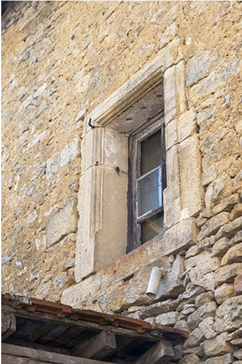
Une baie de l'étage, côté cour.