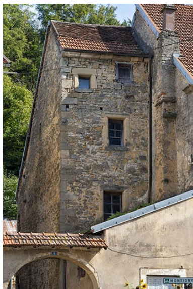
Détail de la partie en retrait.