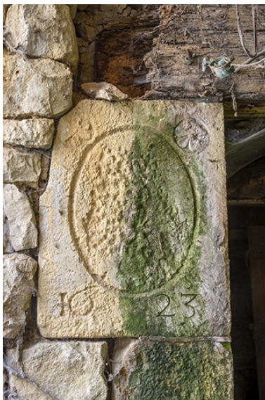
Un remploi (date portée 1623) dans la maçonnerie de l'immeuble.