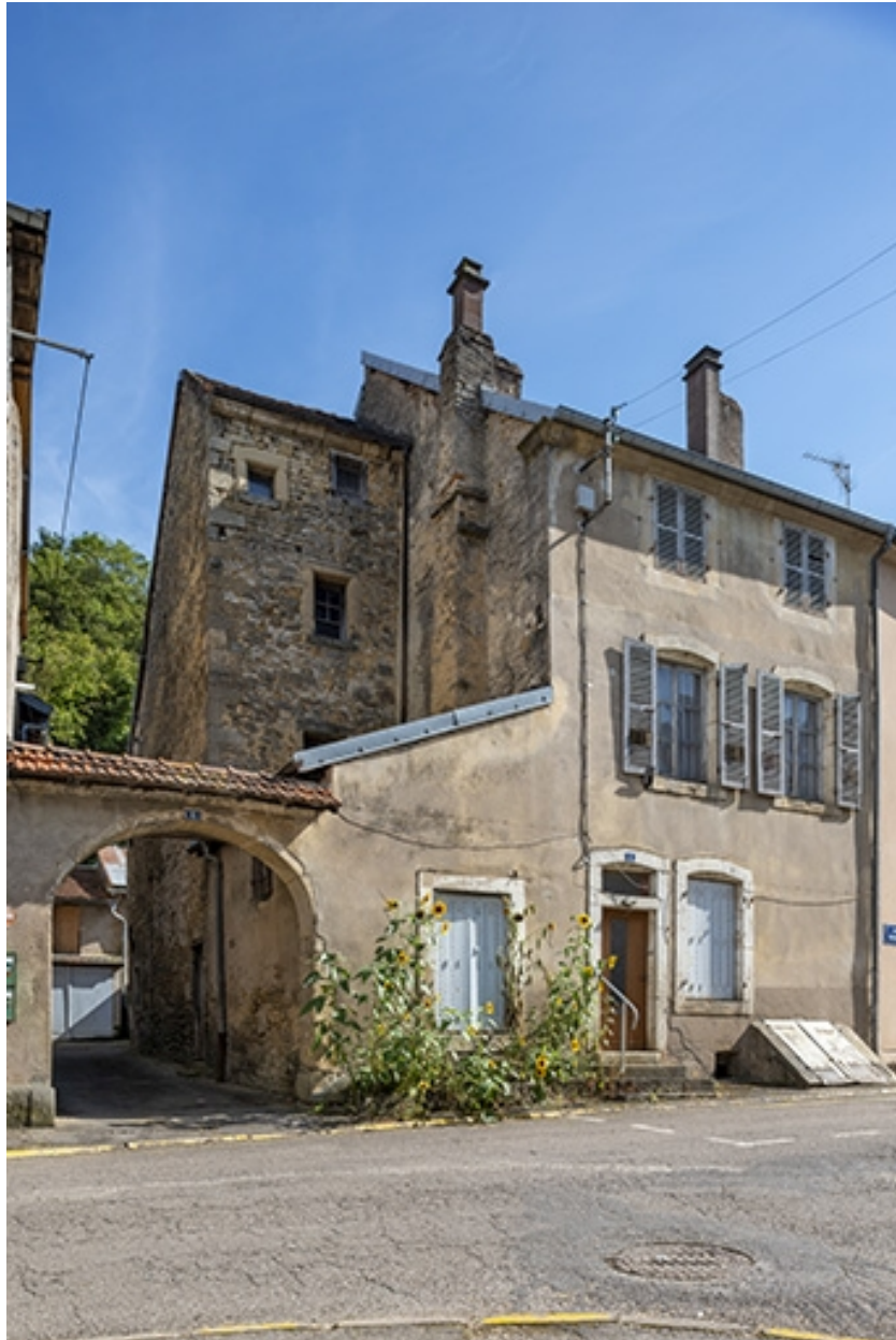
Trois quarts gauche de la maison.