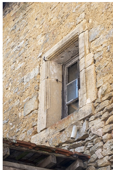
Une baie de l'étage, côté cour.