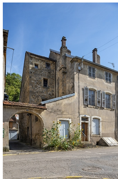
Trois quarts gauche de la maison. IVR43_20217000576NUC4A