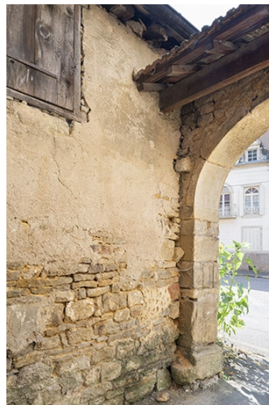
Détail de maçonnerie depuis la cour.