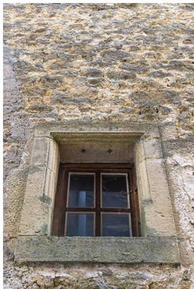
Une baie de l'étage, côté cour.