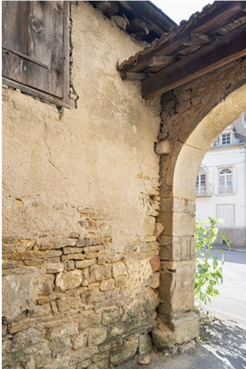
Détail de maçonnerie depuis la cour.