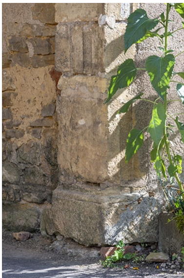
La base du piédroit du portail.