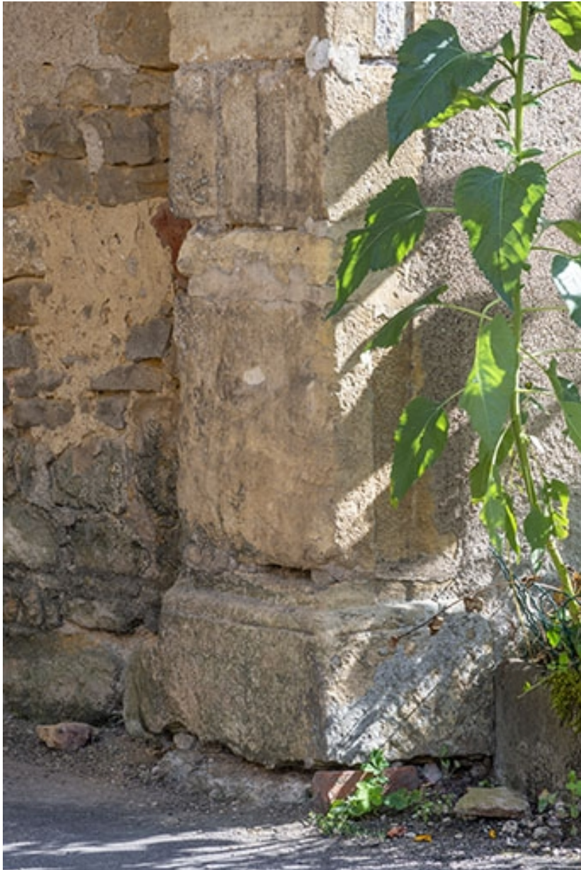
La base du piédroit du portail.