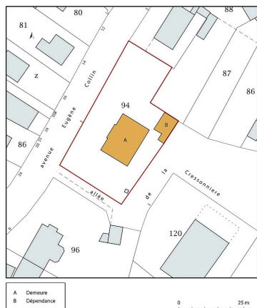
Plan-masse et de situation, extrait du plan cadastral (2020). IVR26_20205800662NUDA