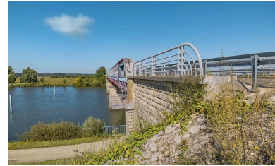
Vue d'ensemble du pont.