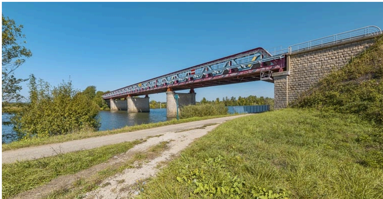
Vue d'ensemble du pont.