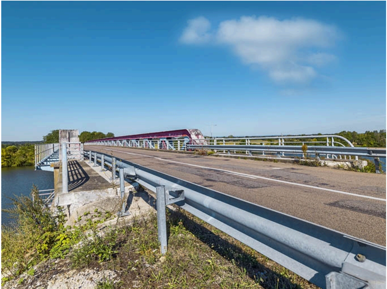
Vue d'ensemble du pont : tablier.