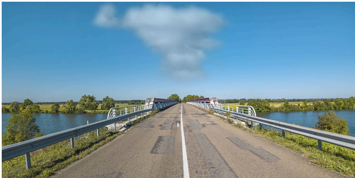
Vue d'ensemble du tablier du pont.