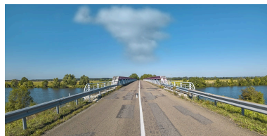
Vue d'ensemble du tablier du pont. IVR26_20192100223NUC4A