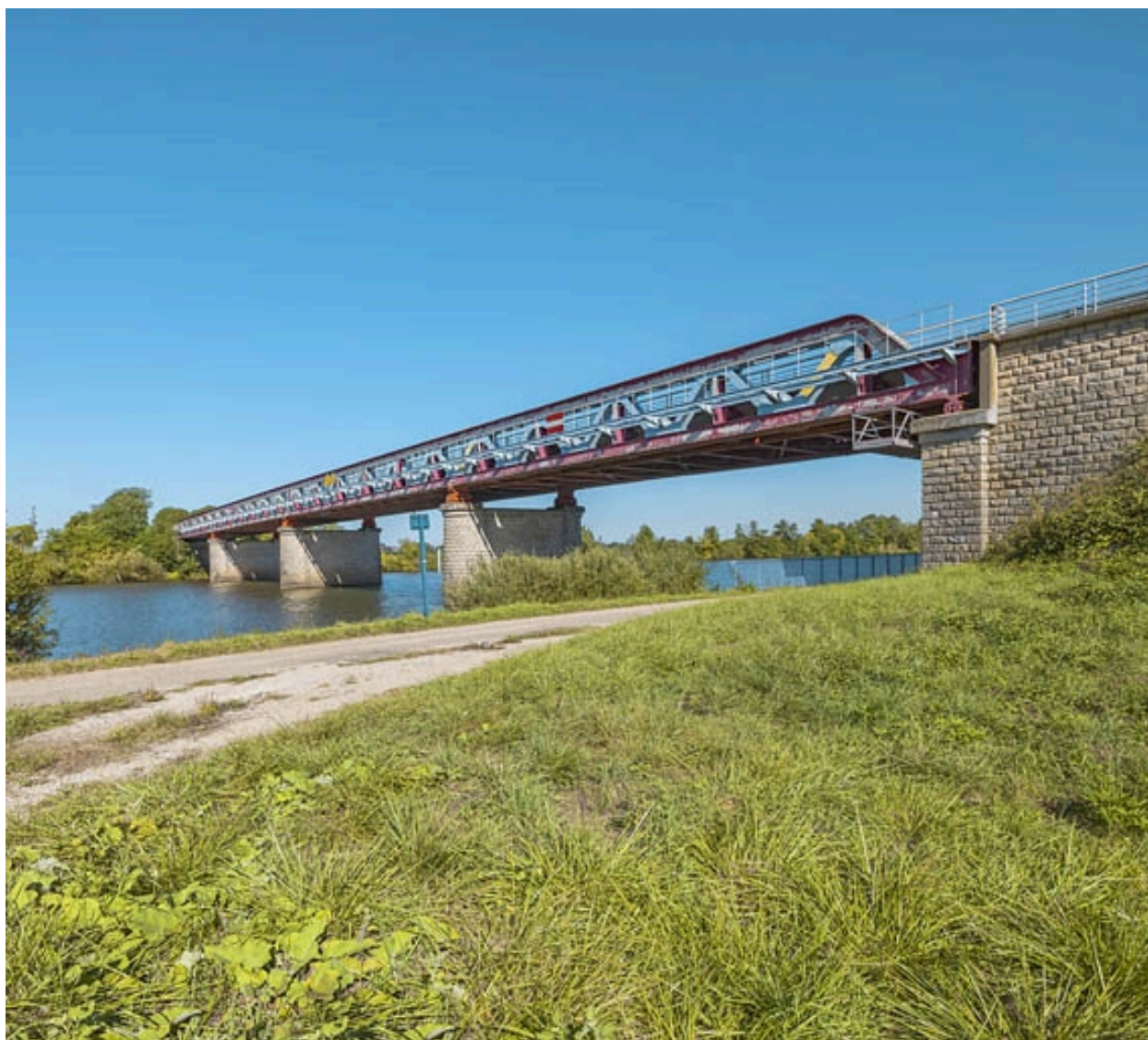
Vue d'ensemble du pont.