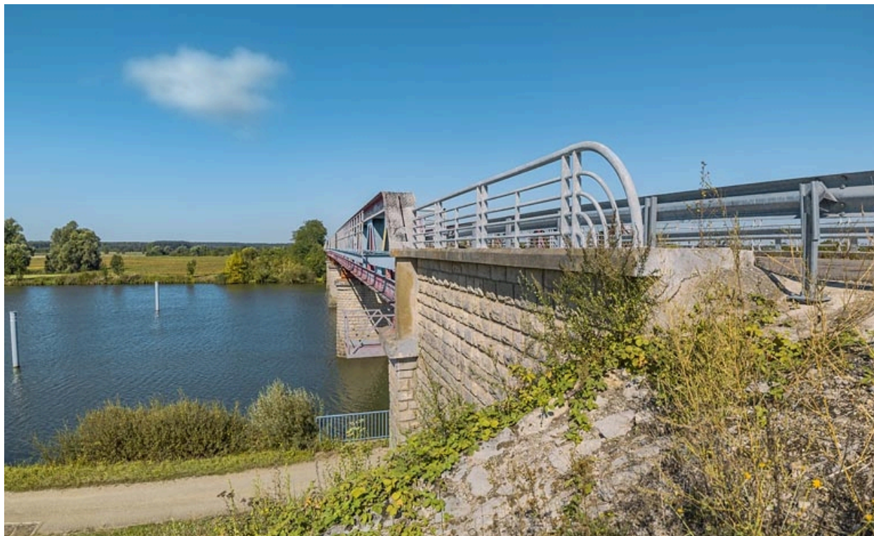
Vue d'ensemble du pont.