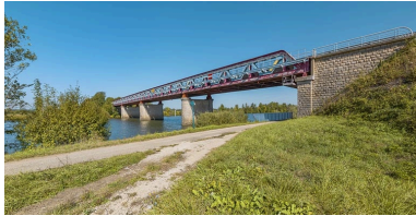
Vue d'ensemble du pont. IVR26_20192100219NUC4A