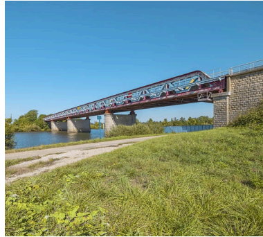
Vue d'ensemble du pont.