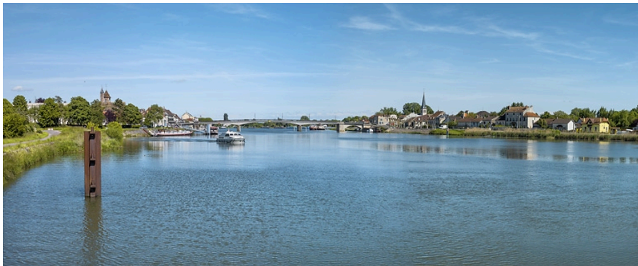
Vue d'ensemble de Losne, sur la rive gauche de la Saône.