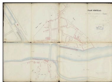
Plan général des perrés à construire à Losne et de leurs abords. 1838.