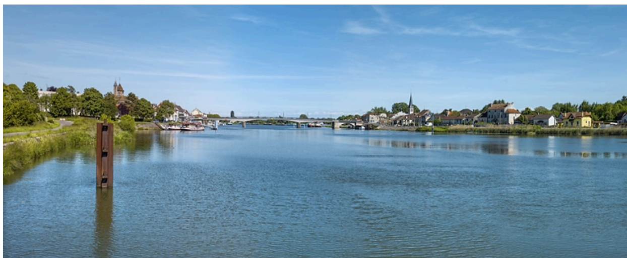
Vue d'ensemble de Losne, sur la rive gauche de la Saône.