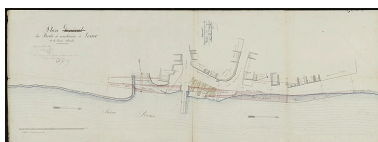
Plan des perrés à construire à Losne et de leurs abords. 1838.