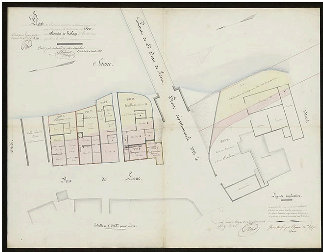
Plan des bâtiments et portions de terrains à acquérir par l'Etat pour la construction d'un port et d'un chemin de halage à Losne (rive gauche de la Saône). 1838.