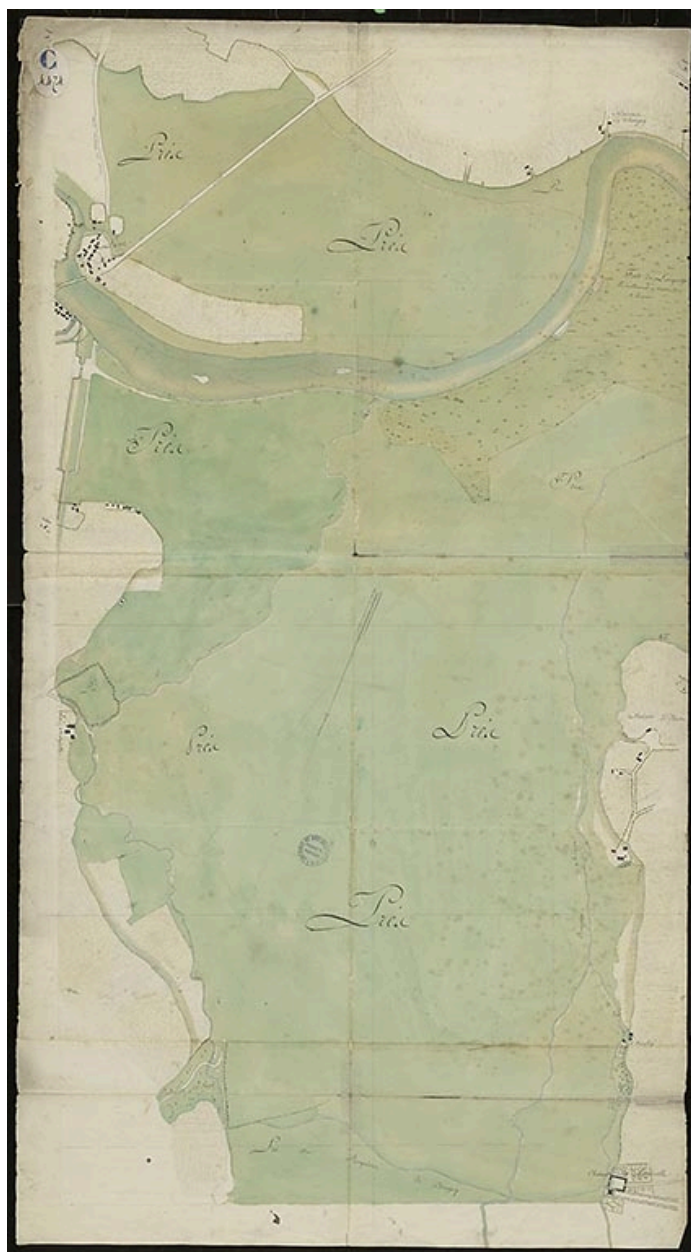
Plan n°13 du cours de la rivière sur les territoires de Losne, Chaughey et Esbarres. 1785.