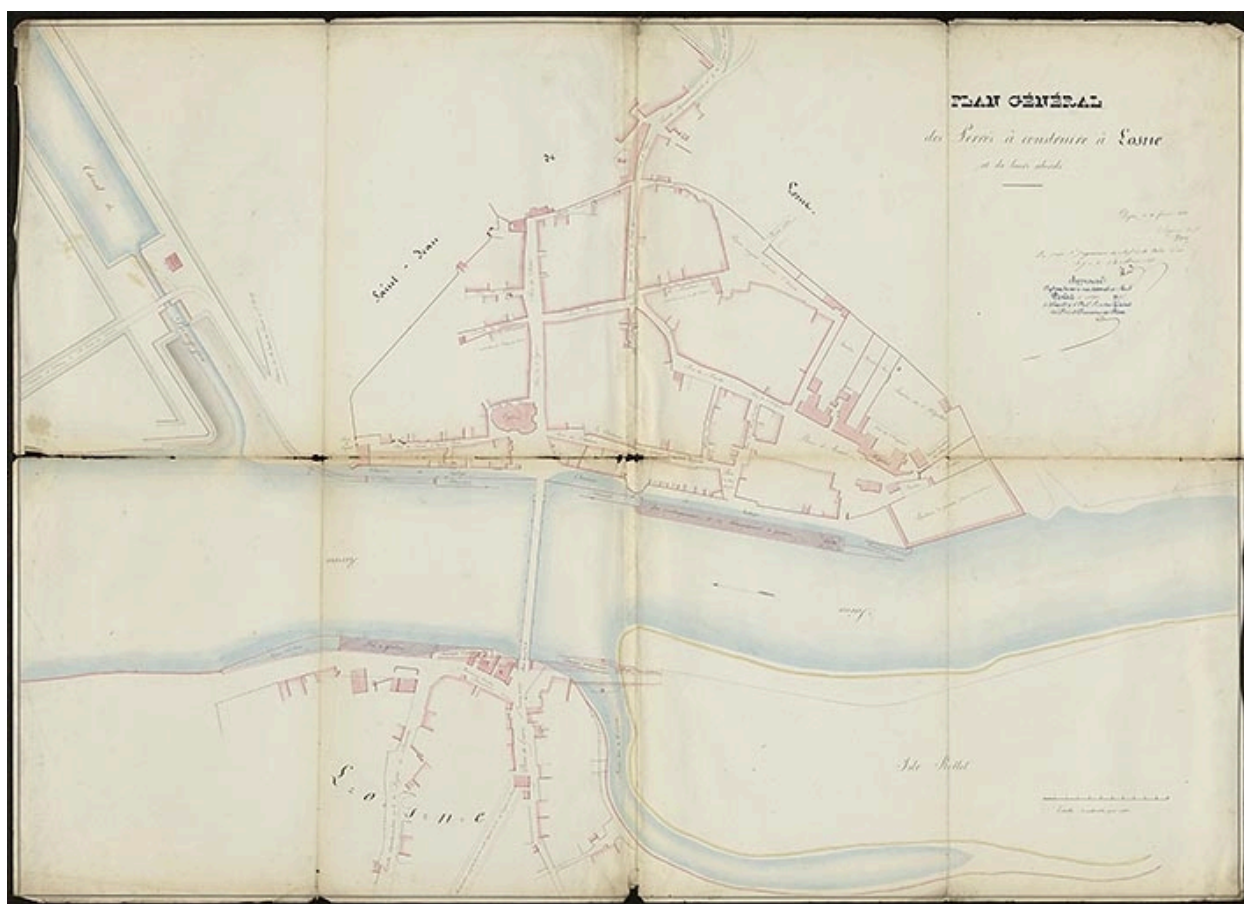
Plan général des perrés à construire à Losne et de leurs abords. 1838.