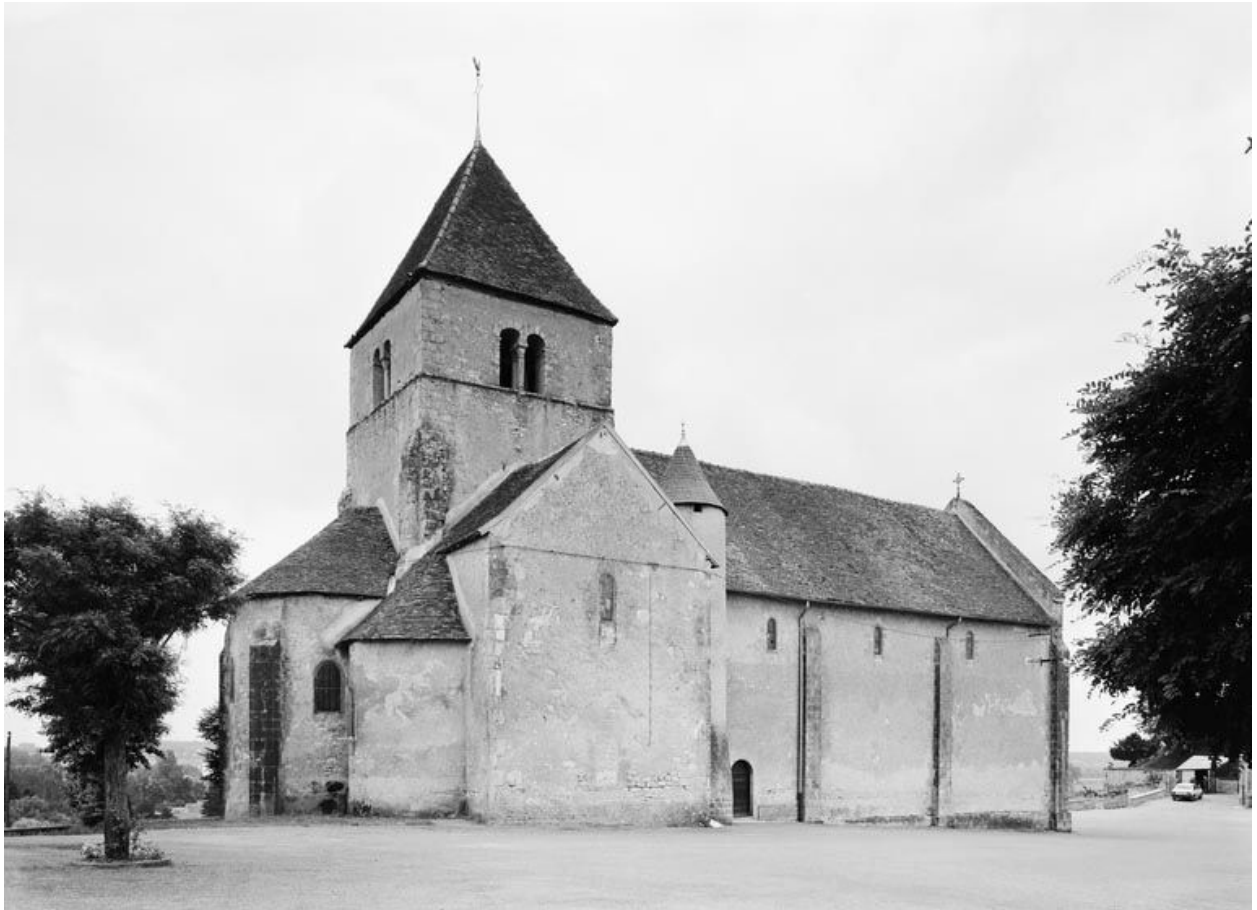
Elévation latérale gauche, vue prise du nord-est.