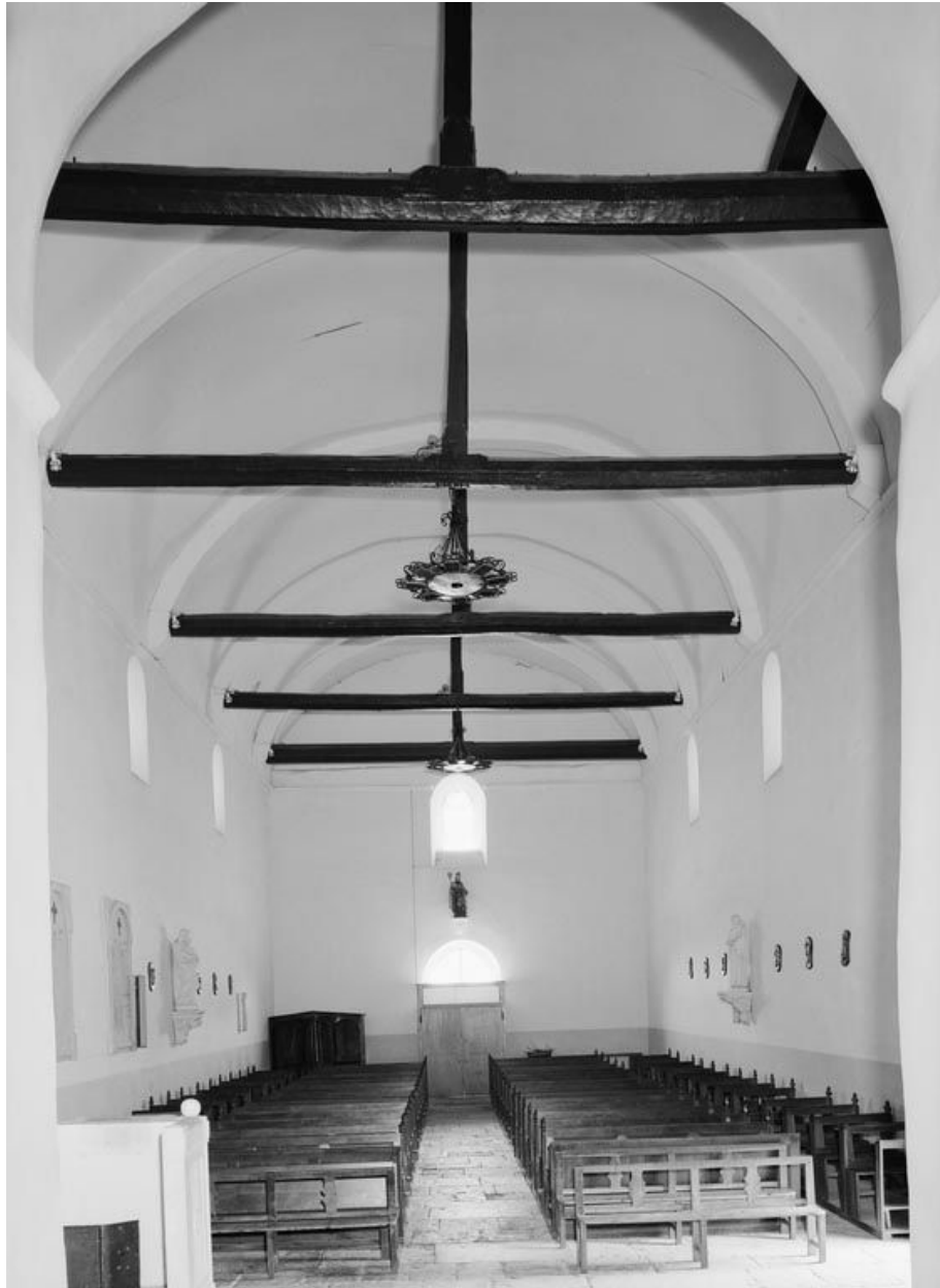
La nef, vue d'ensemble depuis la croisée du transept.