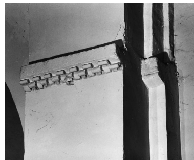
Arcade d'entrée du choeur : détail de l'imposte. IVR26_19815800259X