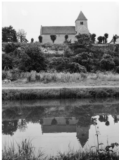
Vue d'ensemble depuis le canal.