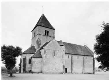
Élévation latérale gauche, vue prise du nord-est. IVR26_19815800244V