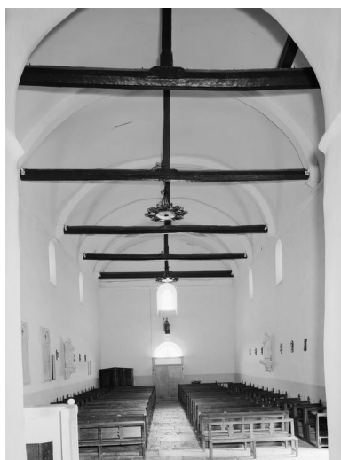
La nef, vue d'ensemble depuis la croisée du transept. IVR26_19815800255V