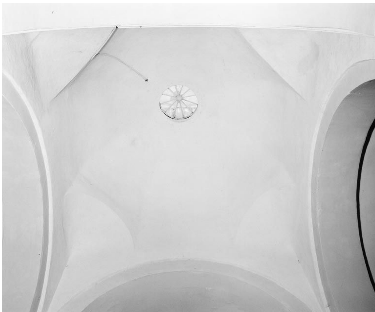
Détail de la voûte de la croisée du transept.