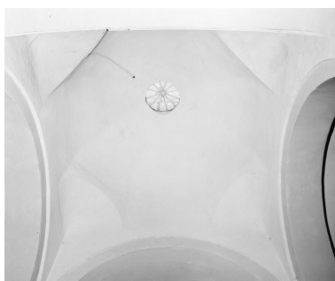
Détail de la voûte de la croisée du transept. IVR26_19815800258X