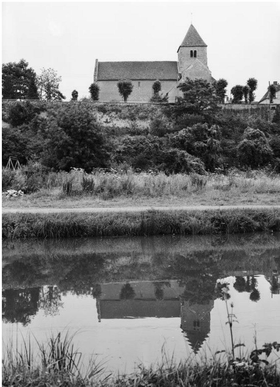
Vue d'ensemble depuis le canal.