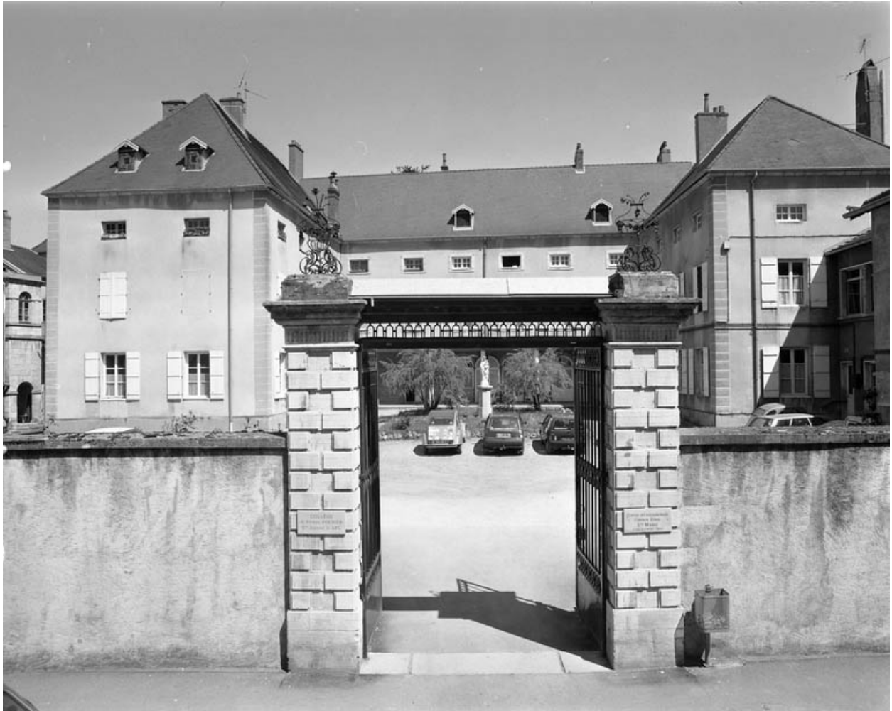
Vue d'ensemble depuis la rue.