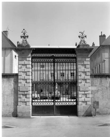
Détail du portail d'entrée, grille fermée.