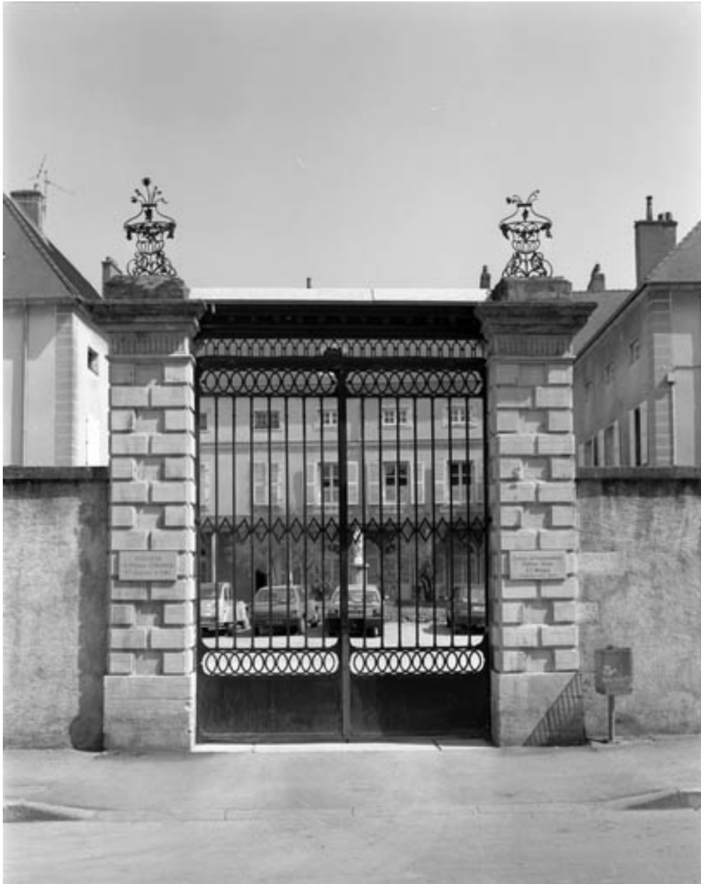
Détail du portail d'entrée, grille fermée.