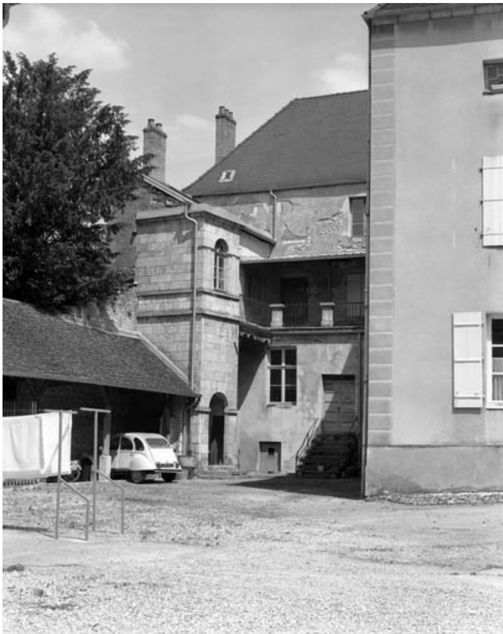
Façade antérieure : détail.