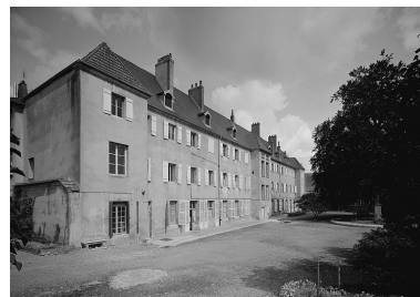
Façade postérieure de trois quarts gauche. IVR43_19897000474V