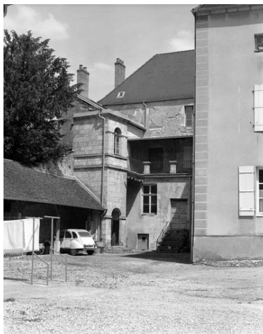
Façade antérieure : détail. IVR43_19897000475X