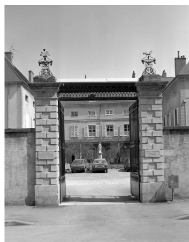
Détail du portail d'entrée, grille ouverte.