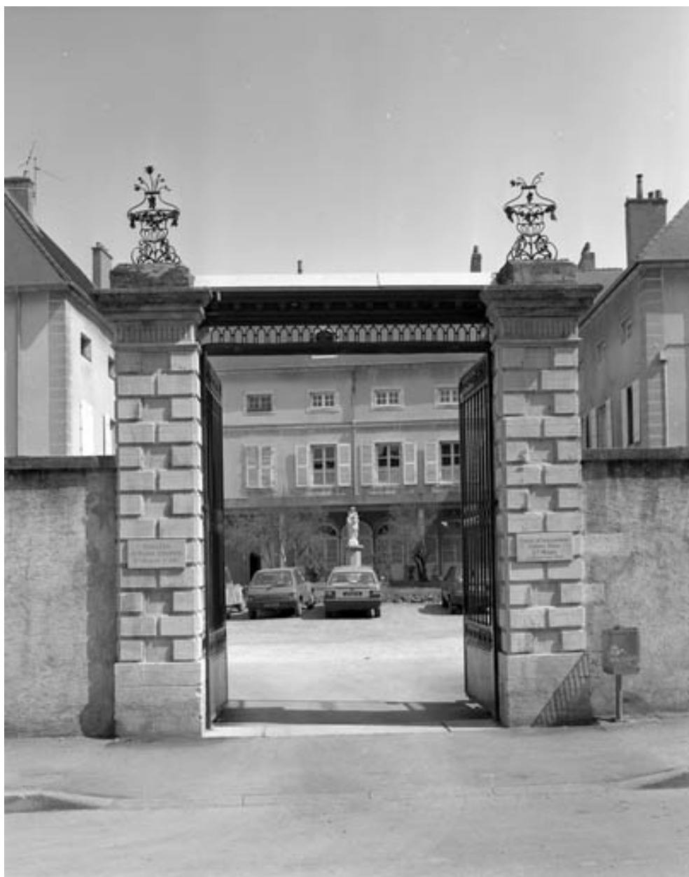
Détail du portail d'entrée, grille ouverte.