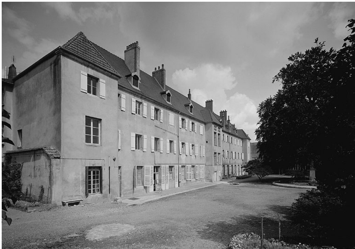
Façade postérieure de trois quarts gauche.