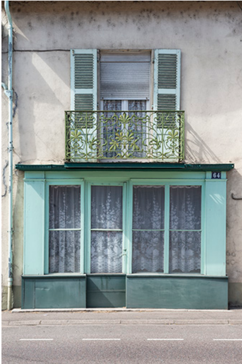
La devanture en bois.