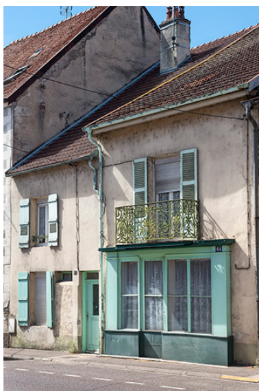
Ancienne boutique. IVR43_20177000831NUC4A