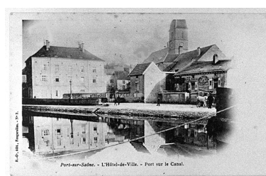
Les quais et un des négociants en vin, carte postale. IVR43_20177000933NUC1A