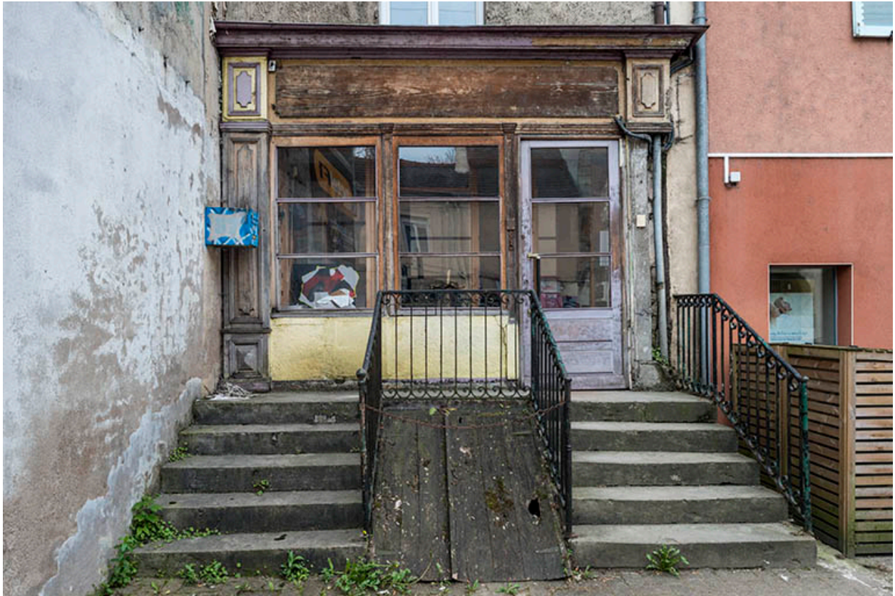
Ancienne boutique, rue F. Mitterrand.