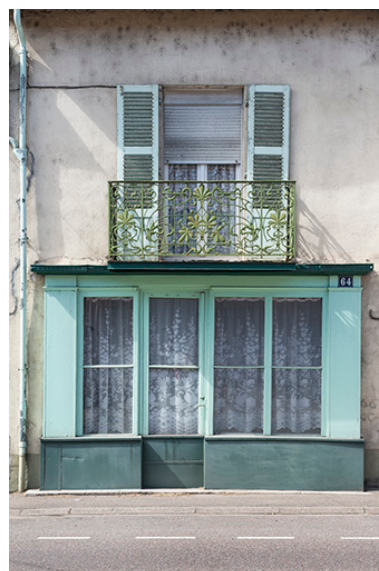
La devanture en bois.