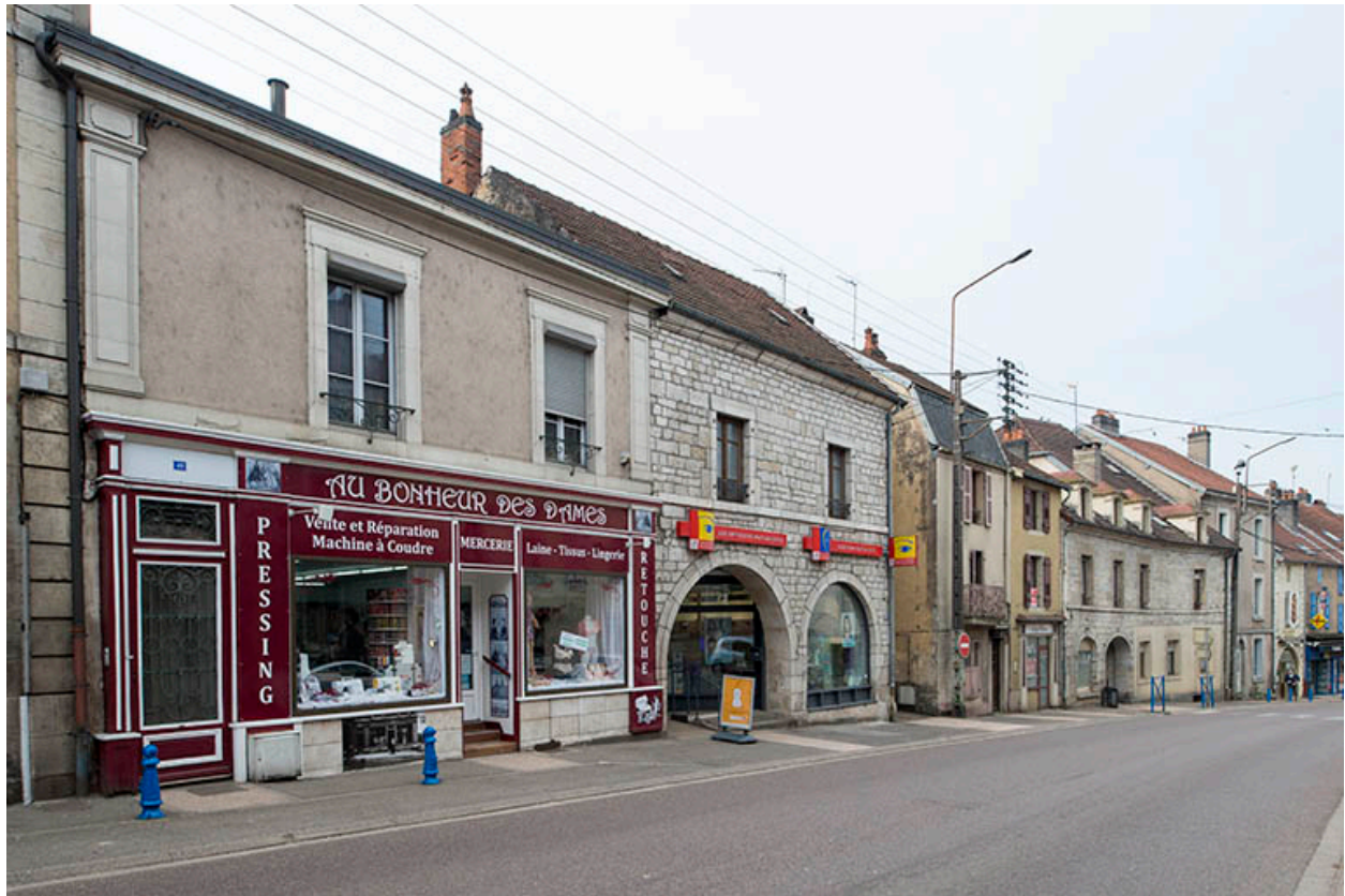
Vue actuelle du bas de la rue principale.