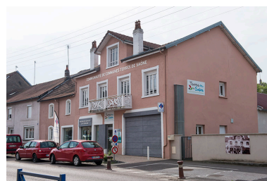
Ancienne station essence transformée en bureaux administratifs, rue F.Mitterrand. IVR43_20177000467NUC4A