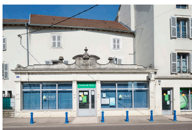
ancien commerce " le Progrès", situé en face de l'hôtel de ville. IVR43_20177000500NUC4A