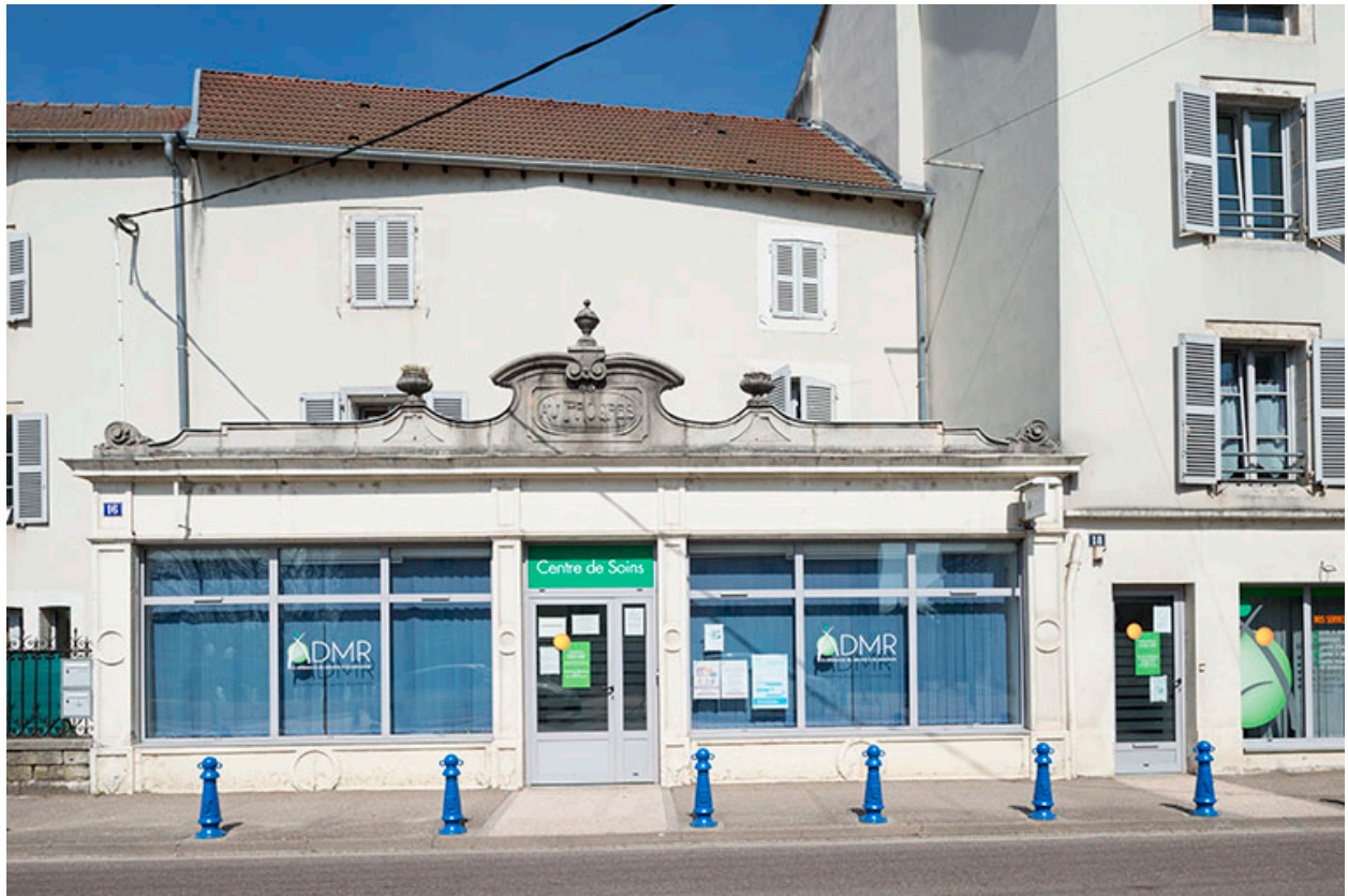
ancien commerce " le Progrès", situé en face de l'hôtel de ville.