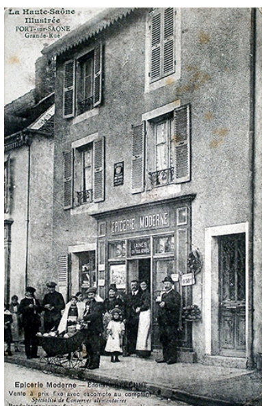
Épicerie dans la Grande rue carte postale. IVR43_20177000928NUC1A