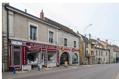
Vue actuelle du bas de la rue principale.