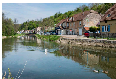
Les quais en amont de la porte de garde qui abritaient des marchands. IVR43_20177000710NUC4A