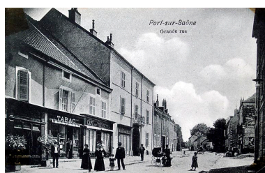
Boutiques le long de la Grande rue. carte postale. IVR43_20177000927NUC1A