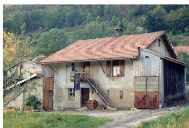
Façade antérieure. IVR43_19903900533ZA