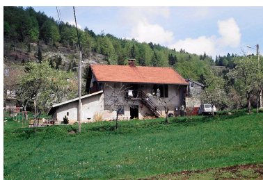
Vue générale. IVR43_19993900217ZA