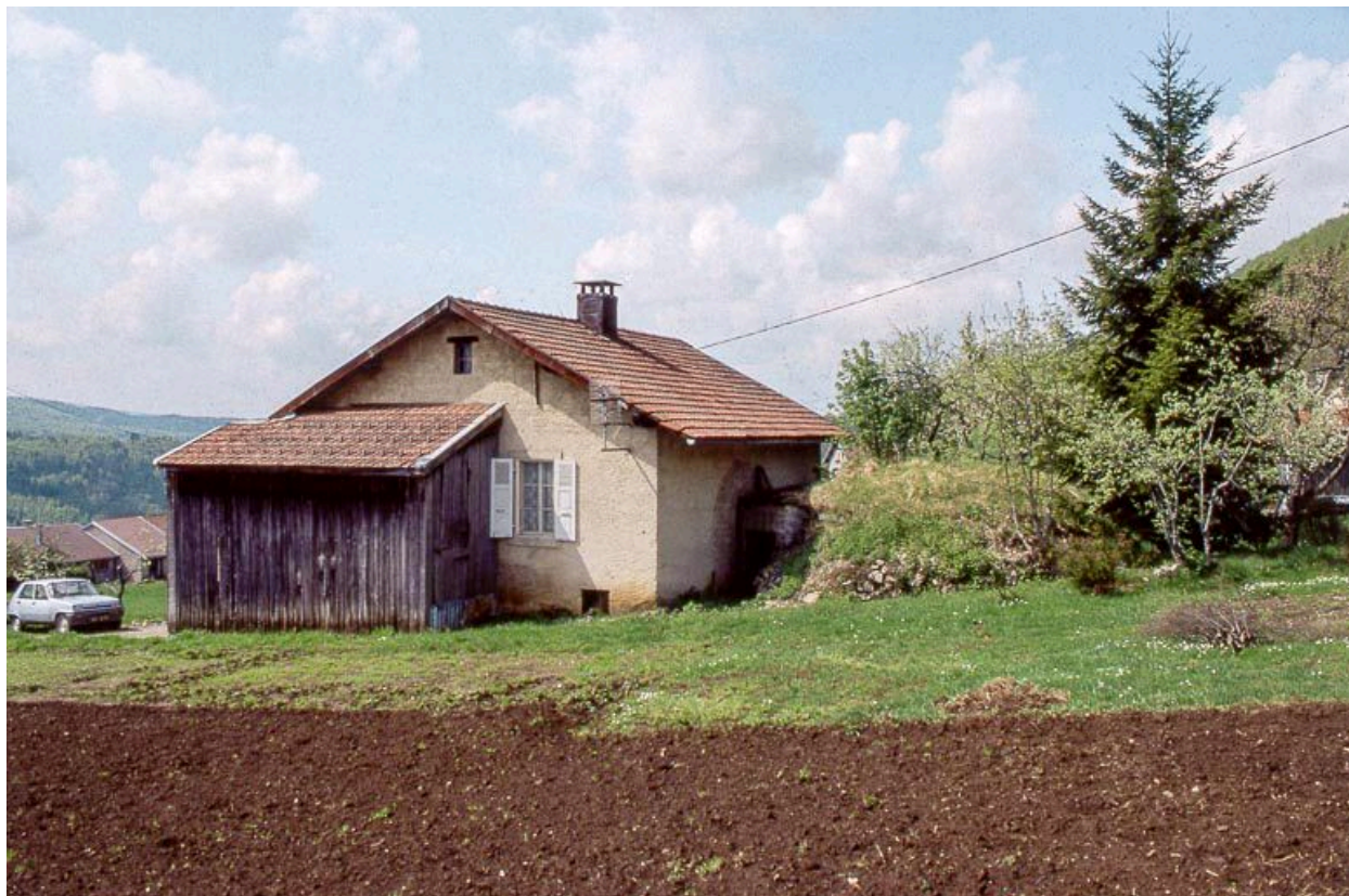
Façade postérieure et face droite.