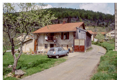
Façade antérieure. IVR43_19993900215ZA