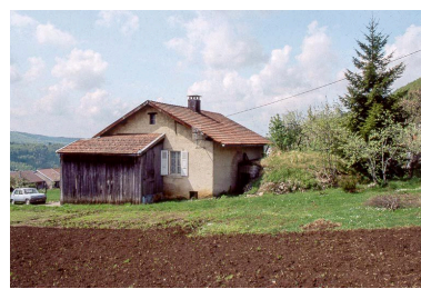
Façade postérieure et face droite.