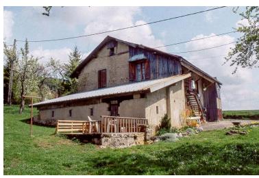
Face gauche. IVR43_19993900219ZA