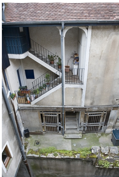
Vue plongeante sur l'escalier à cage ouverte depuis la parcelle voisine.