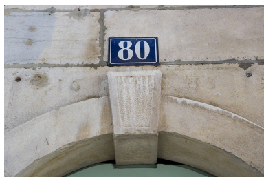
Détail de la date au-dessus de la porte d'entrée du couloir.