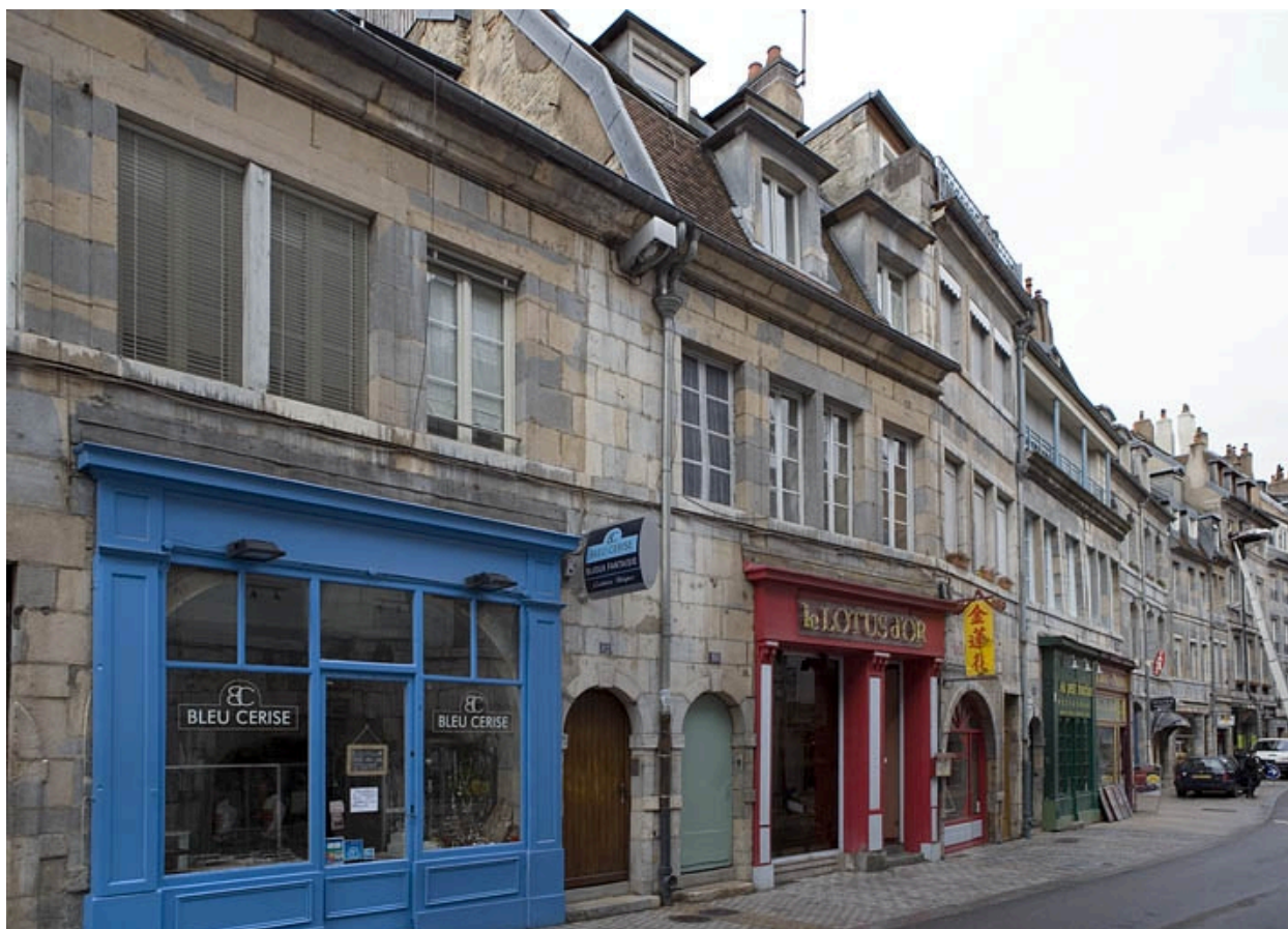
Vue d'ensemble depuis la rue de trois quarts gauche.