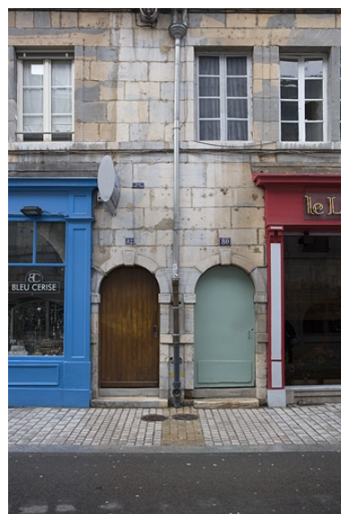
Façade sur rue : détail de la porte d'entrée du couloir. IVR43_20082500311NUC2A