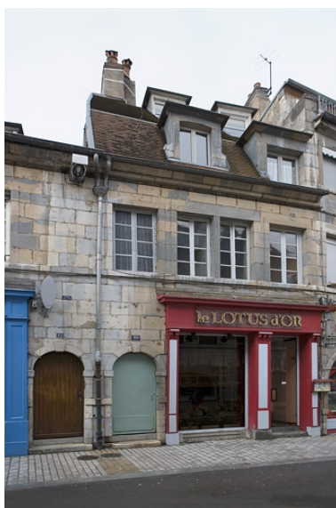
Vue rapprochée depuis la rue, de trois quarts gauche. IVR43_20082500313NUC2A