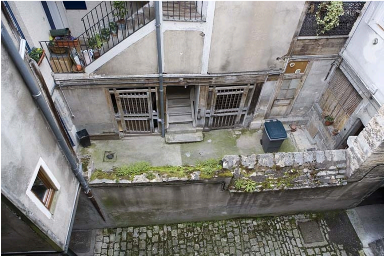
Vue plongeante sur la cour depuis la parcelle voisine.