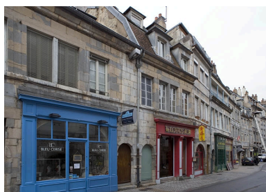
Vue d'ensemble depuis la rue de trois quarts gauche. IVR43_20082500312NUC2A