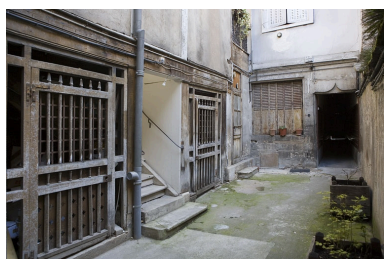
Détail des bûchers et du rez-de-chaussée de la façade postérieure du logis principal.