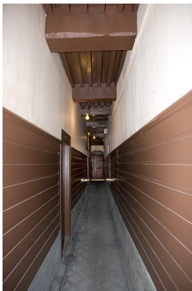
Détail du couloir à gauche du logis principal donnant accès à la première cour.