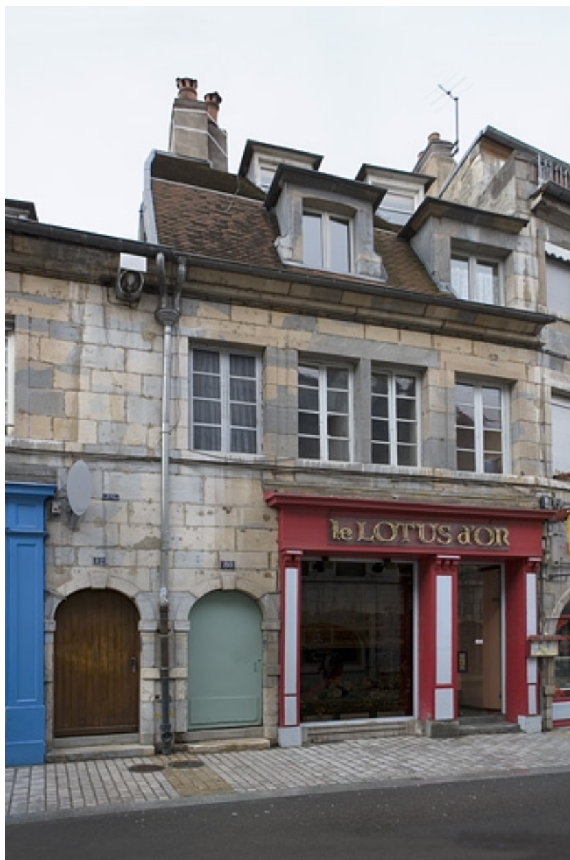
Vue rapprochée depuis la rue, de trois quarts gauche.