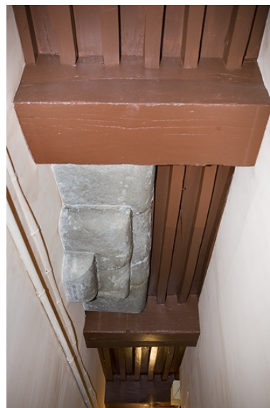
Détail de l'encorbellement en pierre de taille situé dans le premier couloir.