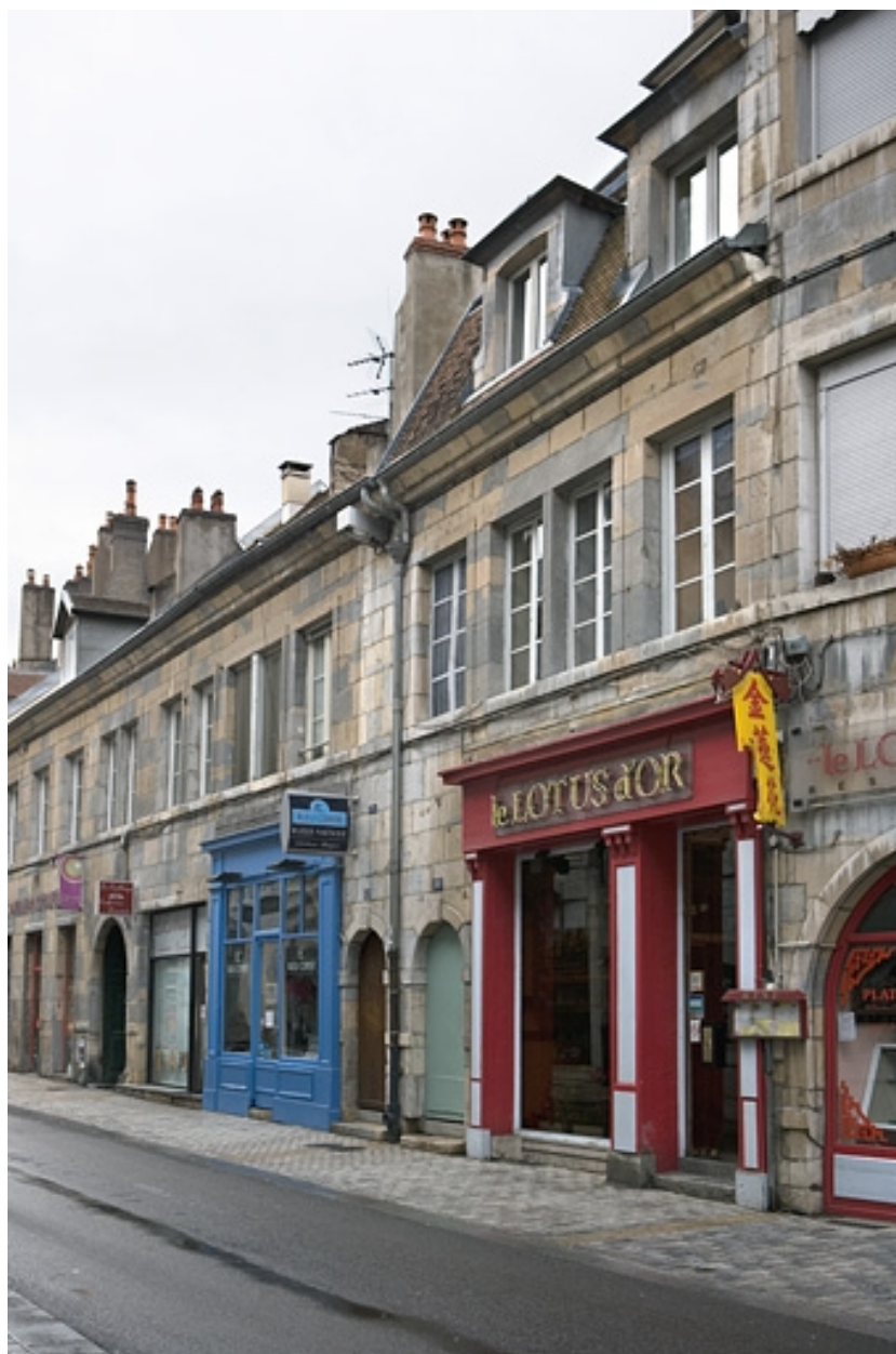
Vue d'ensemble depuis la rue de trois quarts droit.