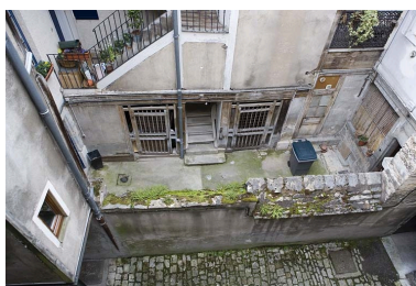
Vue plongeante sur la cour depuis la parcelle voisine.