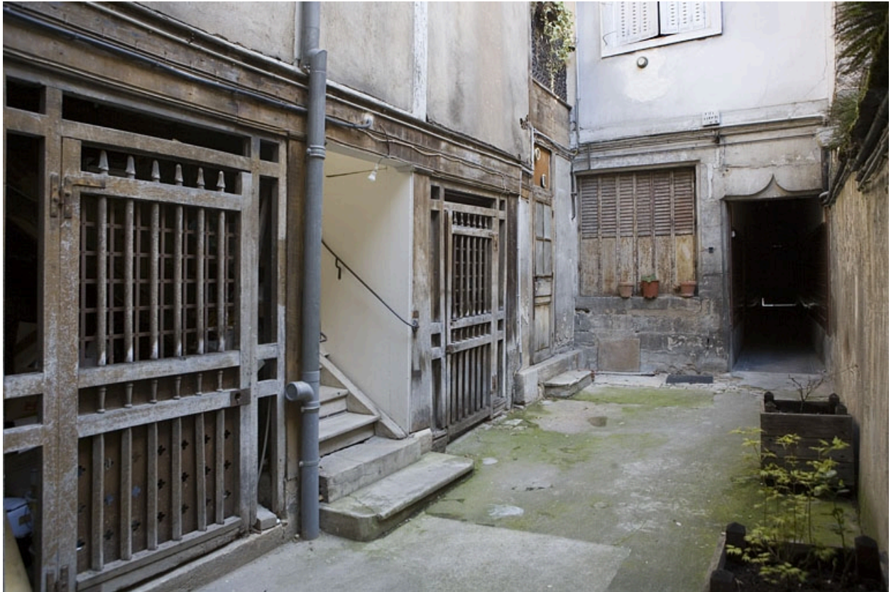
Détail des bûchers et du rez-de-chaussée de la façade postérieure du logis principal.