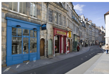
Vue éloignée de la maison dans l'alignement de la rue.