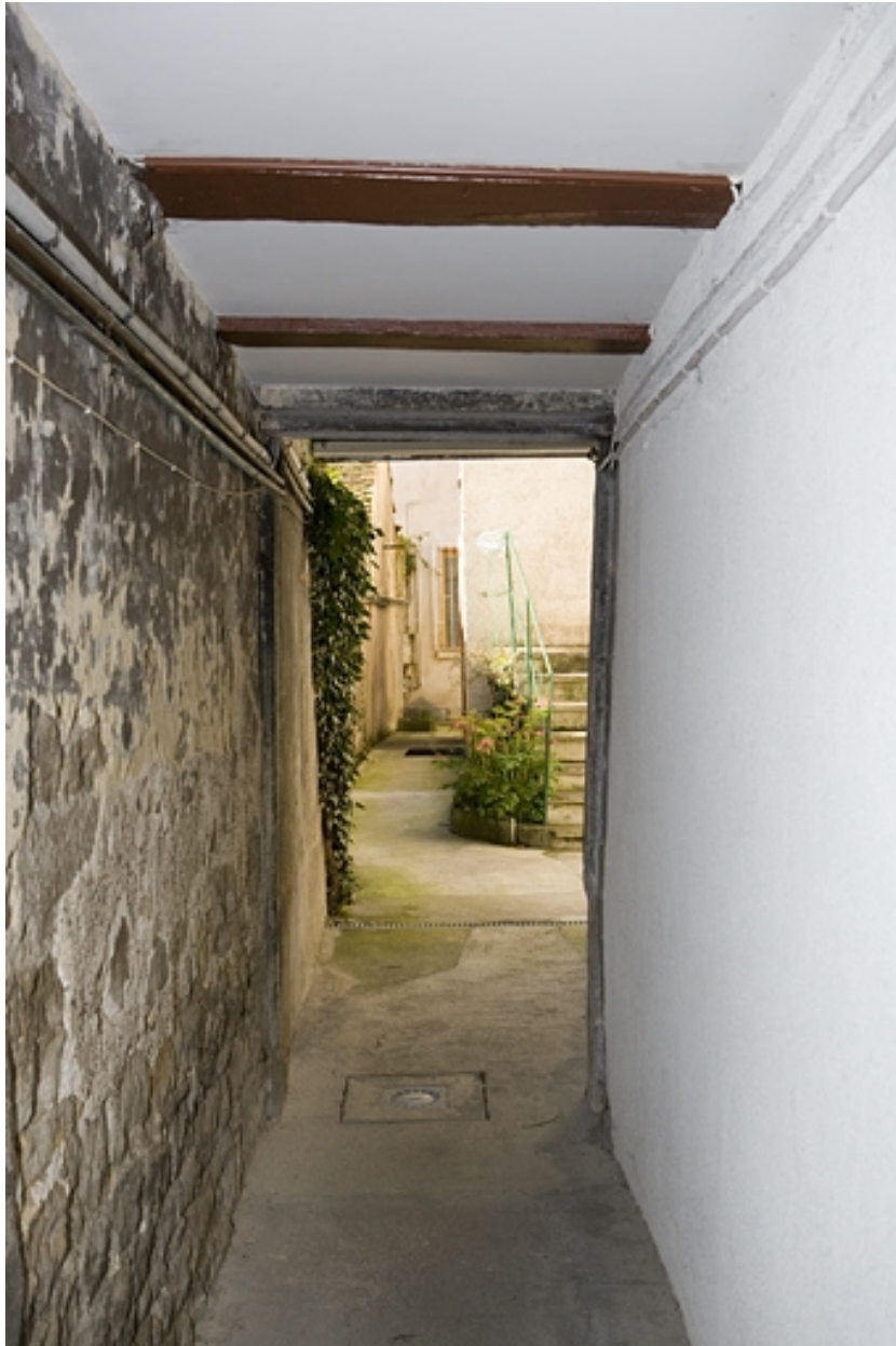
Détail du couloir à gauche du logis secondaire donnant accès à la deuxième cour.