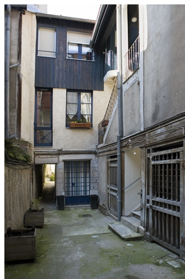
Vue d'ensemble de la façade antérieure du logis secondaire.