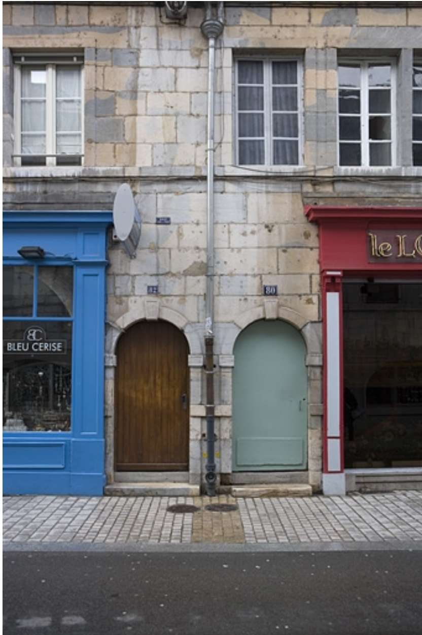
Façade sur rue : détail de la porte d'entrée du couloir.