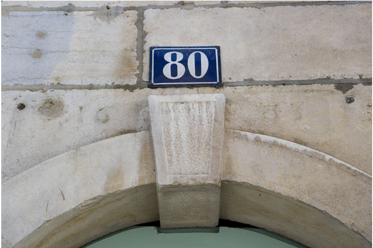
Détail de la date au-dessus de la porte d'entrée du couloir.