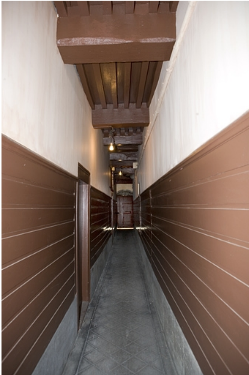
Détail du couloir à gauche du logis principal donnant accès à la première cour.