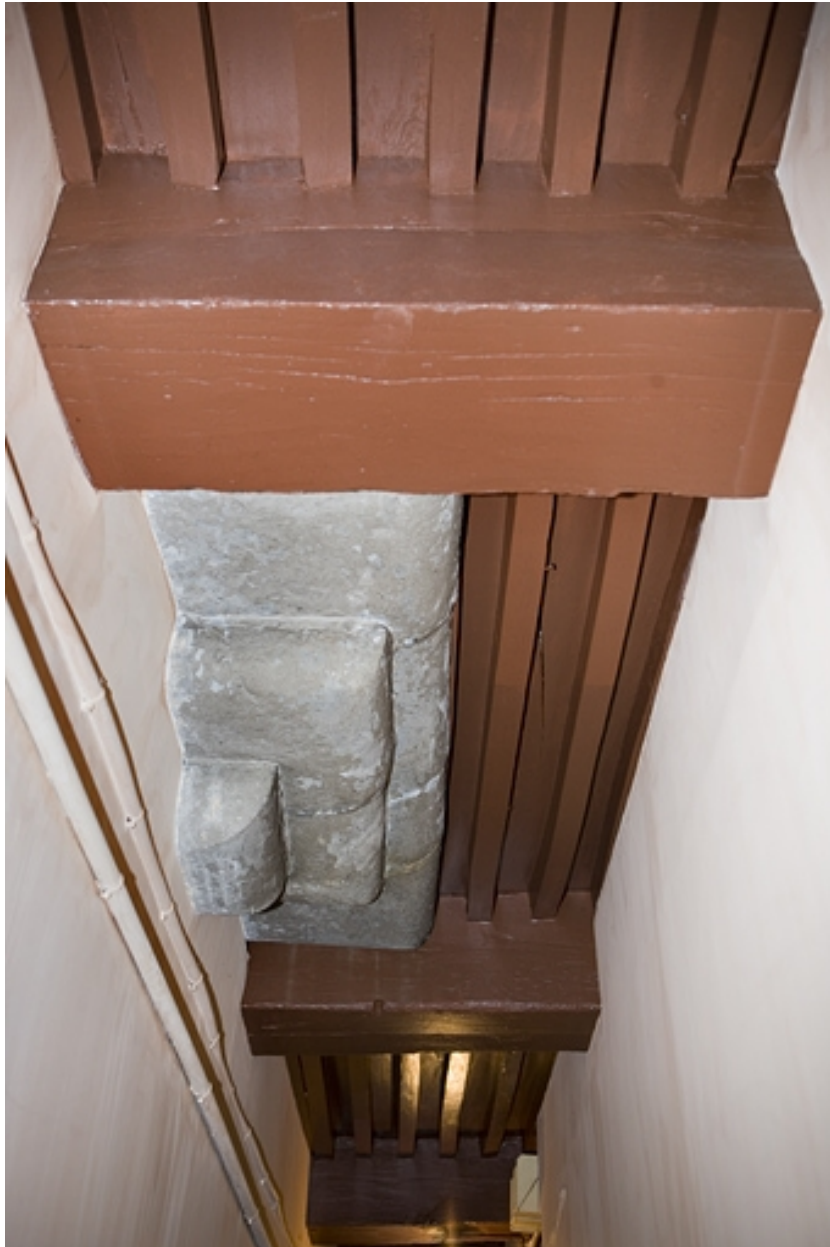
Détail de l'encorbellement en pierre de taille situé dans le premier couloir.