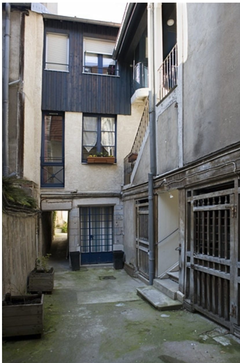
Vue d'ensemble de la façade antérieure du logis secondaire.