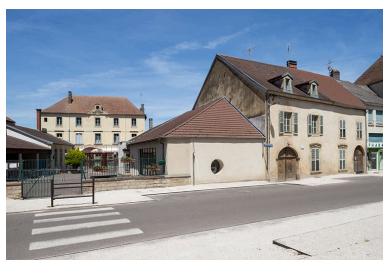
Pignon gauche avec l'école voisine. IVR43_20217000391NUC4A