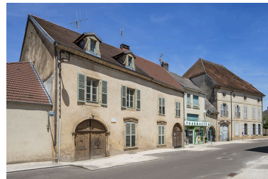
Le bâtiment de trois quarts gauche dans son contexte.