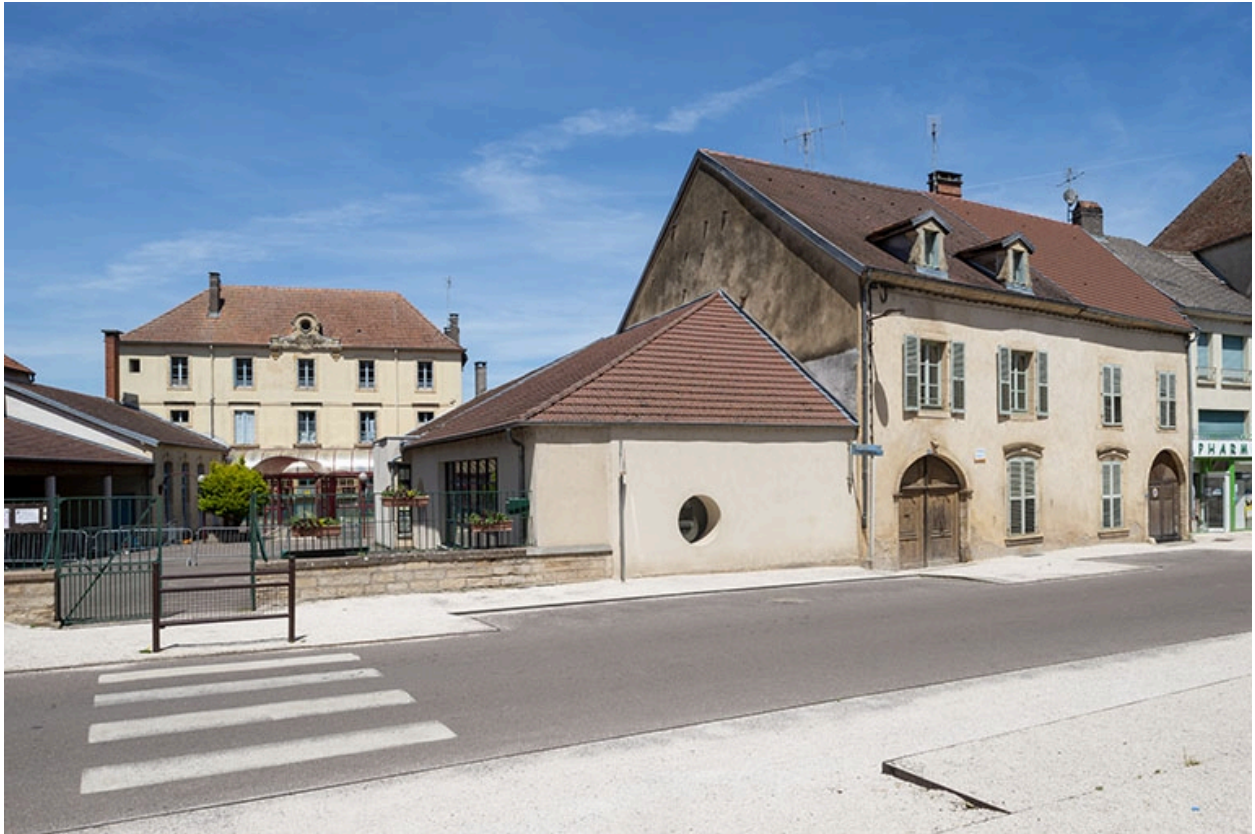
Pignon gauche avec l'école voisine.