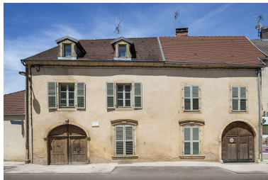
Façade antérieure. IVR43_20217000389NUC4A

IVR43_20257000047NUDA