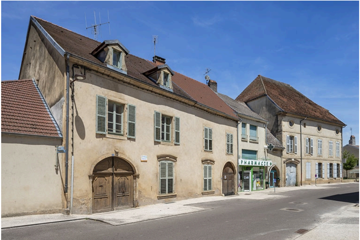
Le bâtiment de trois quarts gauche dans son contexte.