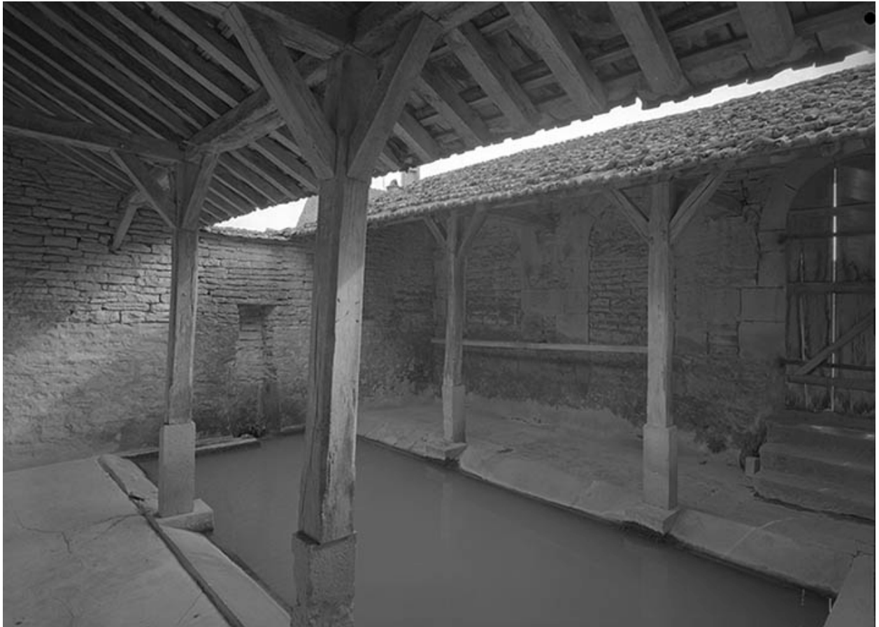
Vue intérieure. Bassin et charpente.