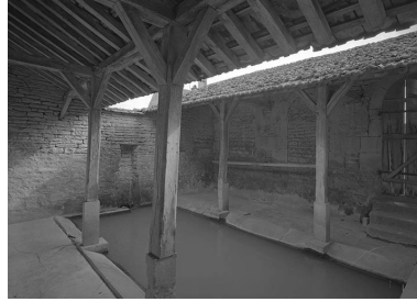
Vue intérieure. Bassin et charpente. IVR26_19748900144V