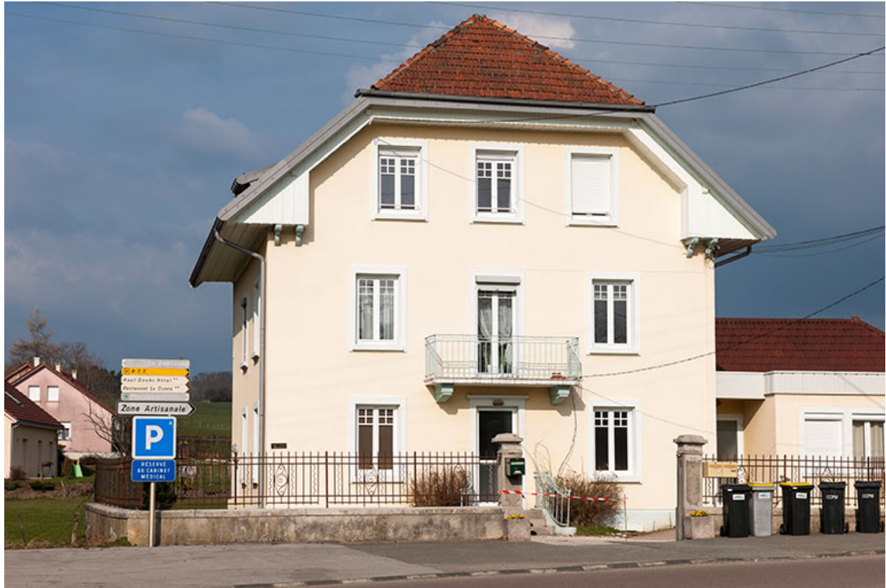
Façade antérieure du logement patronal.