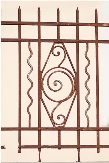
Motif de la grille de clôture. IVR43_20142500196NUC4A