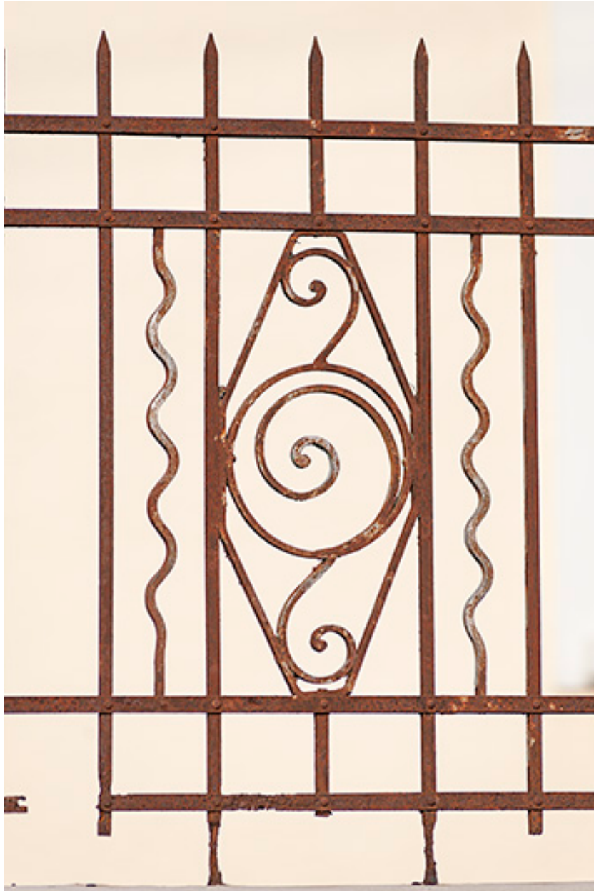
Motif de la grille de clôture.