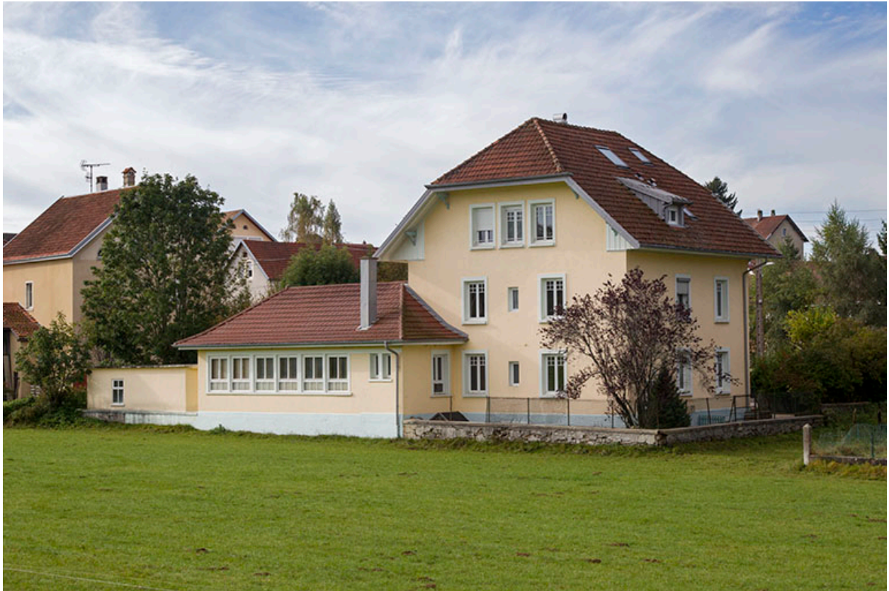
Vue d'ensemble, depuis le nord (façades postérieure et latérale gauche).