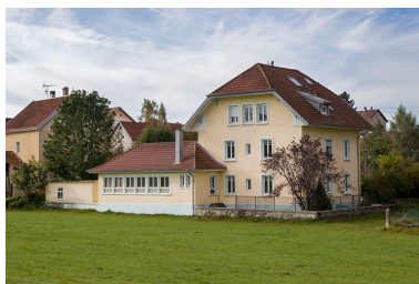
Vue d'ensemble, depuis le nord (façades postérieure et latérale gauche). IVR43_20122502238NUC2A