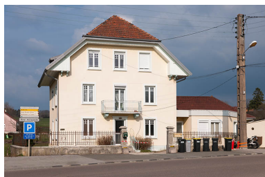
Vue d'ensemble, depuis l'ouest (façade antérieure). IVR43_20142500195NUC4A