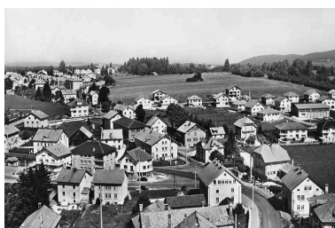
En avion au-dessus de... 7. Charquemont (Doubs) [vue aérienne des rues de la Gare, Victor Hugo et des Villas depuis le sud], entre 1958 et 1967. Autr. auteur inconnu IVR43_20132500074NUC1A