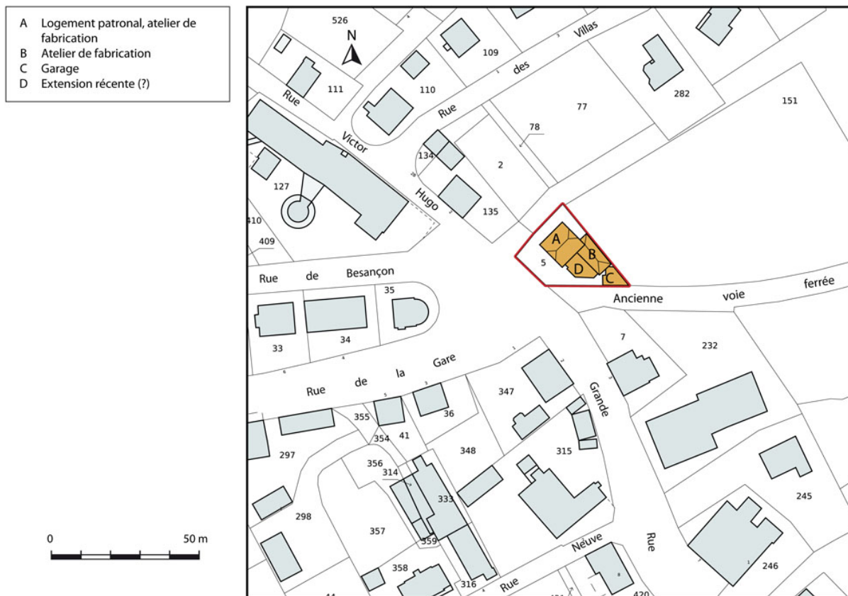
Plan-masse et de situation. Extrait du plan cadastral, 2015, section AC.