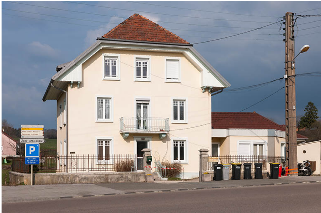
Vue d'ensemble, depuis l'ouest (façade antérieure).