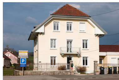
Façade antérieure du logement patronal. IVR43_20142500194NUC4A