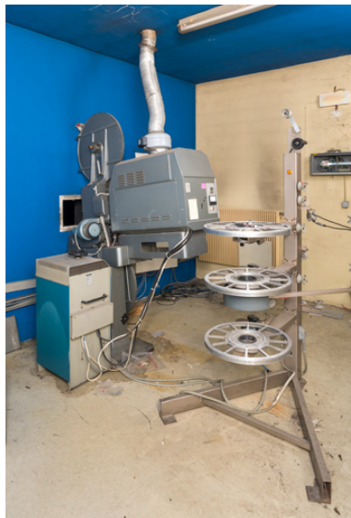
Redresseur Irem N3-X75/95DM, projecteur Cinemeccanica Victoria 8 r et enrouleur-dérouleur de film ST200.

IVR26_20257100986NUC4A