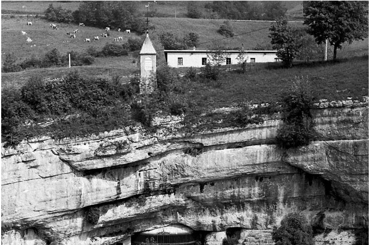
Vue d'ensemble du site.