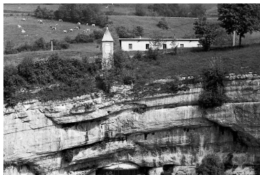
Vue d'ensemble du site. IVR43_19752500649X