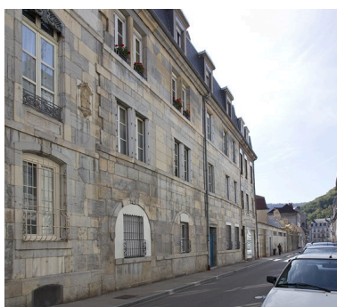
Vue d'ensemble depuis la rue, de trois quarts gauche.