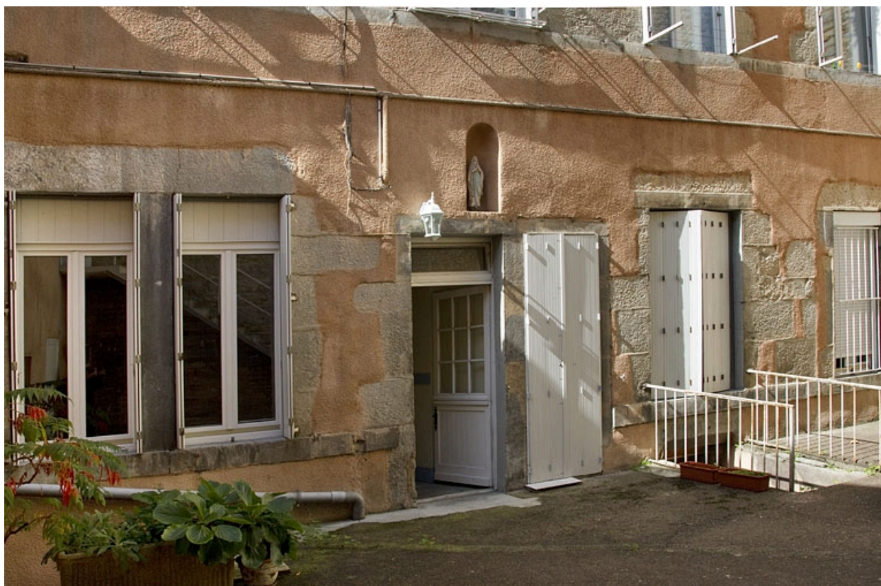
Logis principal, façade postérieure : détail du rez-de-chaussée, de trois quarts gauche.