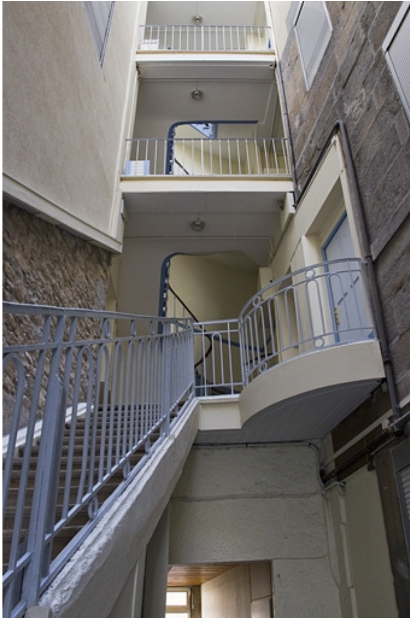
Logis principal, escalier : détail de la partie supérieure.