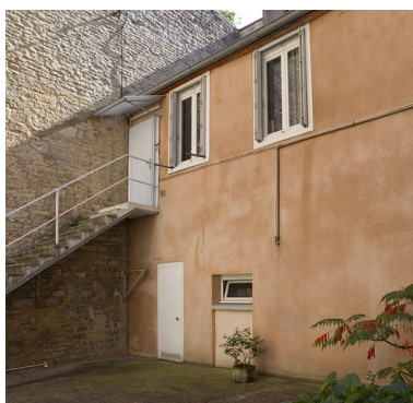
Vue d'ensemble du logis secondaire, de trois quarts droit. IVR43_20112502893NUC2A