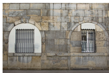
Logis principal, façade antérieure, rez-de-chaussée : détail des arcades boutiquières murées.