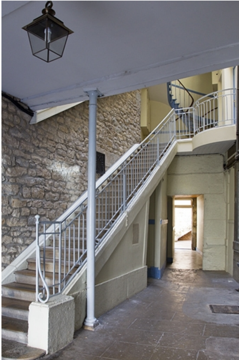
Logis principal : vue d'ensemble de l'escalier.