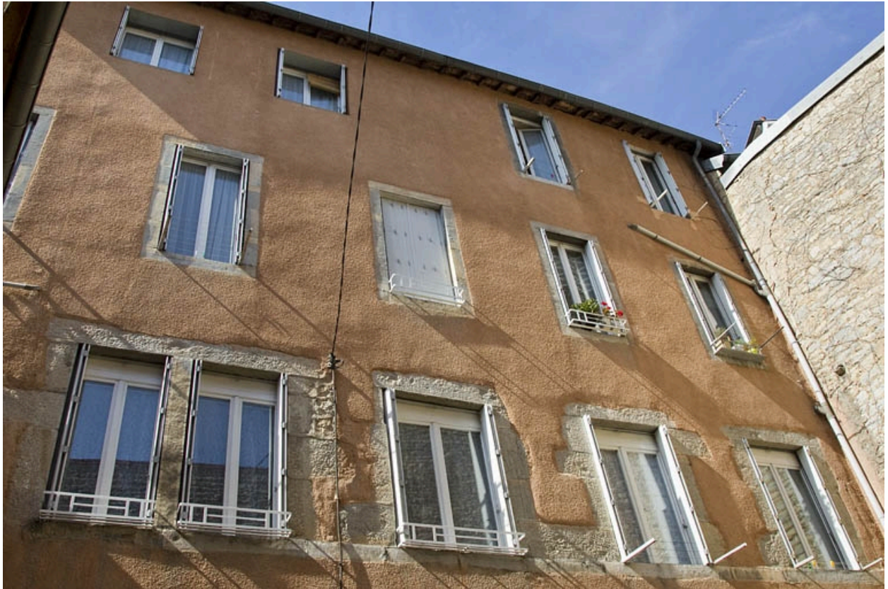
Logis principal : vue d'ensemble de la façade postérieure.