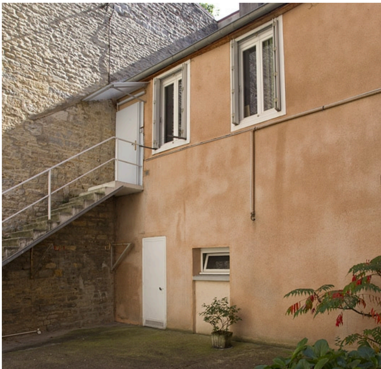
Vue d'ensemble du logis secondaire, de trois quarts droit.