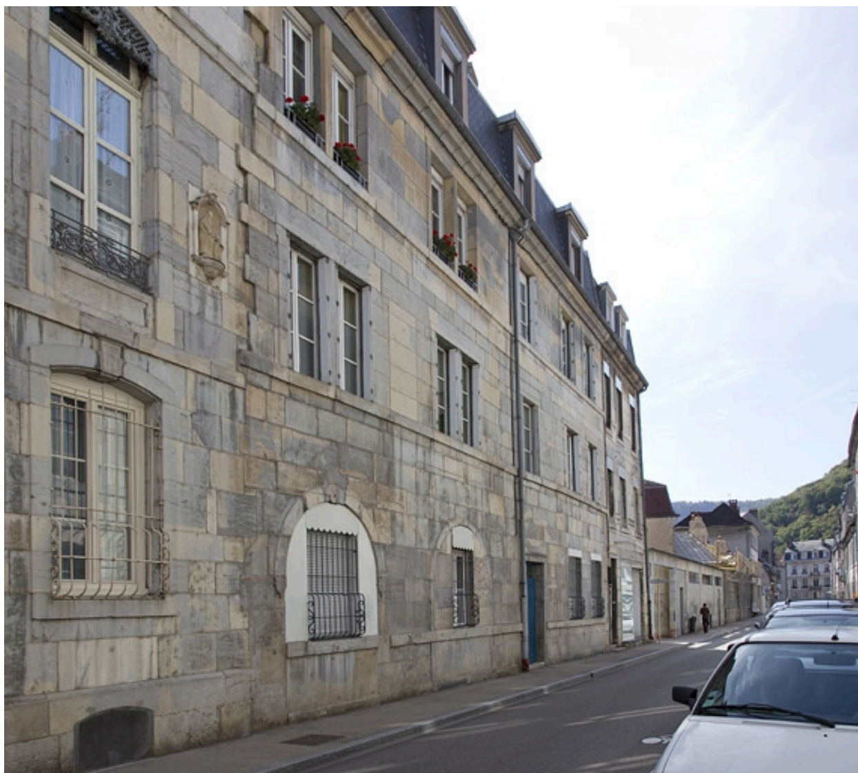
Vue d'ensemble depuis la rue, de trois quarts gauche.