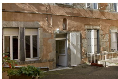
Logis principal, façade postérieure : détail du rez-de- chaussée, de trois quarts gauche. IVR43_20112502898NUC2A