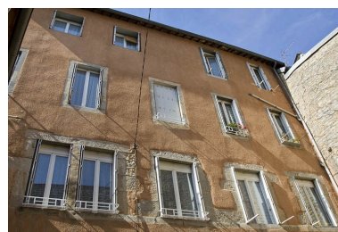
Logis principal : vue d'ensemble de la façade postérieure. IVR43_20112502897NUC2A