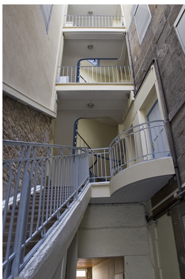
Logis principal, escalier : détail de la partie supérieure. IVR43_20112502896NUC2A