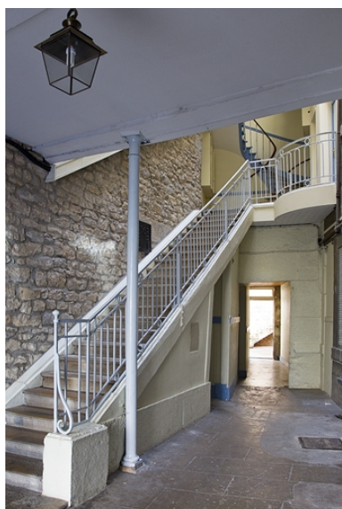
Logis principal : vue d'ensemble de l'escalier. IVR43_20112502895NUC2A