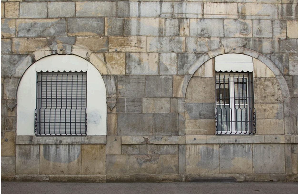
Logis principal, façade antérieure, rez-de-chaussée : détail des arcades boutiquières murées.