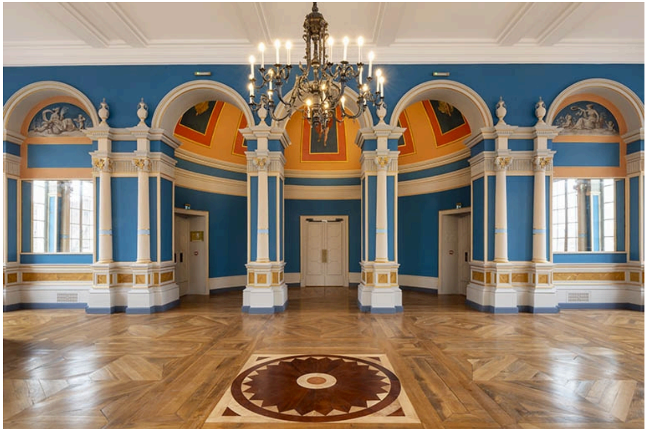
Vue d'ensemble du foyer, en direction de la salle, montrant le Printemps à droite et l'Eté à gauche.