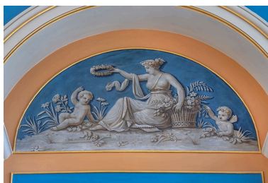
Le Printemps.