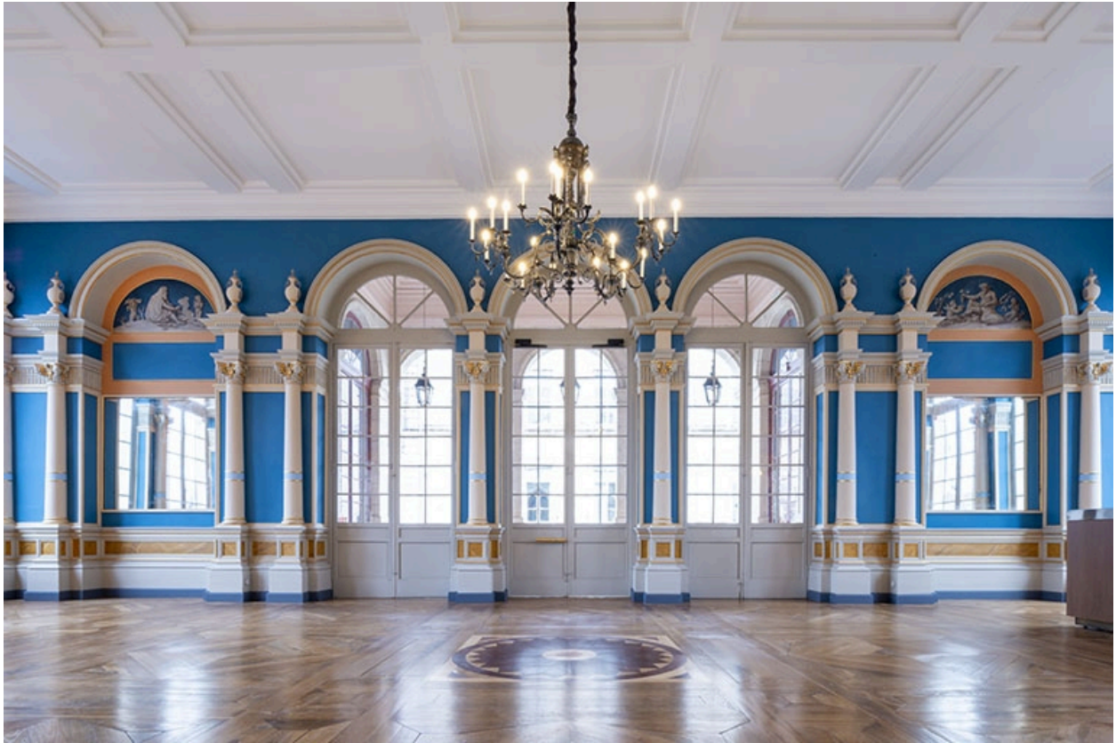
Vue d'ensemble du foyer, en direction de la loggia, montrant l'Automne à droite et l'Hiver à gauche.