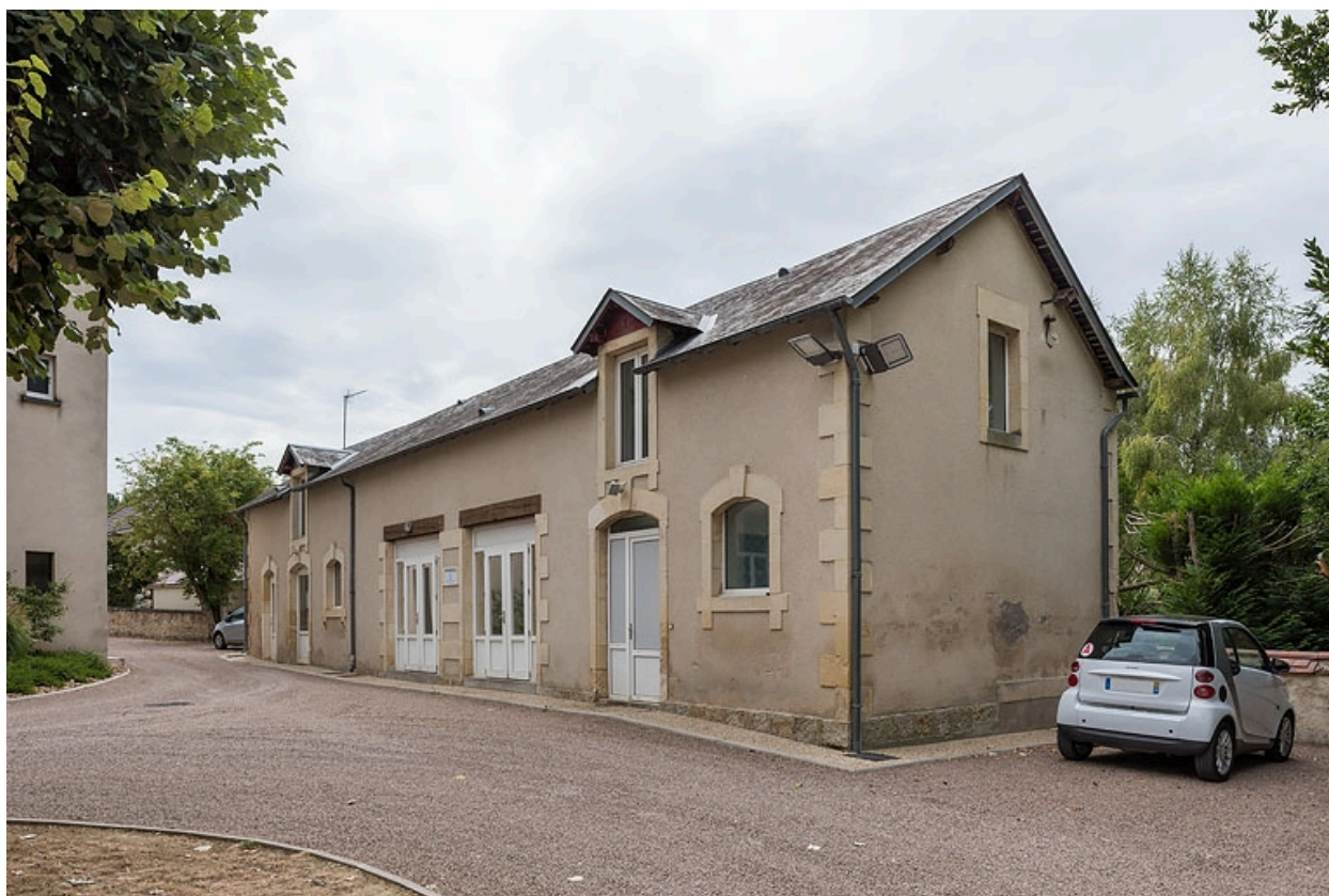
Vue d'ensemble des dépendances.