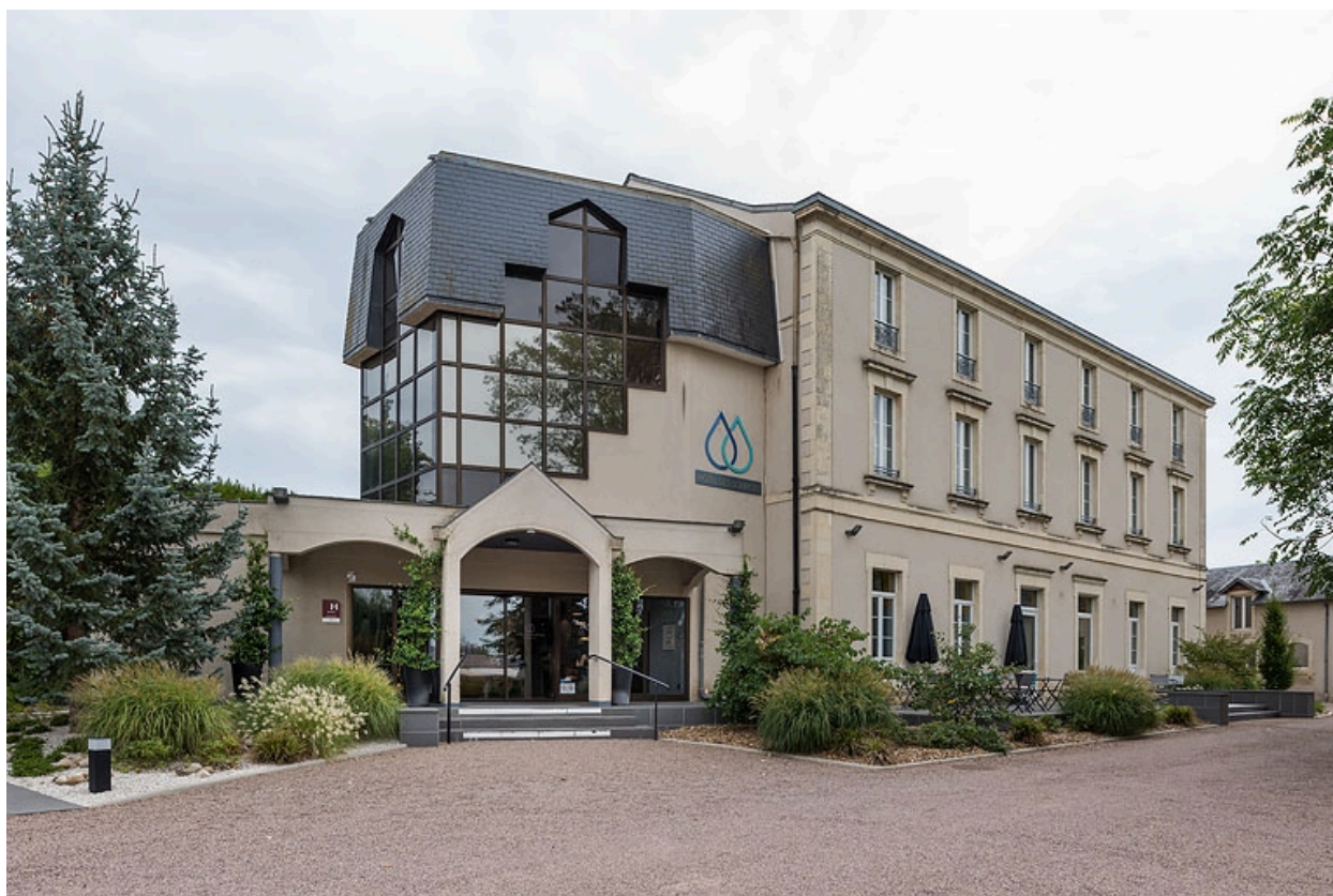
Façade après les travaux de modernisation de 2017.