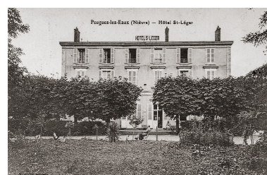
Façade après l'ajout d'un second étage carré. Autr. auteur inconnu IVR26_20195800768NUC4A