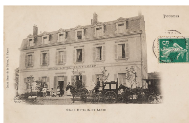
Façade avant l'ajout d'un second étage carré. IVR26_20205800065NUC4A