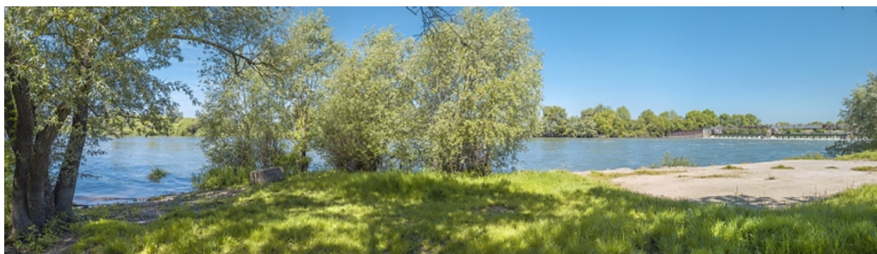
Vue d'ensemble du barrage dans son environnement, vu d'aval.