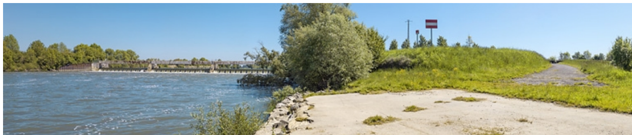
Vue d'ensemble du barrage dans son environnement, vu d'aval.