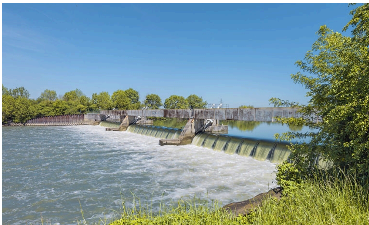
Vue d'ensemble du barrage, vu depuis la dérivation de Seurre.