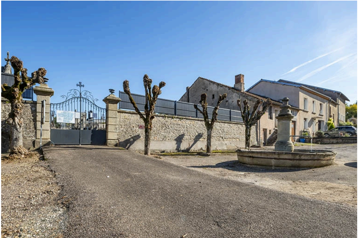
Vue depuis le nord-ouest de l'entrée et de l'enceinte du cimetière rue Charles-Bontemps.