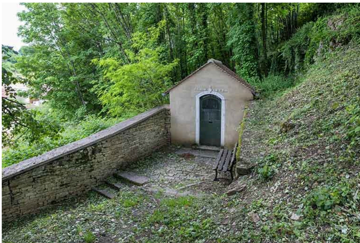
Chapelle de la sainte famille : vue en contrebas de la terrasse et de la façade.