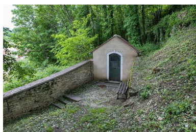
Chapelle de la sainte famille : vue en contrebas de la terrasse et de la façade.