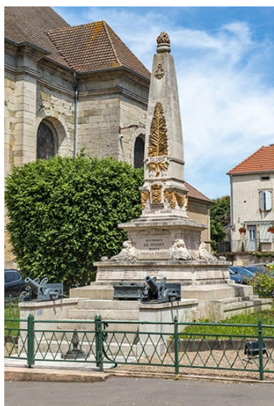
Monument aux morts vu de trois-quart droit. IVR43_20217000375NUC4A