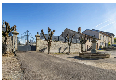
Vue depuis le nord-ouest de l'entrée et de l'enceinte du cimetière rue Charles-Bontemps. IVR43_20217000662NUC4A