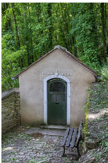
Vue de la façade antérieure de la chapelle de la sainte famille.