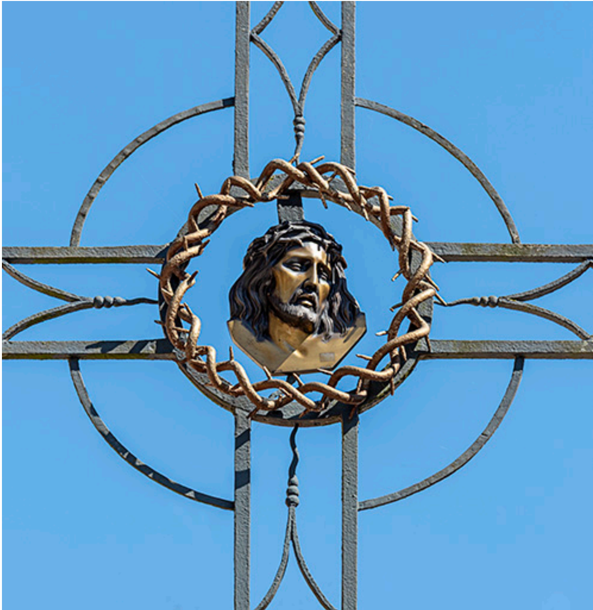
Croix monumentale de la place de la République, détail du visage du Christ.