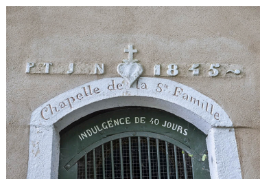
Chapelle de la sainte famille : détail du linteau de l'entrée et des inscriptions.