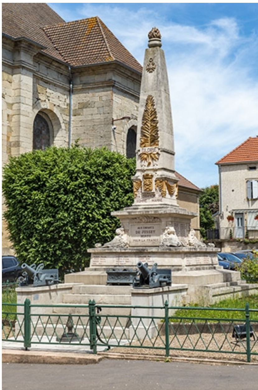
Monument aux morts vu de trois-quart droit.