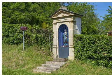
Oratoire saint Vincent. IVR43_20217000314NUC4A