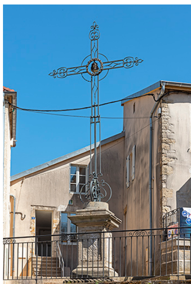
Croix monumentale de la place de la République. IVR43_20257000030NUC4A