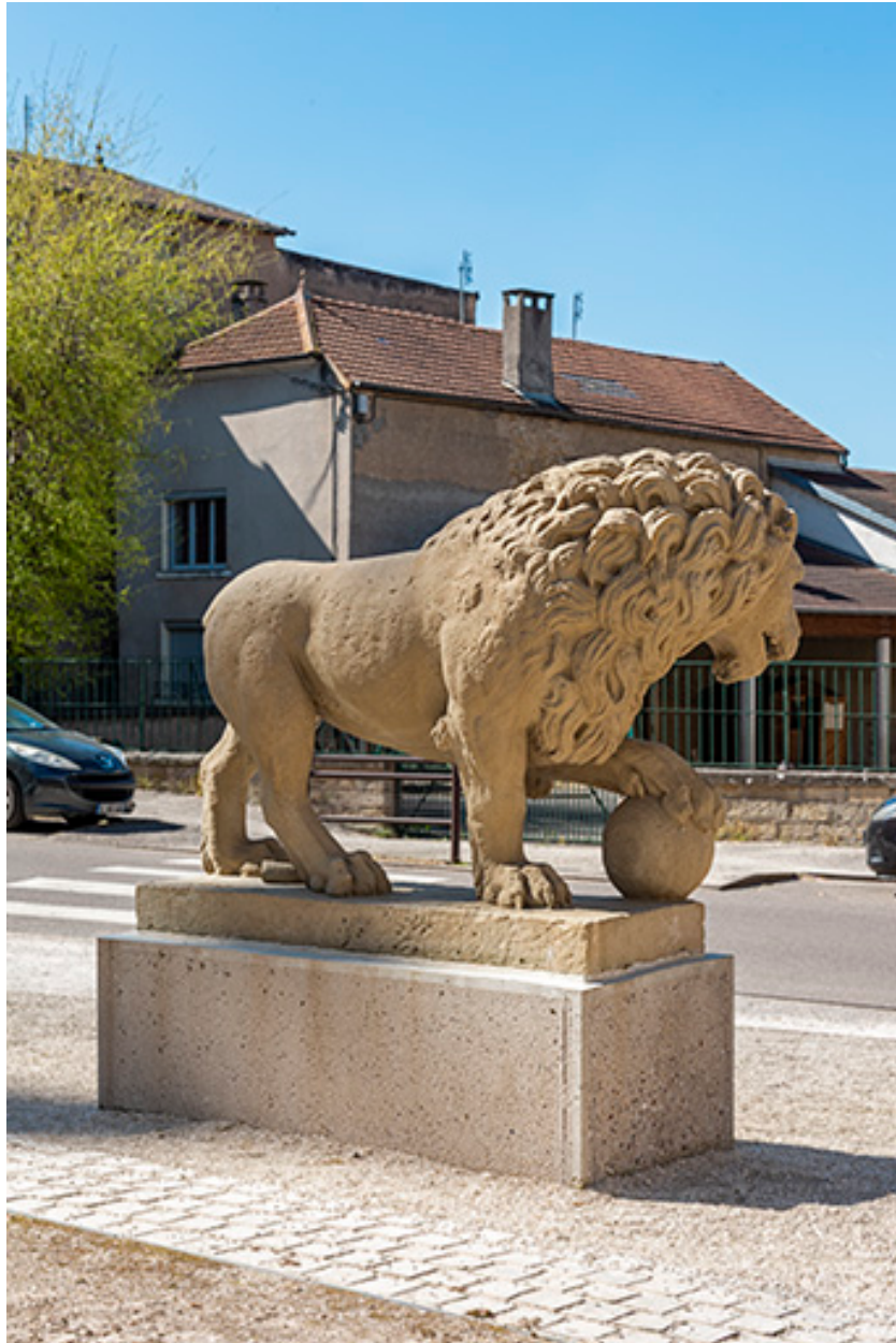
Le lion sculpté dans la rue de l'Hôtel-de-Ville, de l'arrière.