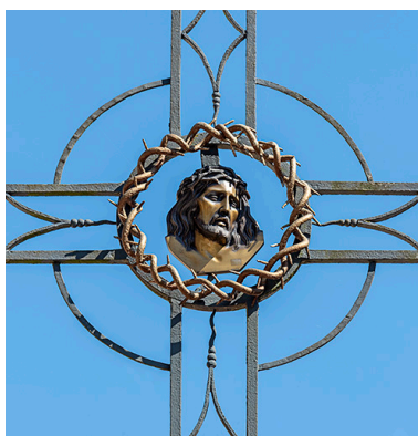
Croix monumentale de la place de la République, détail du visage du Christ. IVR43_20257000031NUC4A