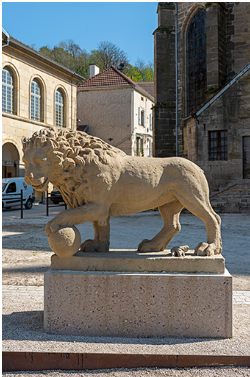
Le lion de la rue de l'Hôtel-de-Ville, de face.