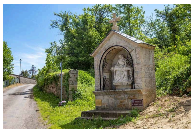
Pietà, vue de trois quarts droit. IVR43_20217000306NUC4A