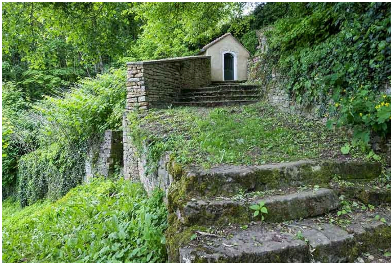
Chapelle de la sainte famille : vue d'ensemble.