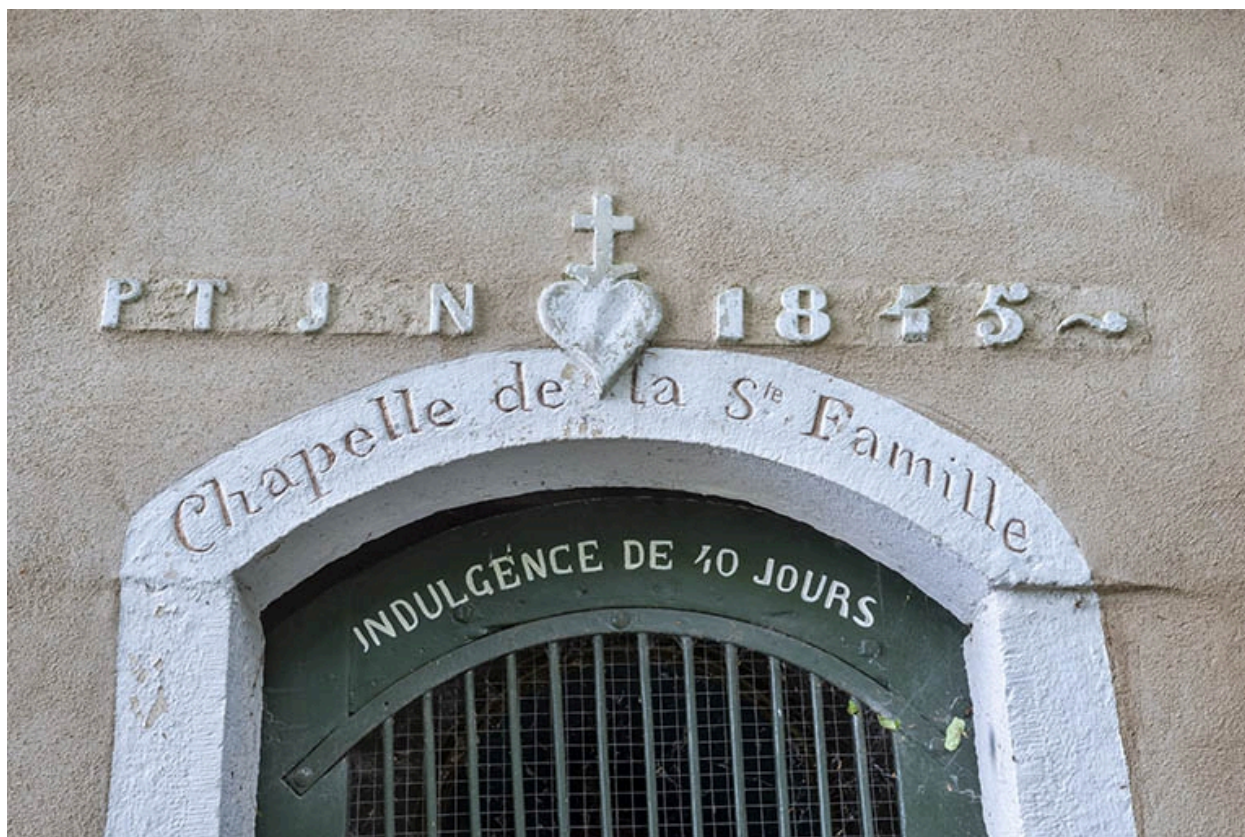
Chapelle de la sainte famille : détail du linteau de l'entrée et des inscriptions.