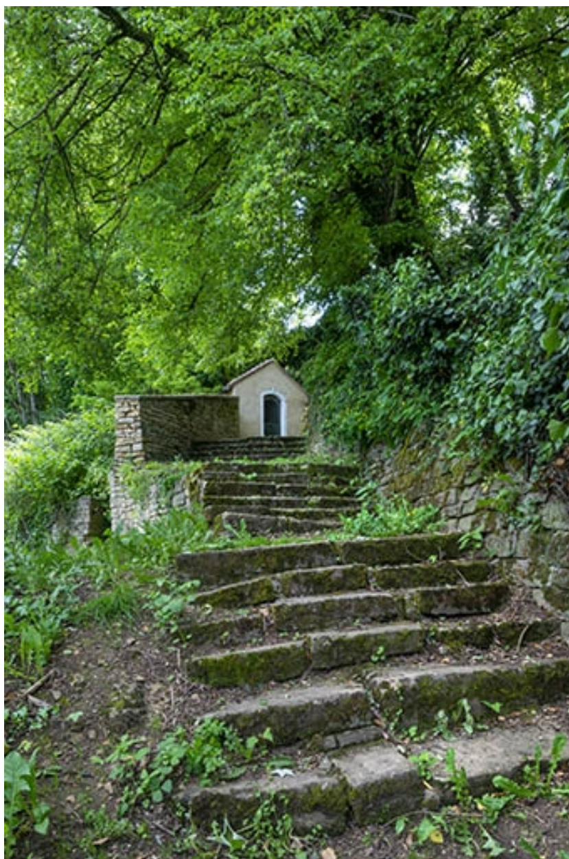
Chapelle de la sainte famille : vue éloignée au sommet de l'escalier.