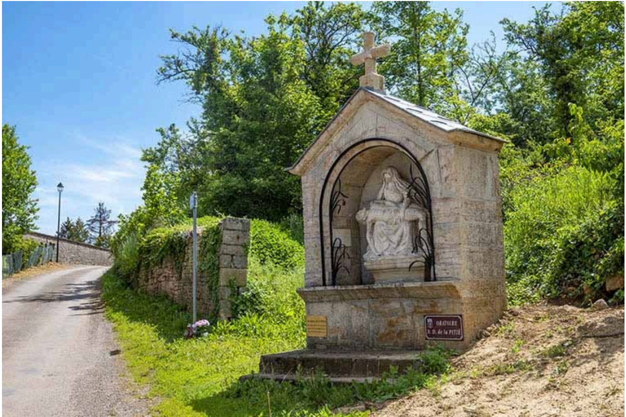
Pietà, vue de trois quarts droit.