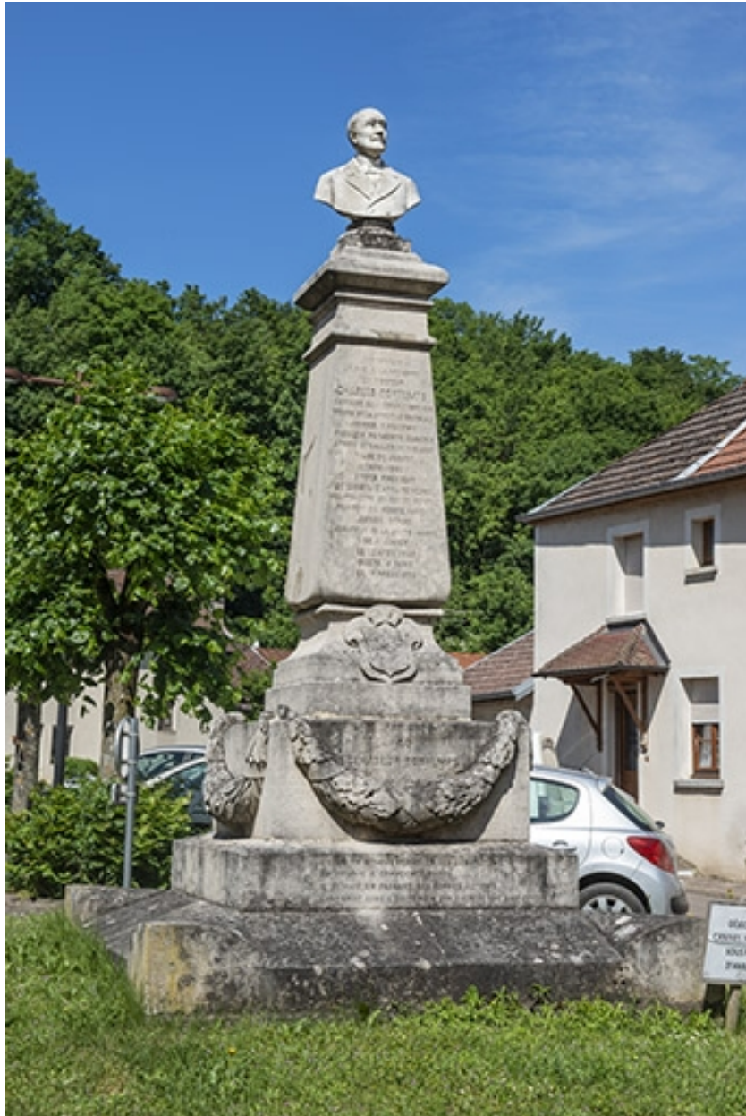
Monument élevé à la mémoire de Charles Bontemps, vu de trois-quart gauche.