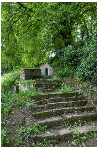
Chapelle de la sainte famille : vue éloignée au sommet de l'escalier. IVR43_20217000323NUC4A