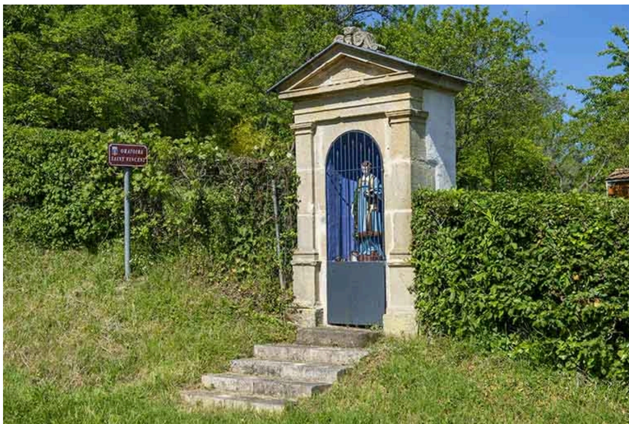
Oratoire saint Vincent.