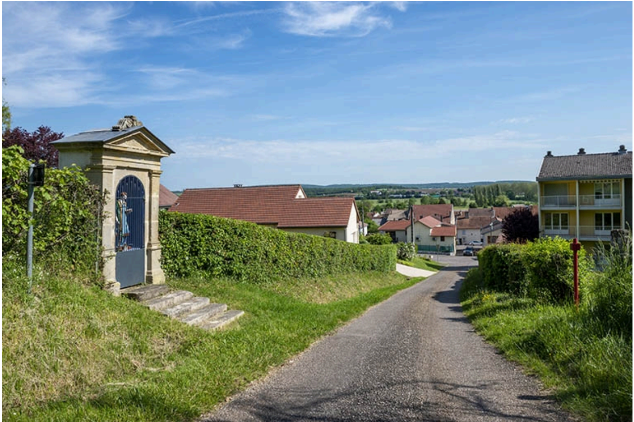
Oratoire saint Vincent.