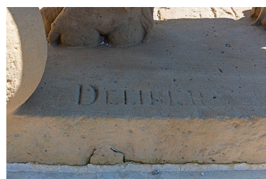
Le lion de la rue de l'Hôtel-de-Ville, détail de la signature. IVR43_20257000035NUC4A