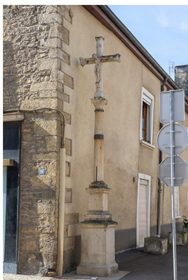
Vue de trois-quart de la croix dressée 19 rue Gambetta. IVR43_20217000610NUC4A