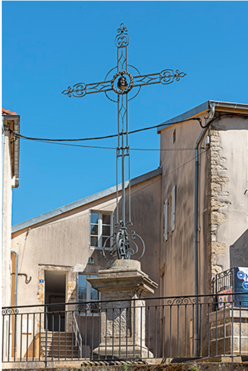
Croix monumentale de la place de la République.