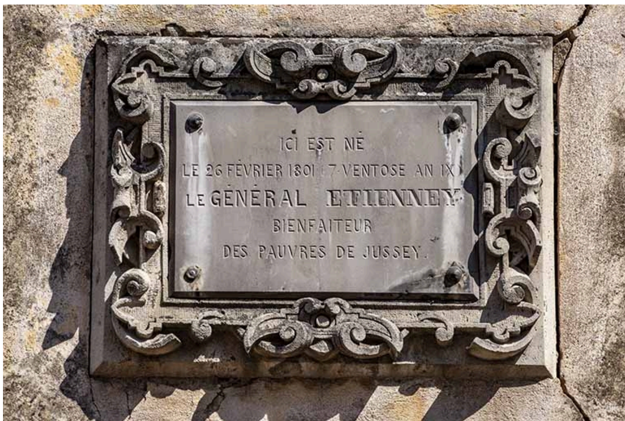
Plaque commémorative du général Etienney, en façade du 1 rue Patet-Tournante.