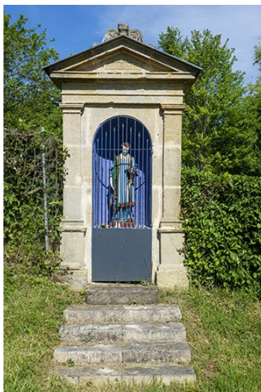
Oratoire saint Vincent.