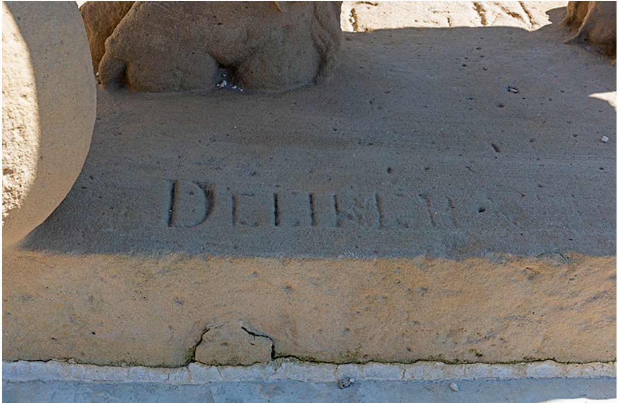
Le lion de la rue de l'Hôtel-de-Ville, détail de la signature.