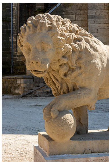
Le lion de la rue de l'Hôtel-de-Ville, détail. IVR43_20257000033NUC4A