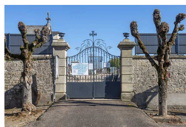
Vue de face de l'entrée du cimetière rue Charles-Bontemps. IVR43_20217000663NUC4A