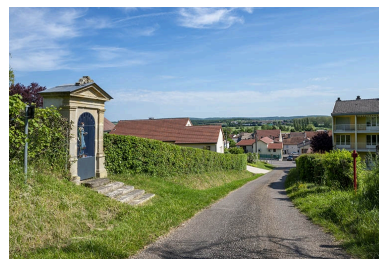
Oratoire saint Vincent. IVR43_20217000316NUC4A