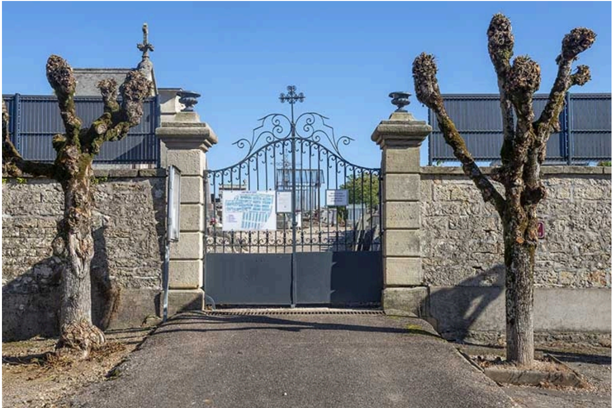
Vue de face de l'entrée du cimetière rue Charles-Bontemps.