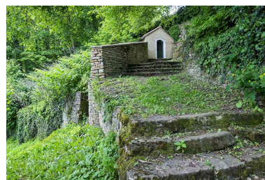
Chapelle de la sainte famille : vue d'ensemble. IVR43_20217000324NUC4A