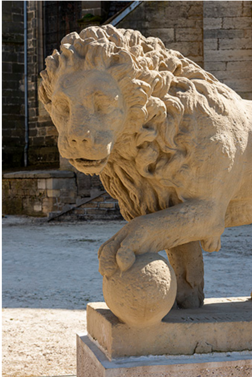
Le lion de la rue de l'Hôtel-de-Ville, détail.