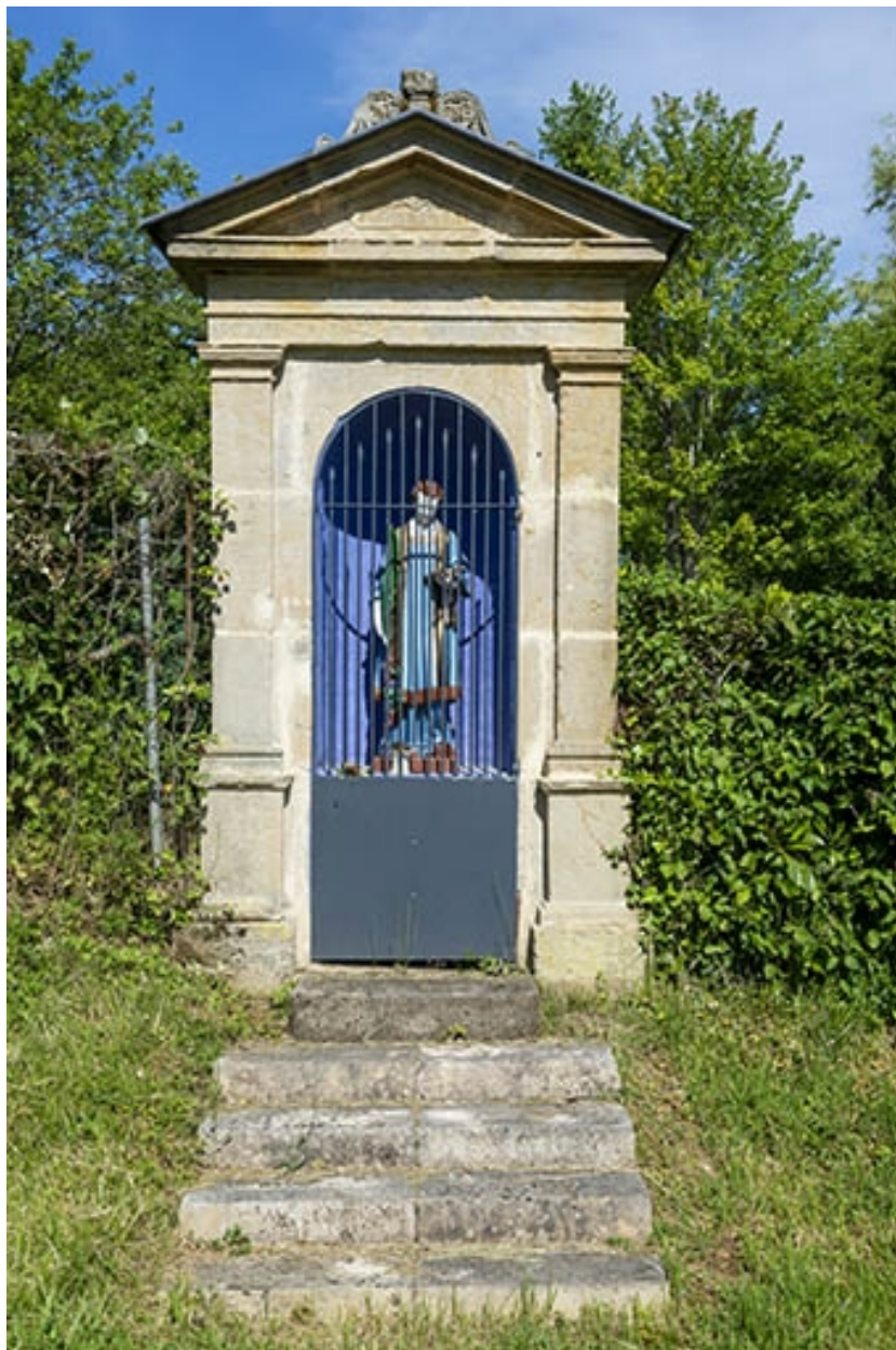
Oratoire saint Vincent.