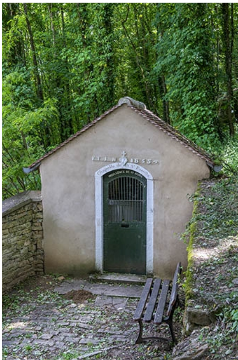
Vue de la façade antérieure de la chapelle de la sainte famille.