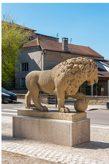
Le lion sculpté dans la rue de l'Hôtel-de-Ville, de l'arrière. IVR43_20257000032NUC4A