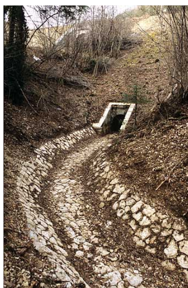
Aqueduc : tête aval (ouest) et rigole.