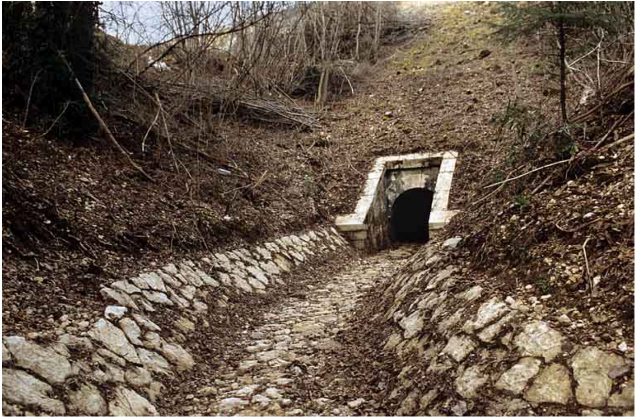
Aqueduc : tête aval et rigole (cadrage horizontal).