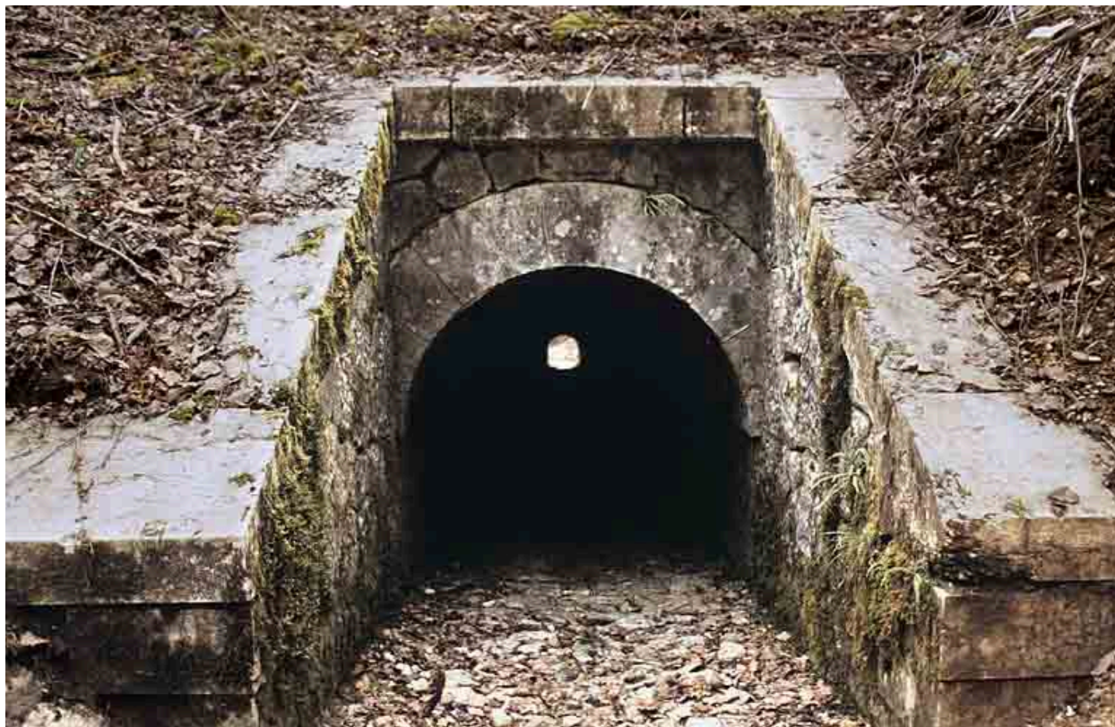
Aqueduc : tête amont (est).