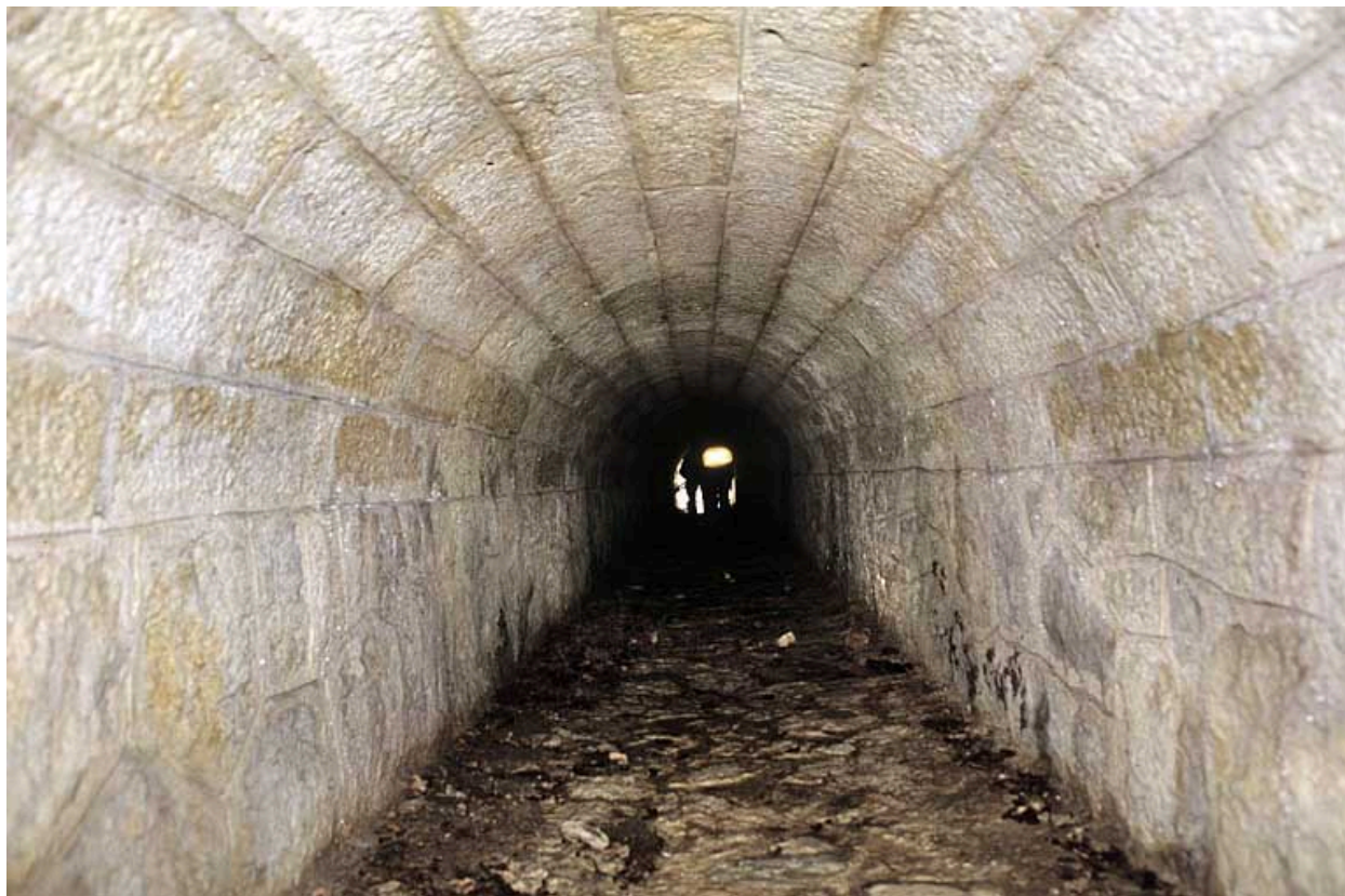
Aqueduc : intérieur.