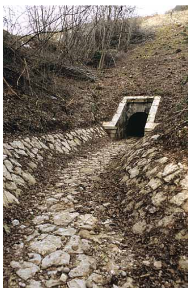
Aqueduc : tête aval (ouest) et rigole (cadrage vertical).