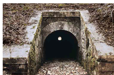
Aqueduc : tête amont (est).