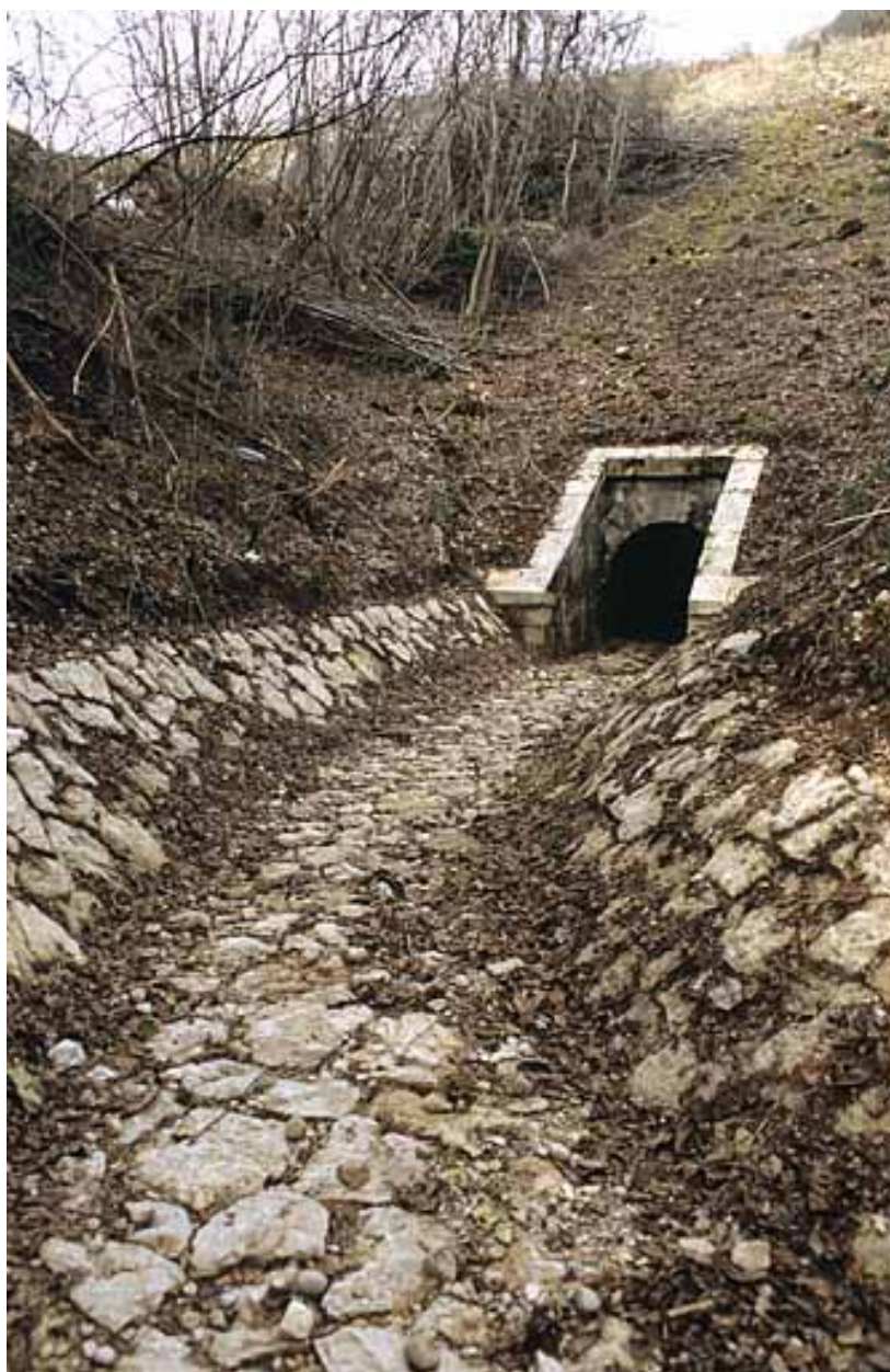
Aqueduc : tête aval (ouest) et rigole (cadrage vertical).