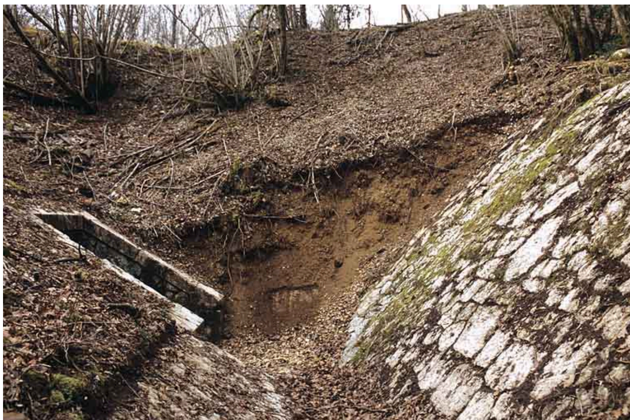
Aqueduc : " canal " et tête amont.