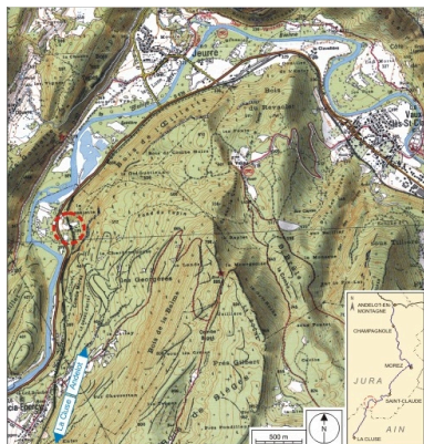
Carte et schéma de localisation. Carte topographique, IGN, 2000, dalles F085_052 et F086_052, échelle 1:25 000. Scan 25, licence n° 2008/CISE/2968. IVR43_20073900505NUDA