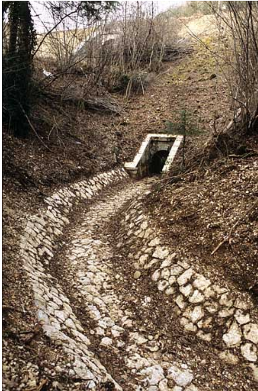
Aqueduc : tête aval (ouest) et rigole.