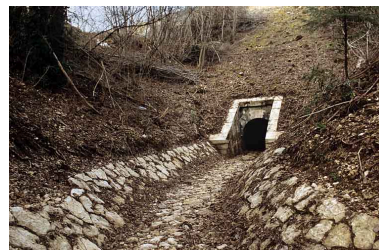
Aqueduc : tête aval et rigole (cadrage horizontal). IVR43_20053900898ZA