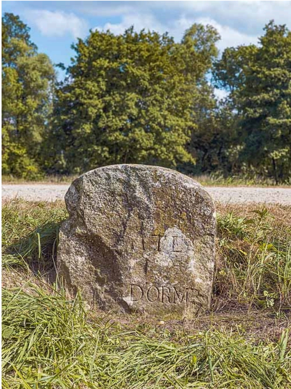
Détail de la borne située au PK 120, rive gauche, en amont du barrage d'Ormes.