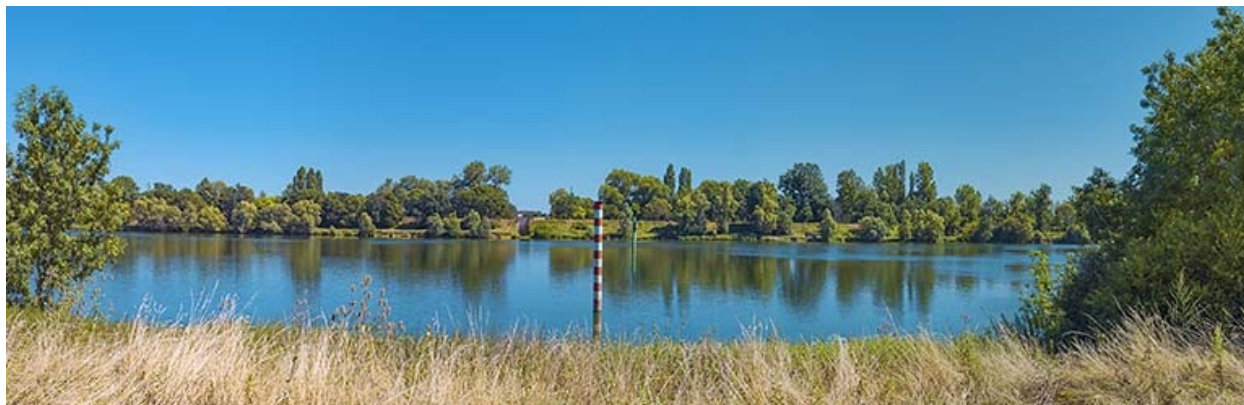
La Saône à hauteur de l'ancienne digue basse de la Motte-Nozillot, entre Gergy et Bey.