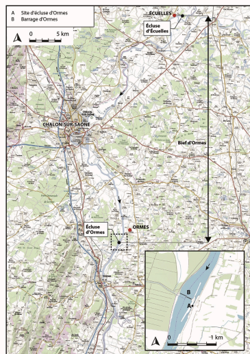
Plan de localisation (1/200 000). Extrait du ScanExpress standard. IVR26_20207100146NUC4A