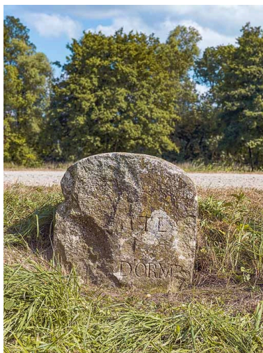
Détail de la borne située au PK 120, rive gauche, en amont du barrage d'Ormes.